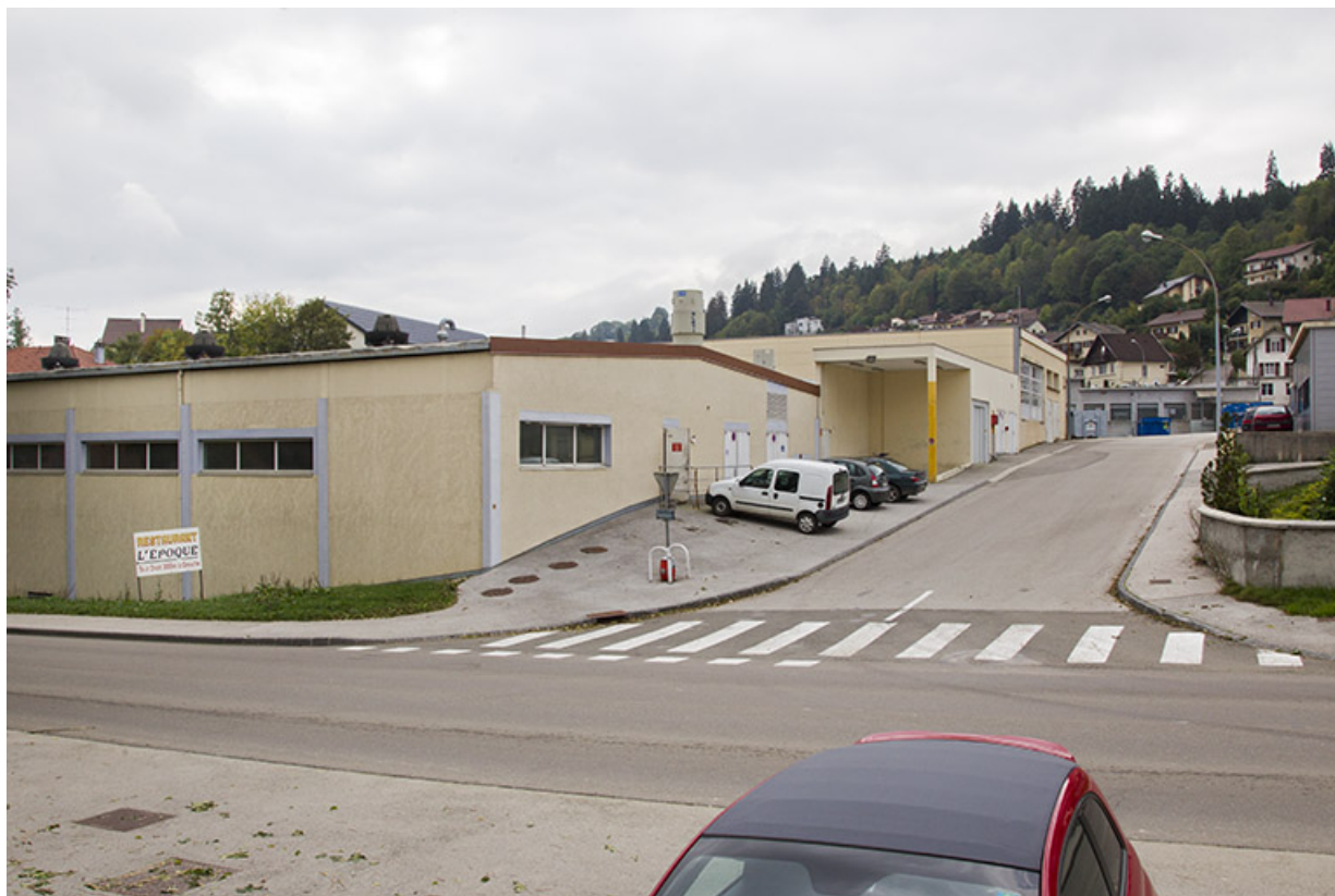
Site ancien : vue d'ensemble depuis le bas de la rue Bois Soleil.