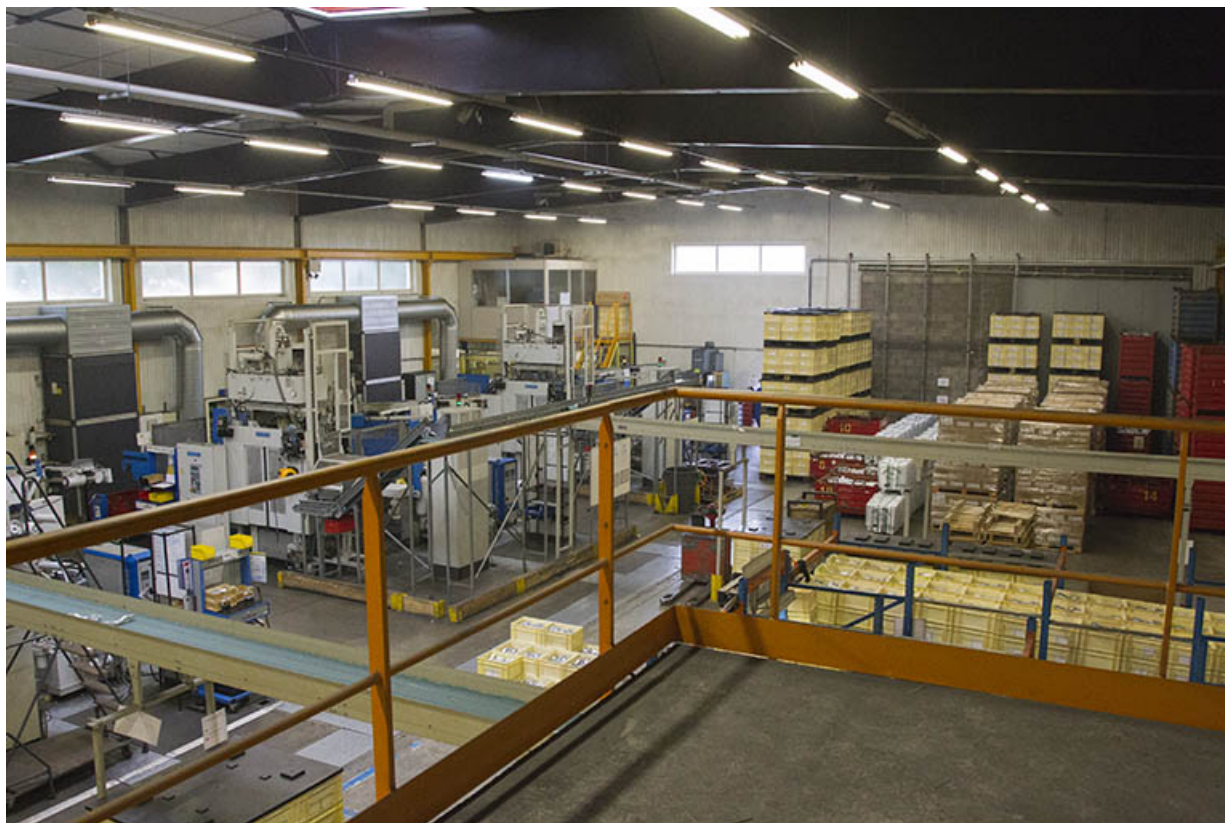
Site ancien : atelier d'injection zamak. 25, Morteau, 13 rue du Maréchal Leclerc