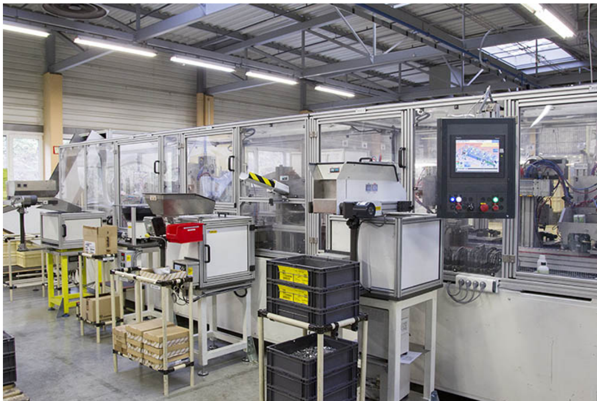
Site récent : atelier d'injection zamak. 25, Morteau, 13 rue du Maréchal Leclerc