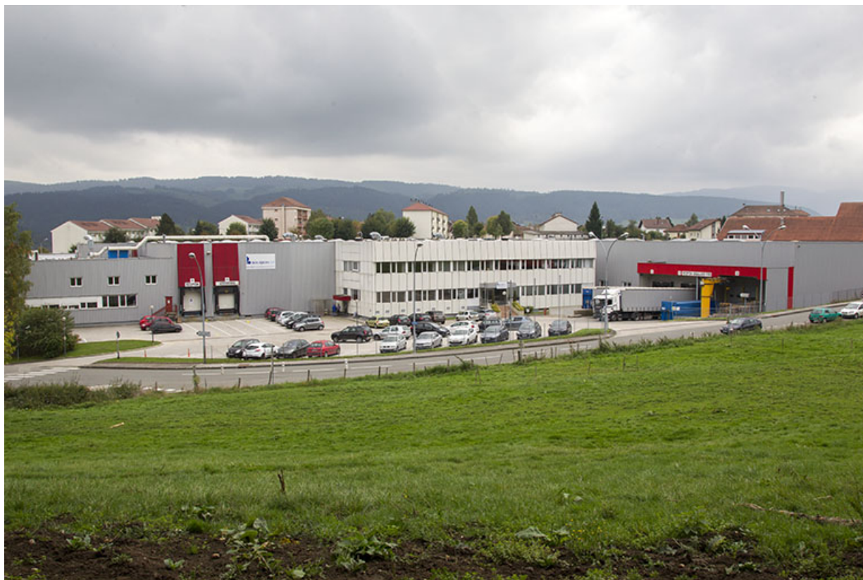
Site récent : façade antérieure, rue du Docteur Sauze. 25, Morteau, 13 rue du Maréchal Leclerc