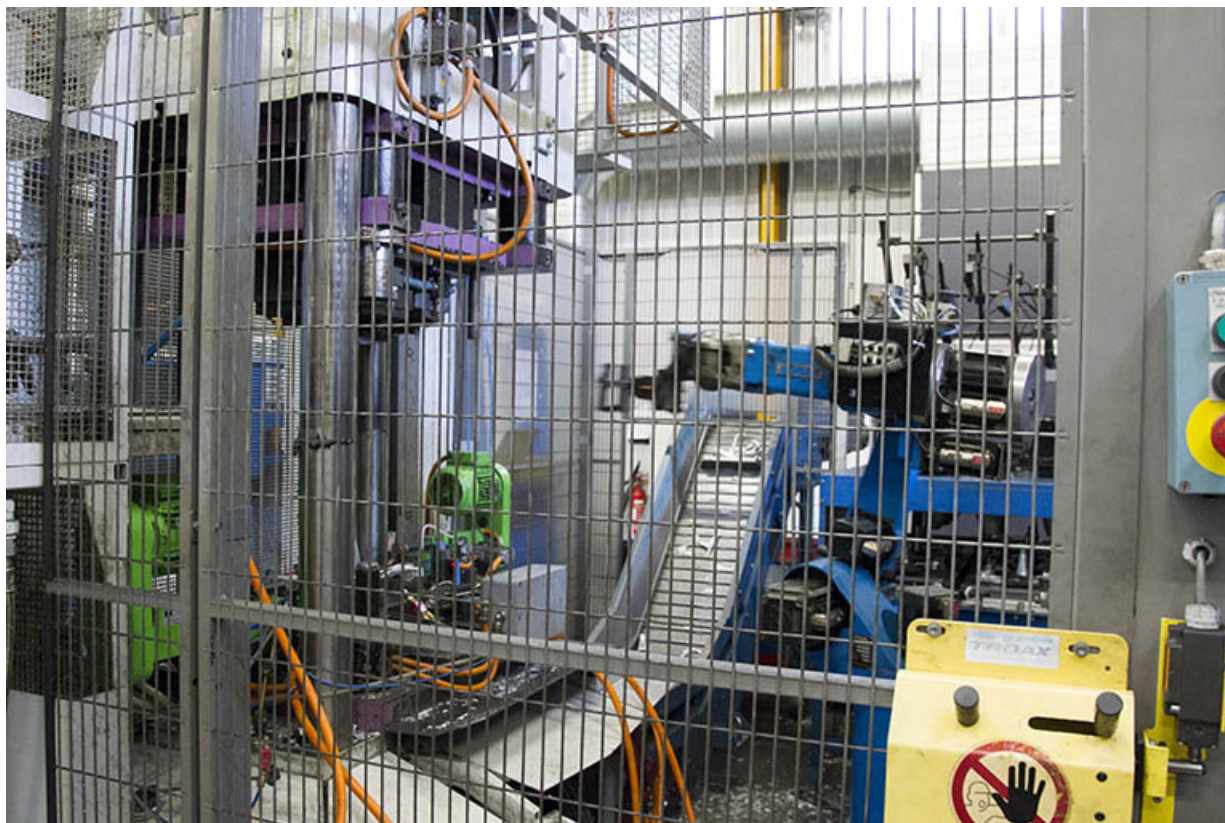
Site ancien : machine de l'atelier d'injection zamak. 25, Morteau, 13 rue du Maréchal Leclerc