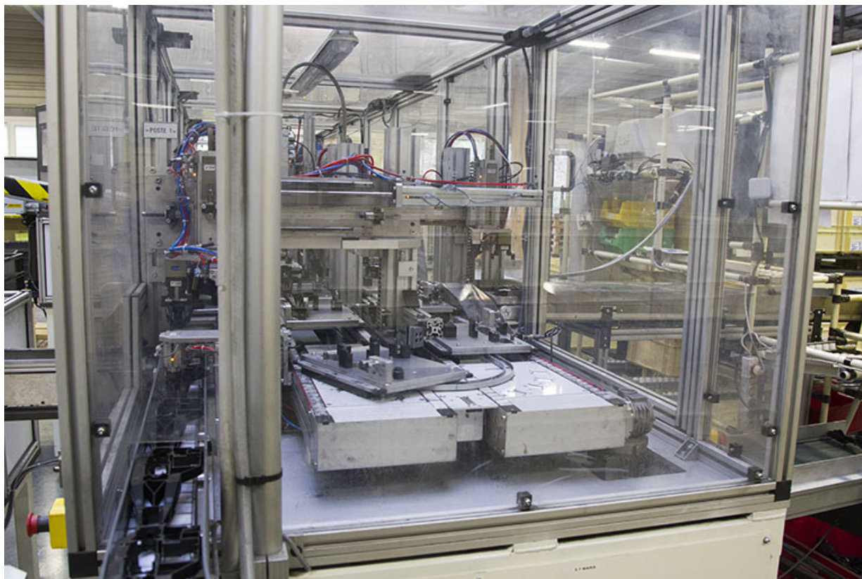
Site récent : machine de l'atelier d'injection zamak. 25, Morteau, 13 rue du Maréchal Leclerc