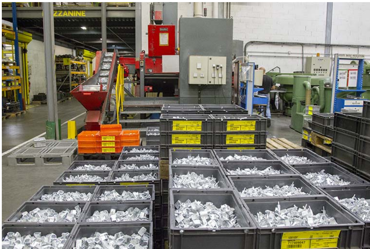
Site récent : stockage de produits finis en zamak.