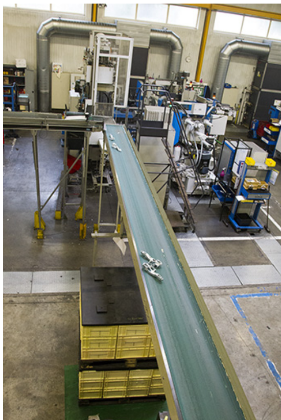
Site ancien : convoyeur à bande de l'atelier d'injection zamak. 25, Morteau, 13 rue du Maréchal Leclerc