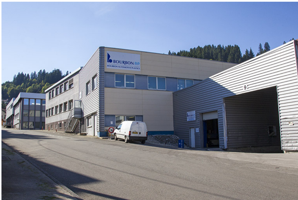
Site ancien : vue d'ensemble, depuis le bas de la rue du Maréchal Leclerc. 25, Morteau, 13 rue du Maréchal Leclerc