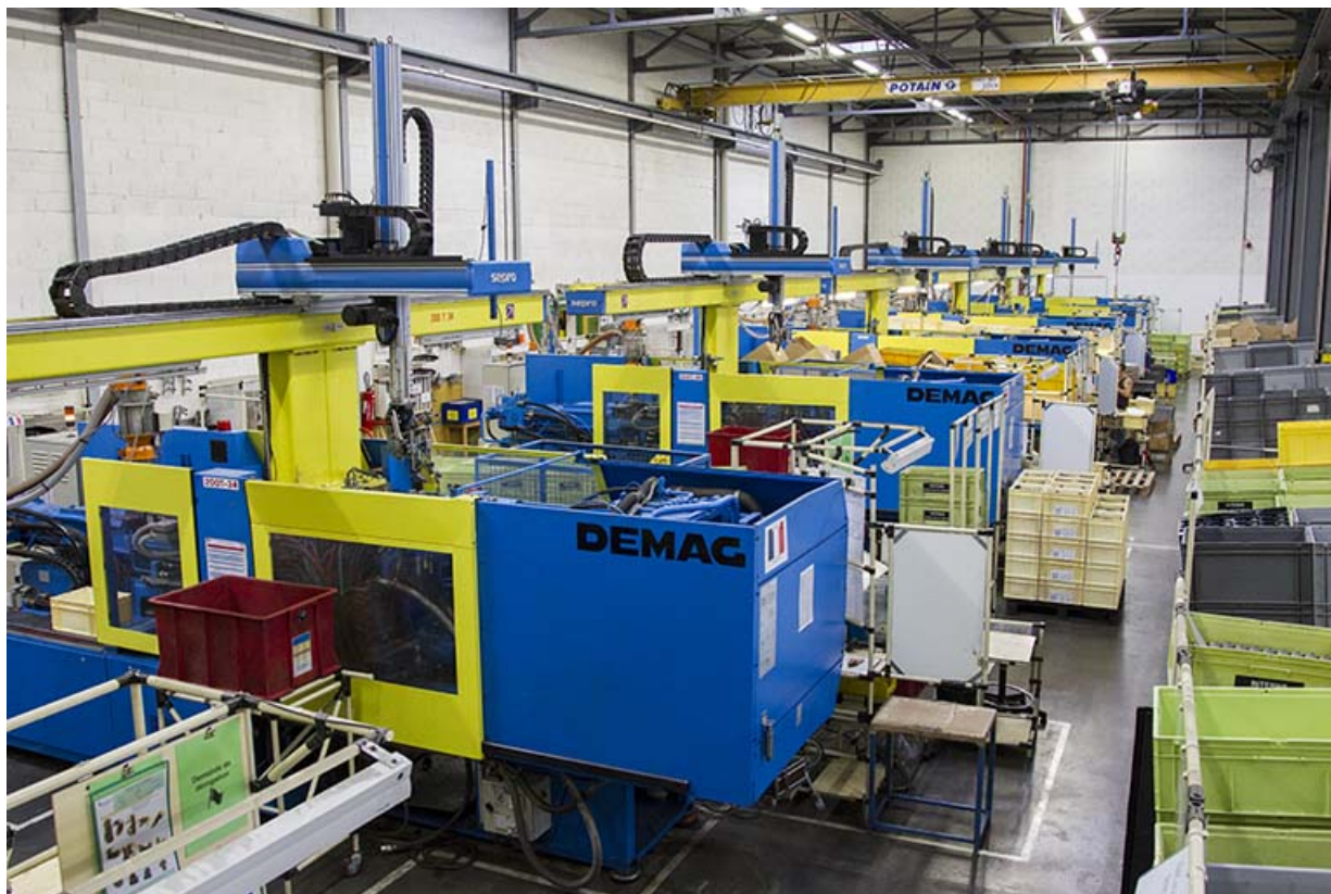
Site récent : presses d'un atelier d'injection plastique. 25, Morteau, 13 rue du Maréchal Leclerc