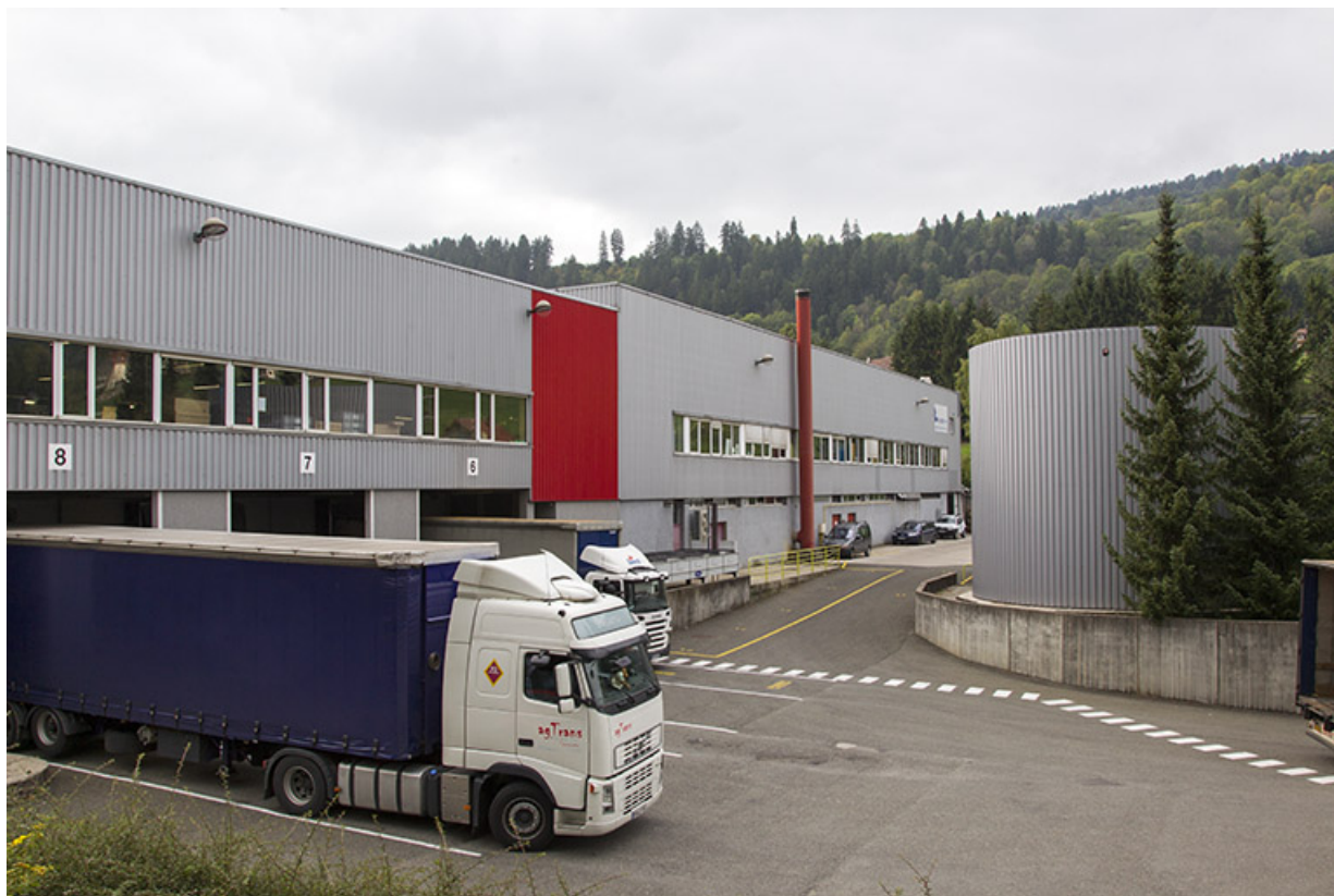
Site récent : atelier et magasin industriel, rue Fontaine l'Epine. 25, Morteau, 13 rue du Maréchal Leclerc