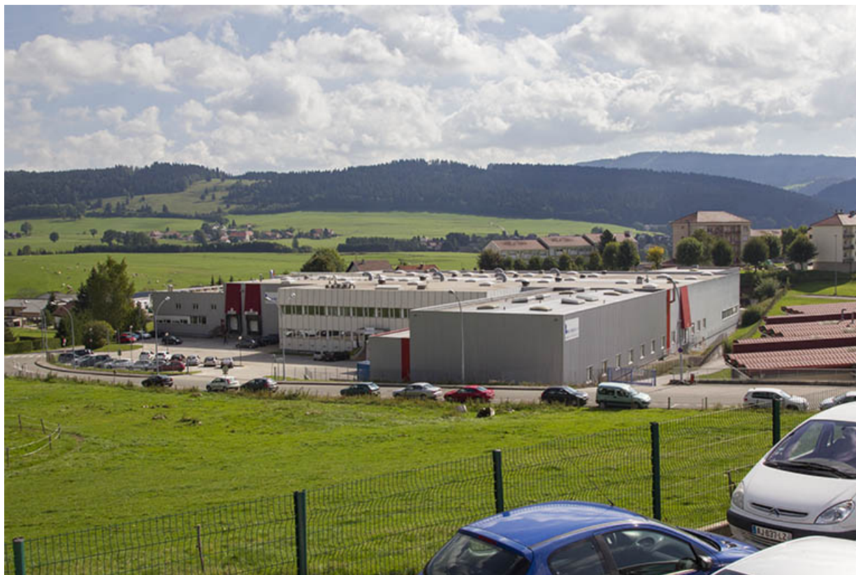
Site récent : vue d'ensemble, depuis le nord-ouest (rue du Docteur Sauze). 25, Morteau, 13 rue du Maréchal Leclerc