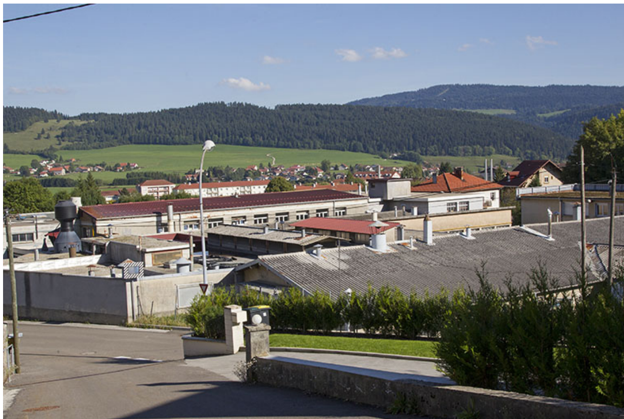
Site ancien : partie occidentale côté rue Bois Soleil. 25, Morteau, 13 rue du Maréchal Leclerc