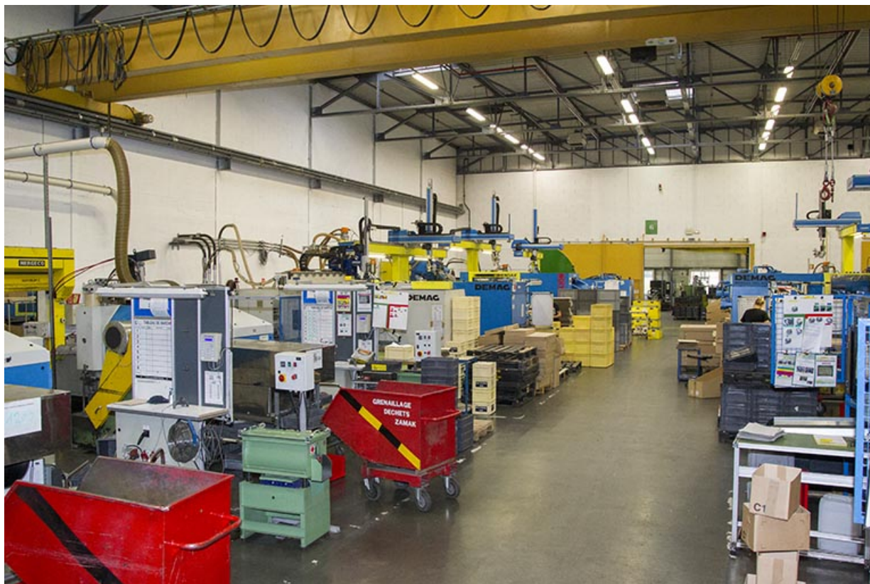
Site récent : un atelier d'injection plastique. 25, Morteau, 13 rue du Maréchal Leclerc