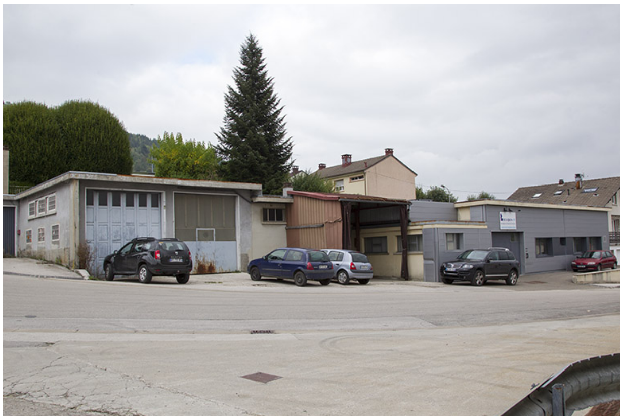
Site ancien : laboratoire de métrologie, rue Bois Soleil. 25, Morteau, 13 rue du Maréchal Leclerc