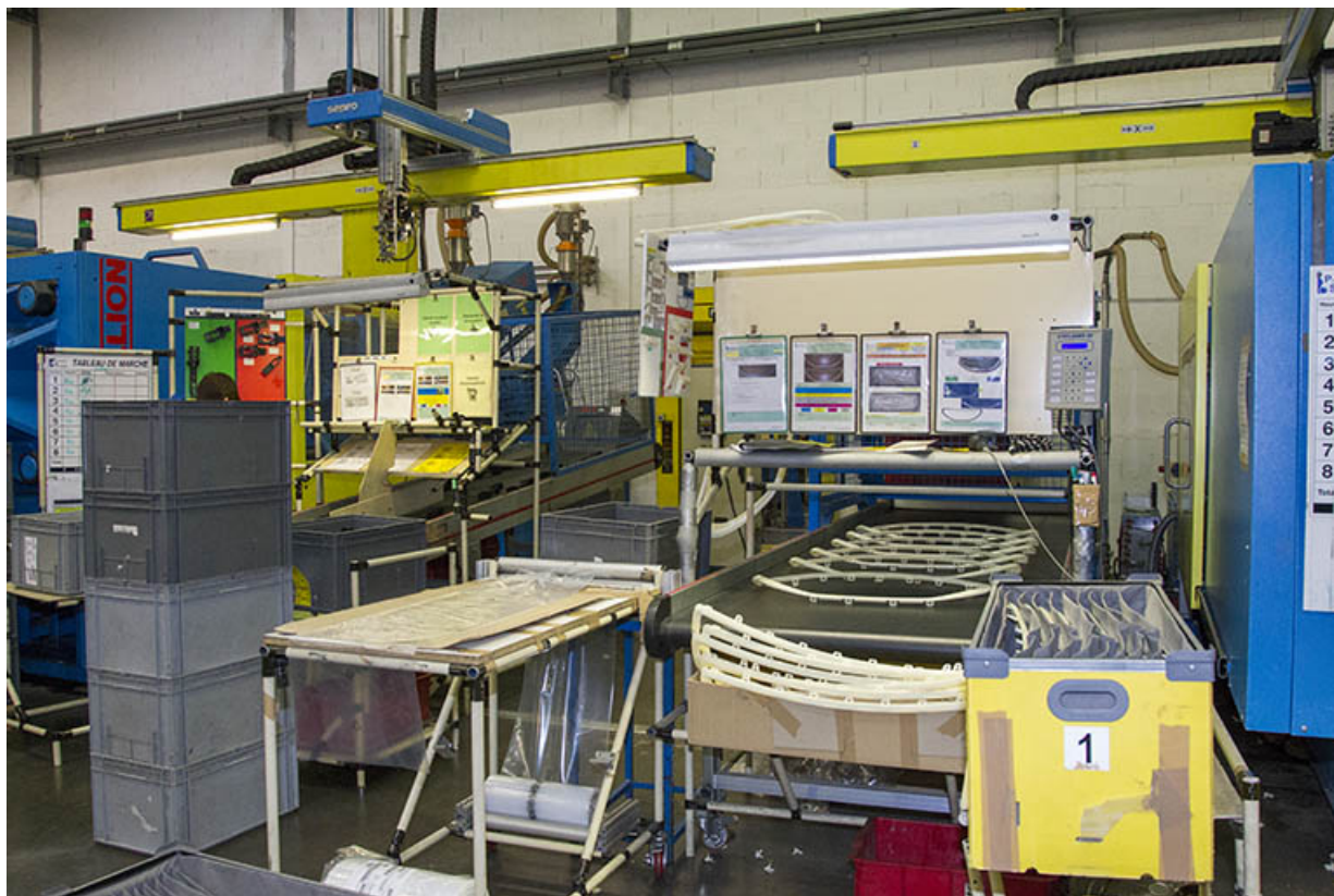
Site récent : poste de travail dans un atelier d'injection plastique.