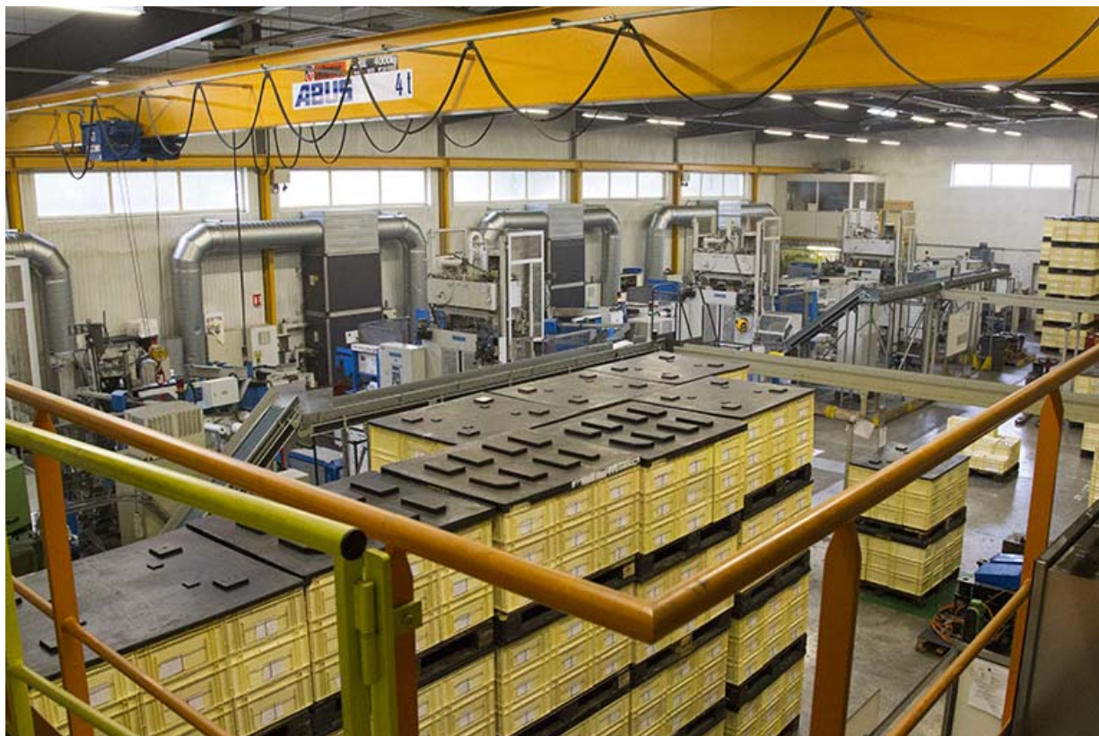
Site ancien : atelier d'injection zamak. 25, Morteau, 13 rue du Maréchal Leclerc