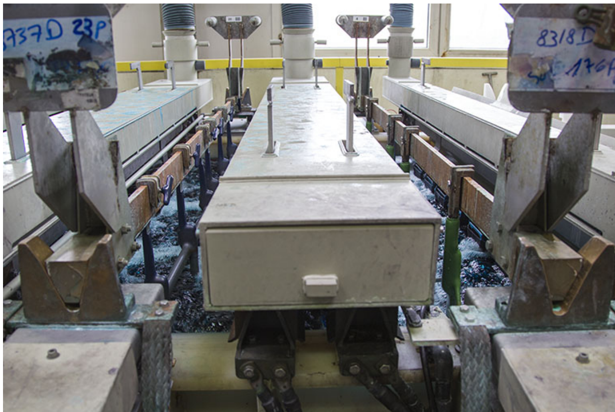
Site ancien : détail de la chaîne de chromage.