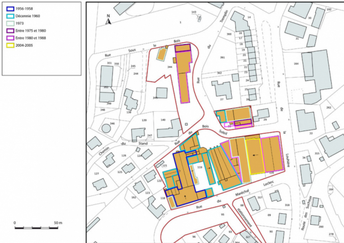
Site ancien (rue du Maréchal Leclerc) : plan de datation. Extrait du plan cadastral, 2013, section AD. 25, Morteau, 13 rue du Maréchal Leclerc