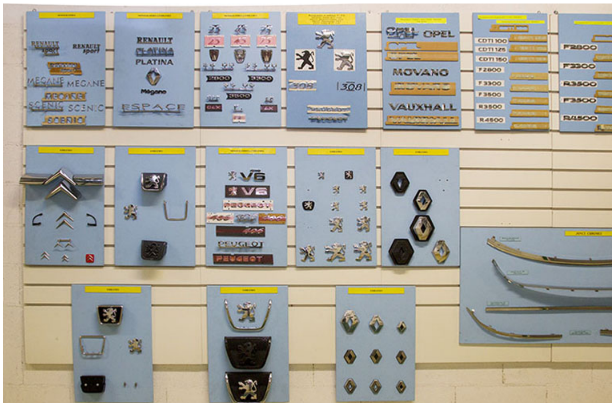
Site récent : panneaux de présentation des produits fabriqués.