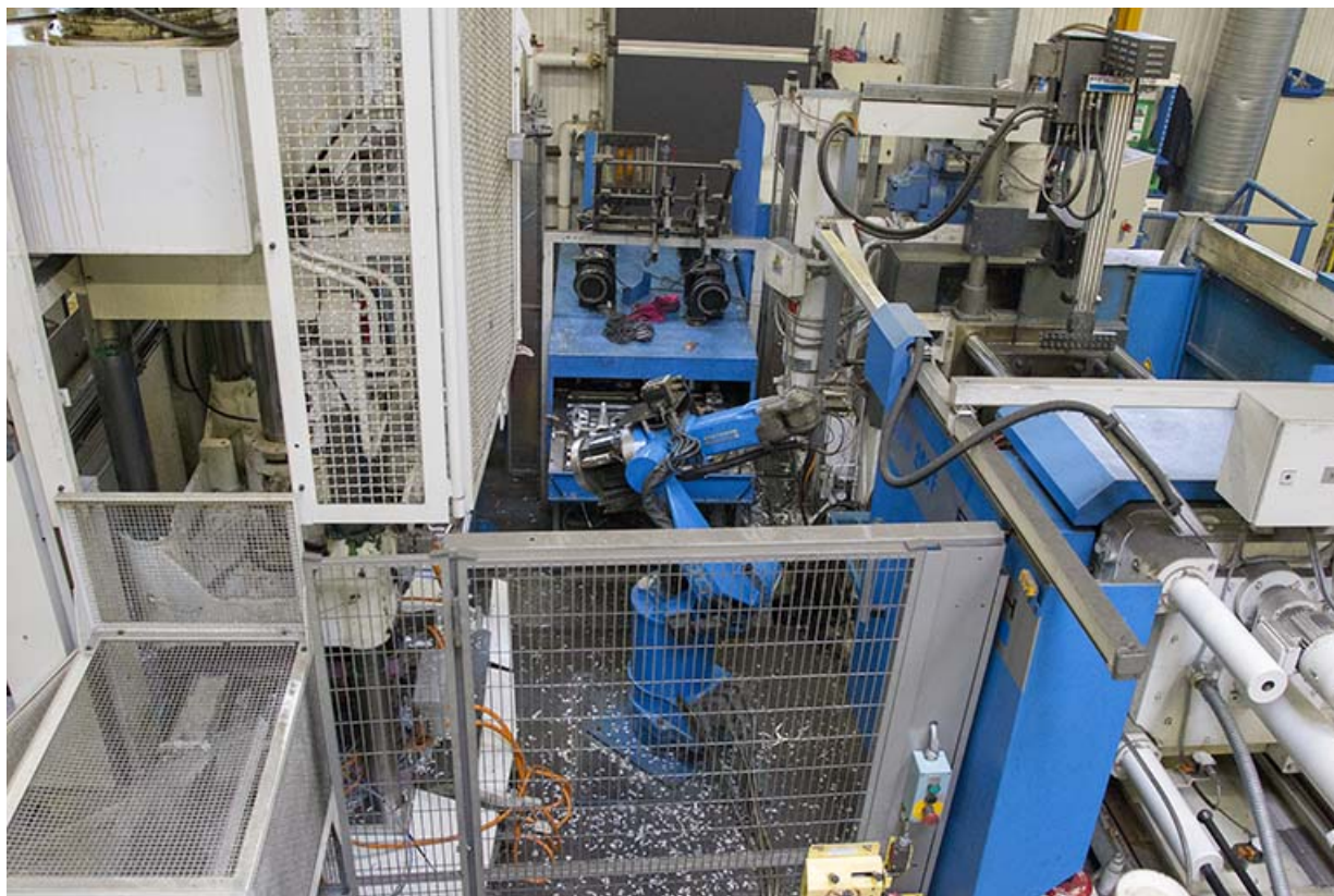
Site ancien : machine de l'atelier d'injection zamak. 25, Morteau, 13 rue du Maréchal Leclerc