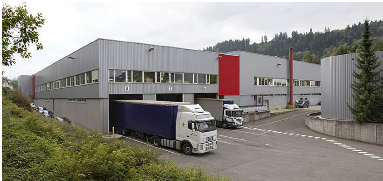
Site récent : atelier et magasin industriel, rue Fontaine l'Epine. 25, Morteau, 13 rue du Maréchal Leclerc