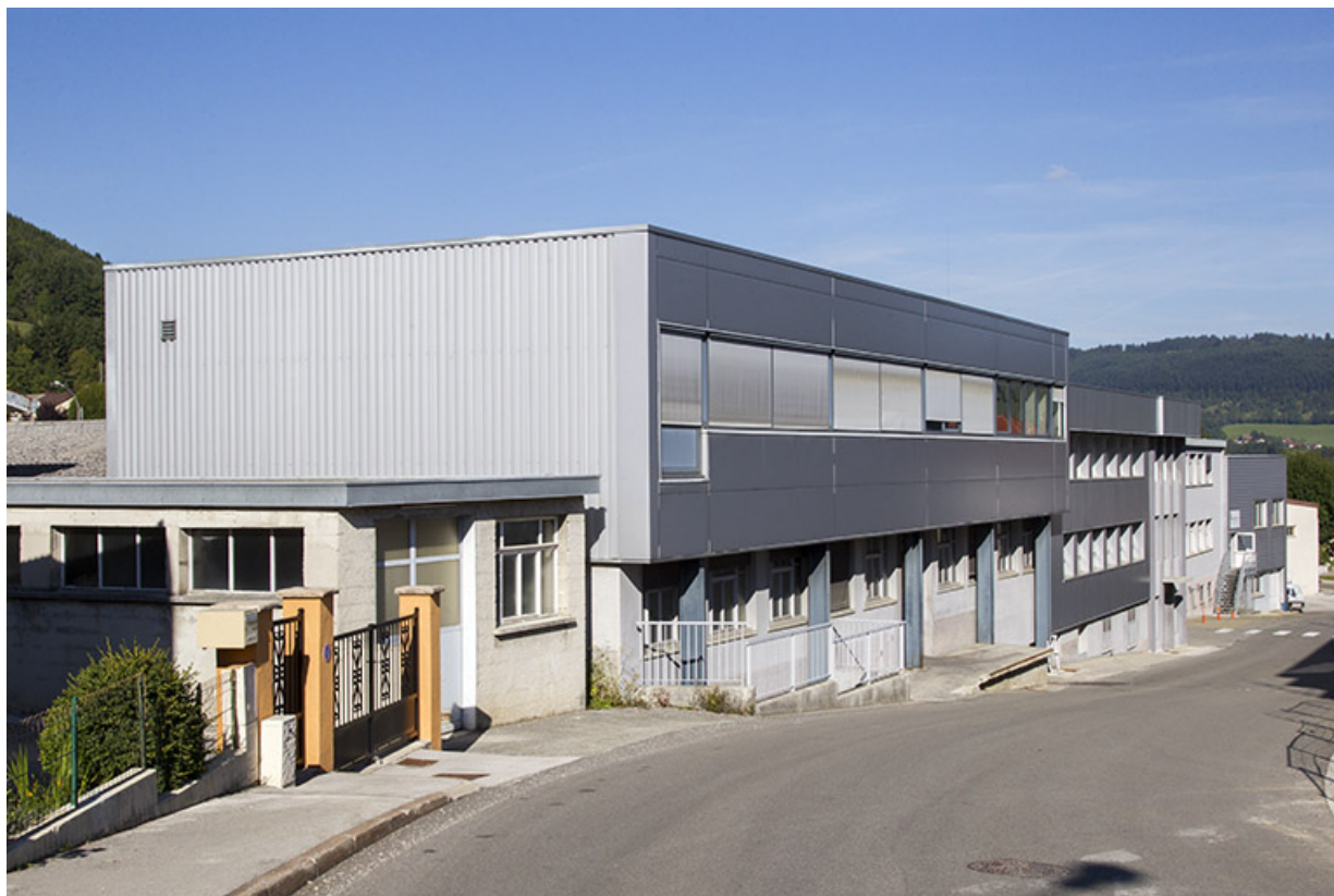
Site ancien : bureaux désaffectés, rue du Maréchal Leclerc. 25, Morteau, 13 rue du Maréchal Leclerc