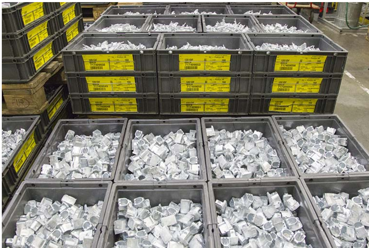
Site récent : stockage de produits finis en zamak.