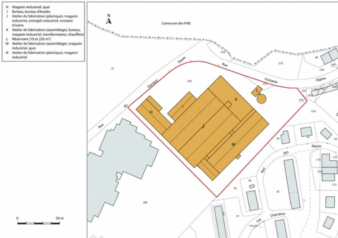
Site récent (rue du Docteur Sauze) : plan-masse et de situation. Extrait du plan cadastral, 2013, section AD. 25, Morteau, 13 rue du Maréchal Leclerc