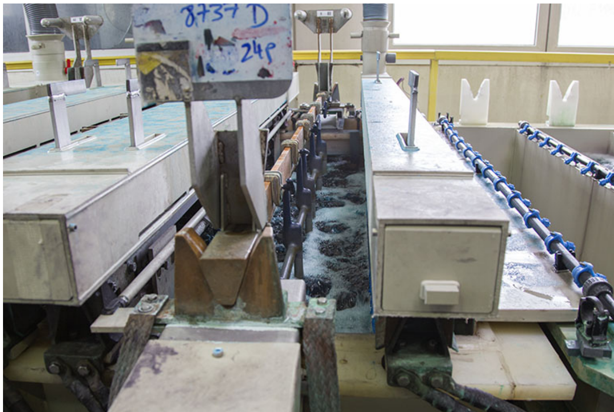
Site ancien : détail de la chaîne de chromage.