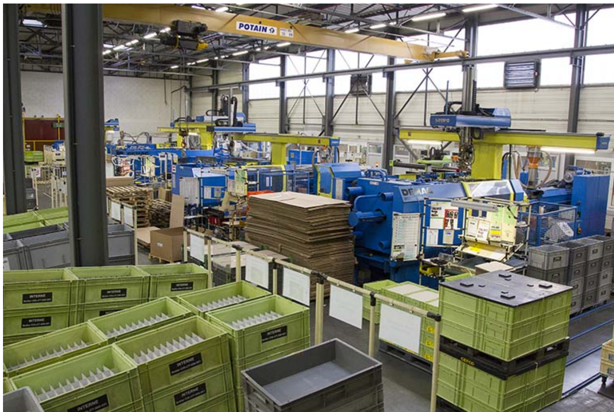
Site récent : un atelier d'injection plastique. 25, Morteau, 13 rue du Maréchal Leclerc