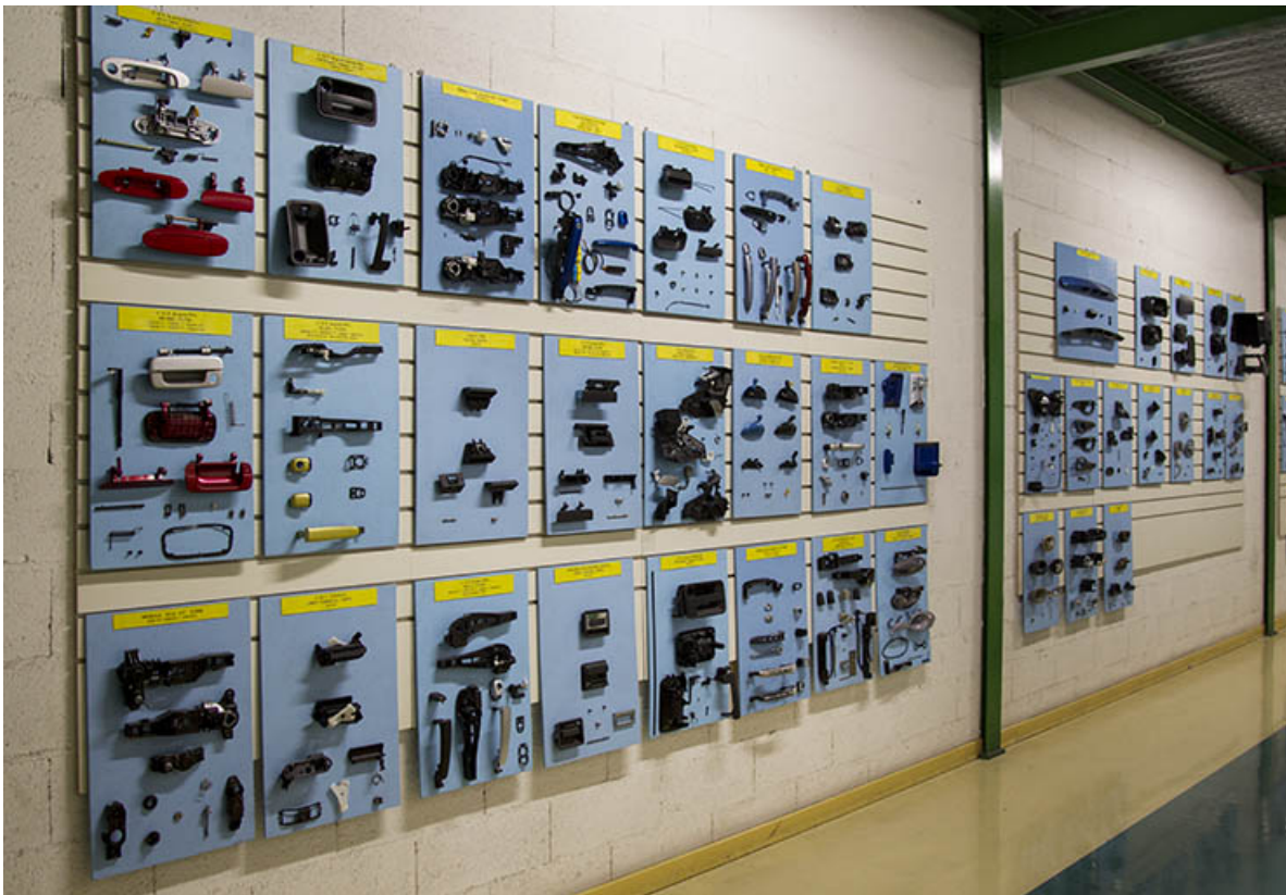
Site récent : panneaux de présentation des produits fabriqués. 25, Morteau, 13 rue du Maréchal Leclerc