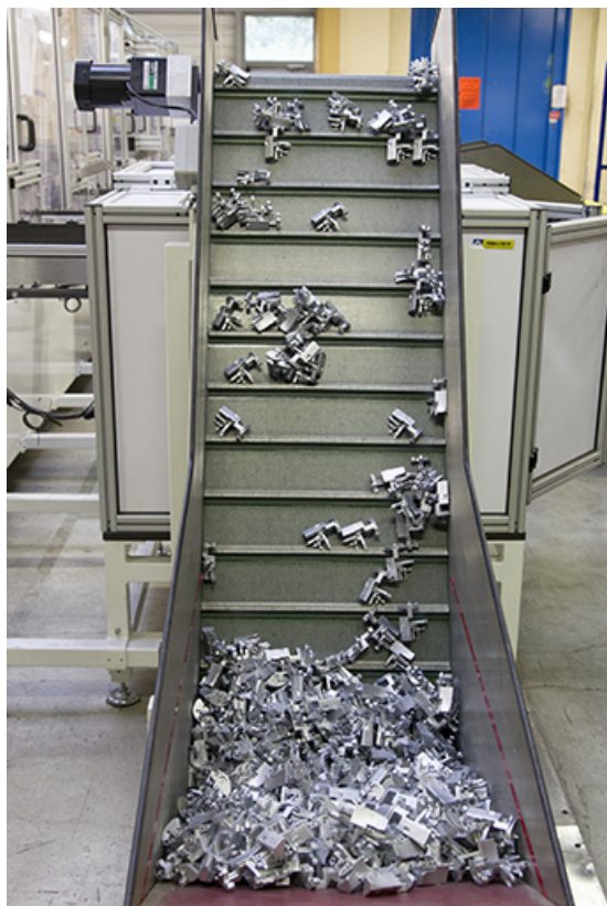
Site récent : convoyeur de l'atelier d'injection zamak. 25, Morteau, 13 rue du Maréchal Leclerc