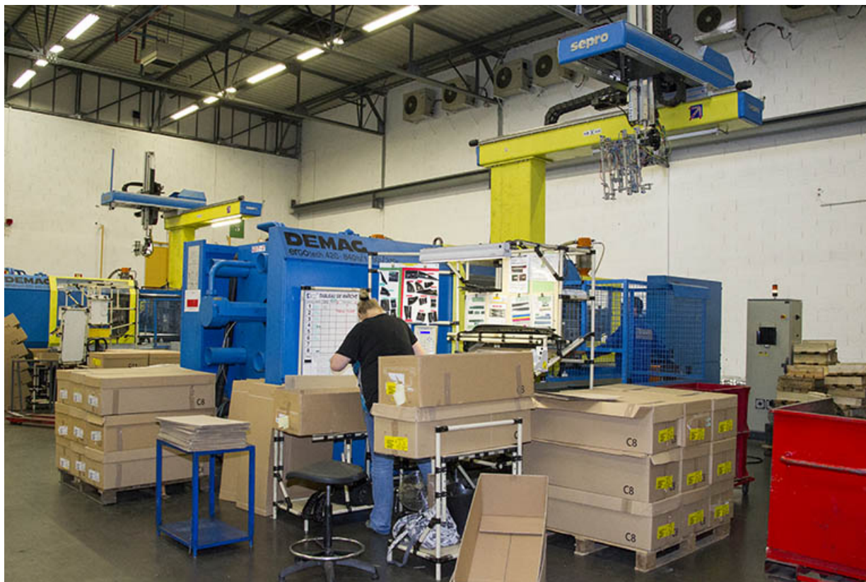
Site récent : presse dans un atelier d'injection plastique. 25, Morteau, 13 rue du Maréchal Leclerc