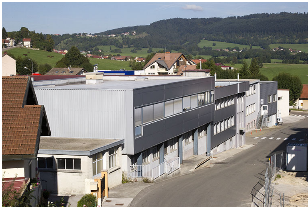
Site ancien : vue d'ensemble, depuis le haut de la rue du Maréchal Leclerc. 25, Morteau, 13 rue du Maréchal Leclerc