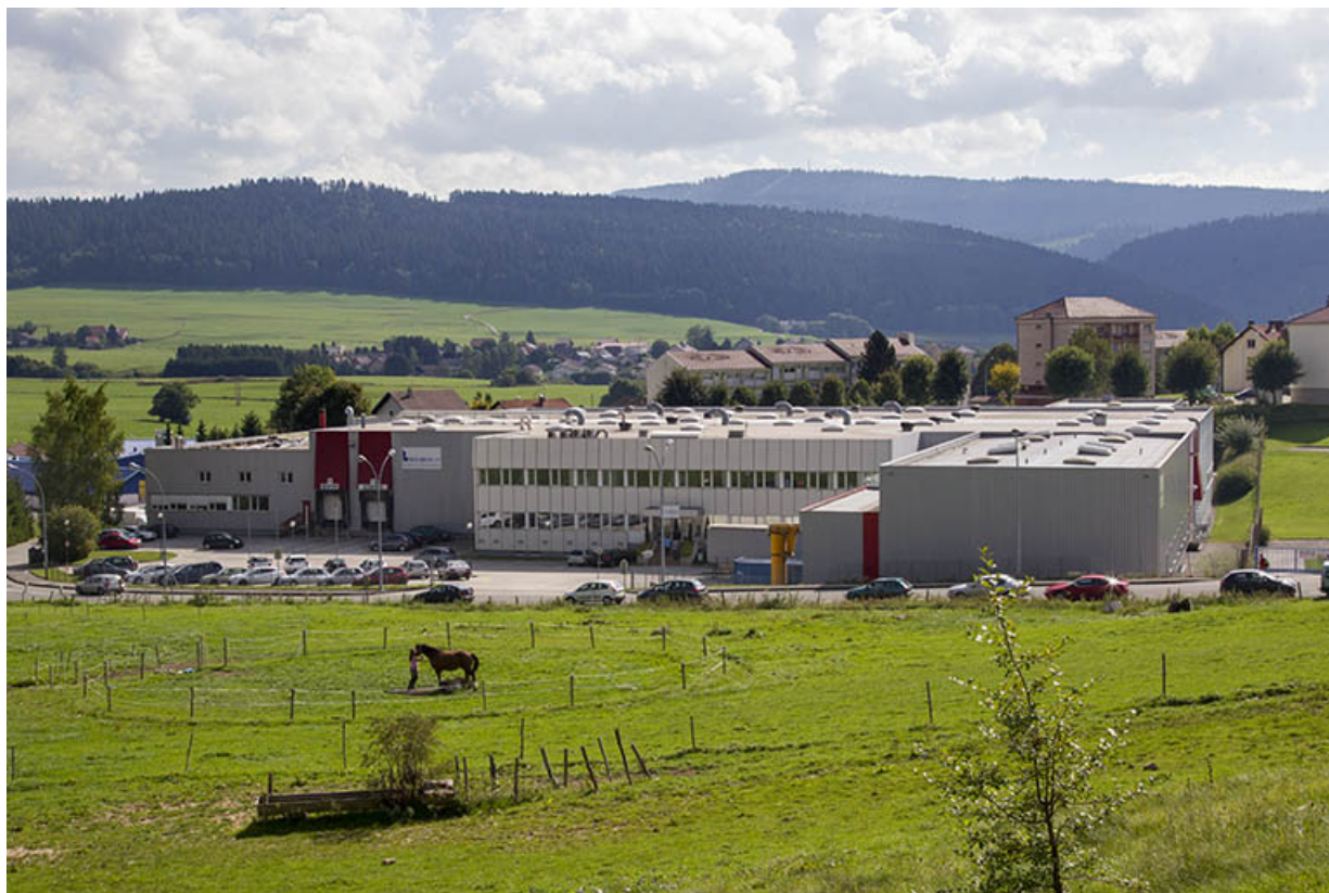
Fonderie et usine de pièces détachées en matière plastique Bourbon, à Morteau.