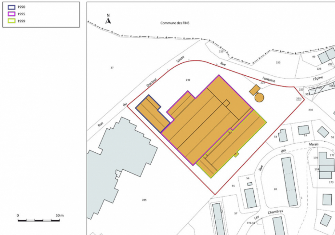
Site récent (rue du Docteur Sauze) : plan de datation. Extrait du plan cadastral, 2013, section AD. 25, Morteau, 13 rue du Maréchal Leclerc