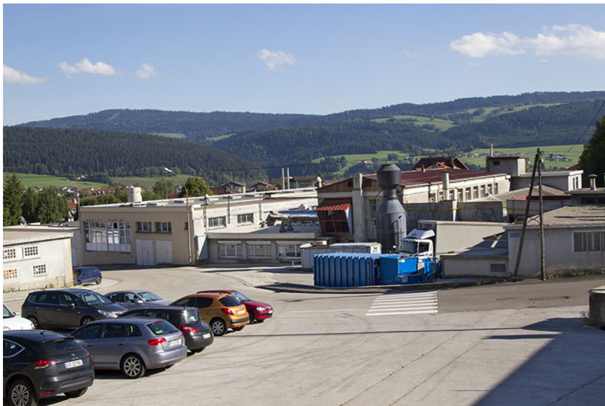
Site ancien : partie orientale côté rue Bois Soleil. 25, Morteau, 13 rue du Maréchal Leclerc