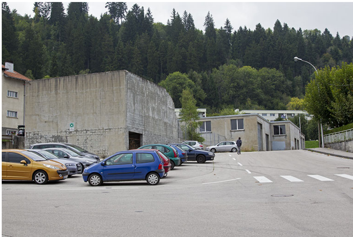
Site ancien : atelier de fabrication plastique désaffecté, rue du Tremplin. 25, Morteau, 13 rue du Maréchal Leclerc