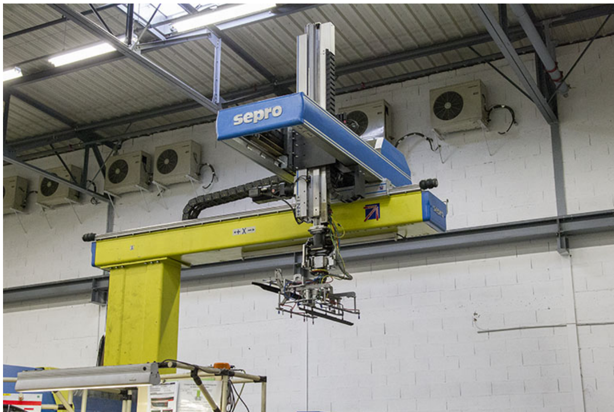
Site récent : robot de déchargement d'une presse à injecter. 25, Morteau, 13 rue du Maréchal Leclerc