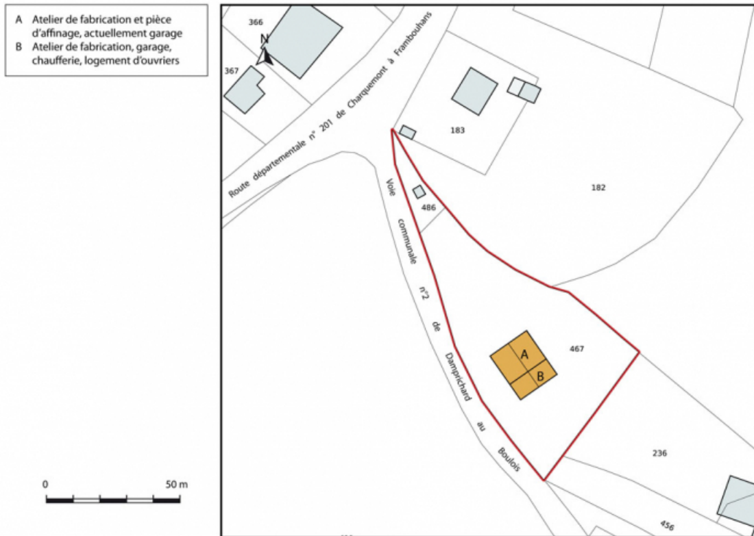
Plan-masse et de situation. Extrait du plan cadastral, 2013, section D. 25, Damprichard, lieudit : le Bois en Barre