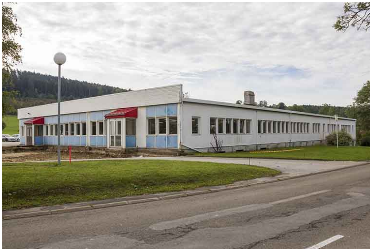
Vue d'ensemble depuis le nord, avant l'extension de 2013.