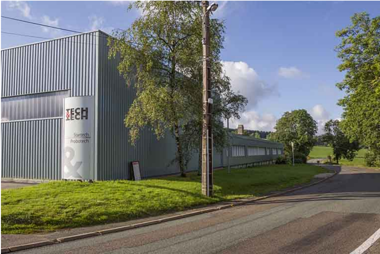
Façade latérale droite (atelier de 2013 au premier plan).