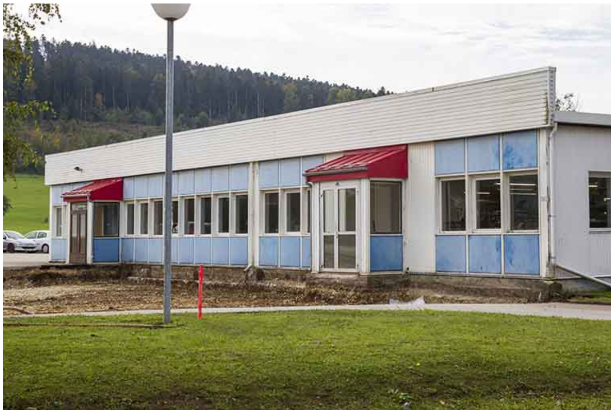
L'entrée, avant l'extension de 2013.