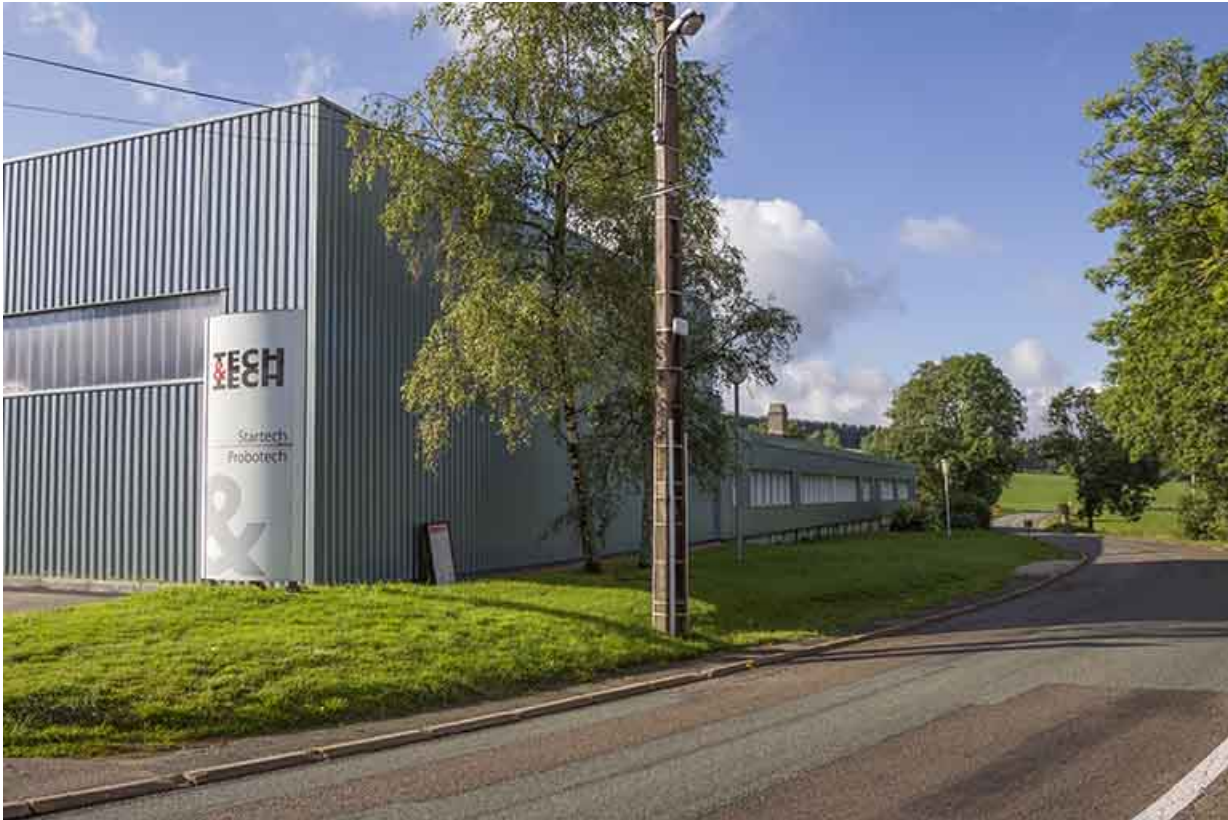
Façade latérale droite (atelier de 2013 au premier plan).