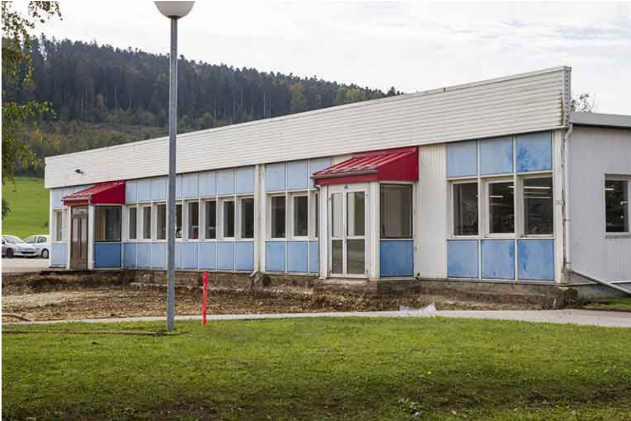
L'entrée, avant l'extension de 2013.