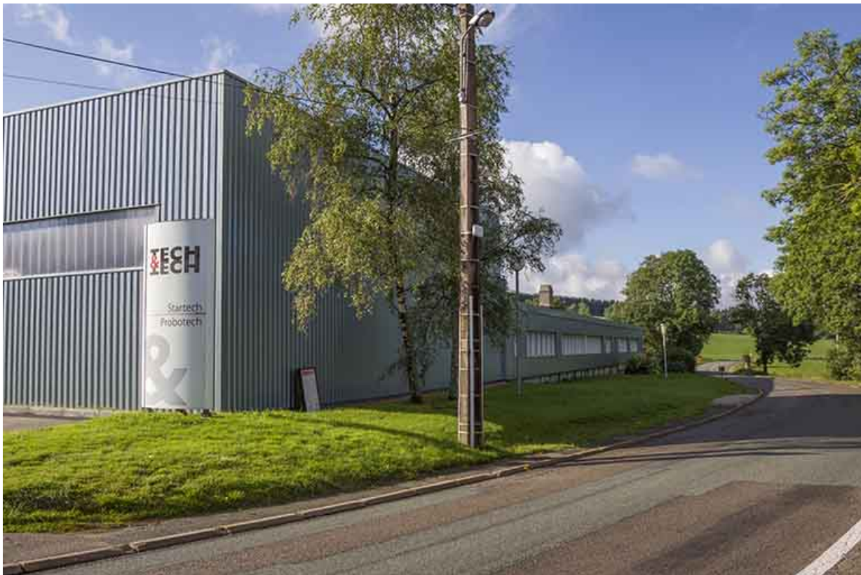
Façade latérale droite (atelier de 2013 au premier plan).