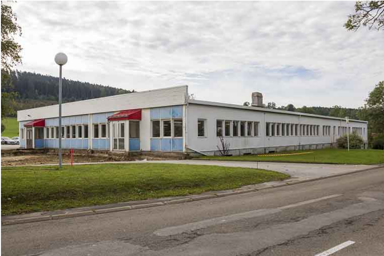
Vue d'ensemble depuis le nord, avant l'extension de 2013.