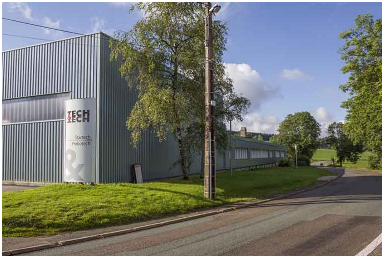
Façade latérale droite (atelier de 2013 au premier plan).