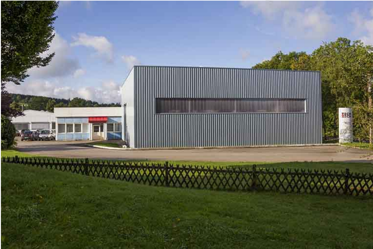
Façade antérieure (atelier de 2013 au premier plan).