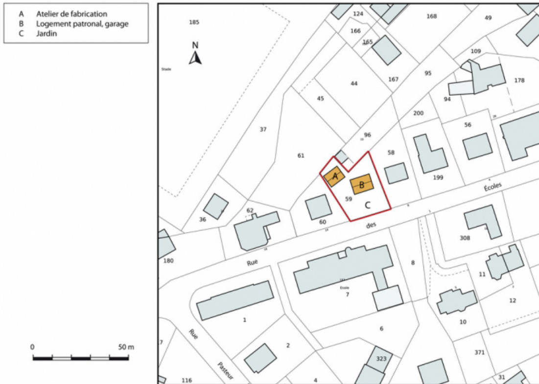
Plan-masse et de situation. Extrait du plan cadastral, 2013, section AB. 25, Damprichard, 10-12 rue des Écoles