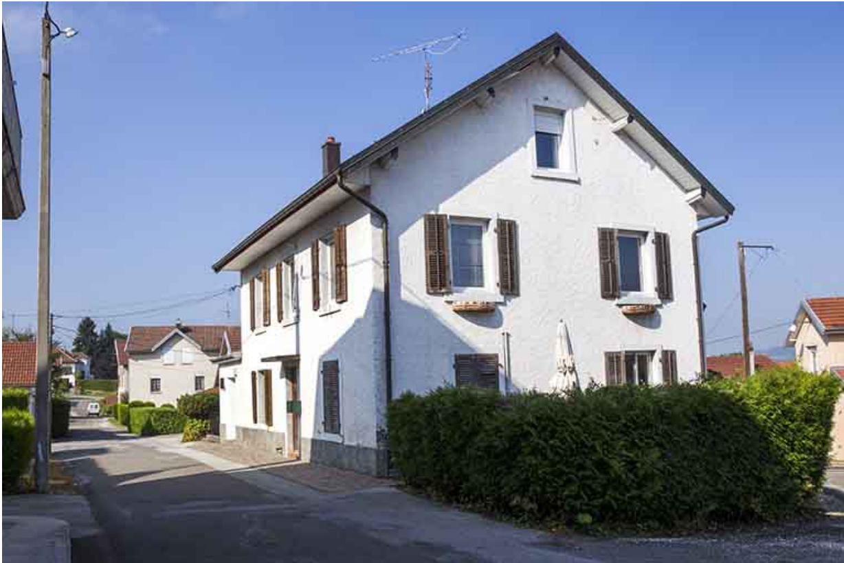
Logement patronal : façades antérieure et latérale droite.