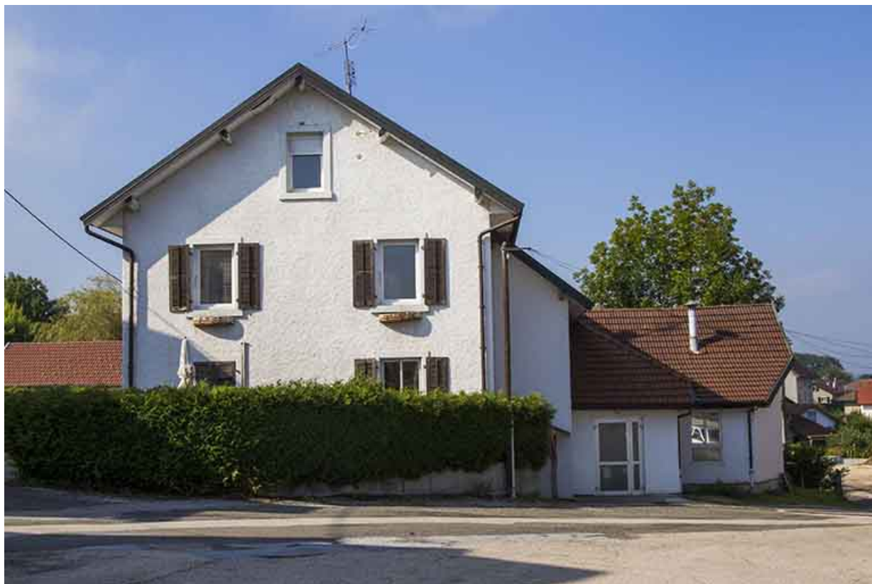
Logement patronal : façade latérale droite.