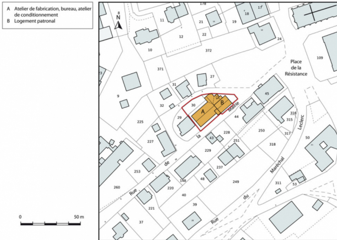
Plan-masse et de situation. Extrait du plan cadastral, 2012, section AE. 25, Damprichard, 4 rue de la Mairie