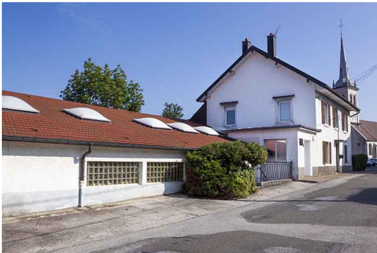
Atelier de fabrication et logement patronal : façade antérieure, de trois quarts gauche. 25, Damprichard, 4 rue de la Mairie