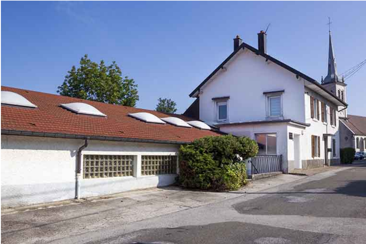
Atelier de fabrication et logement patronal : façade antérieure, de trois quarts gauche.