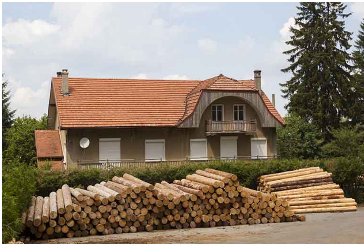
Façade antérieure, depuis la scierie Buliard au sud-est.