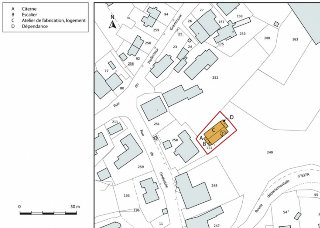
Plan-masse et de situation. Extrait du plan cadastral, 2012, section AD. 25, Damprichard, 5 rue de l' Industrie