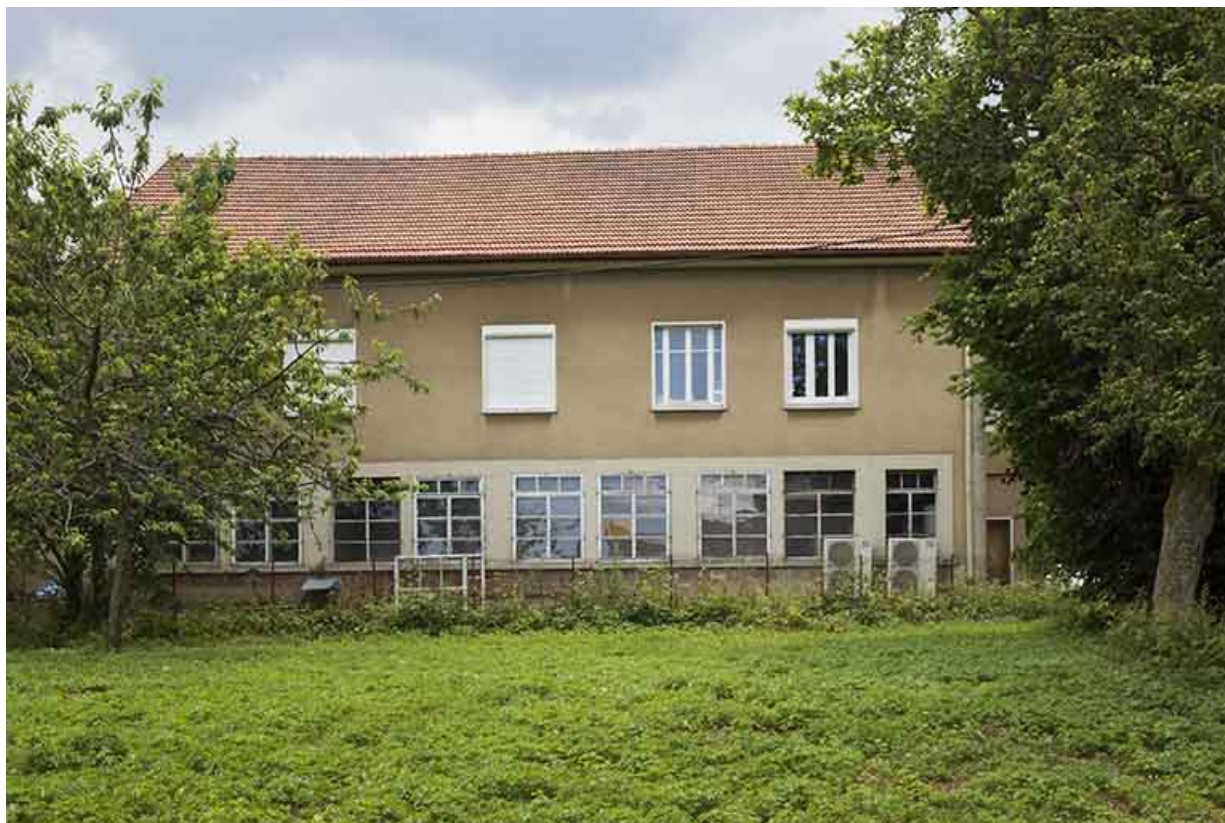
Façade postérieure, depuis l'usine Henri Bourgeois au nord-ouest. 25, Damprichard, 5 rue de l' Industrie