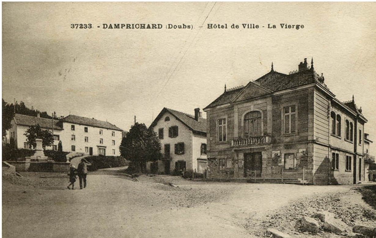
37233 - Damprichard (Doubs) - Hôtel de Ville - La Vierge [et l'usine Burdet], 1ère moitié 20e siècle (entre 1912 et 1935). 25, Damprichard, 1 rue du Maréchal Leclerc