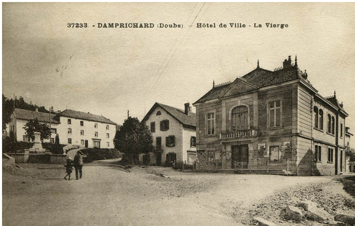
37233 - Damprichard (Doubs) - Hôtel de Ville - La Vierge [et l'usine Burdet], 1ère moitié 20e siècle (entre 1912 et 1935). 25, Damprichard, 1 rue du Maréchal Leclerc