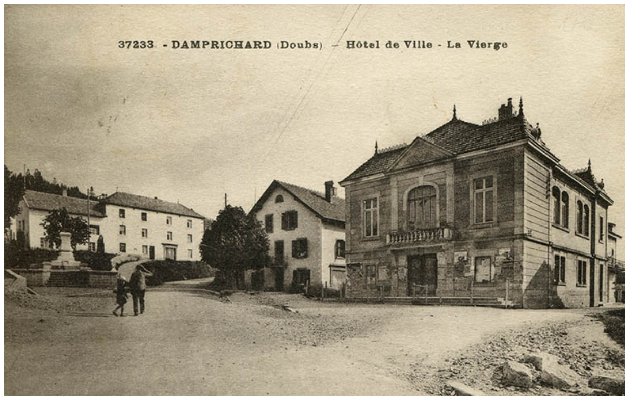
37233 - Damprichard (Doubs) - Hôtel de Ville - La Vierge [et l'usine Burdet], 1ère moitié 20e siècle (entre 1912 et 1935). 25, Damprichard, 1 rue du Maréchal Leclerc