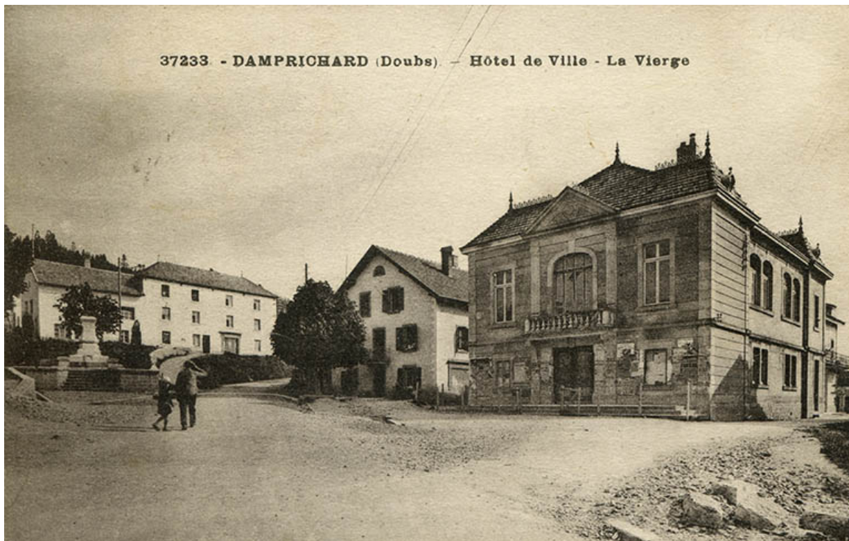
37233 - Damprichard (Doubs) - Hôtel de Ville - La Vierge [et l'usine Burdet], 1ère moitié 20e siècle (entre 1912 et 1935). 25, Damprichard, 1 rue du Maréchal Leclerc