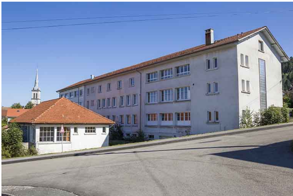
Façade postérieure, de trois quarts droite.