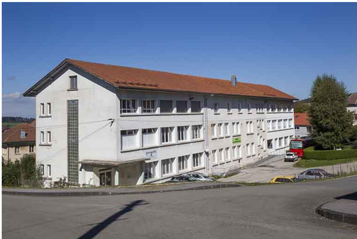
Façade antérieure, de trois quarts gauche.