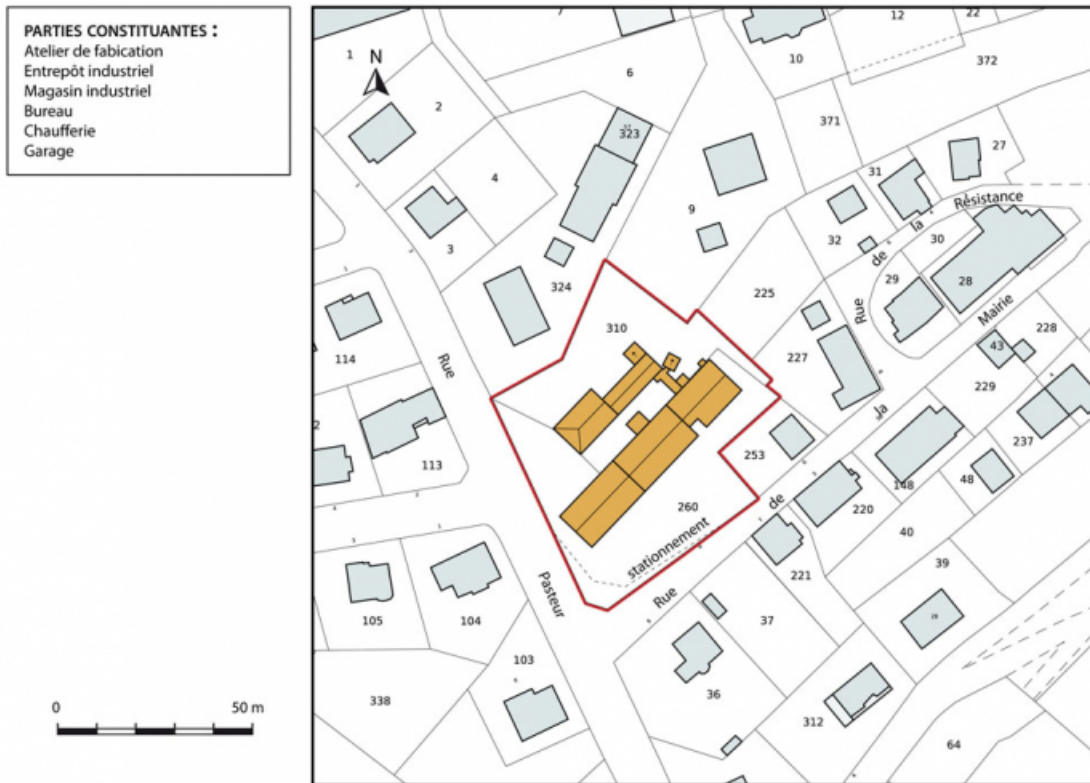
Plan-masse et de situation. Extrait du plan cadastral, 2013, section AE. 25, Damprichard, 8 rue de la Mairie