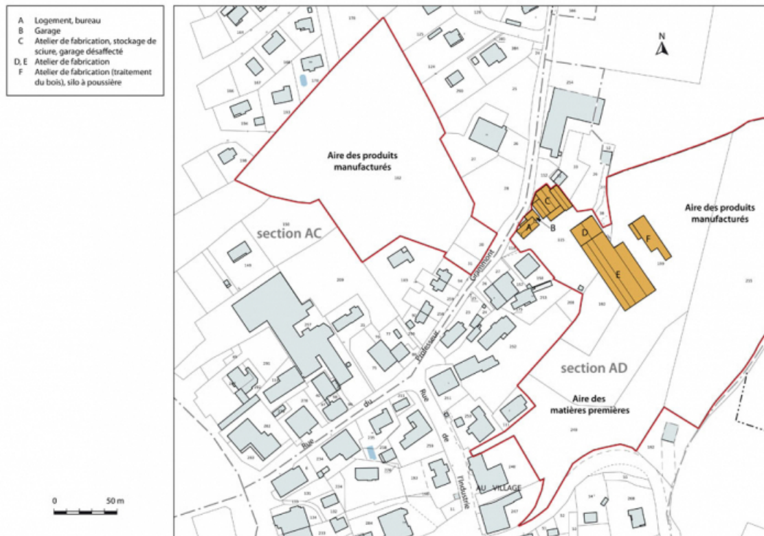
Plan-masse et de situation. Extrait du plan cadastral, 2012, sections AC et AD. 25, Damprichard, 14 rue du Professeur Grammont