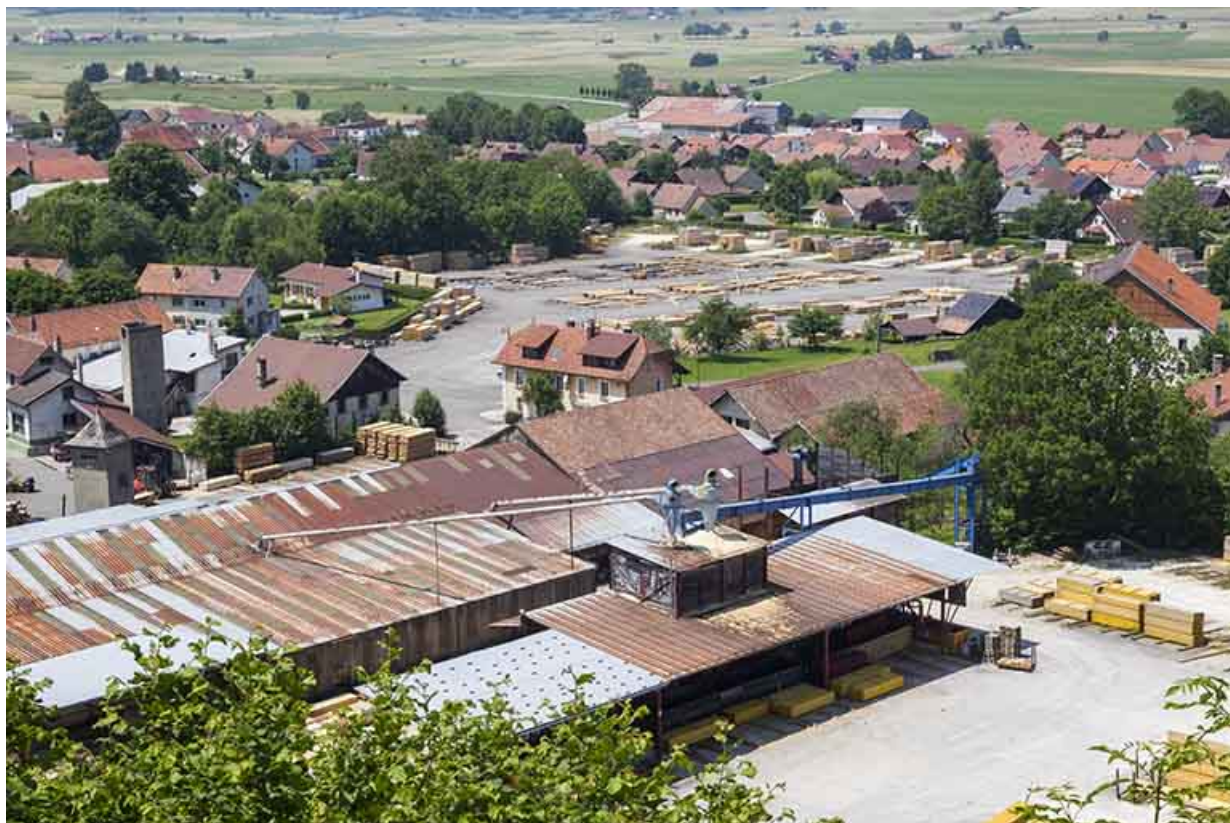
Vue plongeante sur les grands ateliers de fabrication.

25, Damprichard, 14 rue du Professeur Grammont