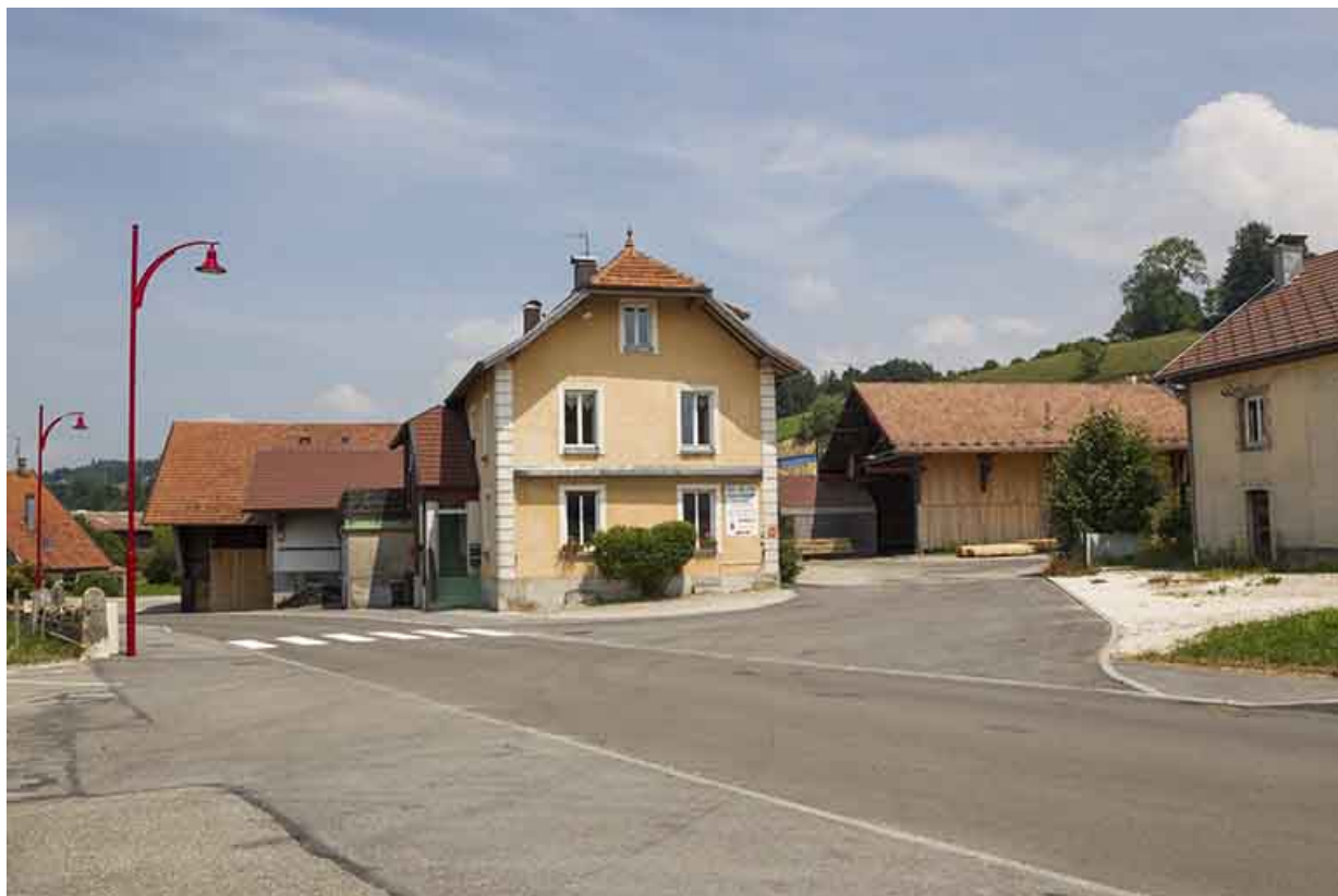
Bureau, logement et atelier de fabrication, depuis la rue du Professeur Grammont.

25, Damprichard, 14 rue du Professeur Grammont