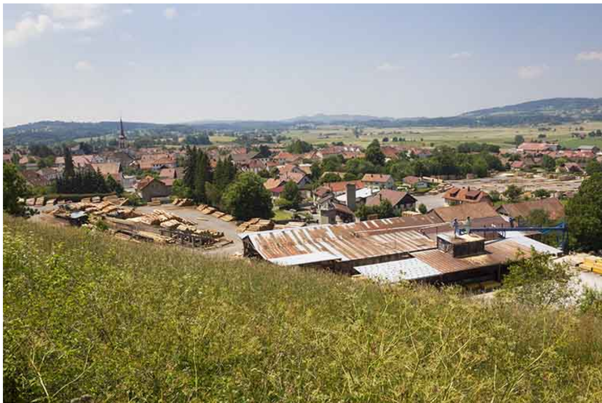
Vue d'ensemble plongeante, depuis l'est (aire des matières premières et ateliers de fabrication).

25, Damprichard, 14 rue du Professeur Grammont