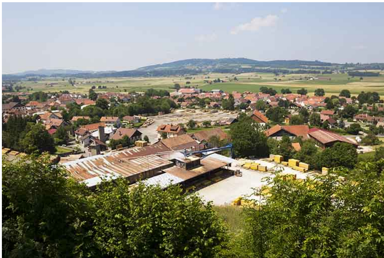
Vue d'ensemble plongeante, depuis l'est (ateliers de fabrication et bureau).

25, Damprichard, 14 rue du Professeur Grammont