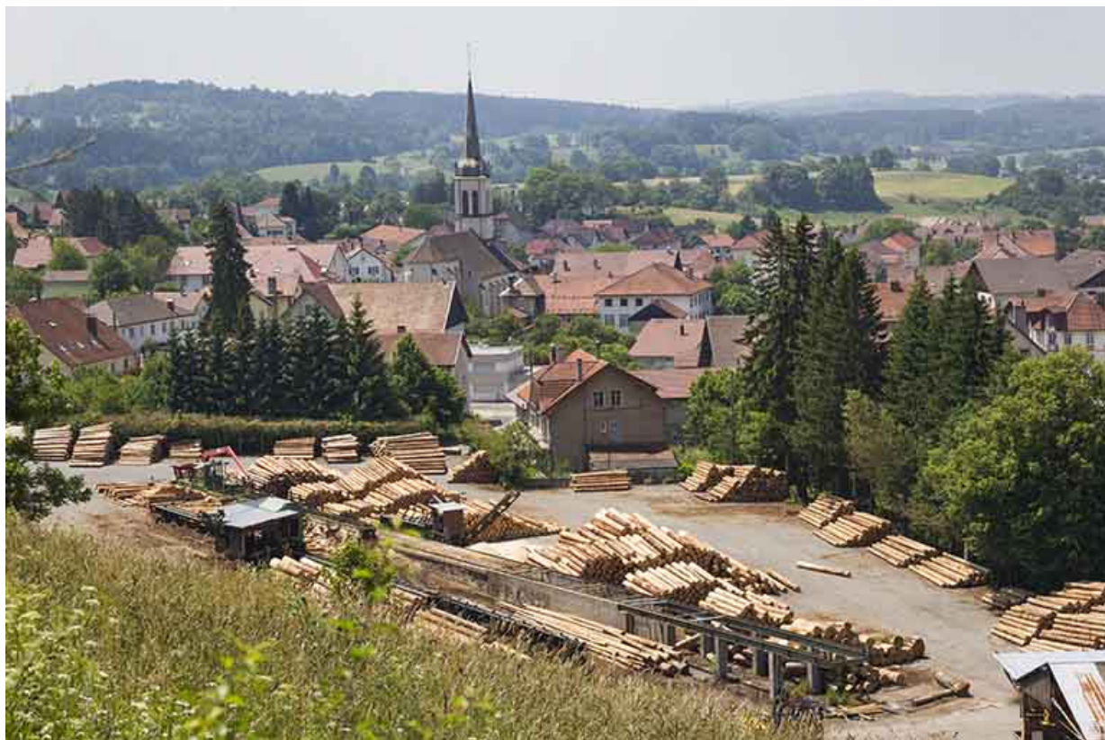
Vue plongeante sur l'aire des matières premières, au sud.

25, Damprichard, 14 rue du Professeur Grammont