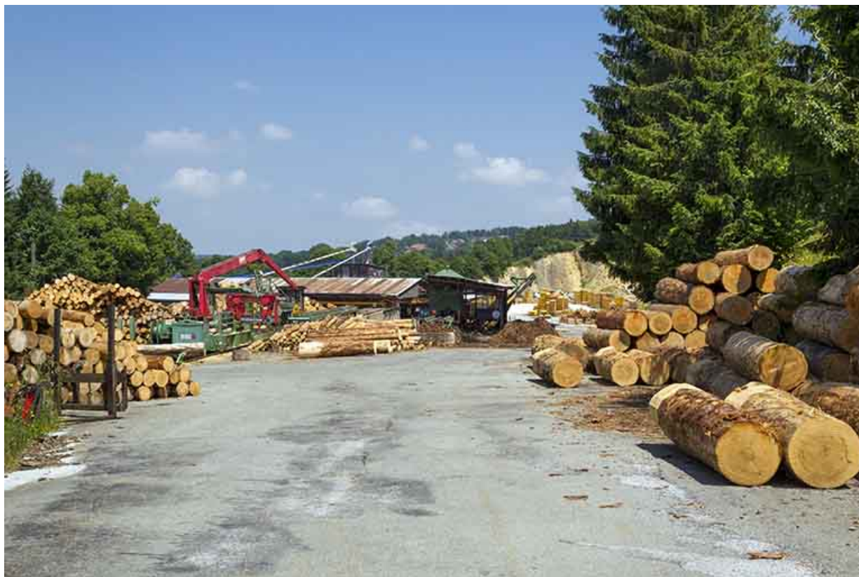
Aire des matières premières au sud : entrée côté route de Charmauvillers. 25, Damprichard, 14 rue du Professeur Grammont