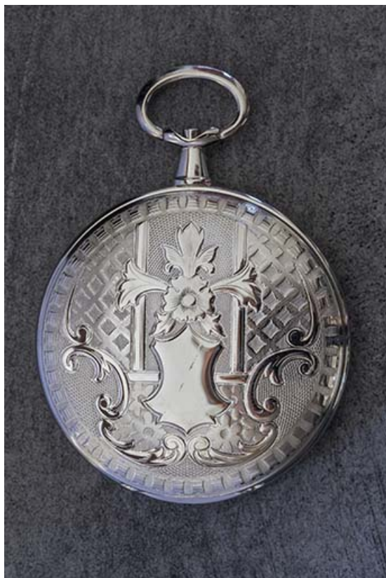
Exemple de boîte de montre de poche : décor floral et géométrique.

25, Damprichard, 9-13 rue du Général de Gaulle