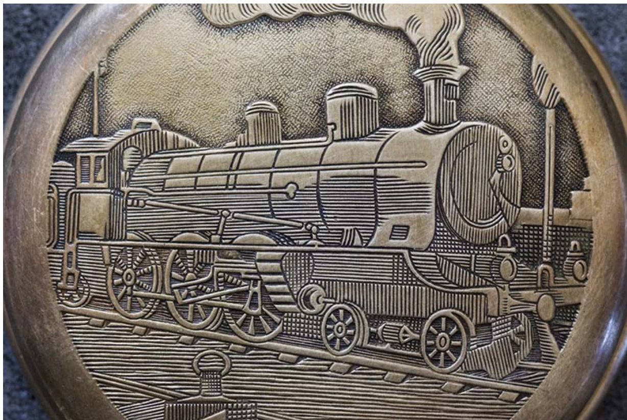
Exemple de boîte de montre de poche : machine à vapeur (détail).

25, Damprichard, 9-13 rue du Général de Gaulle