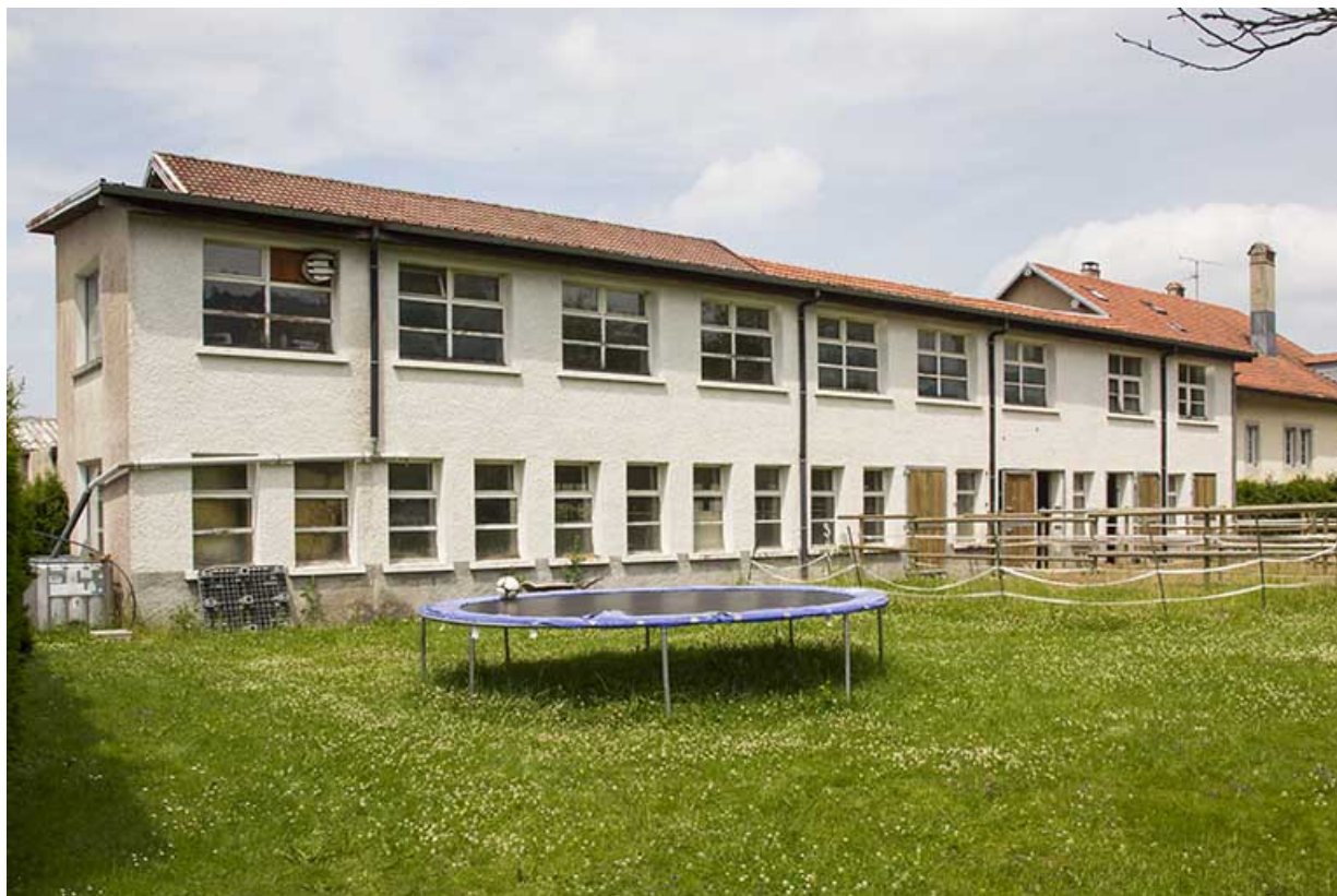
Atelier de fabrication : façade postérieure de trois quarts gauche.

25, Damprichard, 9-13 rue du Général de Gaulle