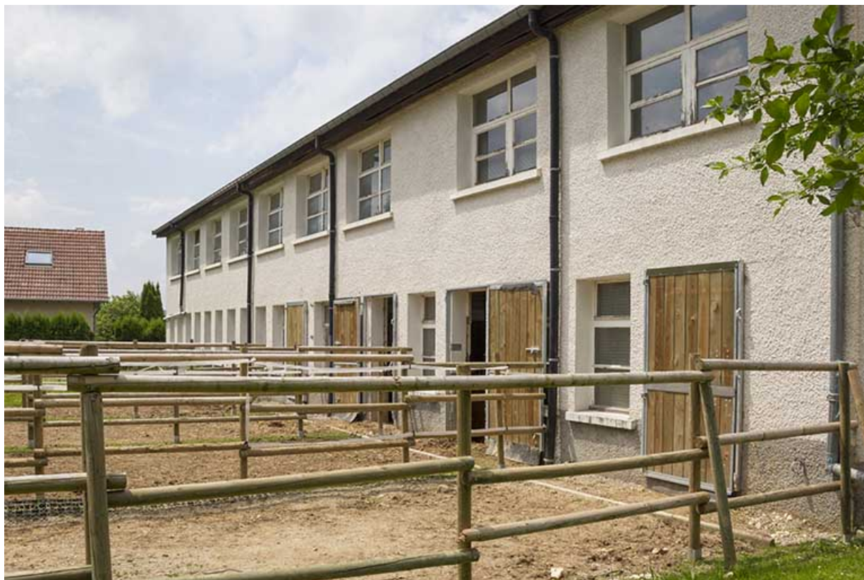
Atelier de fabrication : façade postérieure de trois quarts droite.

25, Damprichard, 9-13 rue du Général de Gaulle