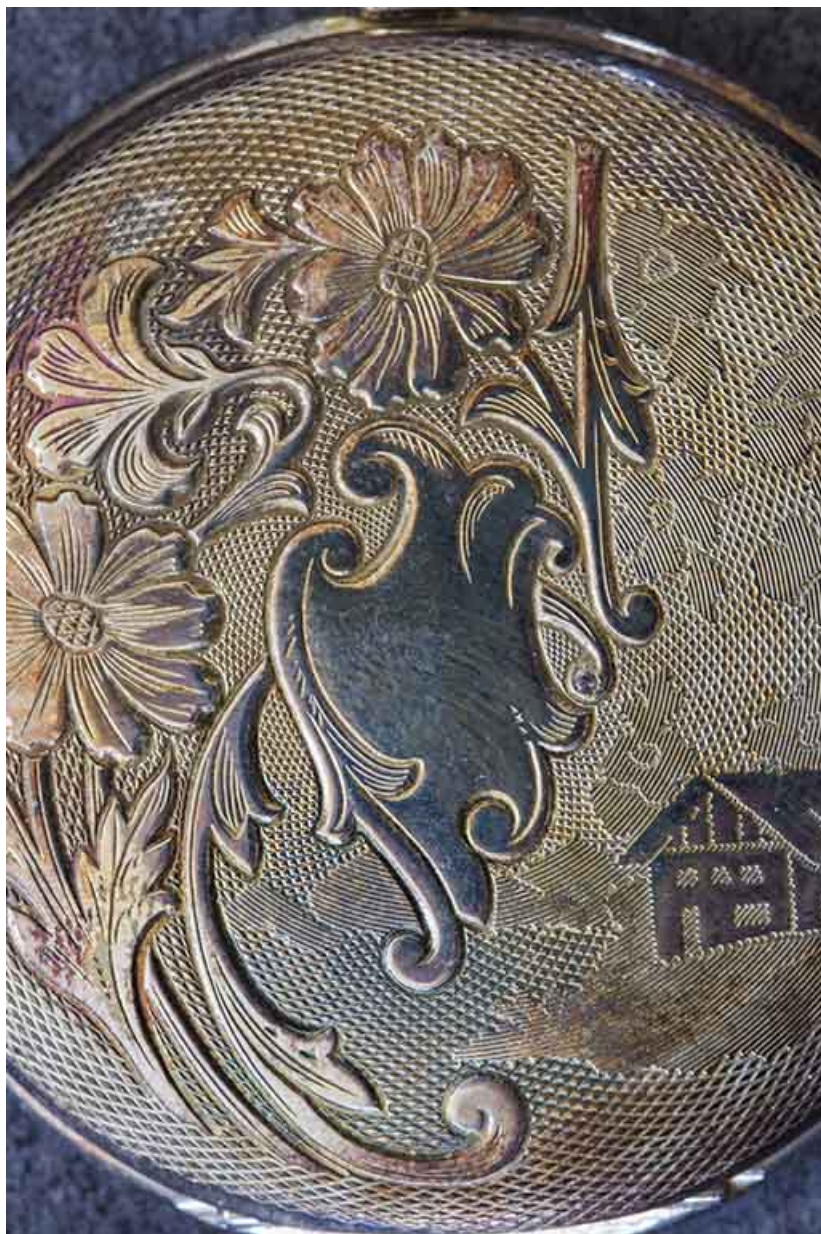
Exemple de boîte de montre de poche : décor floral et chalet (détail).

25, Damprichard, 9-13 rue du Général de Gaulle