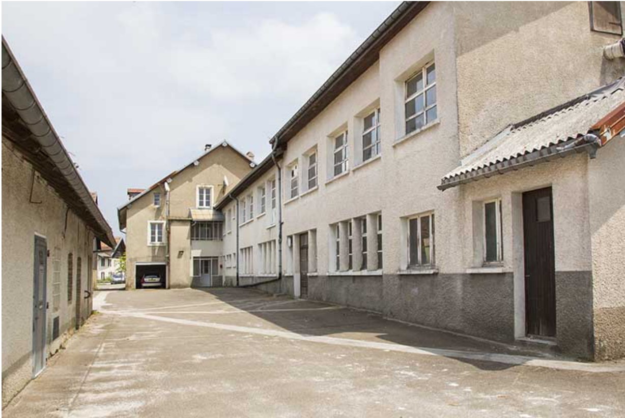
Atelier de fabrication : façade antérieure de trois quarts droite.

25, Damprichard, 9-13 rue du Général de Gaulle