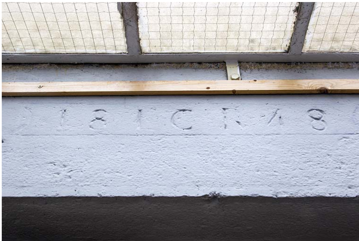
Logement patronal : date 1848 portée sur un linteau avec les initiales LCR. 25, Damprichard, 9-13 rue du Général de Gaulle