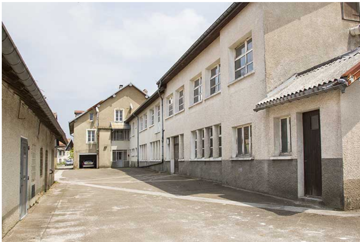
Atelier de fabrication : façade antérieure de trois quarts droite.

25, Damprichard, 9-13 rue du Général de Gaulle