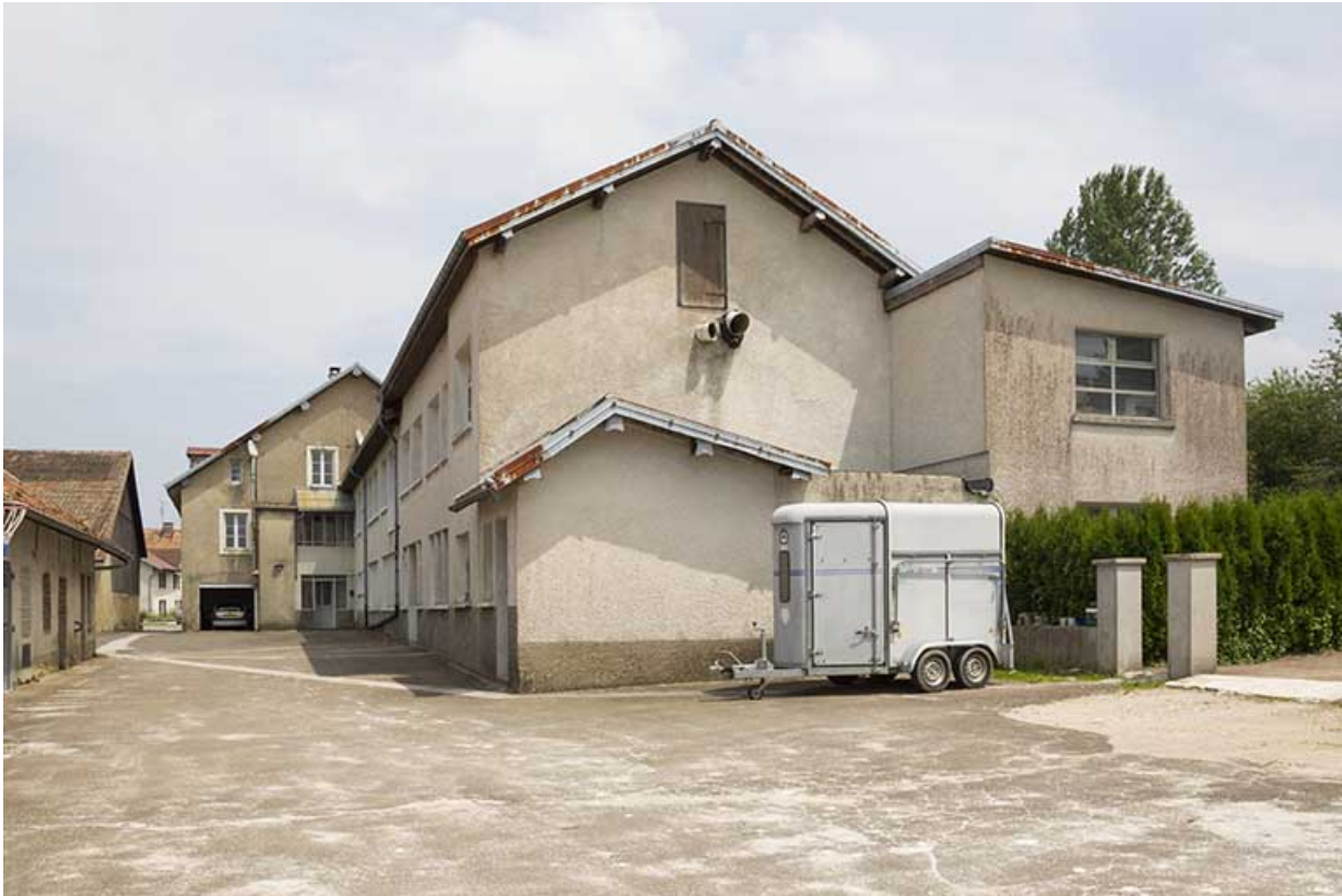
Atelier de fabrication, depuis le sud-ouest.

25, Damprichard, 9-13 rue du Général de Gaulle