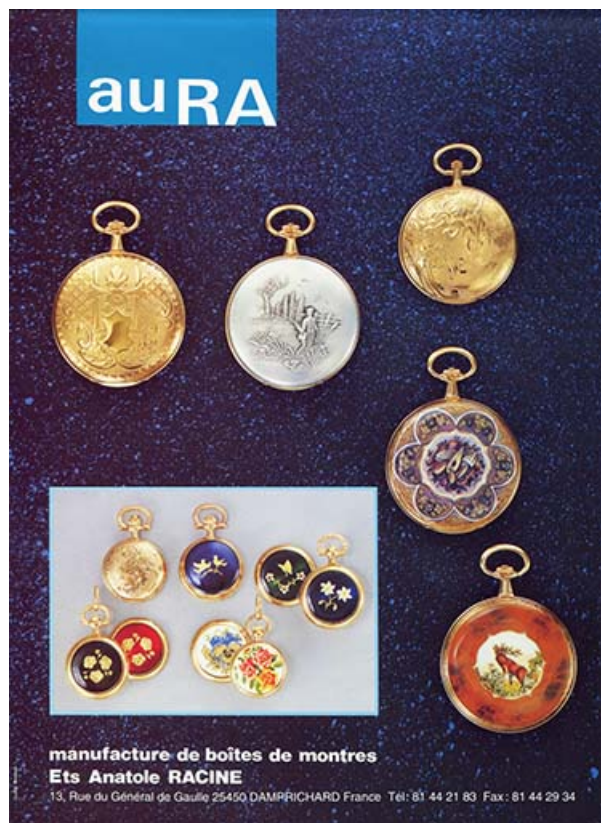
Aura. Manufacture de Boîtes de montres Ets Anatole Racine [affiche publicitaire], [fin des années 1990]. 25, Damprichard, 9-13 rue du Général de Gaulle