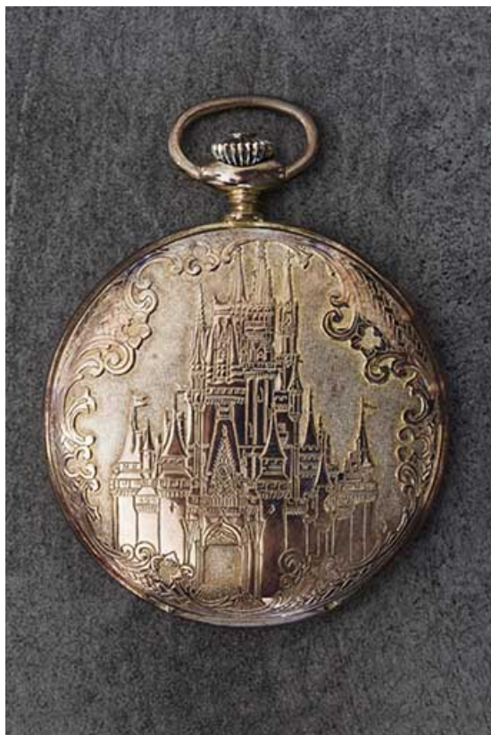
Exemple de boîte de montre de poche : décor au château.

25, Damprichard, 9-13 rue du Général de Gaulle