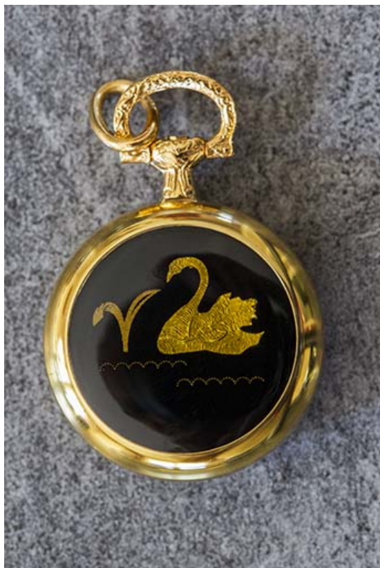
Exemple de boîte de montre de poche : décor émaillé au cygne.

25, Damprichard, 9-13 rue du Général de Gaulle