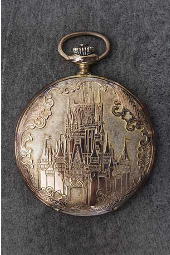
Exemple de boîte de montre de poche : décor au château.

25, Damprichard, 9-13 rue du Général de Gaulle