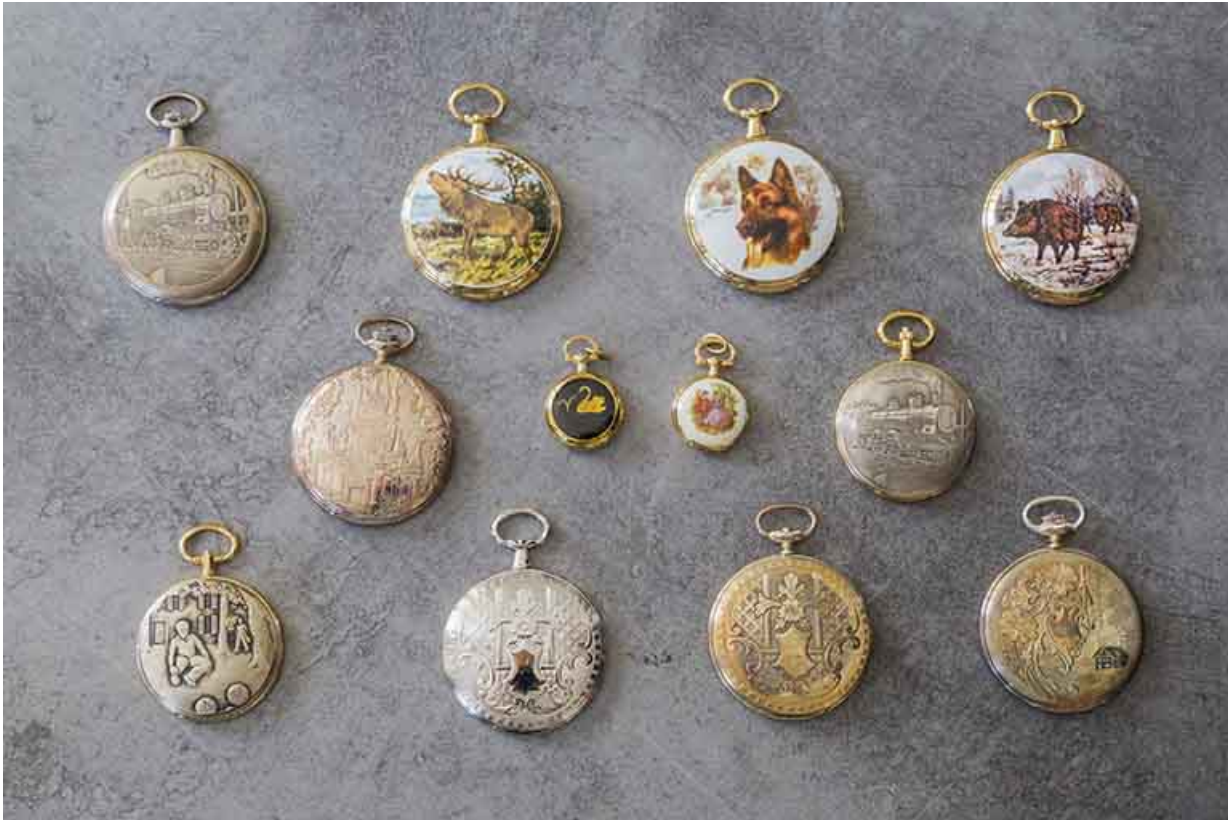
Exemples de boîtes de montre de poche réalisées à l'usine.

25, Damprichard, 9-13 rue du Général de Gaulle