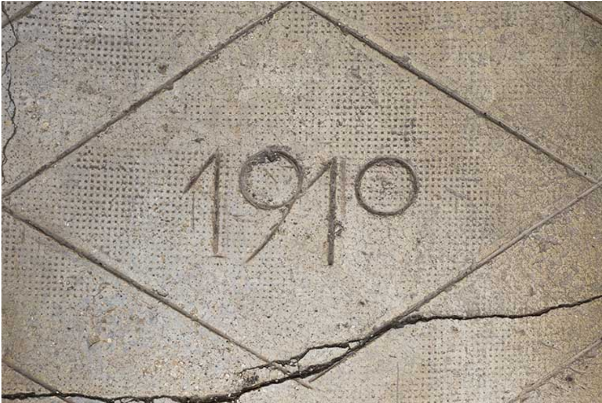
Logement patronal : date 1910 inscrite sur la dalle en béton de l'entrée.

25, Damprichard, 9-13 rue du Général de Gaulle