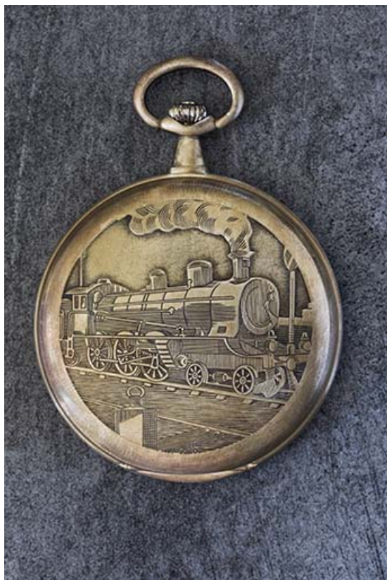
Exemple de boîte de montre de poche : machine à vapeur.

25, Damprichard, 9-13 rue du Général de Gaulle