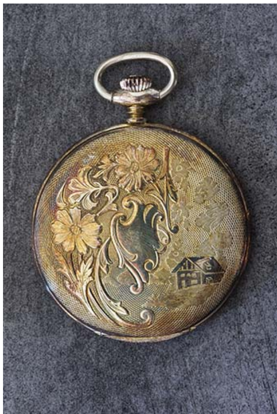
Exemple de boîte de montre de poche : décor floral et chalet.

25, Damprichard, 9-13 rue du Général de Gaulle