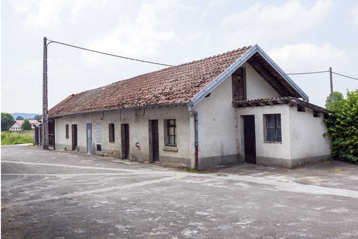
Etable, transformateur et garage.

25, Damprichard, 9-13 rue du Général de Gaulle