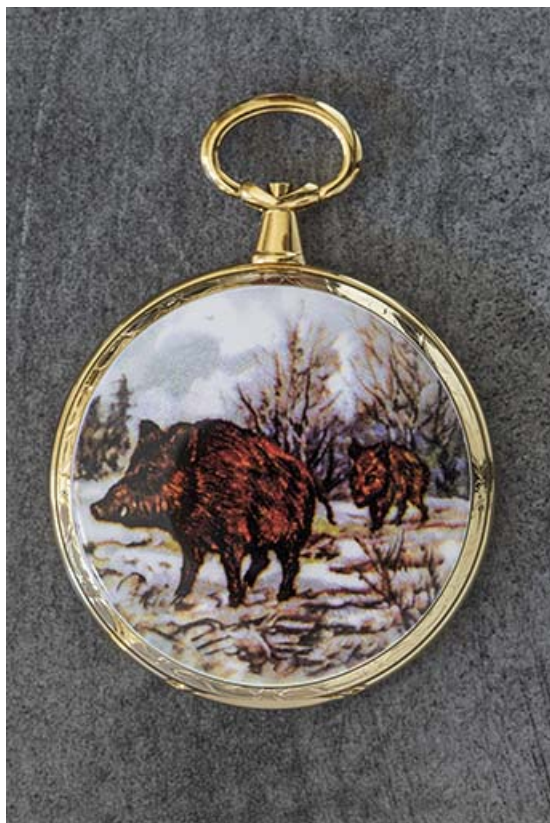
Exemple de boîte de montre de poche : décor émaillé aux sangliers.

25, Damprichard, 9-13 rue du Général de Gaulle