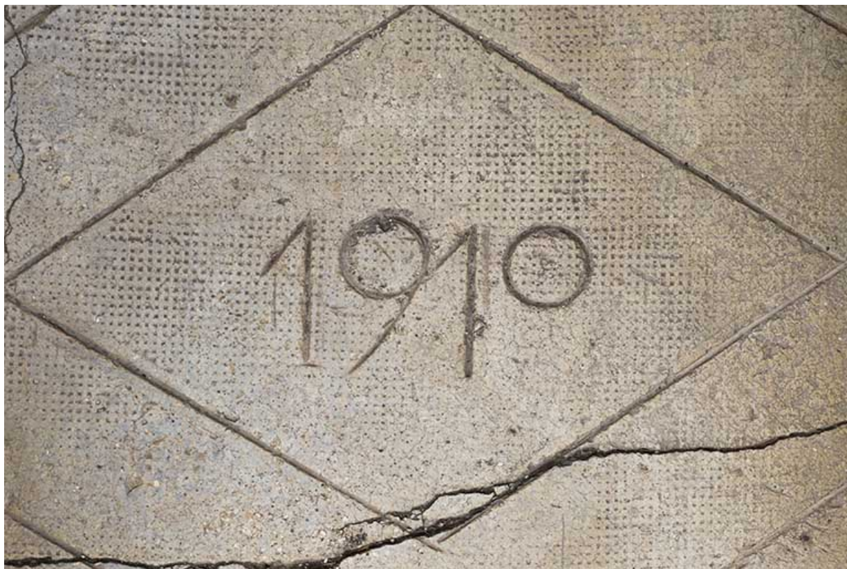
Logement patronal : date 1910 inscrite sur la dalle en béton de l'entrée.

25, Damprichard, 9-13 rue du Général de Gaulle