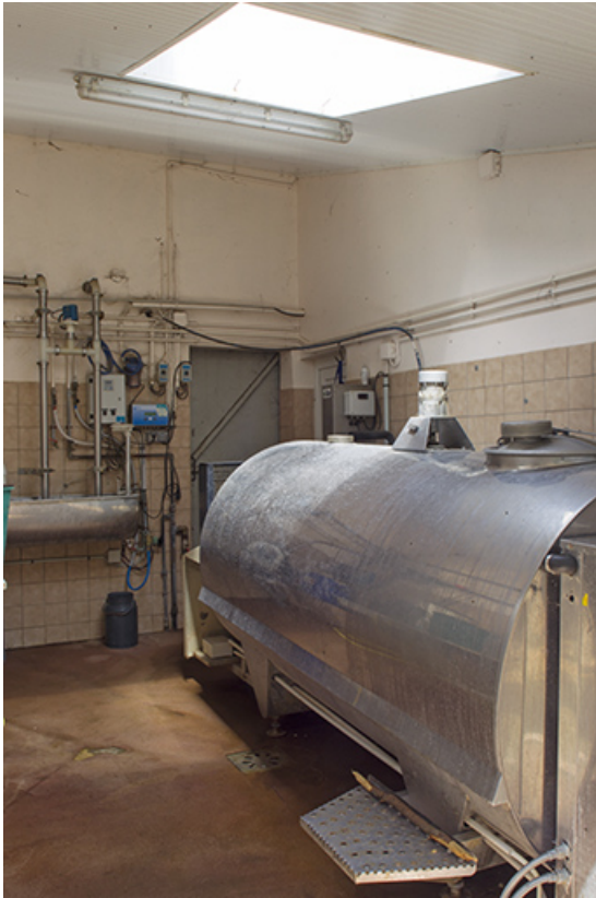
Tank à lait dans l'étable ouest.

25, Dannemarie-sur-Crète, 16 rue de Damprichard