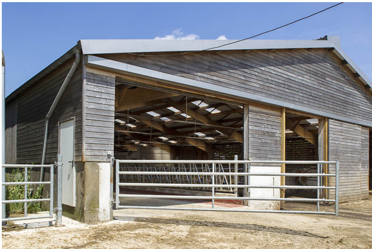
Angle sud-ouest de l'étable ouest.

25, Dannemarie-sur-Crète, 16 rue de Damprichard