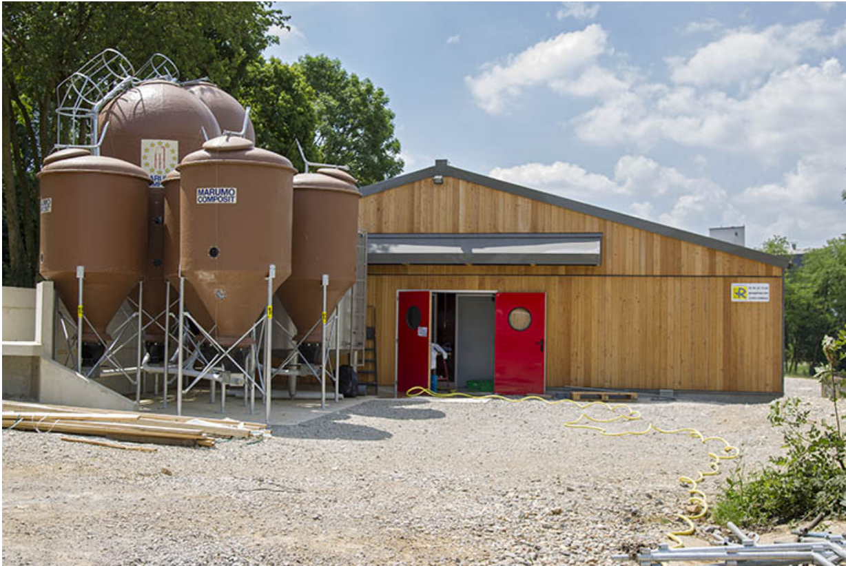
Pignon nord de la porcherie.

25, Dannemarie-sur-Crète, 16 rue de Damprichard