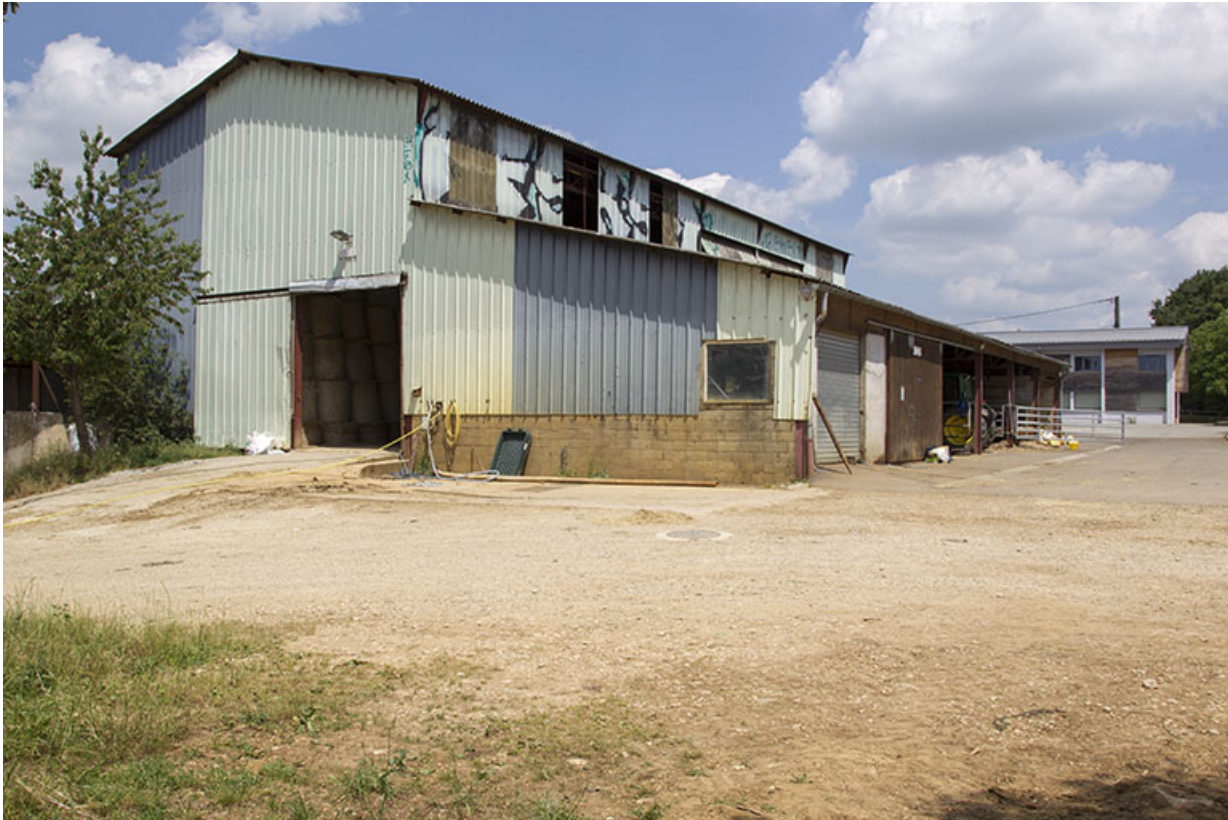
Vue de trois-quart sud-est de l'entrepôt agricole.

25, Dannemarie-sur-Crète, 16 rue de Damprichard