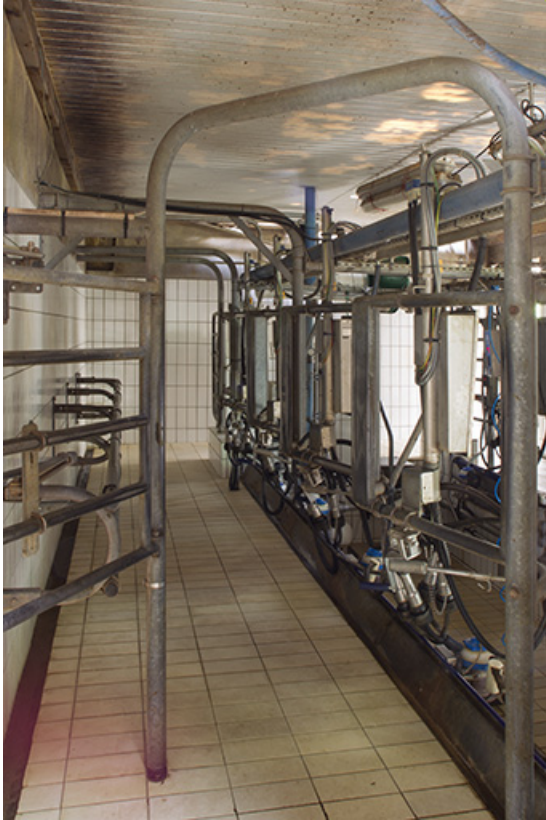
Salle de traite de l'étable ouest.

25, Dannemarie-sur-Crète, 16 rue de Damprichard