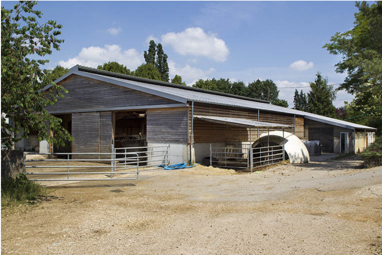
L'étable ouest vue de trois-quart sud-est.

25, Dannemarie-sur-Crète, 16 rue de Damprichard