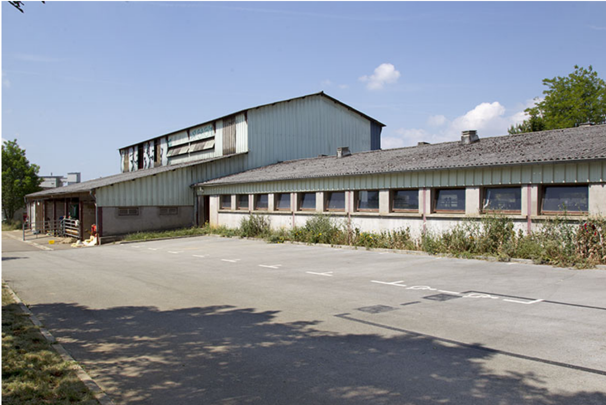
Façades est de l'étable est et de l'entrepôt agricole.

25, Dannemarie-sur-Crète, 16 rue de Damprichard