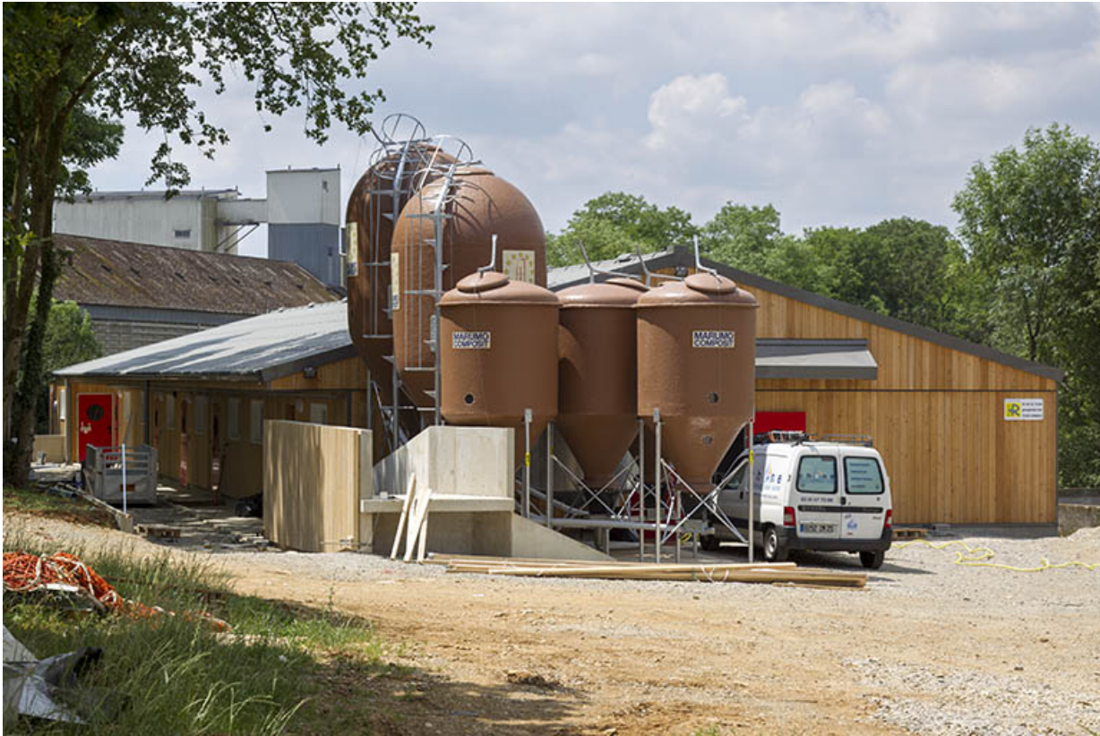
La porcherie vue du nord-est.

25, Dannemarie-sur-Crète, 16 rue de Damprichard