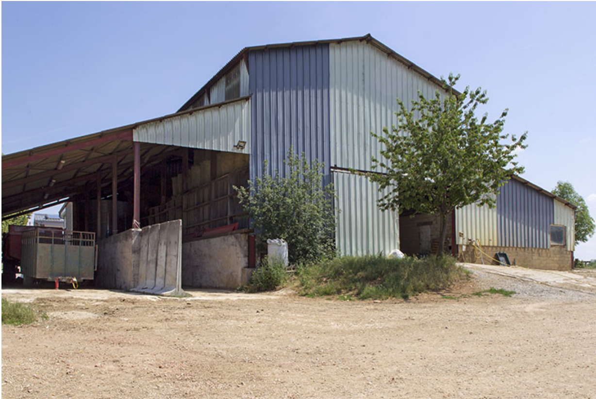
Pignon sud de l'entrepôt agricole.

25, Dannemarie-sur-Crète, 16 rue de Damprichard