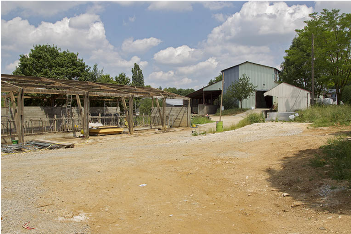
L'étable sud en travaux et pignons sud de la quarantaine et de l'entrepôt agricole.

25, Dannemarie-sur-Crète, 16 rue de Damprichard