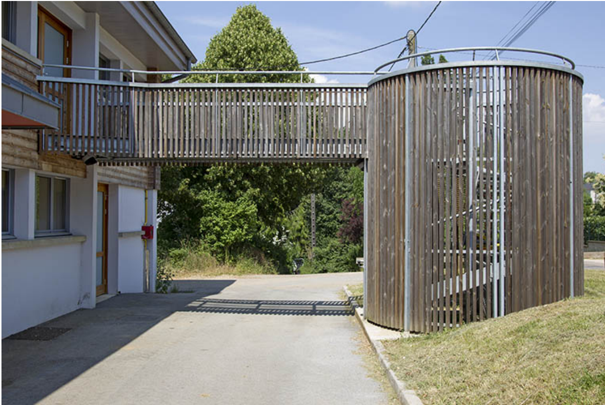
Escalier hors-oeuvre sur la face antérieure du bâtiment de services.

25, Dannemarie-sur-Crète, 16 rue de Damprichard