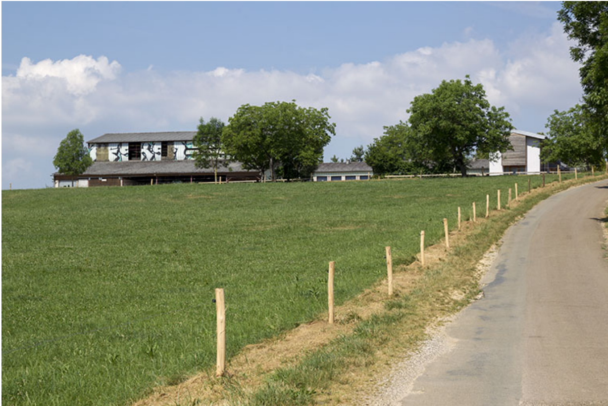
Vue d'ensemble de la ferme depuis l'est.

25, Dannemarie-sur-Crète, 16 rue de Damprichard