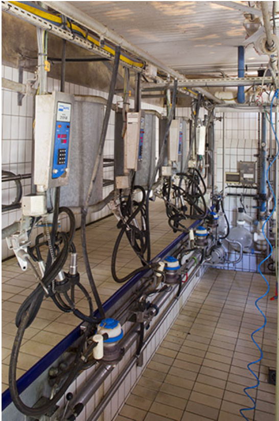
Salle de traite de l'étable ouest.

25, Dannemarie-sur-Crète, 16 rue de Damprichard