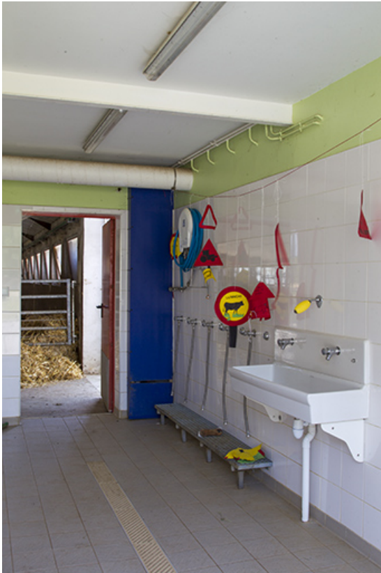
Espace lave bottes dans le bâtiment de services de la ferme.

25, Dannemarie-sur-Crète, 16 rue de Damprichard