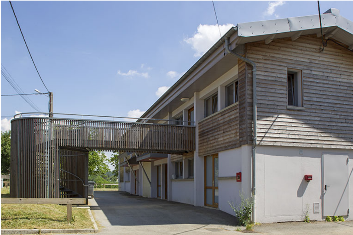
Façade antérieure - nord - et pignon ouest du bâtiment de services.

25, Dannemarie-sur-Crète, 16 rue de Damprichard