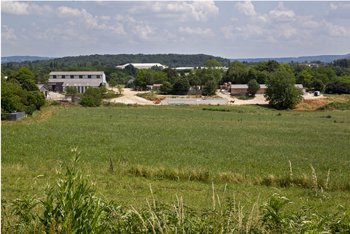
Vue d'ensemble de la ferme depuis le nord-ouest.

25, Dannemarie-sur-Crète, 16 rue de Damprichard