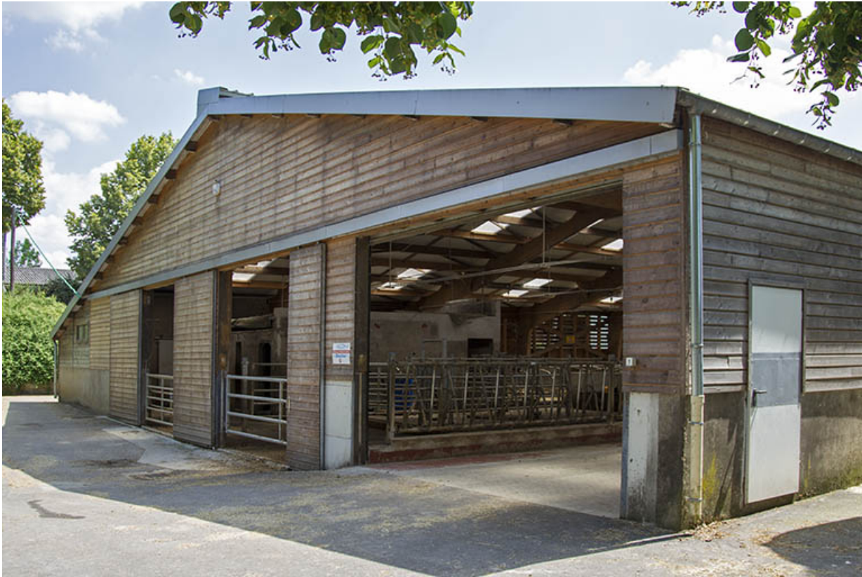
Pignon nord de l'étable ouest.

25, Dannemarie-sur-Crète, 16 rue de Damprichard