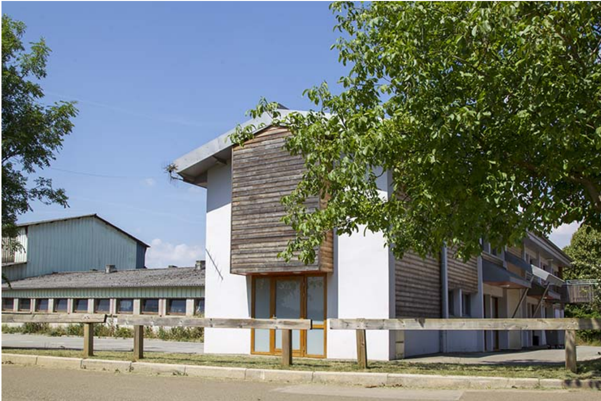
Pignon est du bâtiment de services et étable est.

25, Dannemarie-sur-Crète, 16 rue de Damprichard