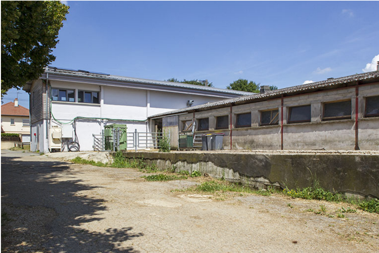
Façade postérieure du bâtiment de services et flanc ouest de l'étable est.

25, Dannemarie-sur-Crète, 16 rue de Damprichard