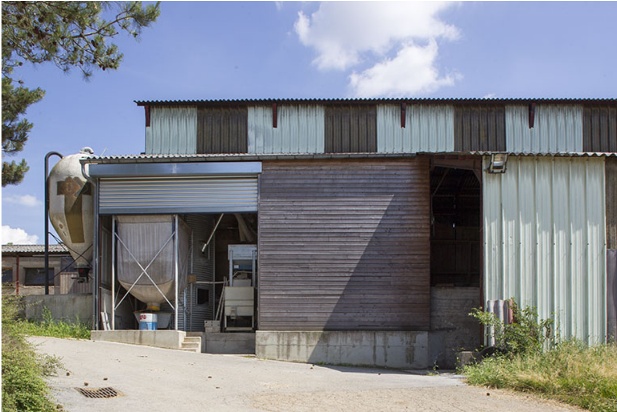
Silos, moulins à l'ouest de l'entrepôt agricole. 25, Dannemarie-sur-Crète, 16 rue de Damprichard