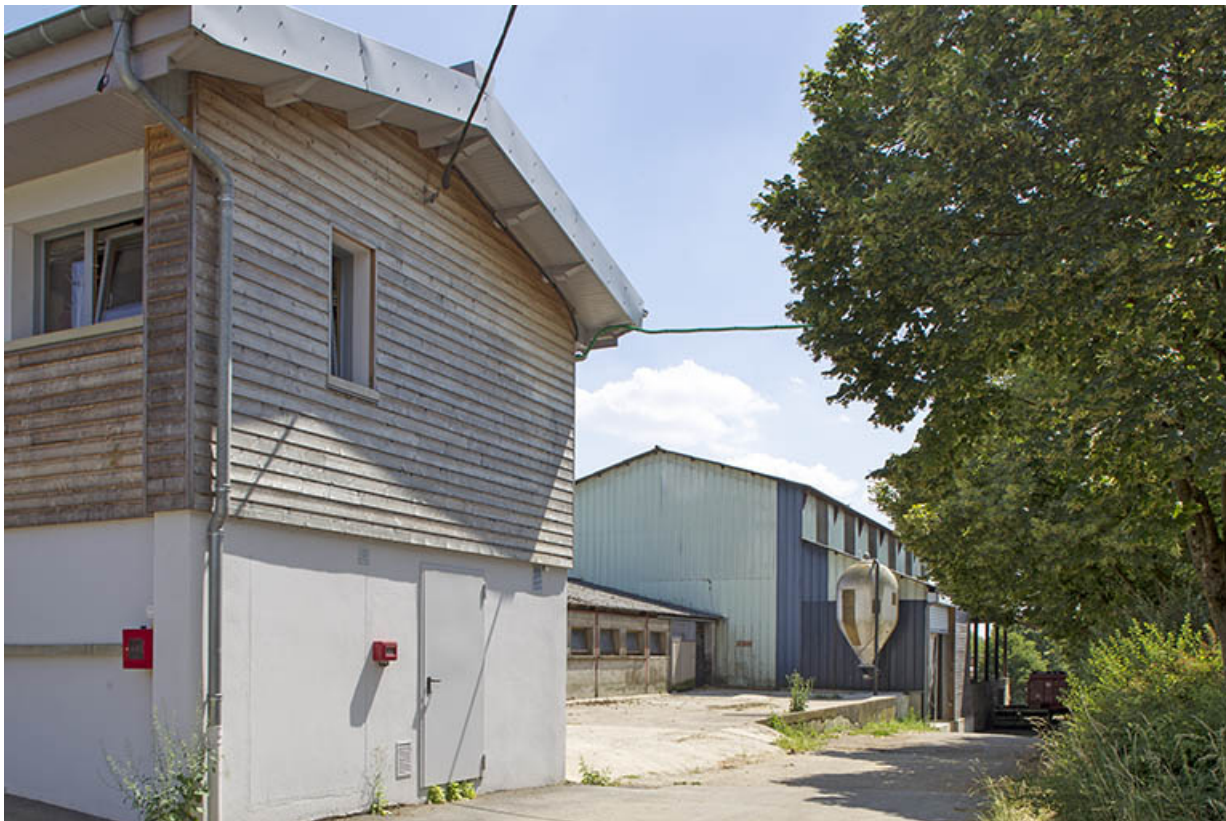
Pignon ouest du bâtiment de services et vue d'ensemble vers le sud.

25, Dannemarie-sur-Crète, 16 rue de Damprichard