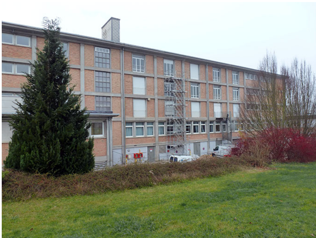
Façade postérieure du bâtiment d'internat, logement, restauration. (ex.Léger) 25, Audincourt, 6 rue René Girardot