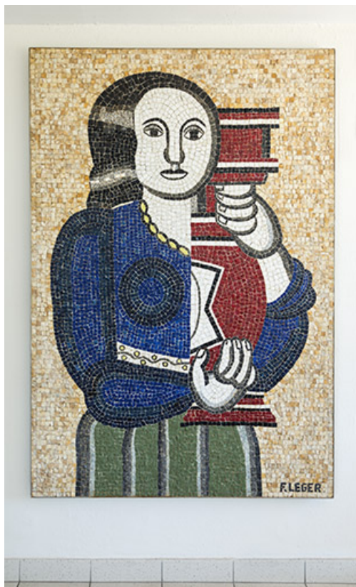
Mosaïque réplique d'une oeuvre de Léger. (ex Léger) 25, Audincourt, 6 rue René Girardot