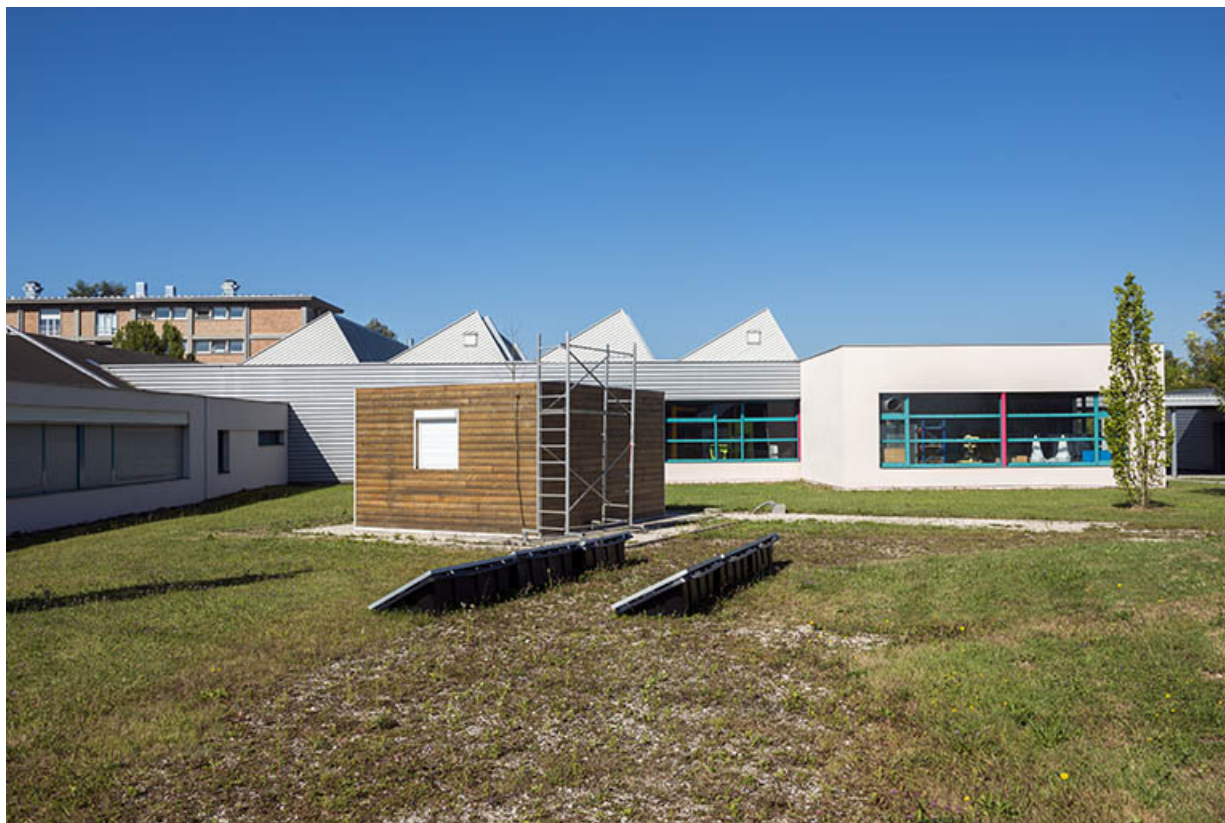
Détail façade est du bâtiment de plasturgie et chalets pédagogiques. (ex-Léger)