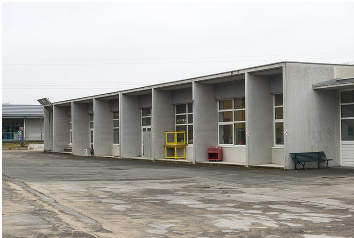
Façade nord du bâtiment des ateliers et de l'administration.