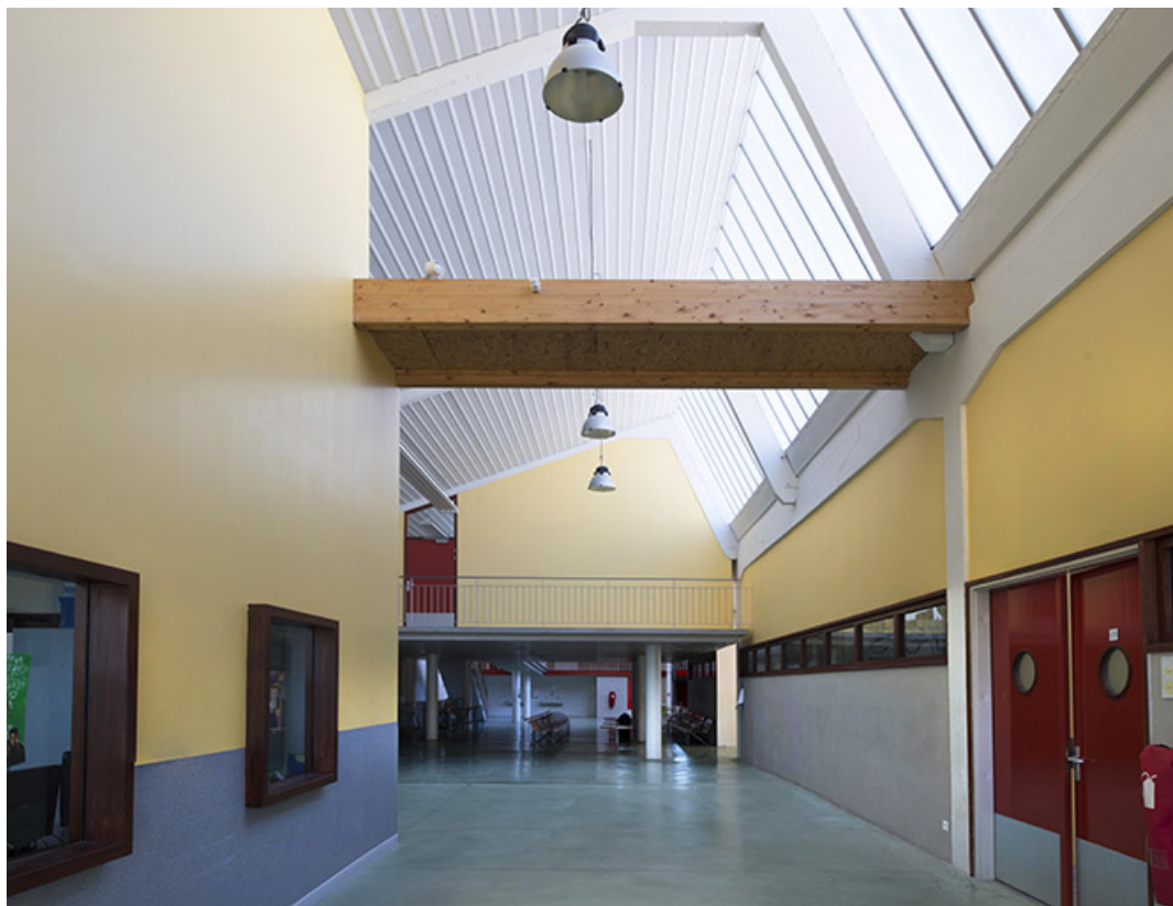
Vue intérieure des ateliers sous sheds. (ex Léger)