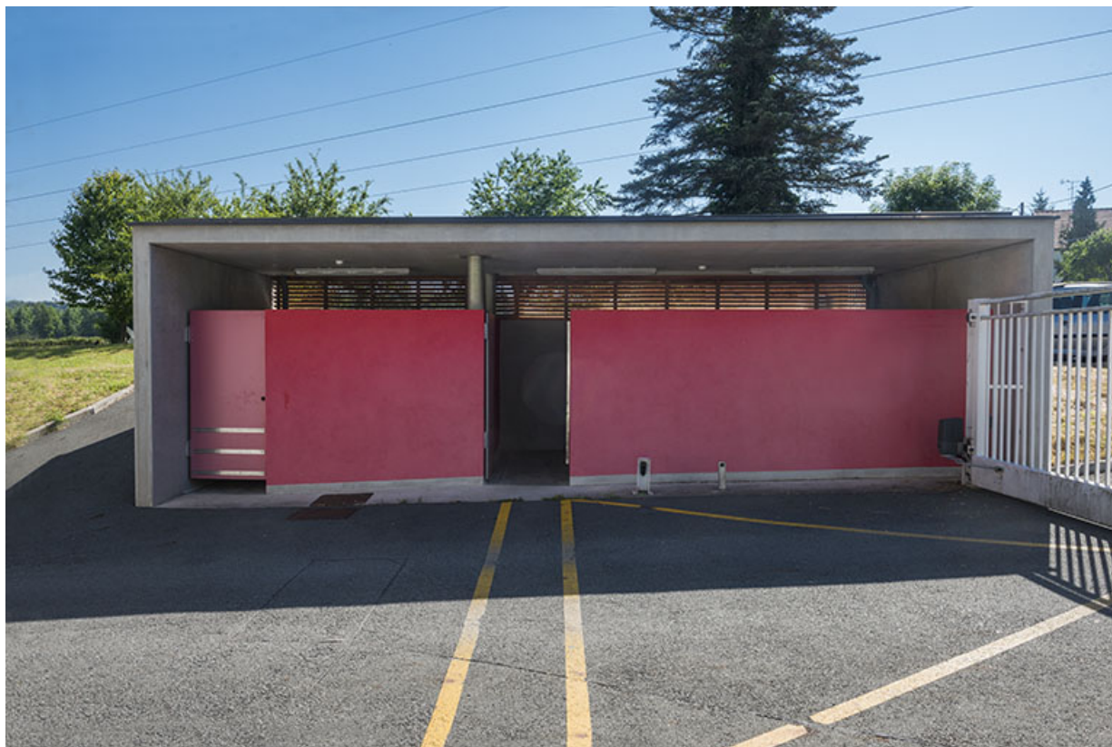
Local d'abri des poubelles à l'entrée 45 rue des cantons. 25, Audincourt, 6 rue René Girardot