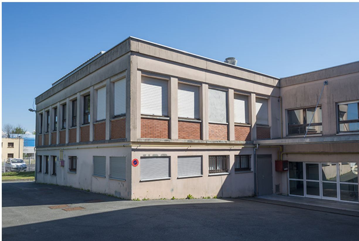
Façade ouest du bâtiment d'externat. (ex-Garnier)