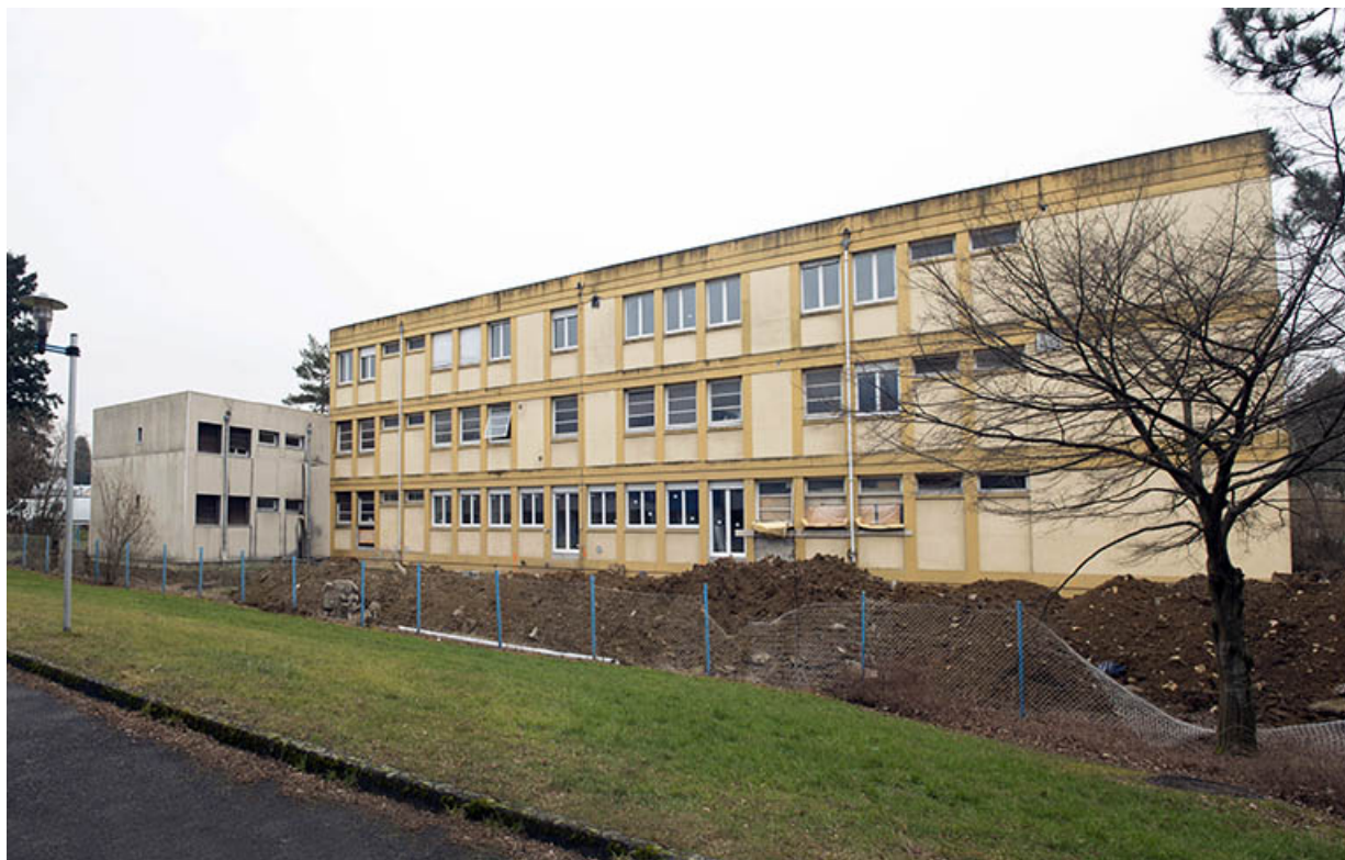
Face nord du bâtiment antérieurement affecté à usage d'externat, internat, logement. (ex Garnier) 25, Audincourt, 6 rue René Girardot