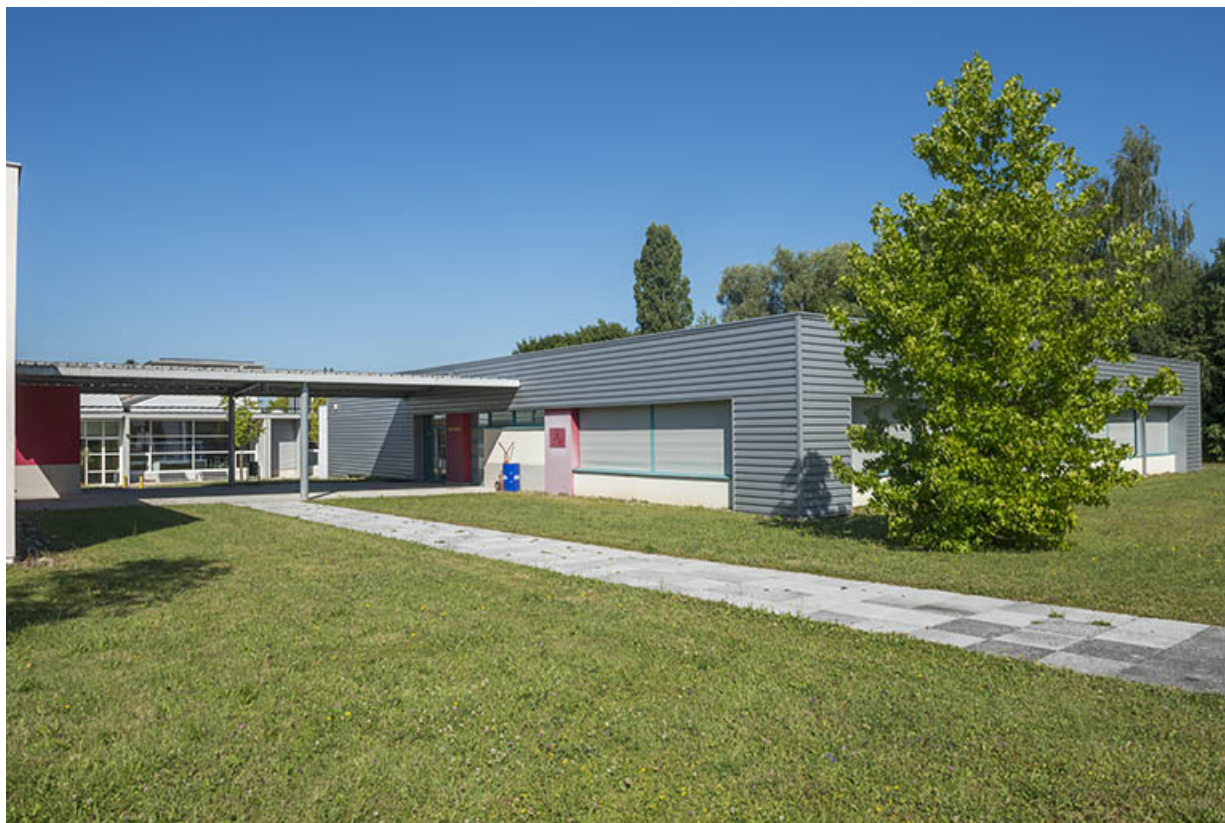
Angle sud-est du bâtiment de maintenance.(ex-Léger)