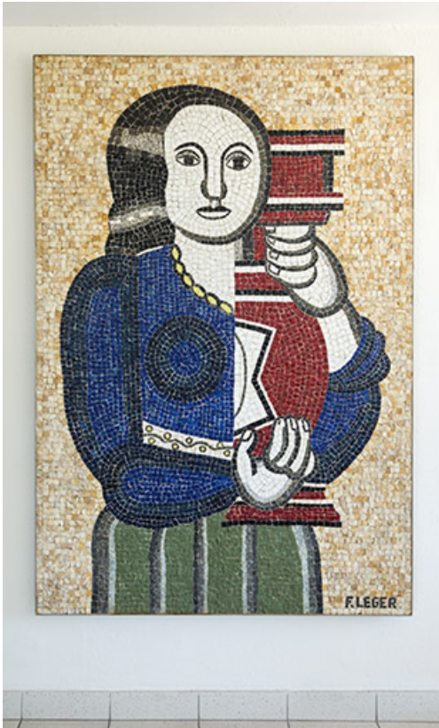
Mosaïque réplique d'une oeuvre de Léger. (ex Léger)