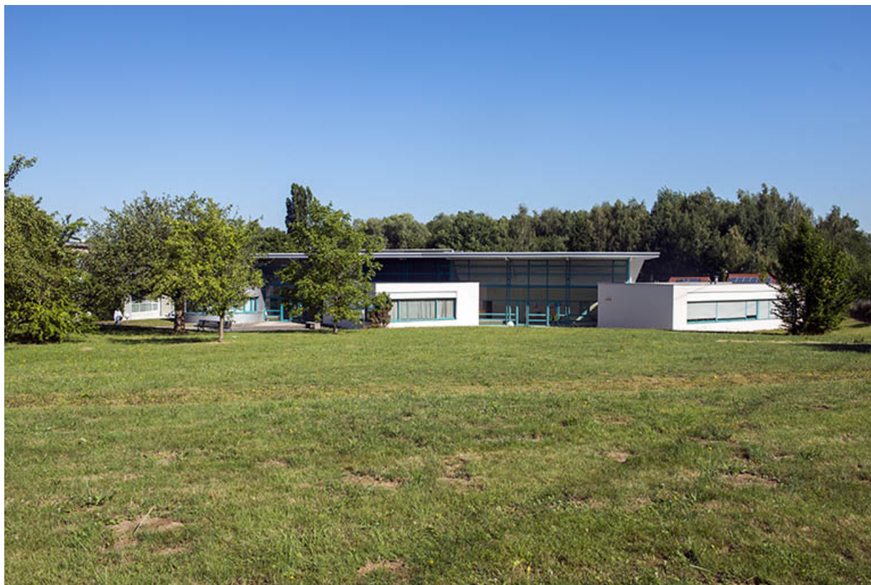
Vue d'ensemble du verger et des bâtiments plasturgie. (ex-Léger)