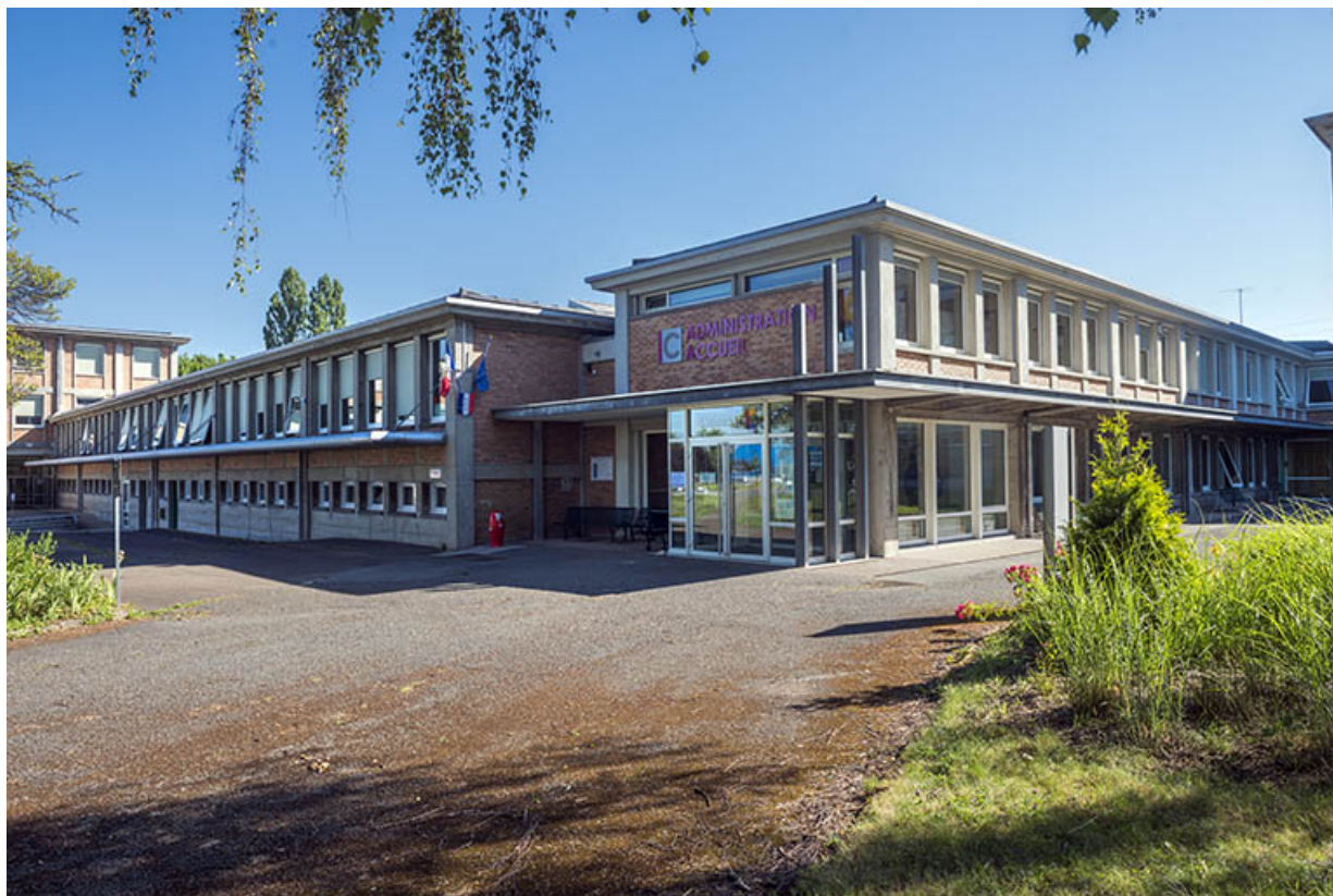
Façade ouest des bâtiments des ateliers et de l'administration, angle sud et façade sud. (ex-Léger) 25, Audincourt, 6 rue René Girardot