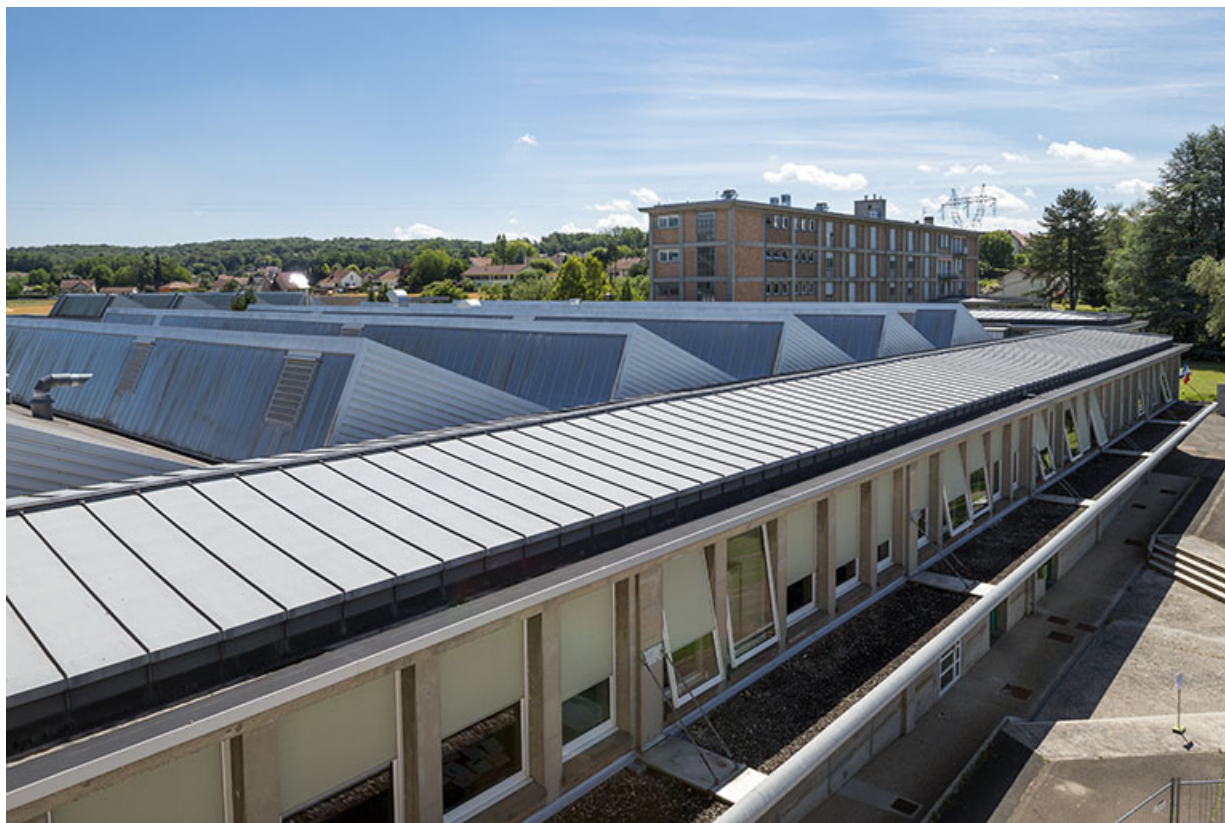
Toiture des ateliers et façade antérieure du bâtiment d'internat, logement, restauration. (ex.Léger) 25, Audincourt, 6 rue René Girardot