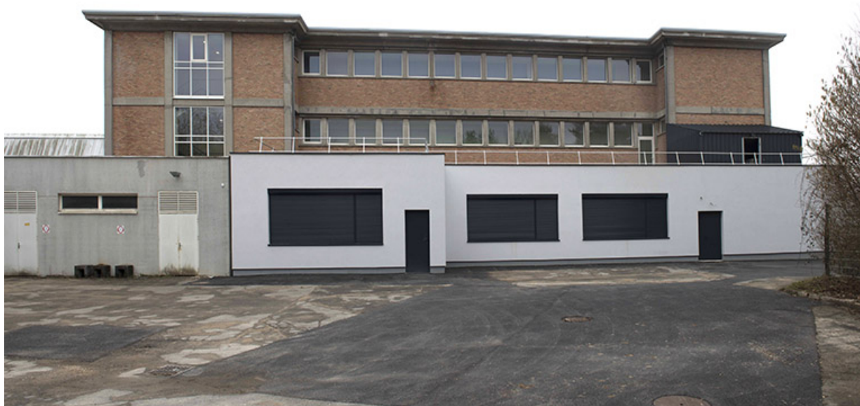
Façade postérieure nord de l'externat après les travaux. (ex-Léger) 25, Audincourt, 6 rue René Girardot