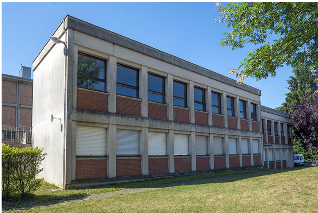
Façades antérieures (nord) du bâtiment d'externat. (ex-Garnier)