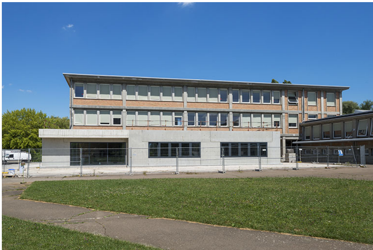
Façade antérieure sud de l'externat (ex-Léger)