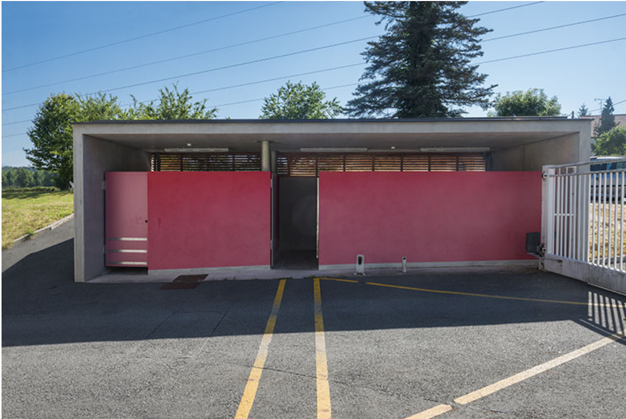
Local d'abri des poubelles à l'entrée 45 rue des cantons.