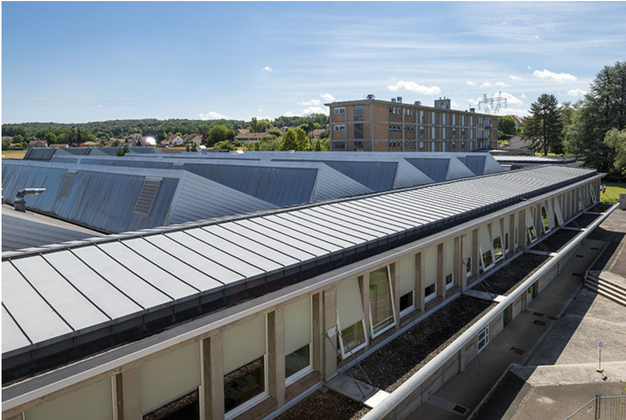
Toiture des ateliers et façade antérieure du bâtiment d'internat, logement, restauration. (ex.Léger)