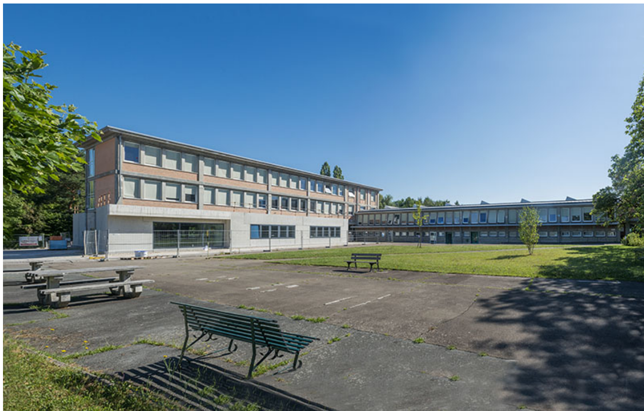
Cour devant les bâtiments d'externat, d'administration et d'ateliers. (ex-Leger) 25, Audincourt, 6 rue René Girardot