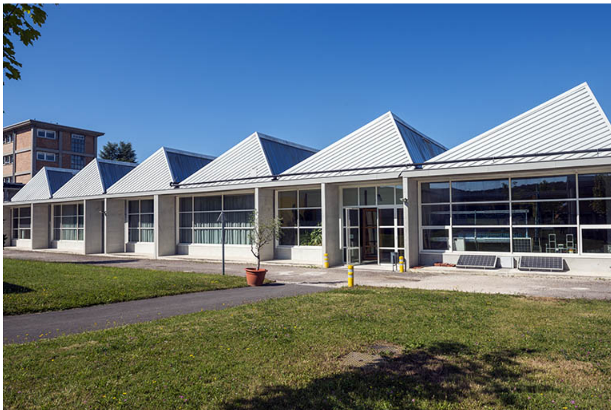
Façade postérieure est du bâtiment des ateliers et de l'administration. (ex-Léger) 25, Audincourt, 6 rue René Girardot