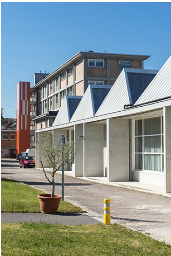
Façade postérieure est du bâtiment des ateliers et de l'administration. (ex-Léger) 25, Audincourt, 6 rue René Girardot