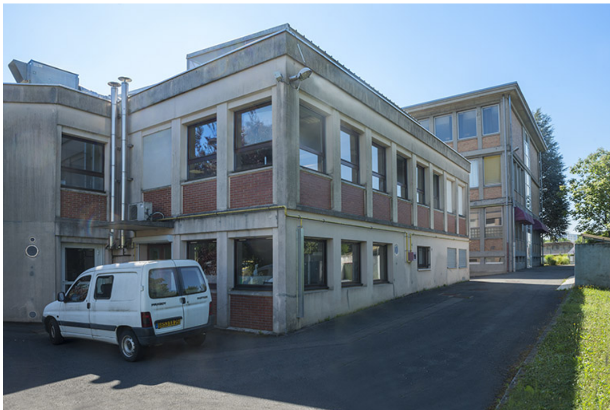
Angle nord ouest et façades ouest du bâtiment d'externat (ex-Garnier) 25, Audincourt, 6 rue René Girardot