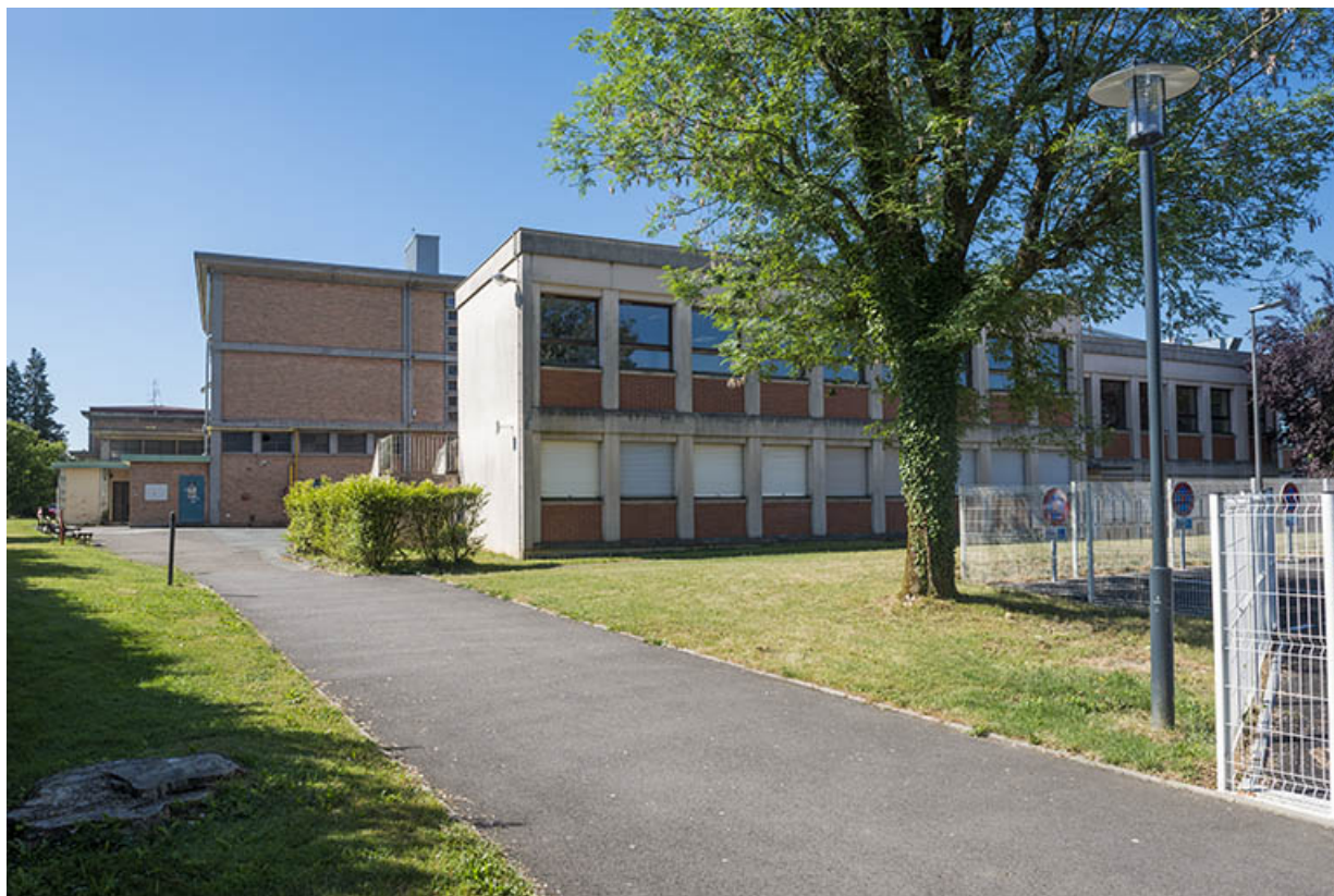
Vue d'ensemble des façades antérieures (nord) du bâtiment d'externat. (ex-Garnier) 25, Audincourt, 6 rue René Girardot