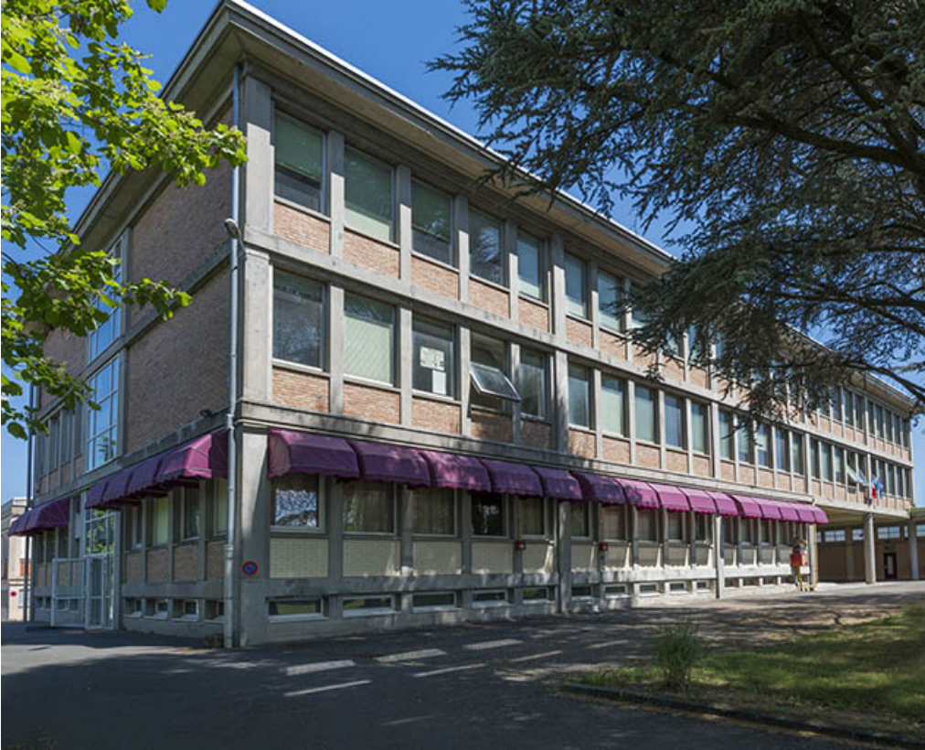
Façade antérieure et pignon ouest de l'externat restaurant d'application (ex Garnier) 25, Audincourt, 6 rue René Girardot