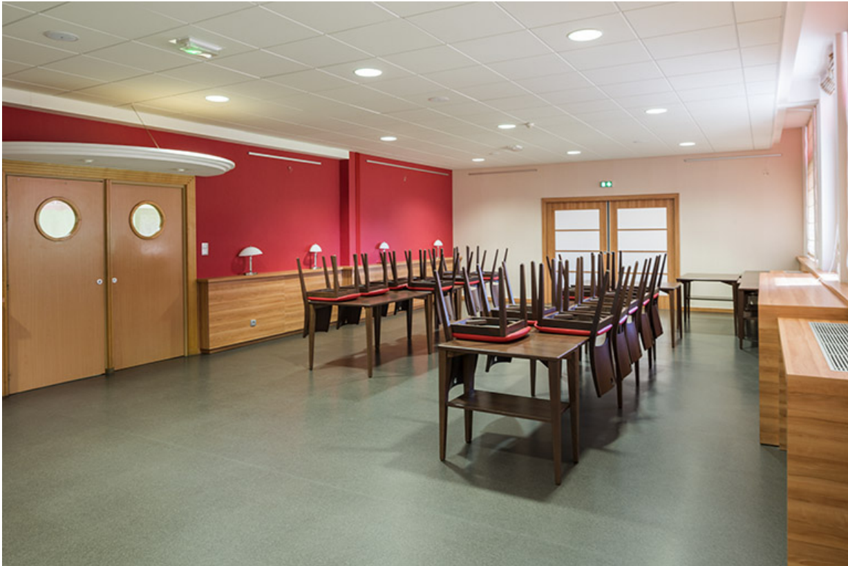
Salle du restaurant d'application.