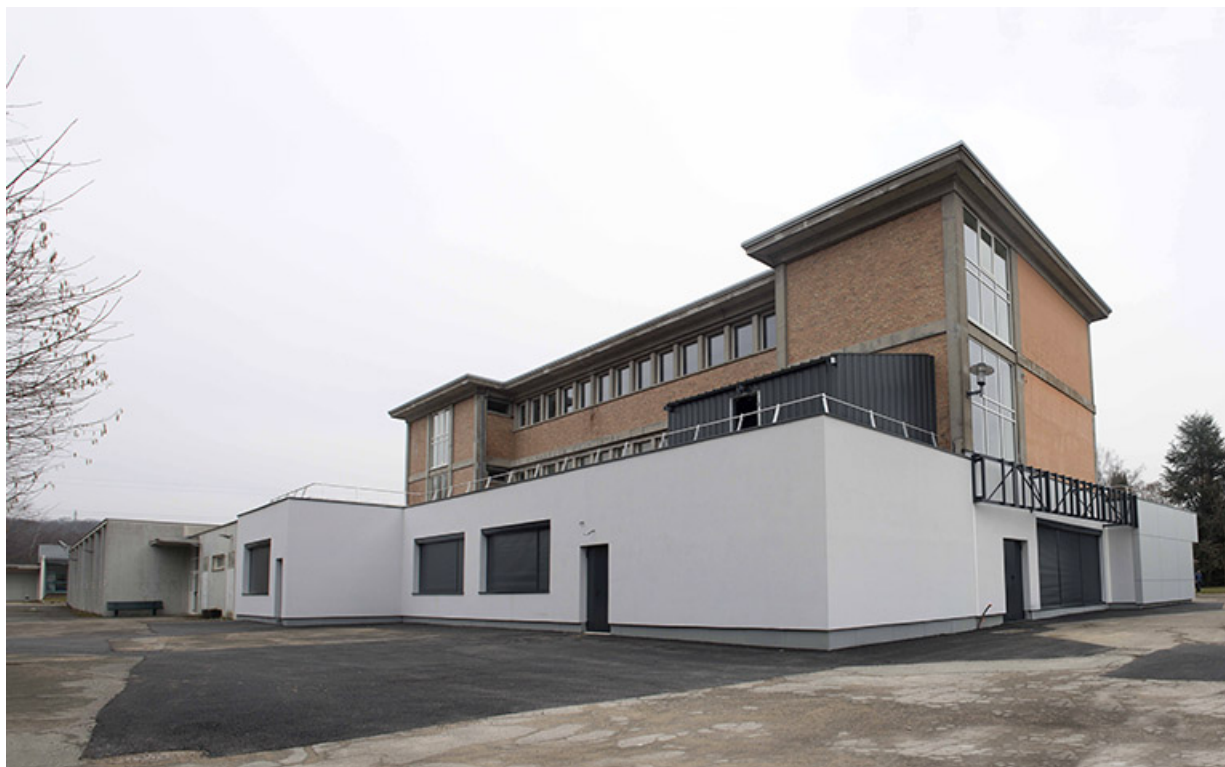
Angle nord-ouest de l'externat après les travaux. (ex-Léger)