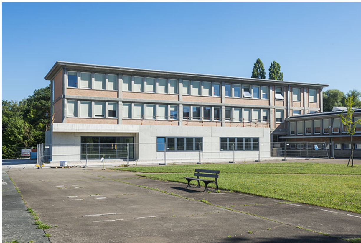
Face antérieure de l'externat (ex-Léger) durant les travaux.