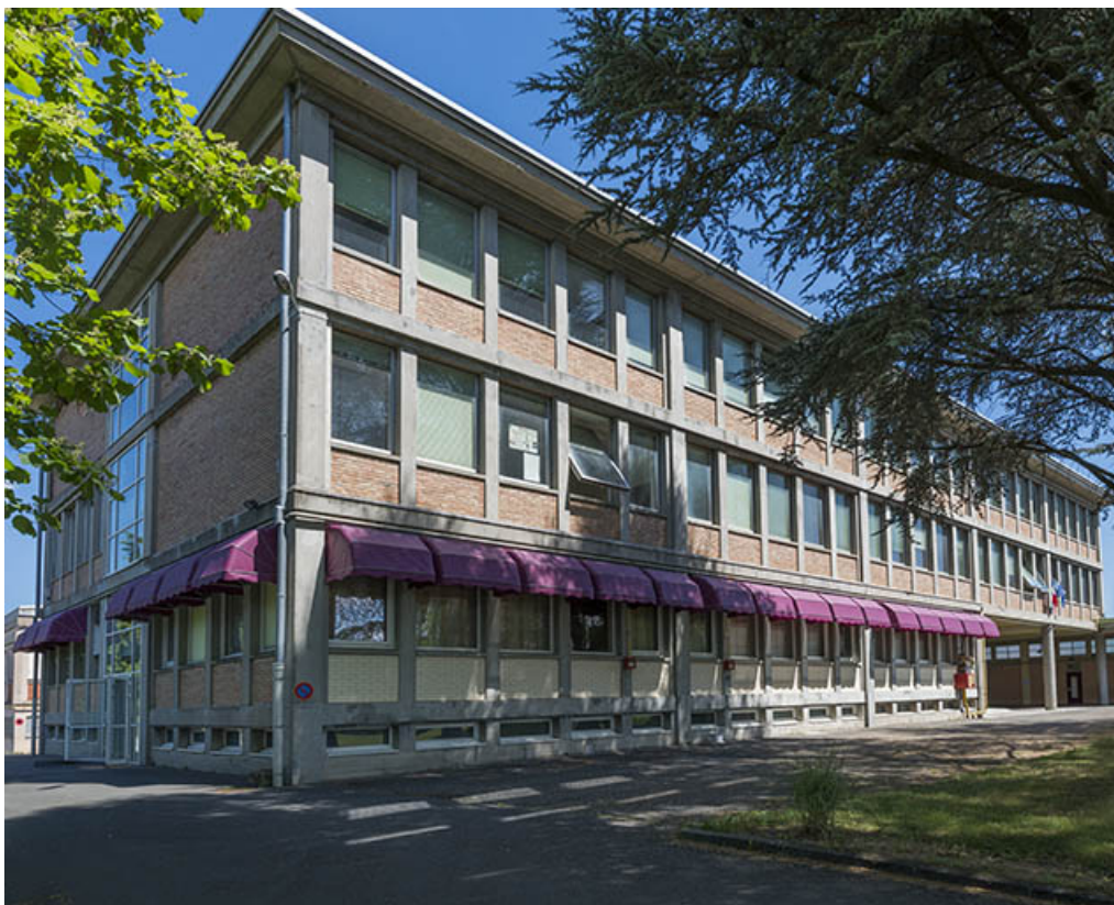
Façade antérieure et pignon ouest de l'externat restaurant d'application (ex Garnier) 25, Audincourt, 6 rue René Girardot