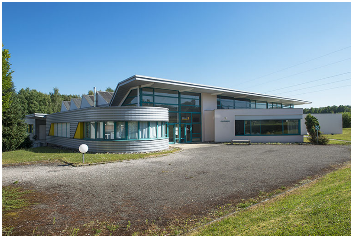
Détail des façades sud-ouest du bâtiment de plasturgie. (ex-Léger)