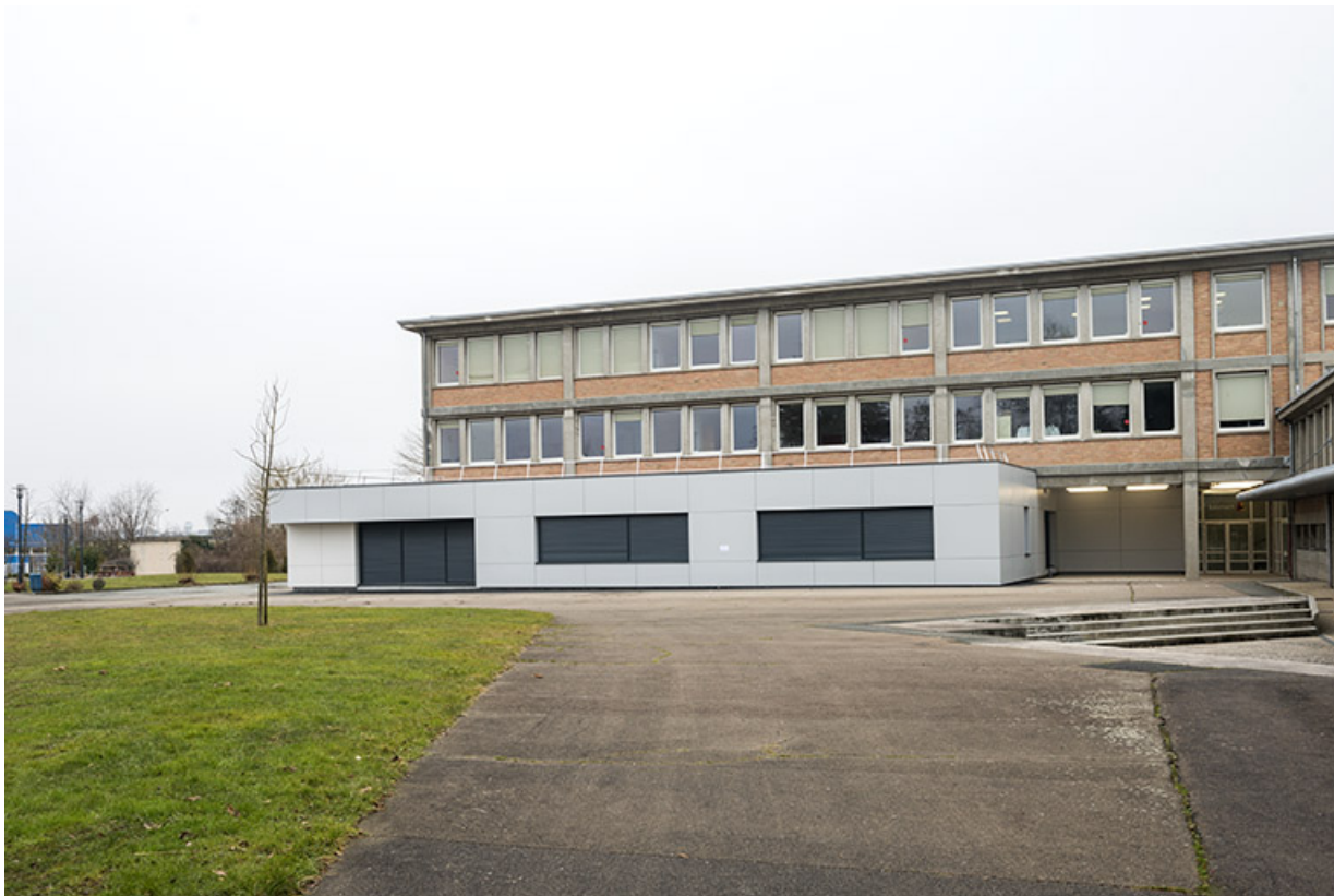
La cour, les façades antérieures et le préau de l'externat après les travaux. (ex-Léger)