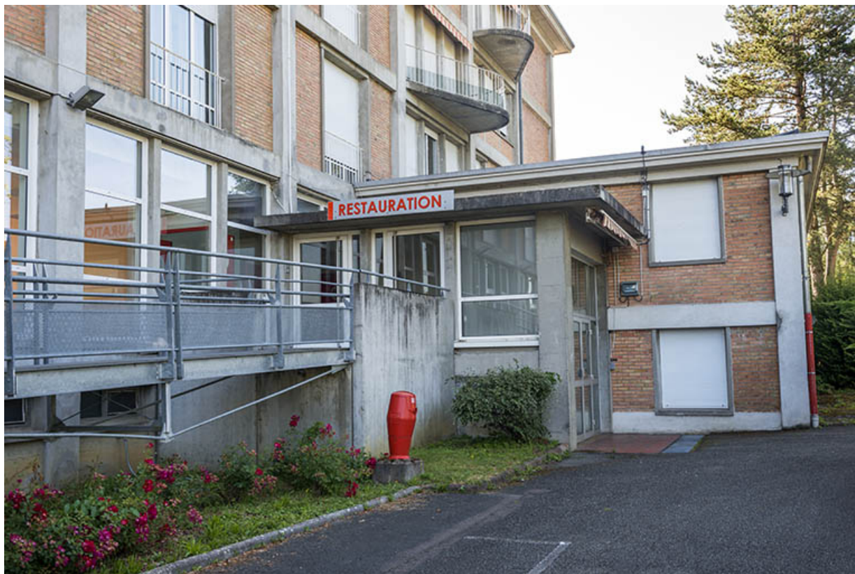
Entrée de la restauration sur la façade ouest du bâtiment d'internat, logement, restauration. (ex-Léger) 25, Audincourt, 6 rue René Girardot