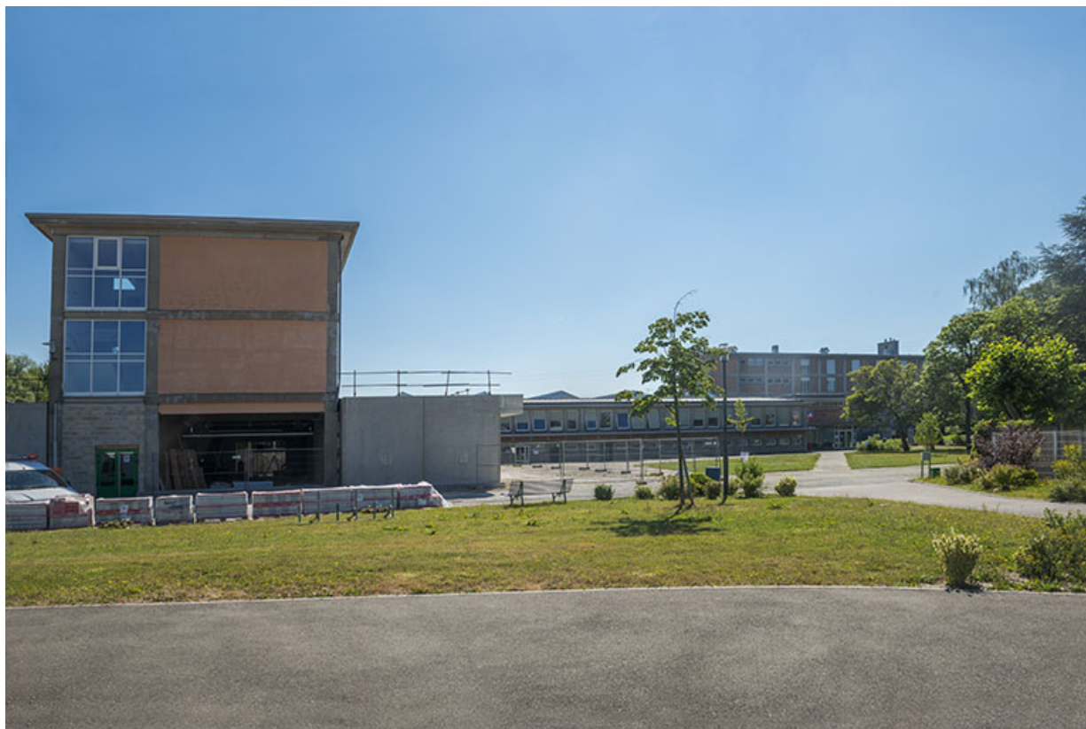
Vue d'ensemble de la partie antérieure et pignon ouest du bâtiment d'externat. (ex-Léger) 25, Audincourt, 6 rue René Girardot