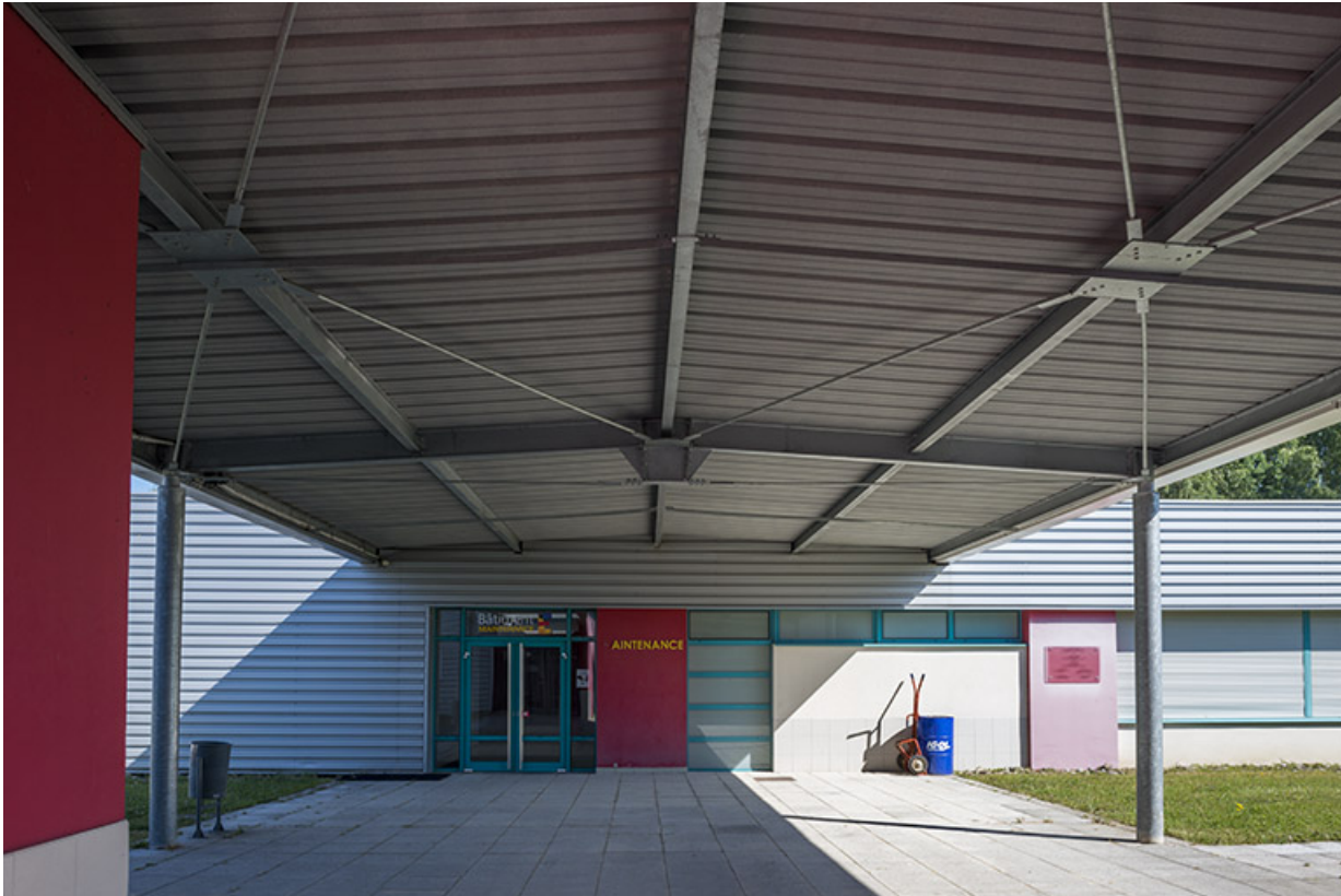
Sous la passerelle entre les ateliers de maintenance et de plasturgie. (ex-Léger)