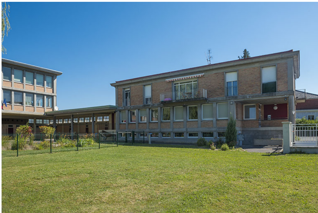
Façade antérieure ouest du bâtiment d'administration logement. (ex-Garnier) 25, Audincourt, 6 rue René Girardot