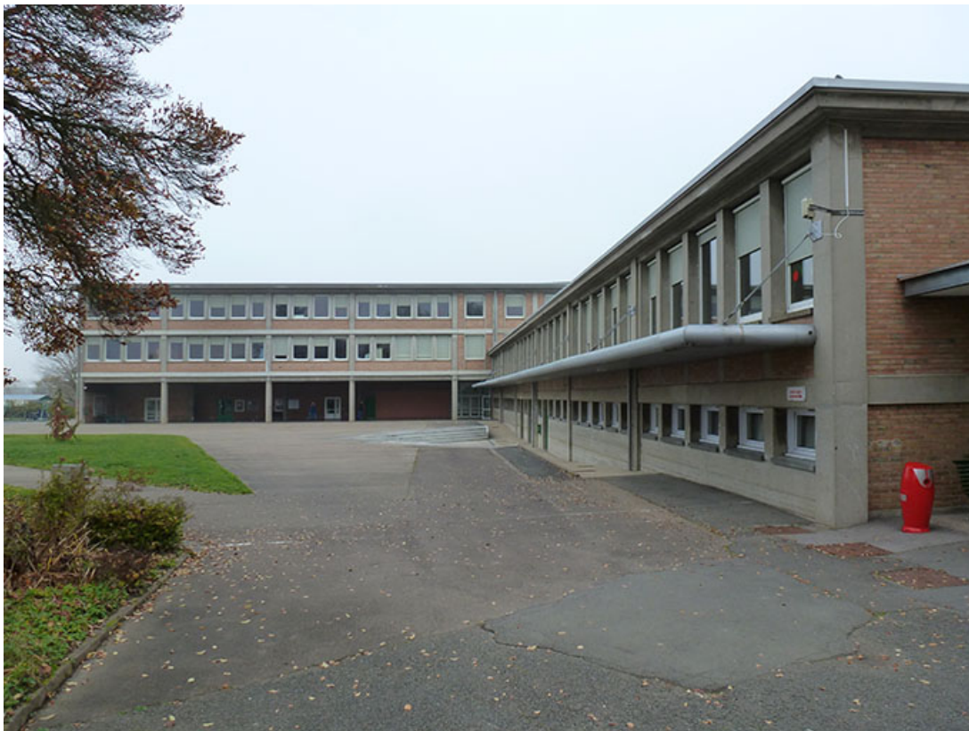
Audincourt, lycée professionnel Nelson Mandela : la cour, les façades antérieures et le préau de l'externat avant les travaux.