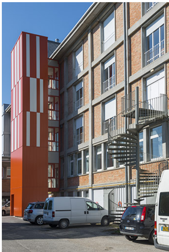
Détail de la face postérieure du bâtiment d'internat, logement, restauration. (ex-Léger) 25, Audincourt, 6 rue René Girardot