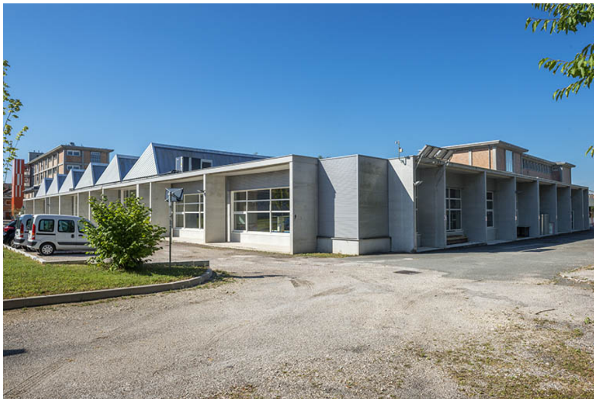
Angle nord-est du bâtiment des ateliers et de l'administration. (ex-Léger)