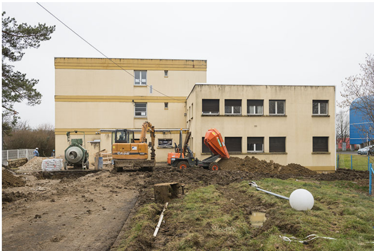
Face sud du bâtiment antérieurement affecté à usage d'externat, internat, logement. (ex Garnier) 25, Audincourt, 6 rue René Girardot