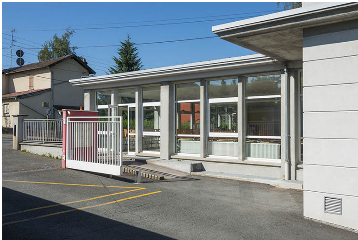
Façade est du bâtiment d'internat, logement, restauration à l'entrée 45 rue des cantons. 25, Audincourt, 6 rue René Girardot