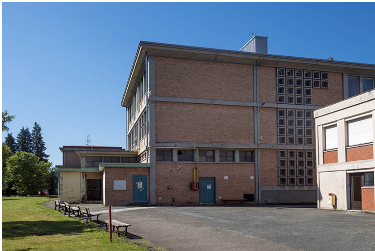
Façades antérieures (nord) du bâtiment d'externat. (ex-Garnier)