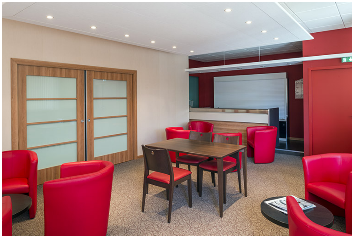
Salles du restaurant d'application.