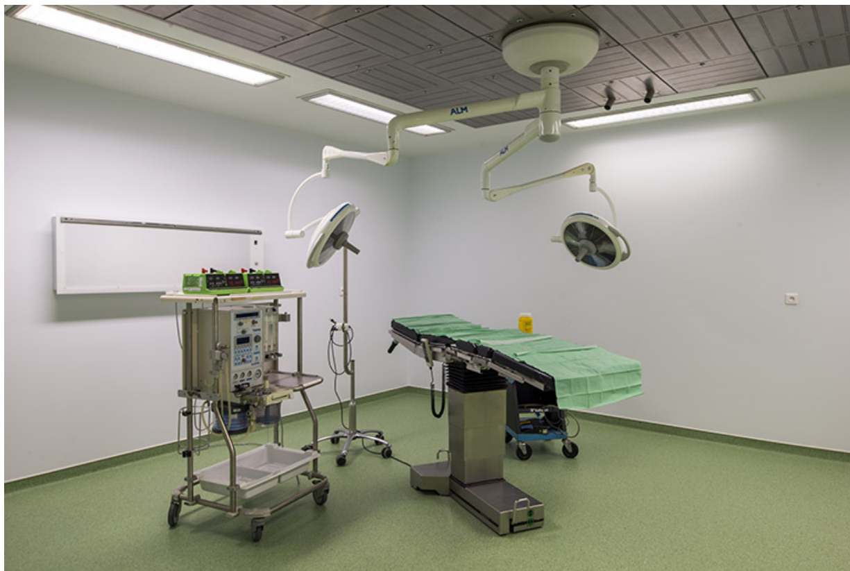
Élément - bloc opératoire - de l'hôpital pédagogique.