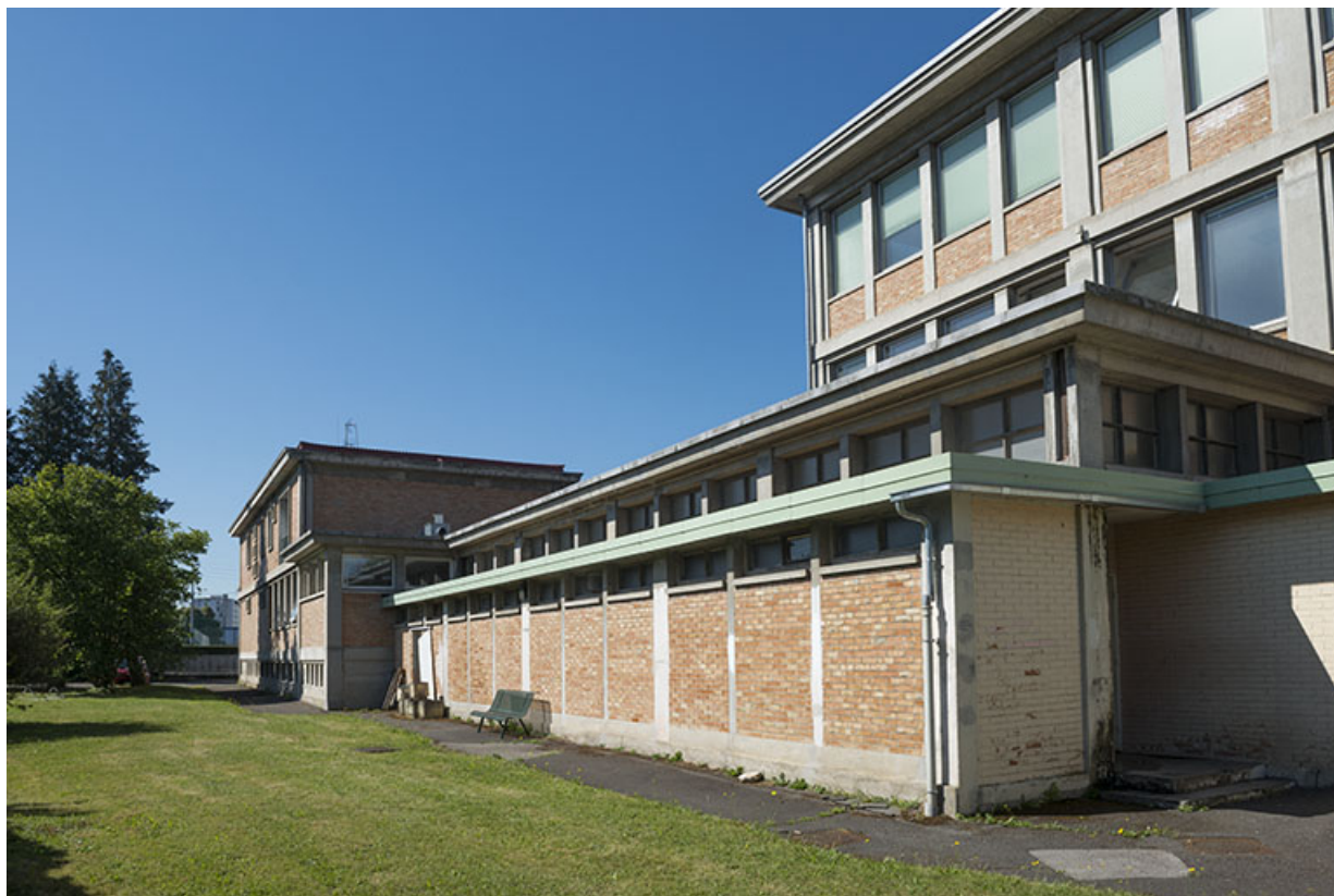
Angle nord est du bâtiment d'externat, transformateur, chaufferie (ex-Garnier). 25, Audincourt, 6 rue René Girardot