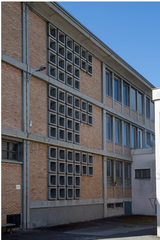
Détail de la façade nord du bâtiment d'externat.(ex-Garnier) 25, Audincourt, 6 rue René Girardot