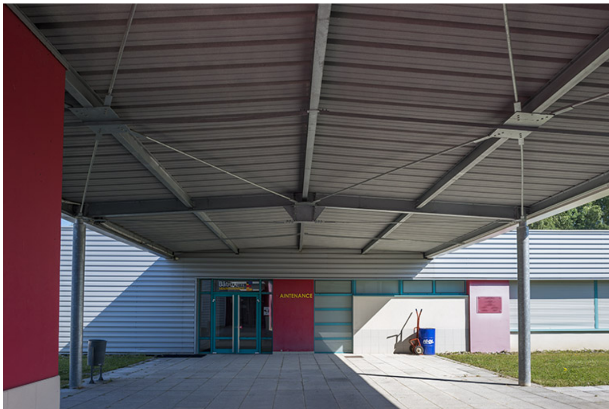
Sous la passerelle entre les ateliers de maintenance et de plasturgie. (ex-Léger)