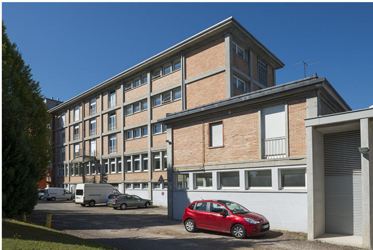
Façades postérieures du bâtiment d'internat, logement, restauration. (ex-Léger) 25, Audincourt, 6 rue René Girardot