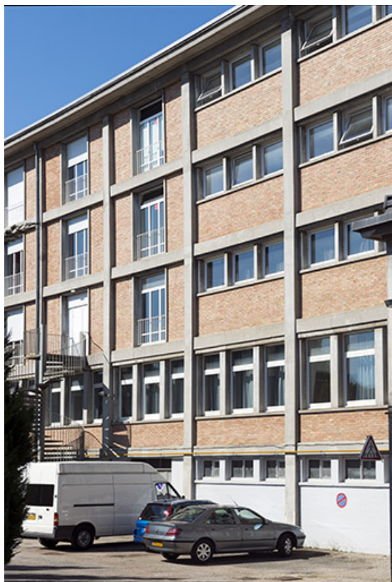
Détail de la façade postérieure du bâtiment d'internat, logement, restauration. (ex-Léger) 25, Audincourt, 6 rue René Girardot