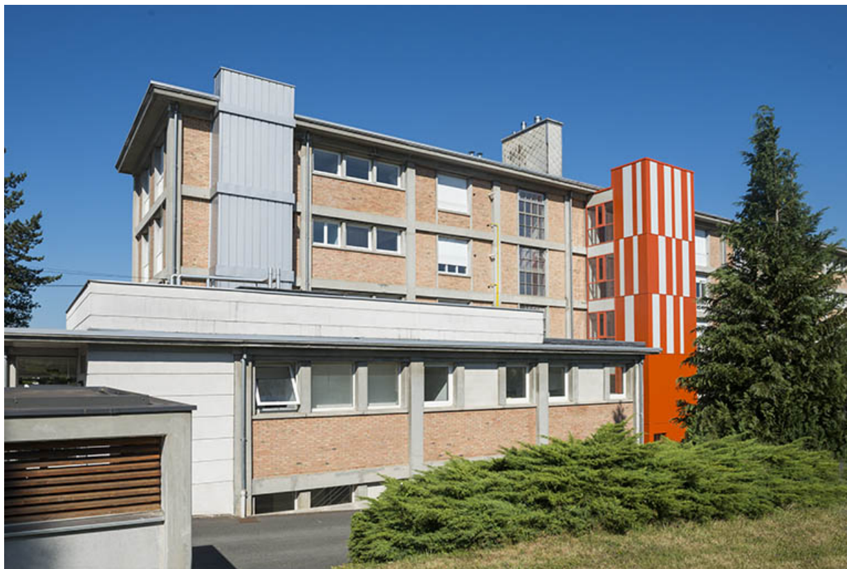
Façade postérieure du bâtiment d'internat, logement, restauration. (ex-Léger) 25, Audincourt, 6 rue René Girardot