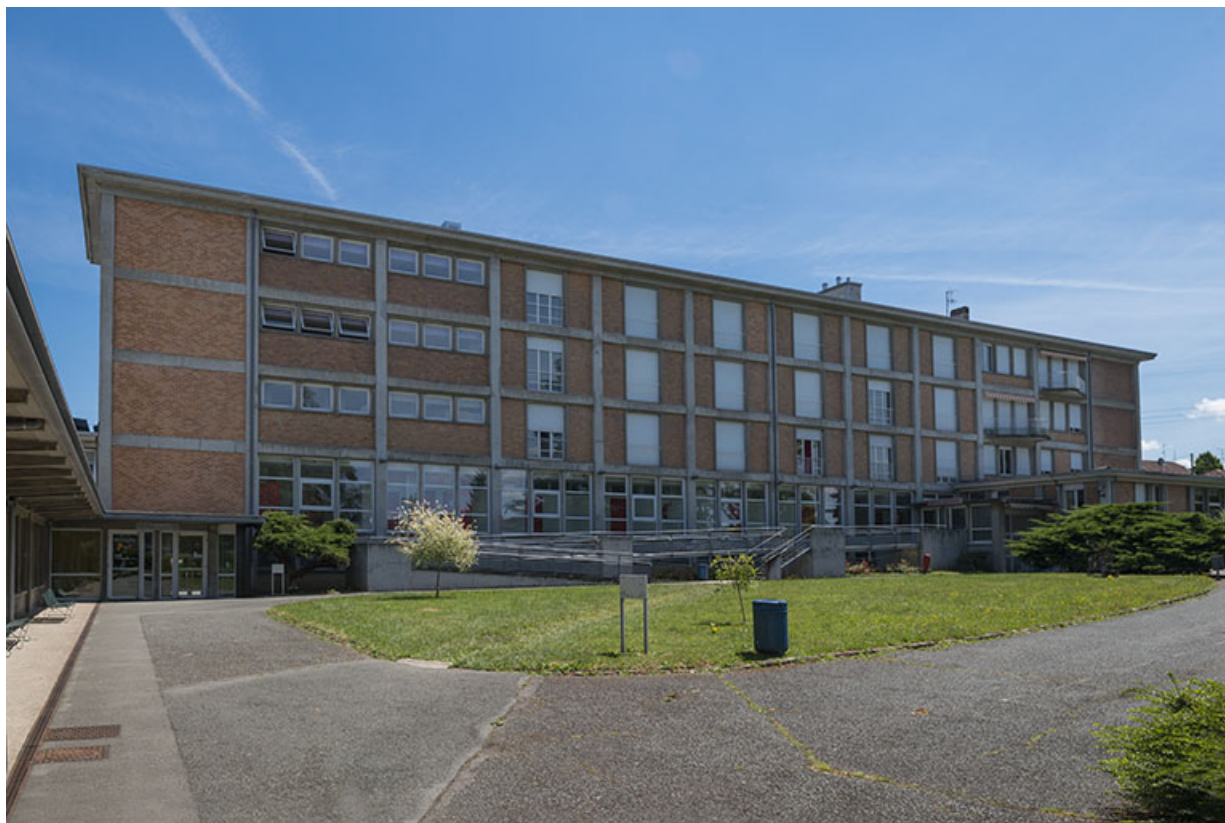
Façade ouest du bâtiment d'internat, logement, restauration. (ex.Léger) 25, Audincourt, 6 rue René Girardot