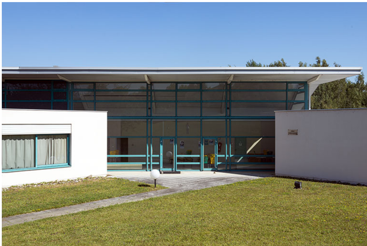
Détail façades sud des bâtiments de plasturgie.(ex-Léger)