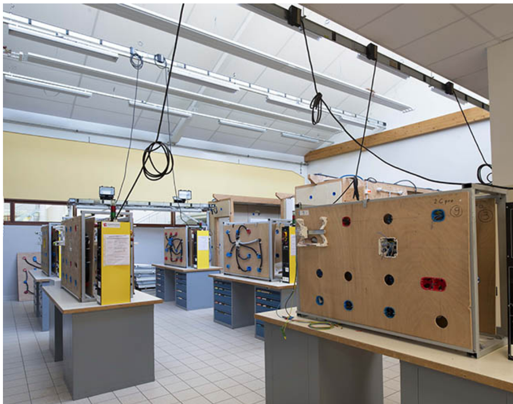
Détail d'atelier sous sheds.(ex-Leger)