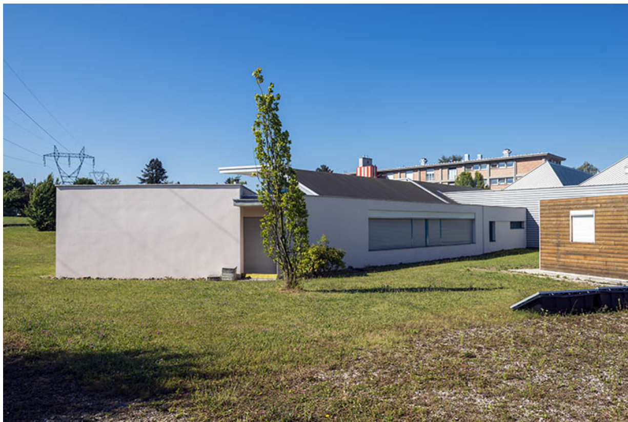
Façade postérieure nord de la plasturgie. (ex-Léger)