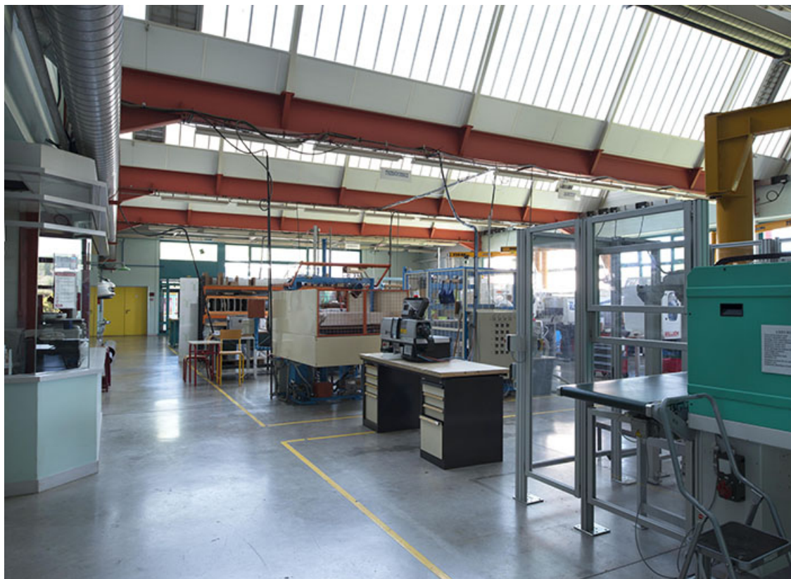
Détail d'atelier sous sheds. (ex.Léger) 25, Audincourt, 6 rue René Girardot