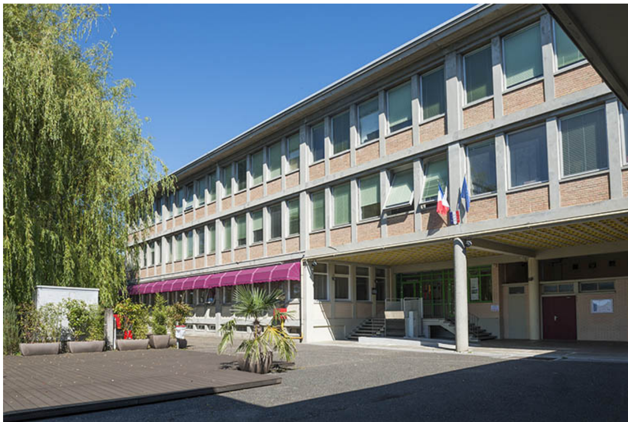
Cour intérieure et façade ouest du bâtiment d'externat. (ex-Garnier) 25, Audincourt, 6 rue René Girardot