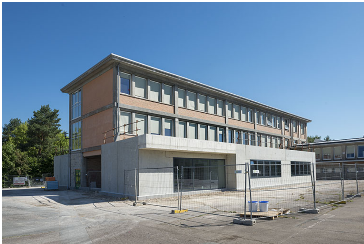
Pignon ouest et face antérieure de l'externat (ex-Léger) durant les travaux. 25, Audincourt, 6 rue René Girardot