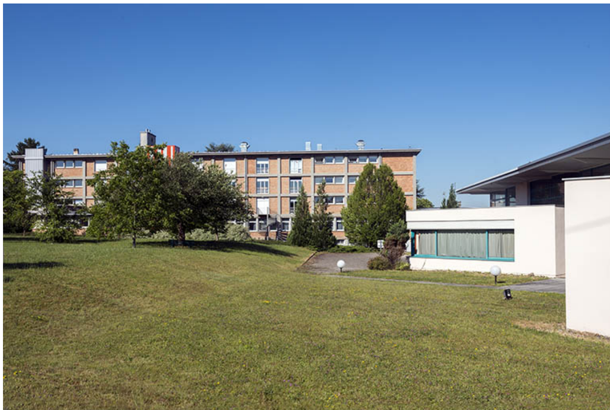
Façade postérieure de l'aile nord du bâtiment d'internat, logement, restauration et détail façades sud des bâtiments de plasturgie. (ex-Léger)