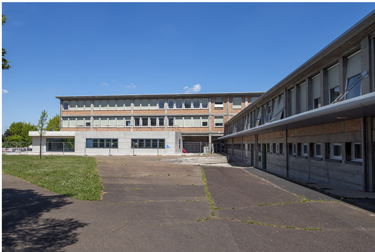
Façades antérieures des bâtiments d'externat, des ateliers et de l'administration. (ex.Léger)