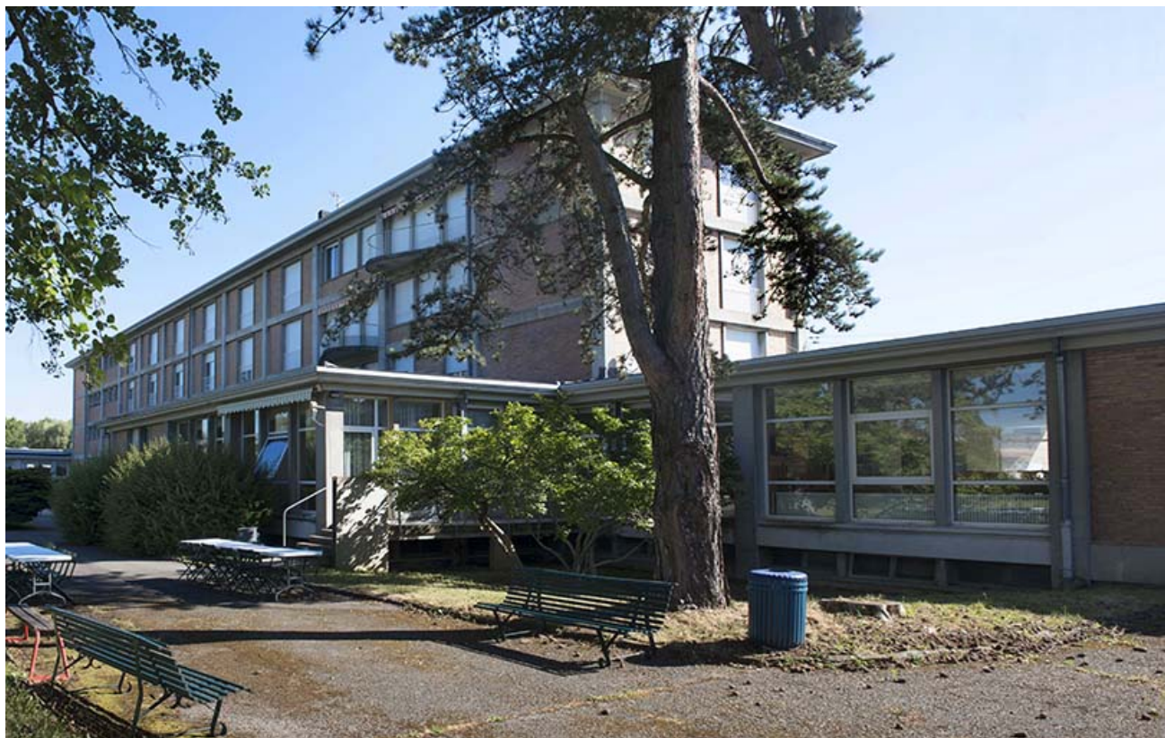
Détail de l'aile sud du bâtiment restauration et salles à manger en rez-de-chaussée. (ex-Léger) 25, Audincourt, 6 rue René Girardot