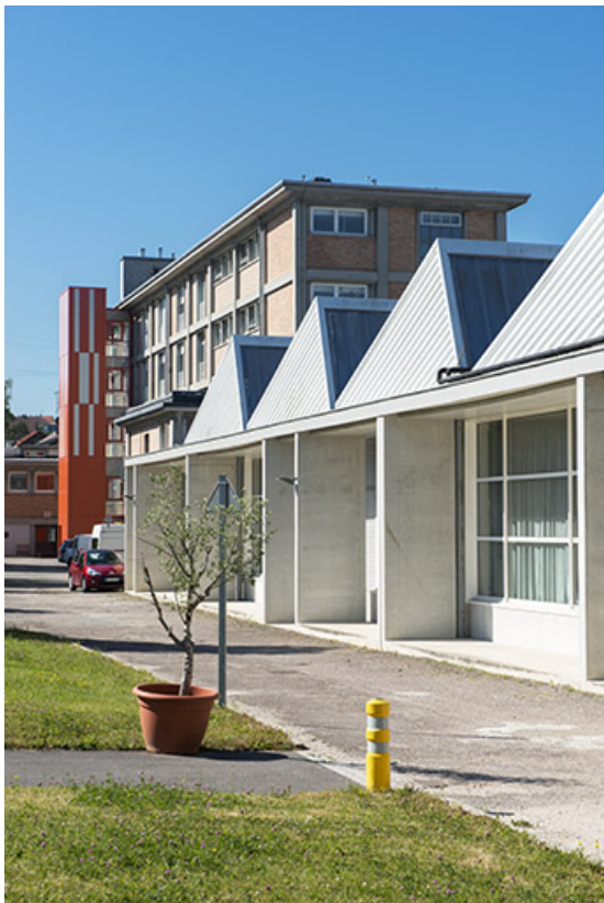
Façade postérieure est du bâtiment des ateliers et de l'administration. (ex-Léger) 25, Audincourt, 6 rue René Girardot