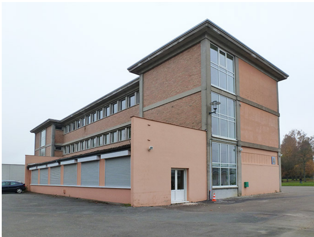
Angle nord-ouest et face postérieure du bâtiment d'externat.(ex-Léger)