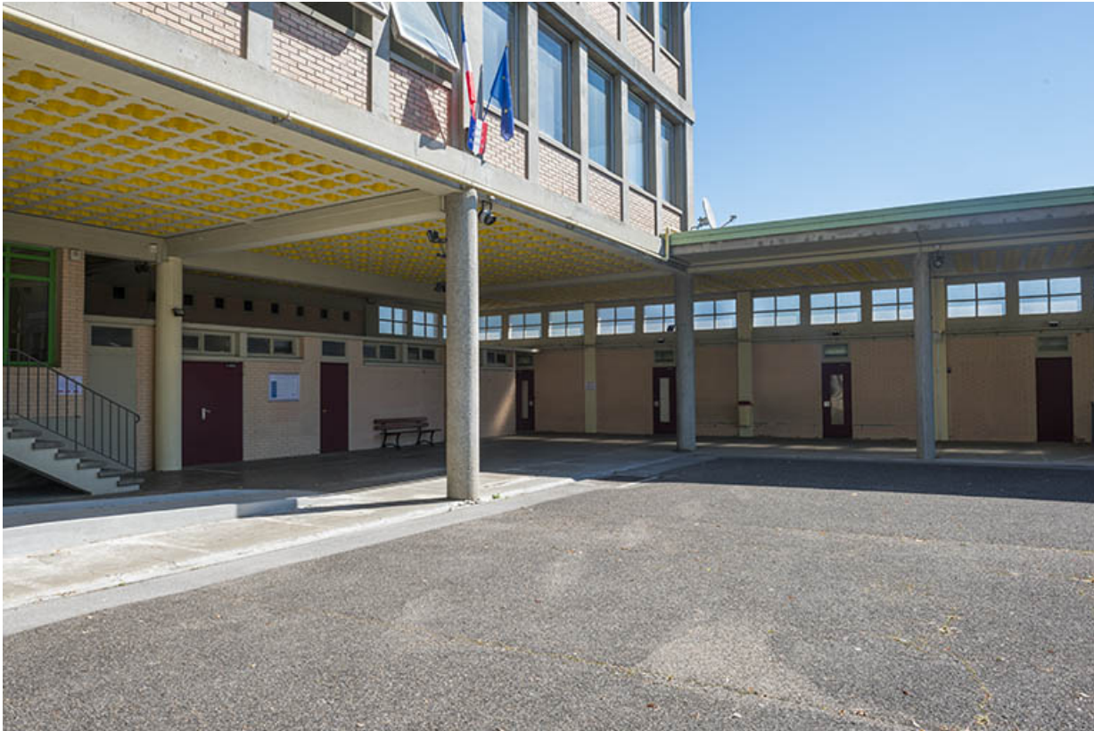
Préau et cour devant le bâtiment d'externat. (ex-Garnier)