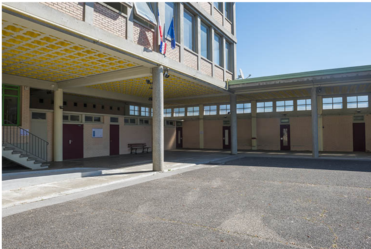
Préau et cour devant le bâtiment d'externat. (ex-Garnier)