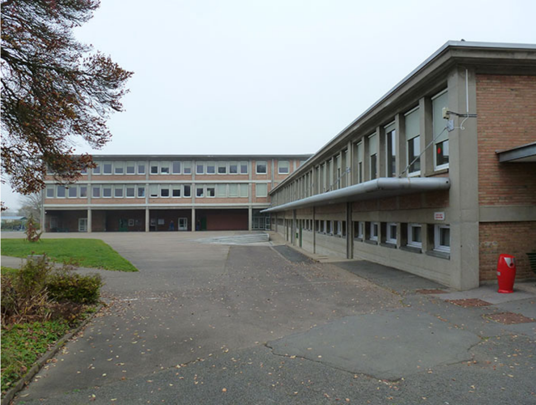
Audincourt, lycée professionnel Nelson Mandela : la cour, les façades antérieures et le préau de l'externat avant les travaux.