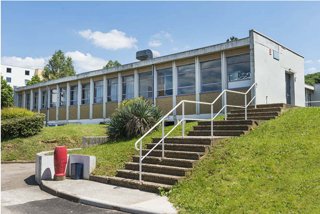
Escalier indépendant et façade nord du bâtiment de restauration.