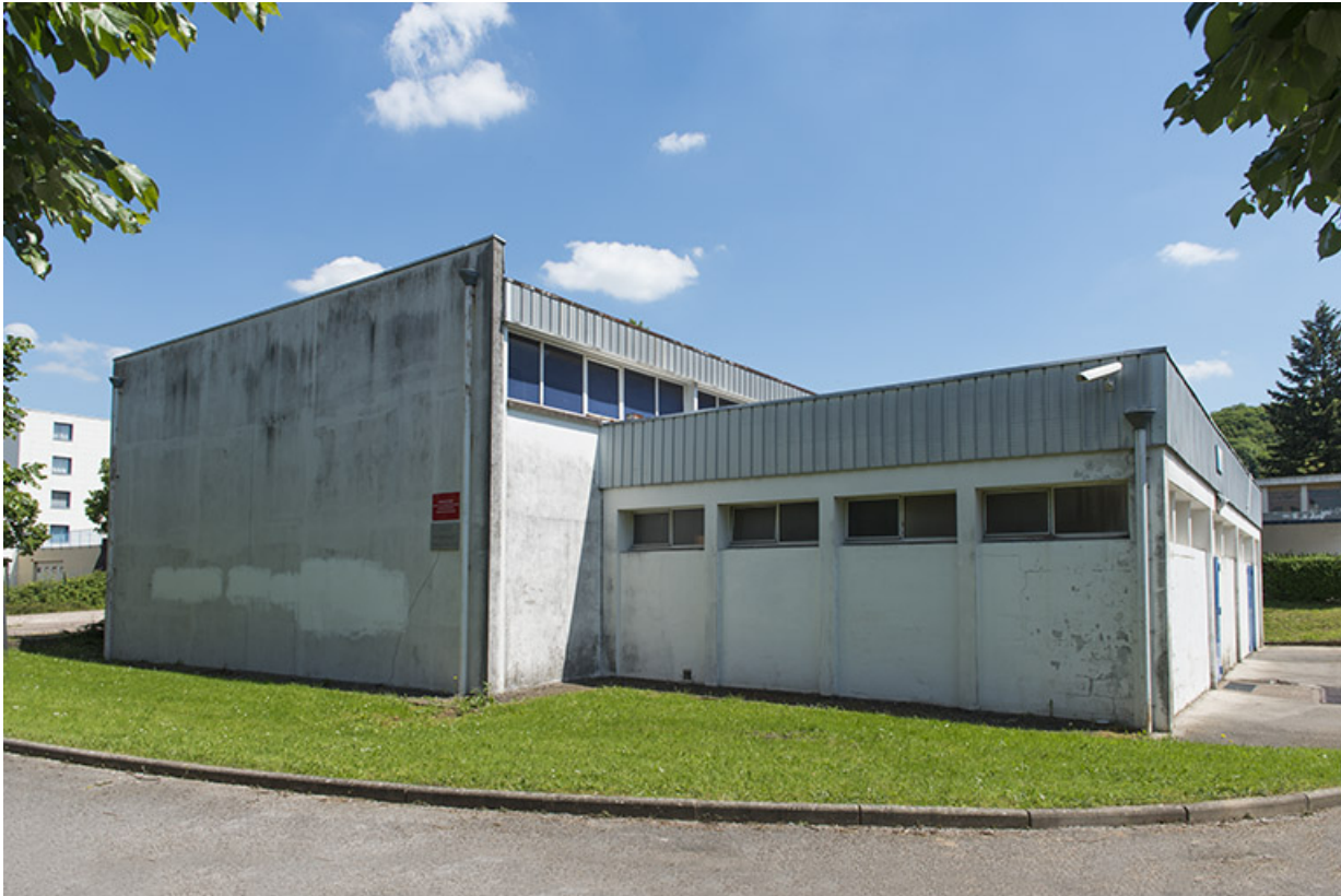
Angle nord du gymnase.