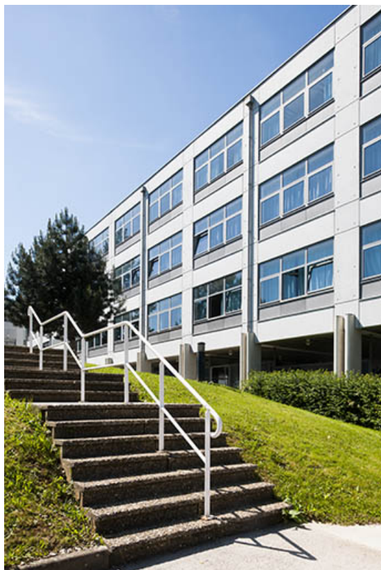
Détail de la façade postérieure est du bâtiment d'enseignement professionnel. 25, Besançon, 13 rue Goya