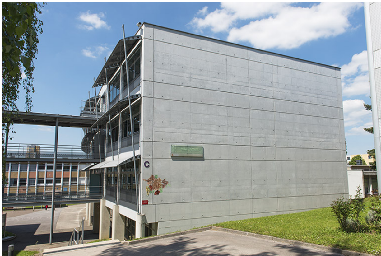
Angle sud-ouest et pignon sud du bâtiment d'enseignement professionnel. 25, Besançon, 13 rue Goya