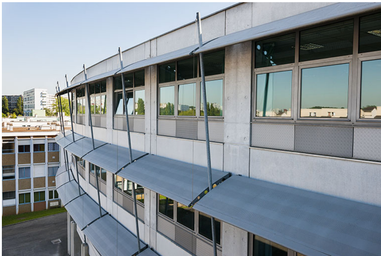
Détail de la façade ouest du bâtiment d'enseignement professionnel. 25, Besançon, 13 rue Goya