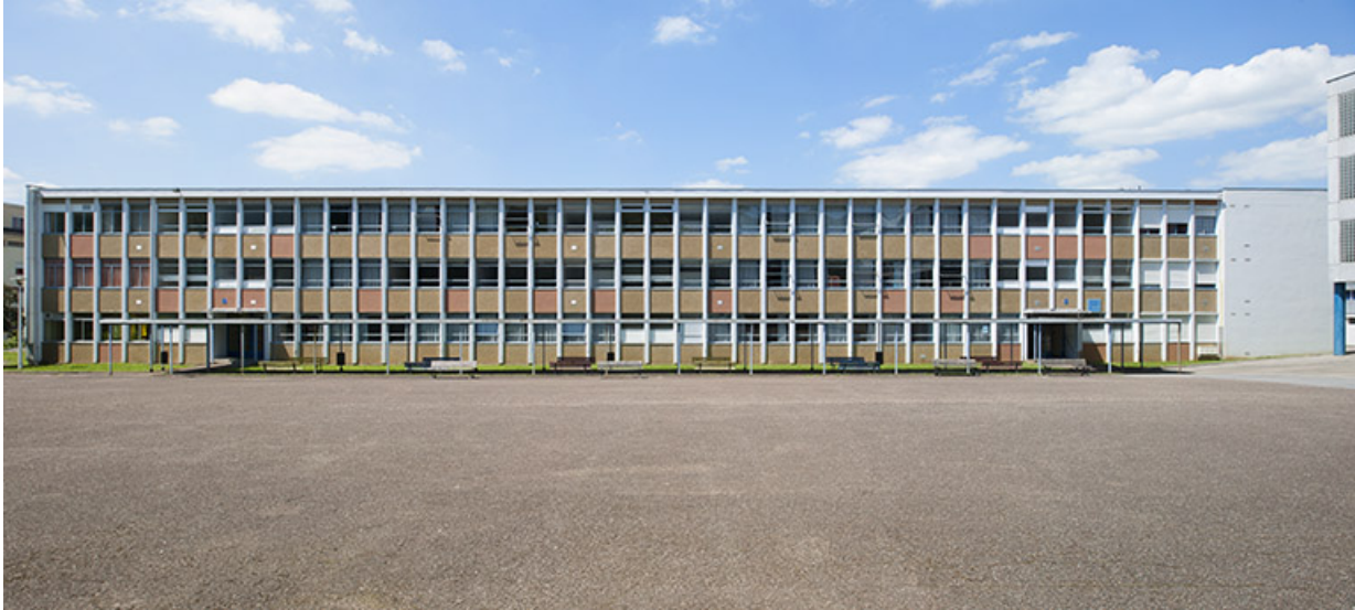
Besançon, lycée Tristan Bernard : façade antérieure sud du bâtiment d'internat, externat, logements, infirmerie. 25, Besançon, 13 rue Goya