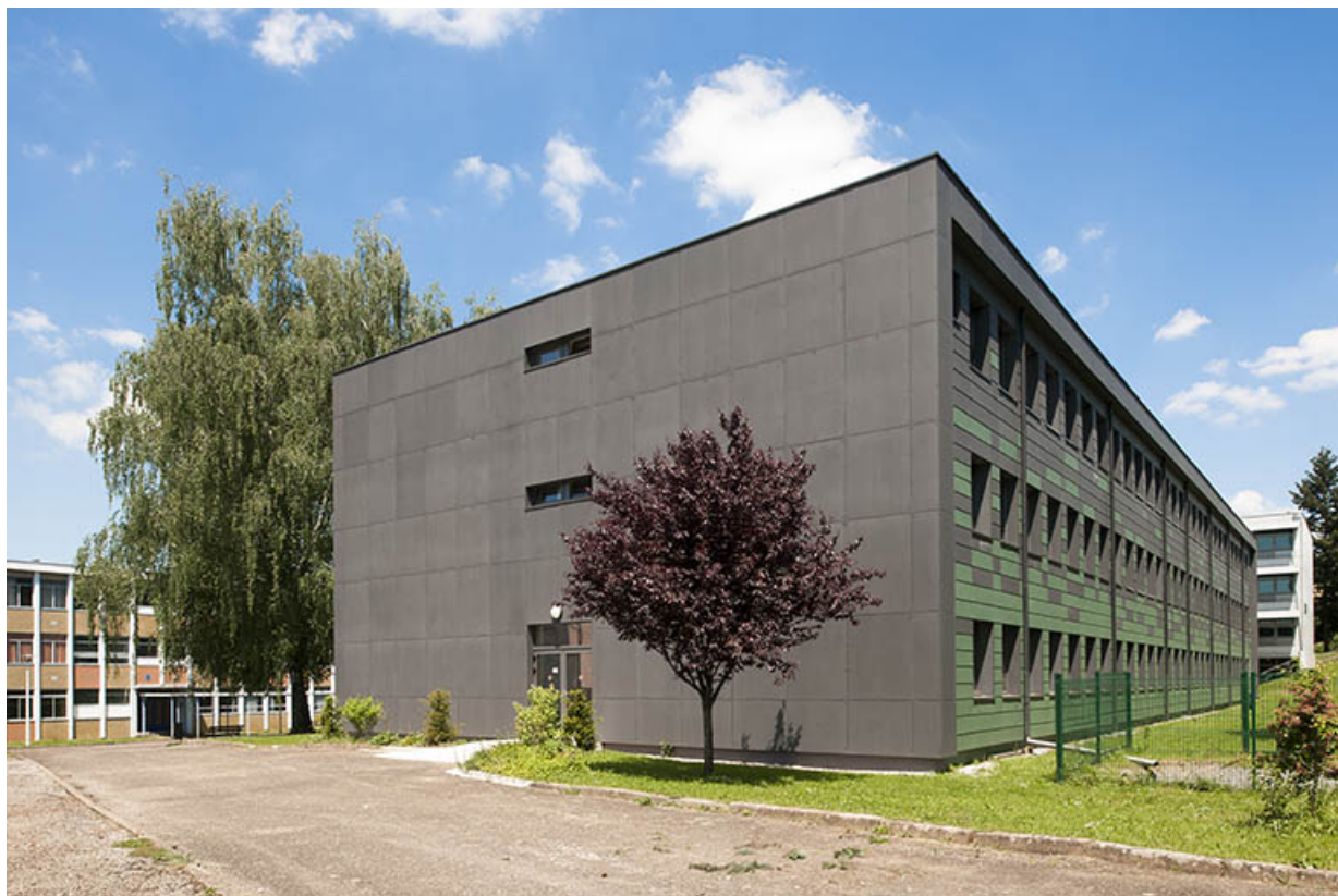
Façade sud et pignon ouest de l'externat.