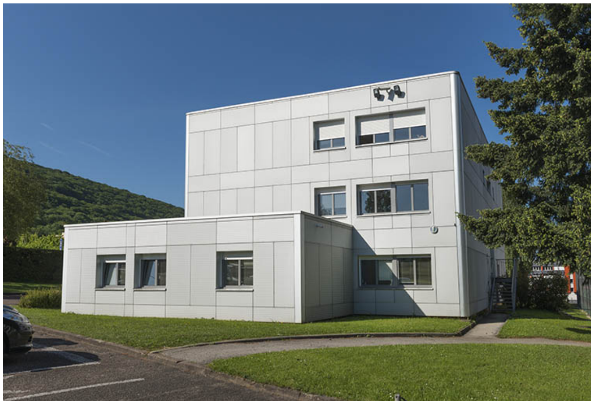
Détail de la façade est du bâtiment d'administration et logements.