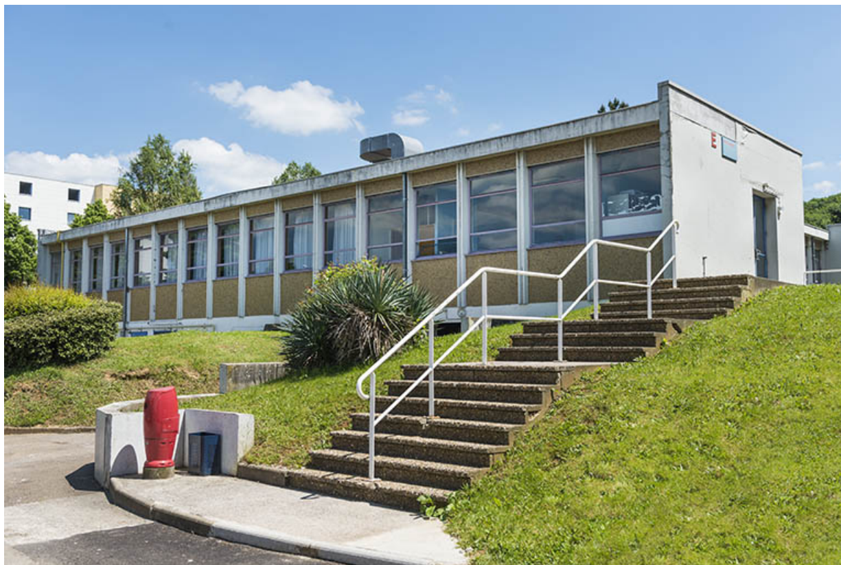
Escalier indépendant et façade nord du bâtiment de restauration.