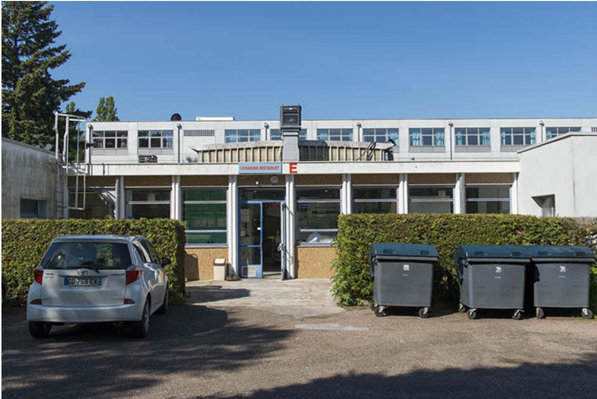
Façade postérieure est du bâtiment de restauration.