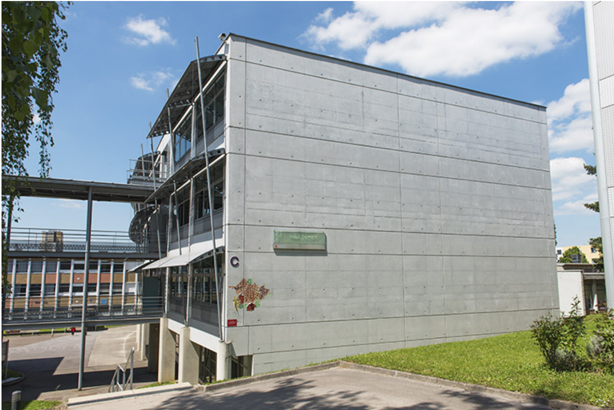
Angle sud-ouest et pignon sud du bâtiment d'enseignement professionnel. 25, Besançon, 13 rue Goya