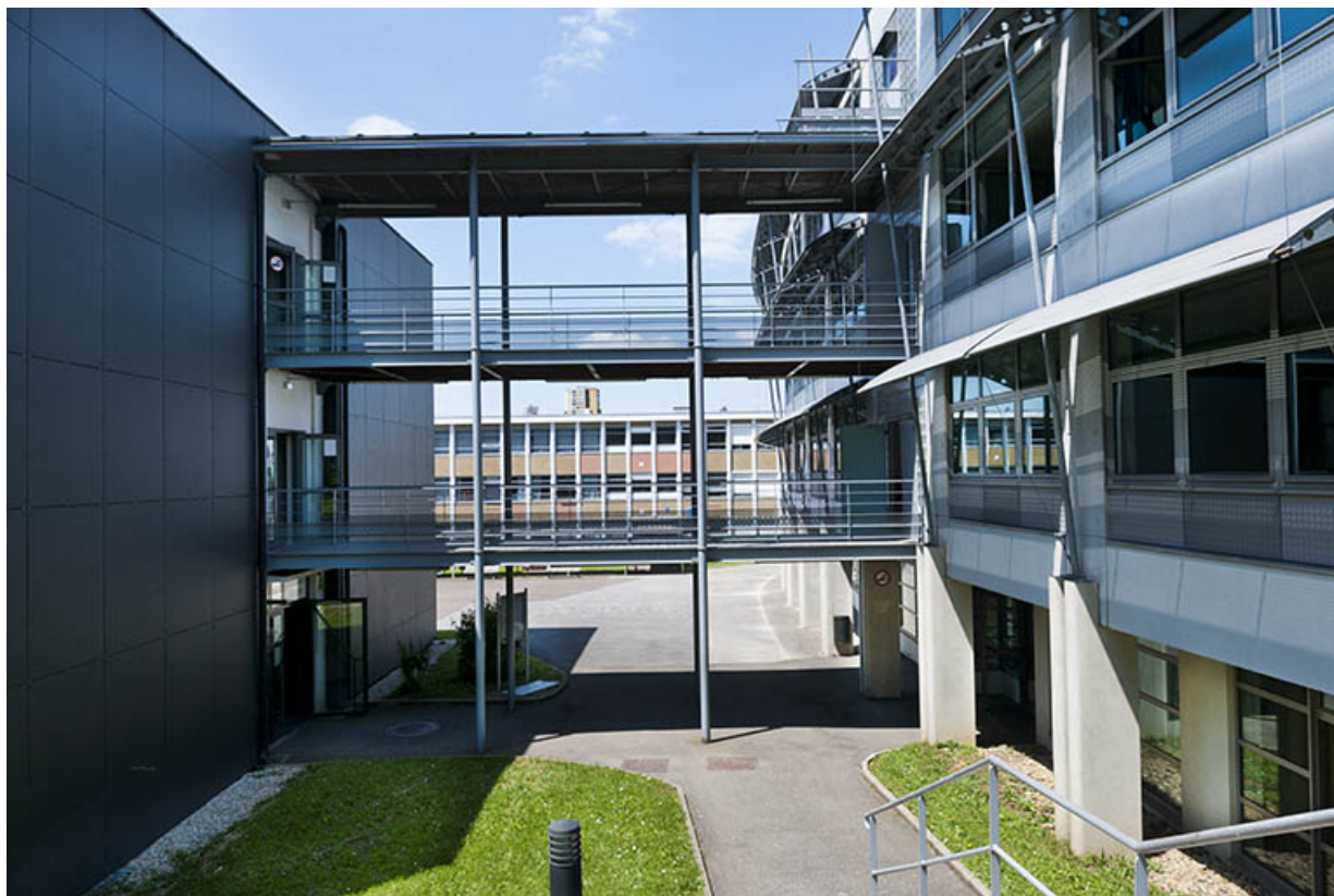
Pignon est de l'externat, façade ouest du bâtiment d'enseignement professionnel et passerelle. 25, Besançon, 13 rue Goya