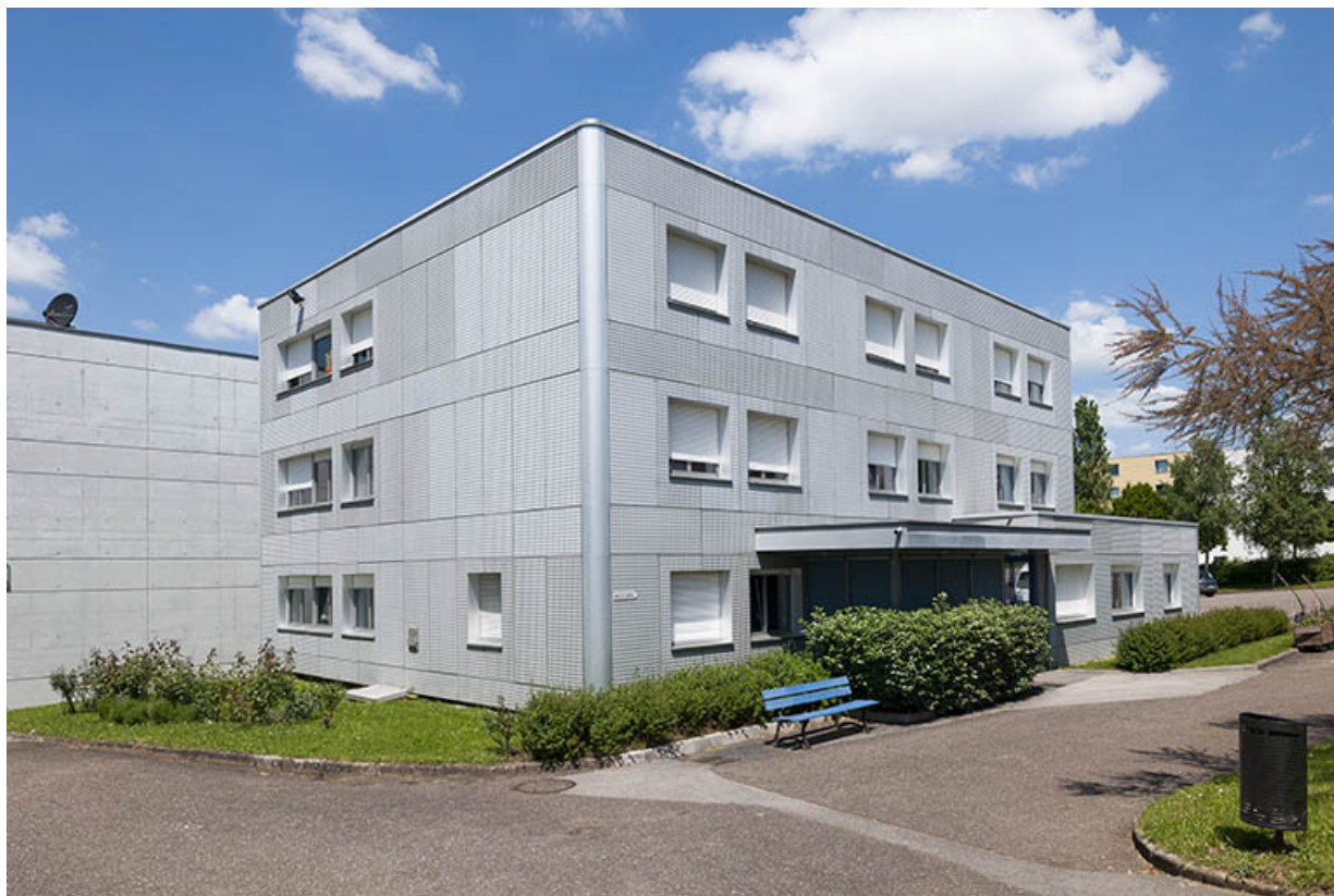
Entrée, angle sud et façade antérieure (sud) du bâtiment d'administration et logements. 25, Besançon, 13 rue Goya