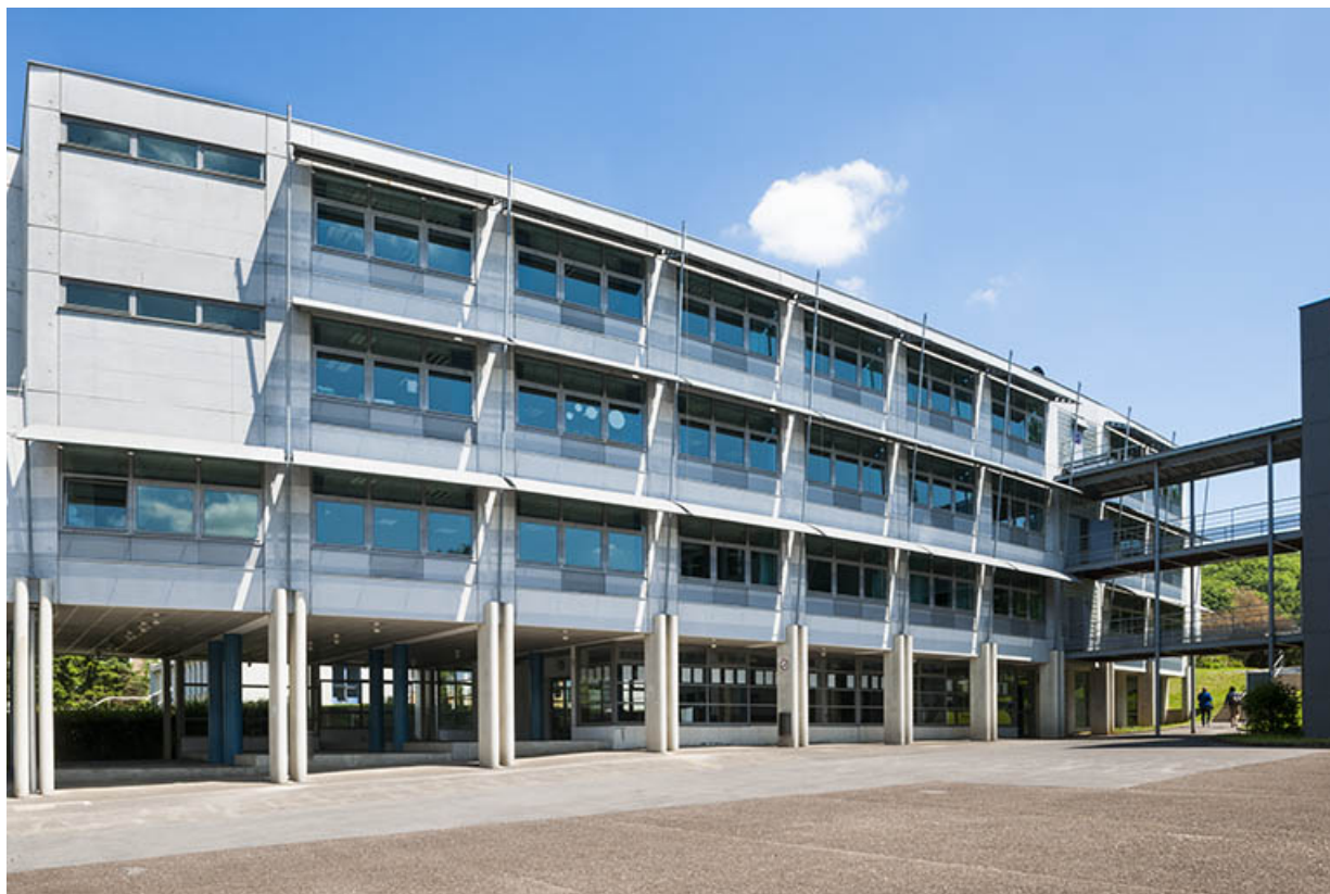
Façade ouest du bâtiment d'enseignement professionnel et passerelle. 25, Besançon, 13 rue Goya