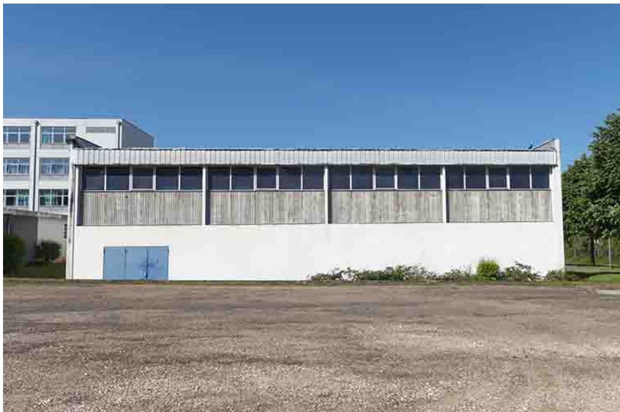
Façade nord-est du gymnase.