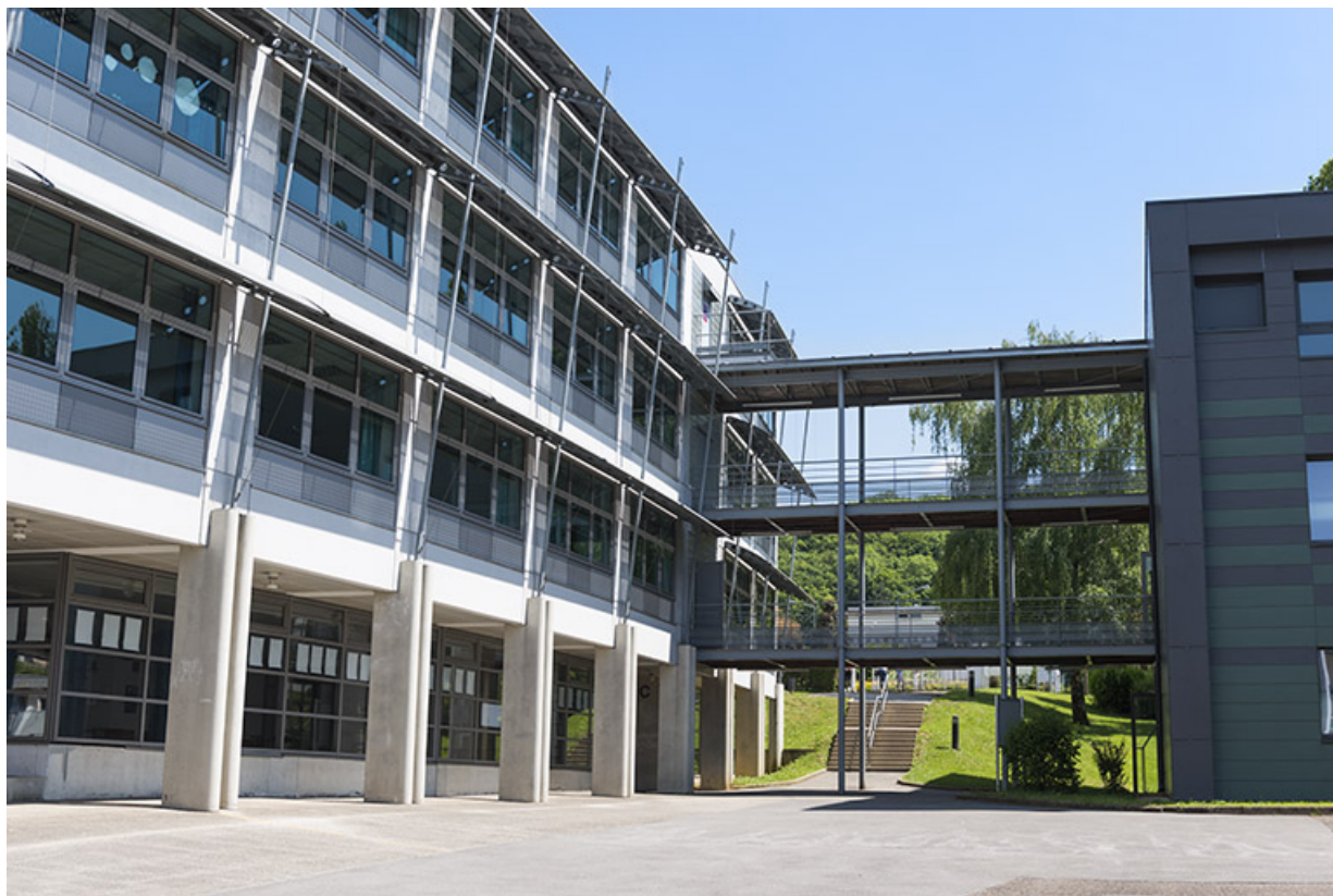
Façade ouest du bâtiment d'enseignement professionnel et côté nord de la passerelle. 25, Besançon, 13 rue Goya