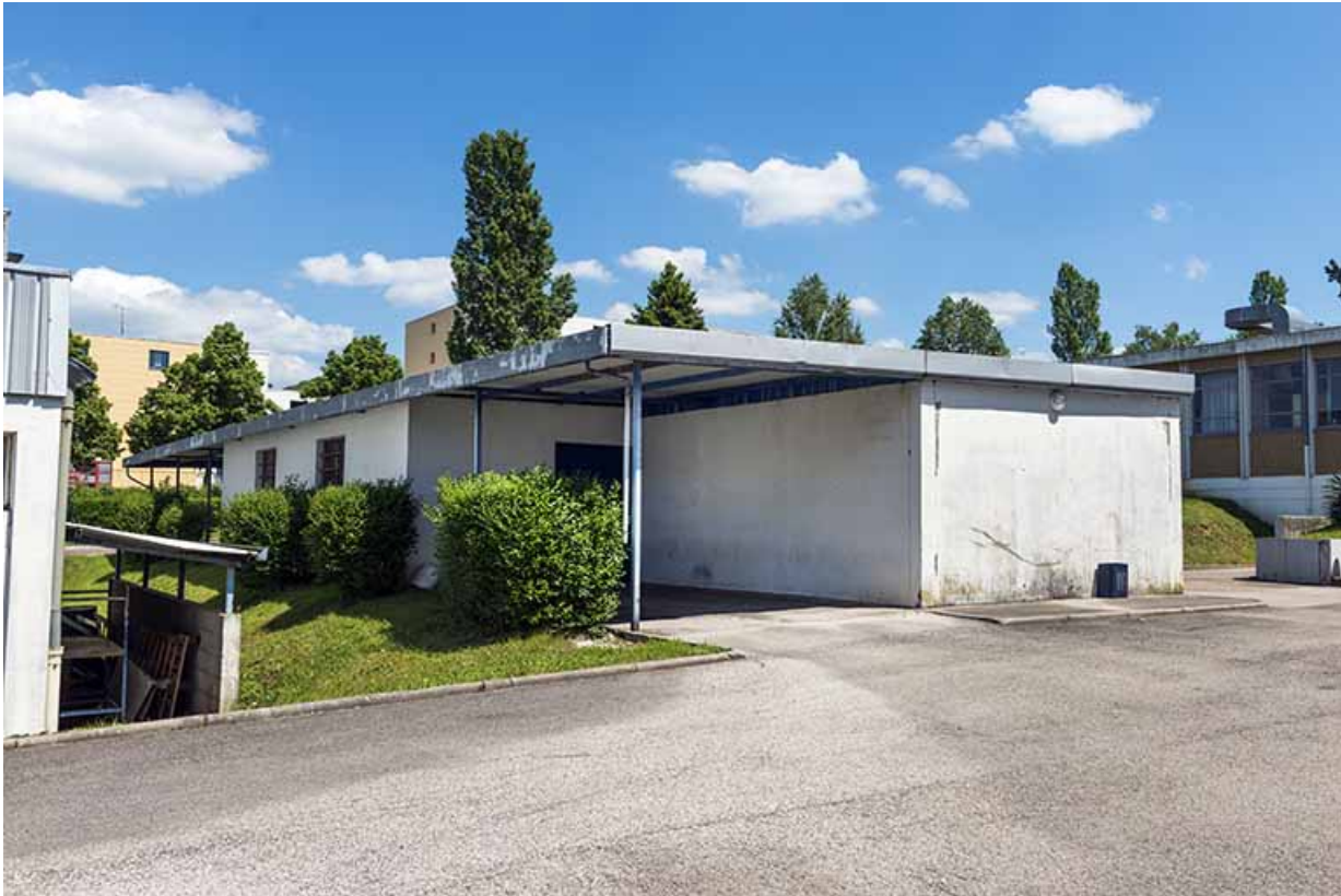
Bâtiment abritant le garage et le local jardin depuis le nord-ouest.