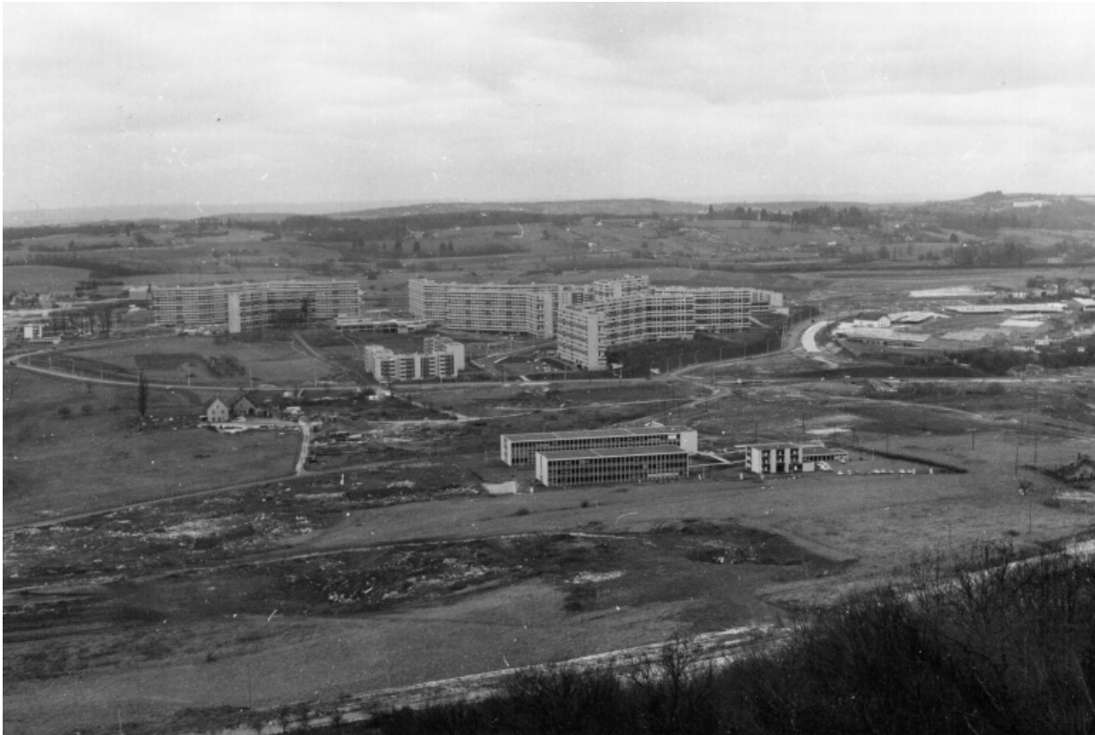
Le quartier de Planoise au moment de la construction du lycée, au premier plan. 25, Besançon, 13 rue Goya