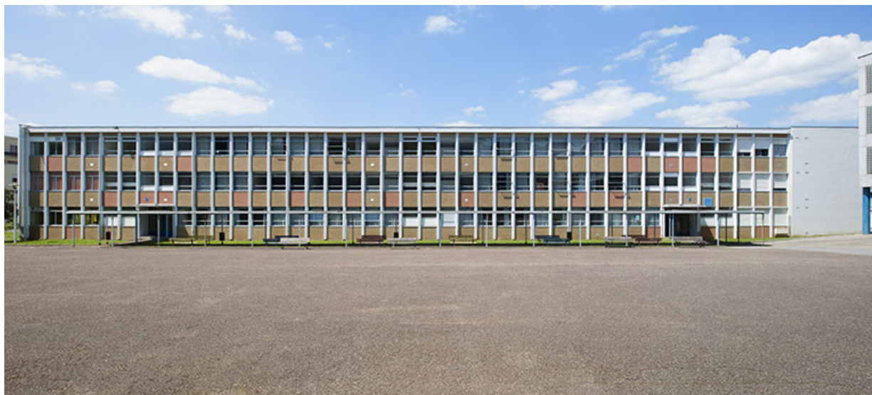
Besançon, lycée Tristan Bernard : façade antérieure sud du bâtiment d'internat, externat, logements, infirmerie. 25, Besançon, 13 rue Goya