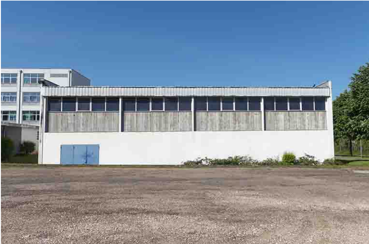
Façade nord-est du gymnase.