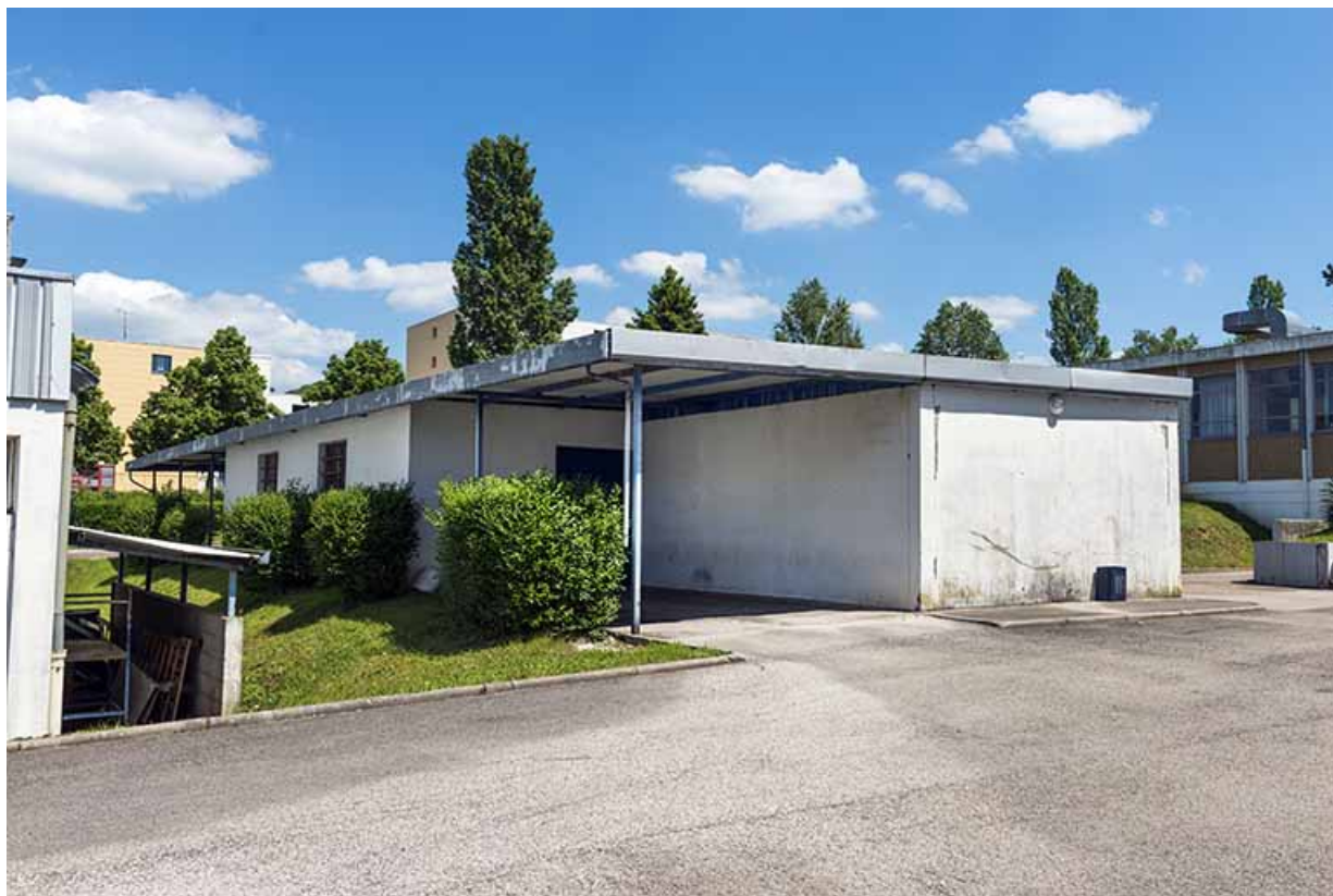
Bâtiment abritant le garage et le local jardin depuis le nord-ouest.