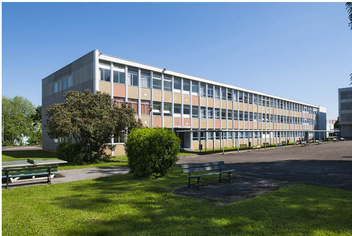
Pignon ouest et façade antérieure sud du bâtiment d'internat, externat, logements, infirmerie depuis la cour. 25, Besançon, 13 rue Goya