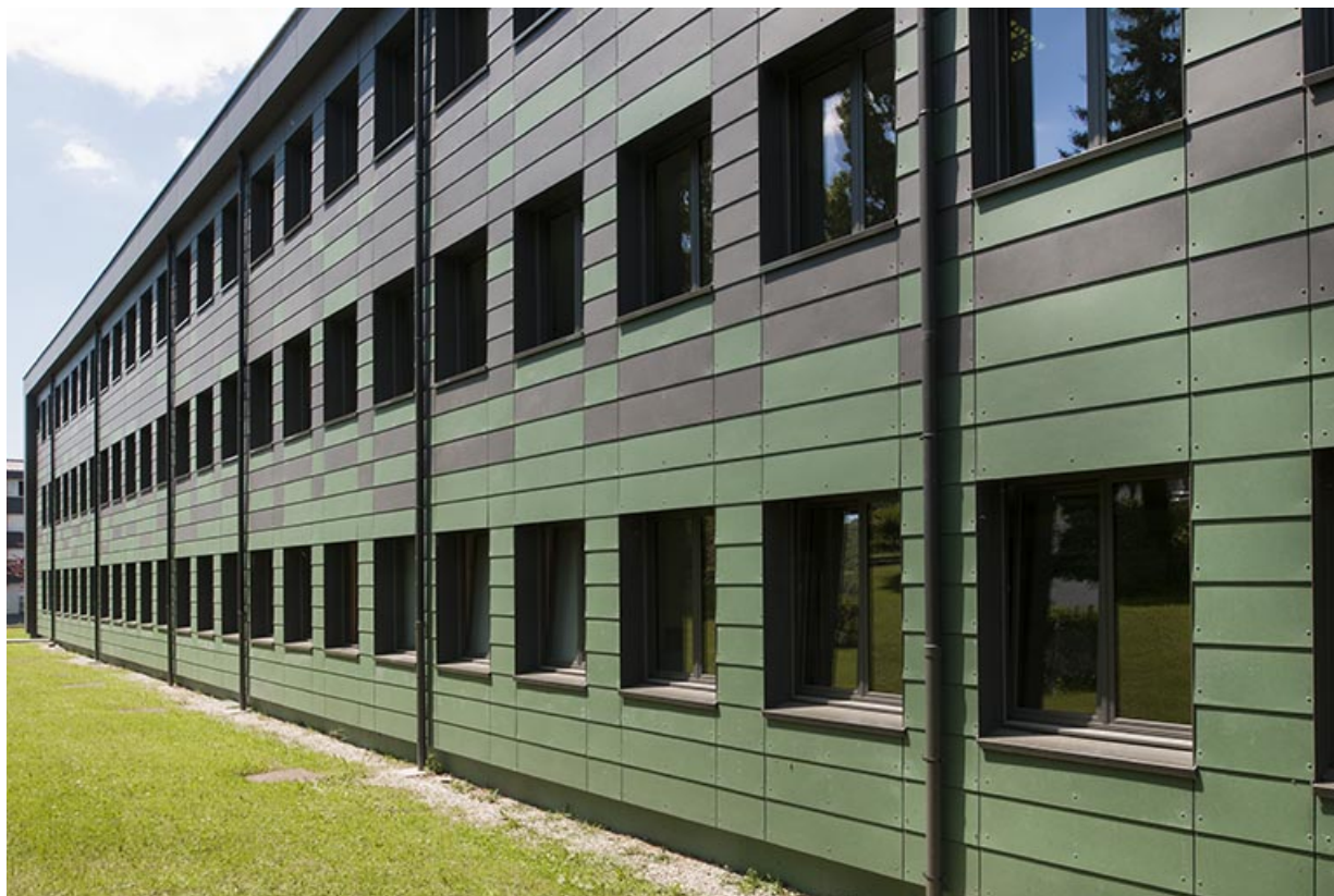
Détail de la façade sud et du pignon est de l'externat.