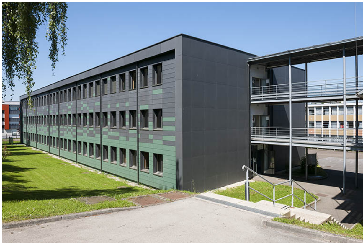
Façade sud et pignon est de l'externat.