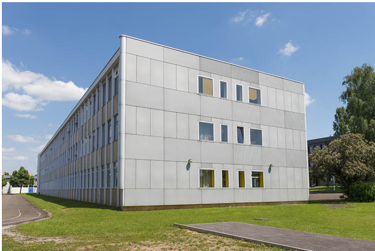
Angle nord-ouest du bâtiment d'internat, externat, logements, infirmerie. 25, Besançon, 13 rue Goya