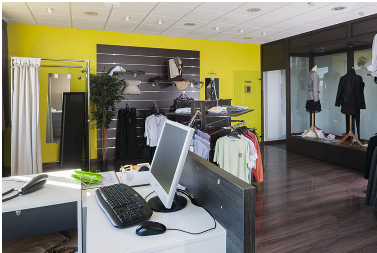
Détail intérieur du magasin pédagogique du bâtiment d'enseignement professionnel. 25, Besançon, 13 rue Goya