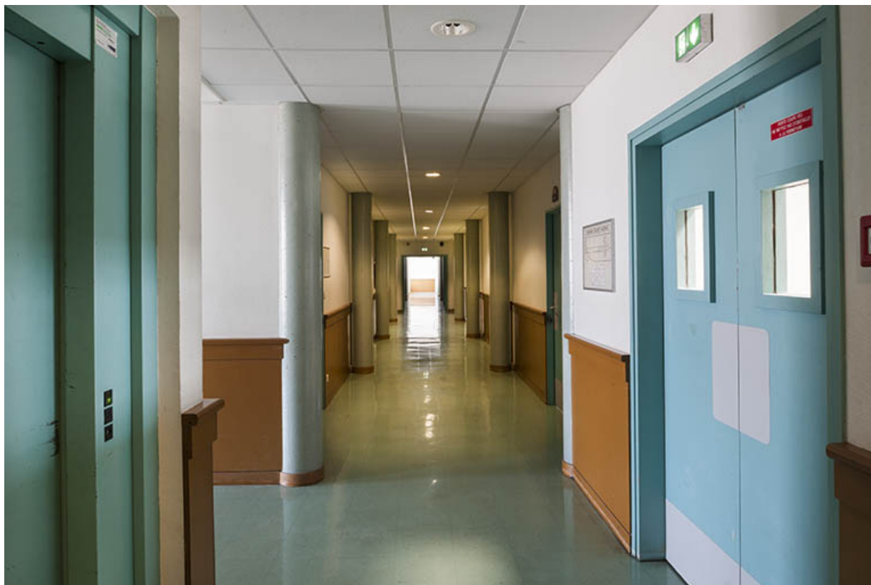
Vue intérieure d'un couloir d'internat.