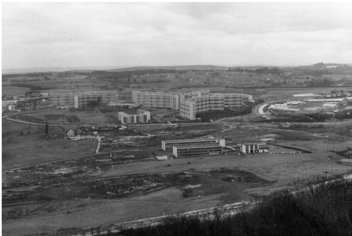
Le quartier de Planoise au moment de la construction du lycée, au premier plan.