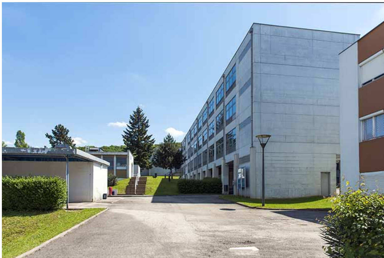
Pignon nord et façade postérieure est du bâtiment d'enseignement professionnel. 25, Besançon, 13 rue Goya