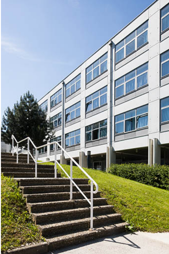
Détail de la façade postérieure est du bâtiment d'enseignement professionnel. 25, Besançon, 13 rue Goya