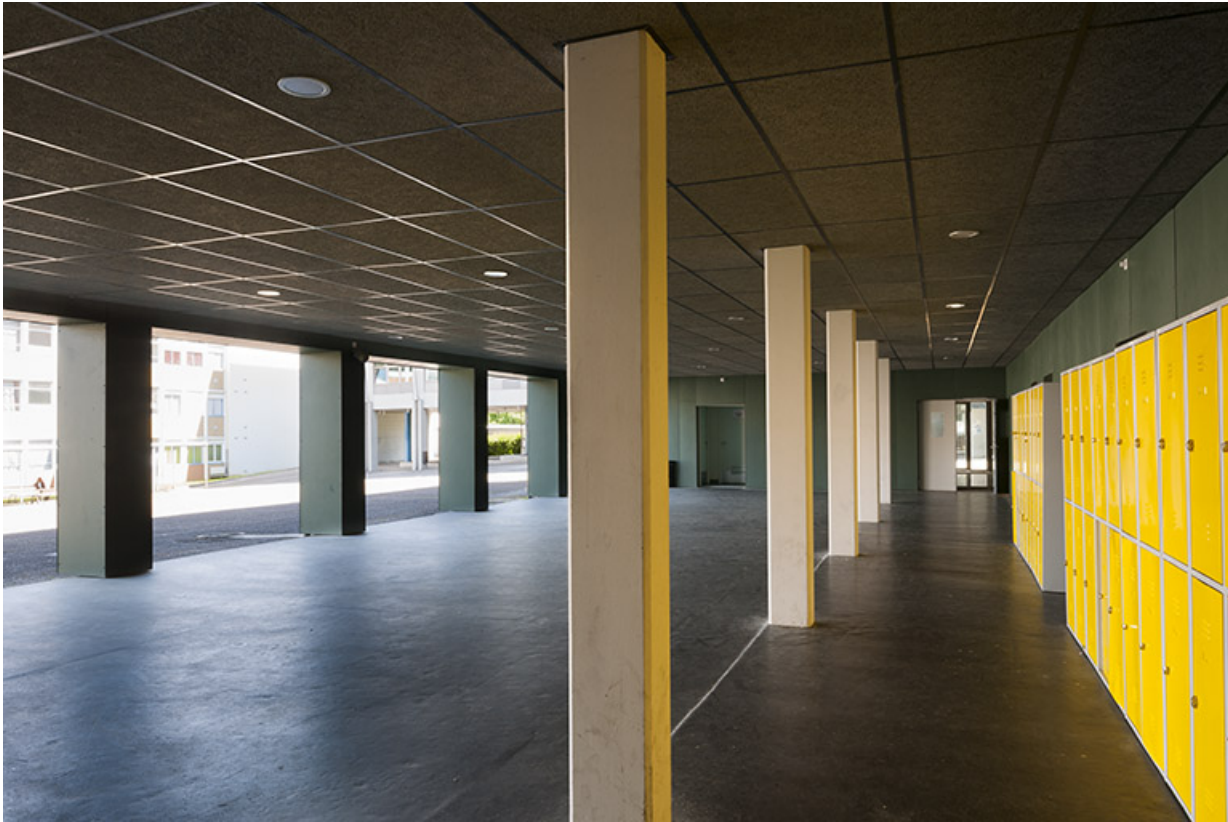
Détail de l'intérieur du préau de l'externat.