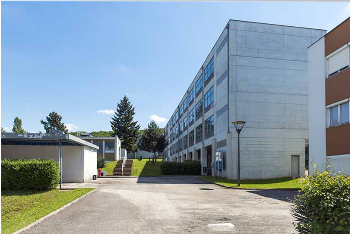
Pignon nord et façade postérieure est du bâtiment d'enseignement professionnel. 25, Besançon, 13 rue Goya