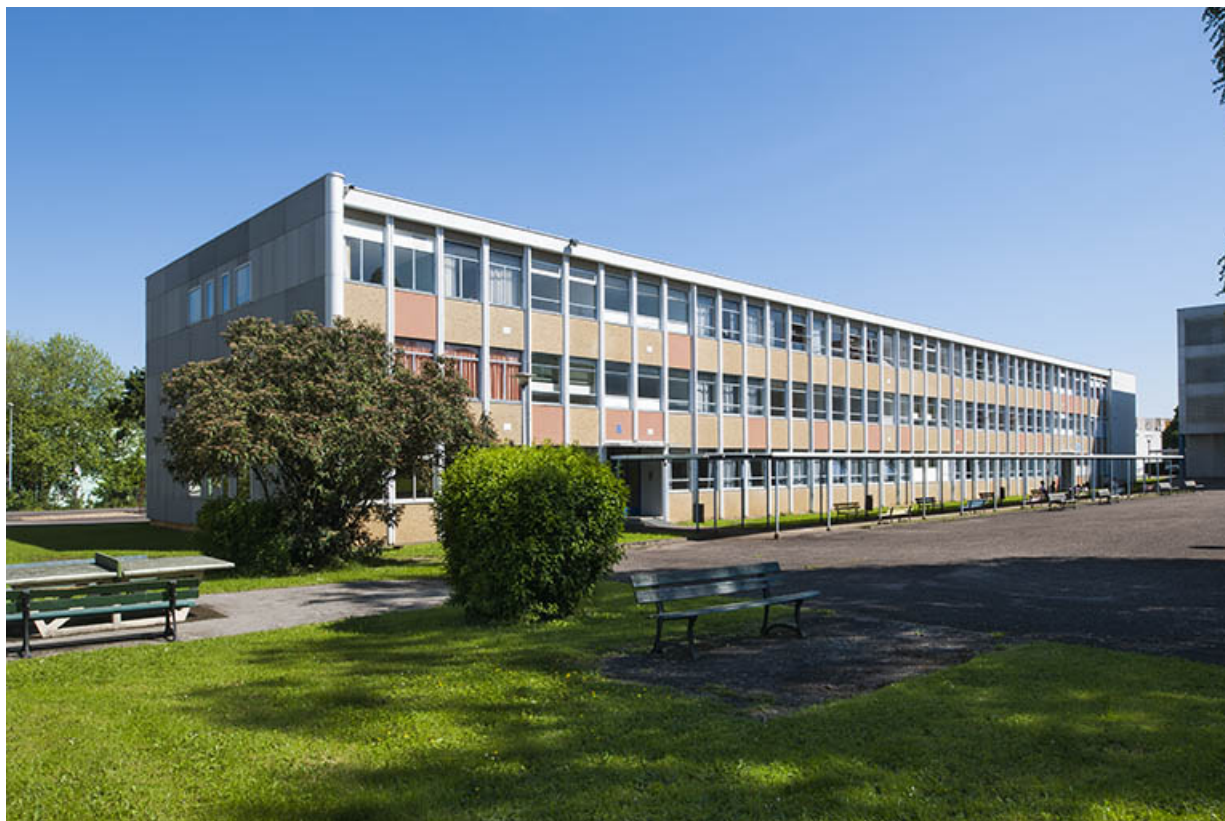
Pignon ouest et façade antérieure sud du bâtiment d'internat, externat, logements, infirmerie depuis la cour. 25, Besançon, 13 rue Goya