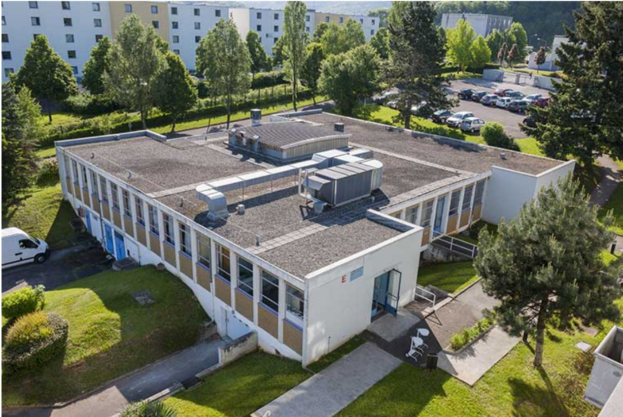
Angle nord-ouest du bâtiment de restauration.