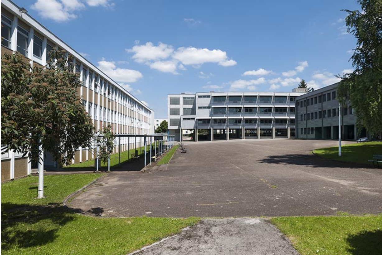
La cour depuis l'ouest, face au bâtiment d'enseignement professionnel.