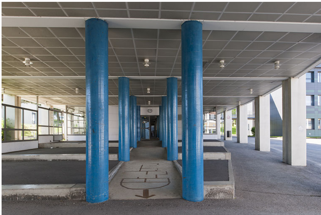
Vue intérieure de la partie inférieure nord du bâtiment d'enseignement professionnel. 25, Besançon, 13 rue Goya