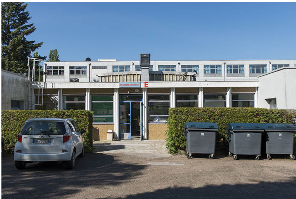
Façade postérieure est du bâtiment de restauration.