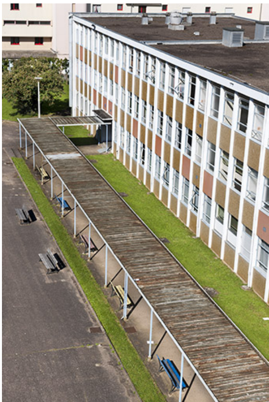
Façade antérieure sud du bâtiment d'internat vu depuis le bâtiment d'enseignement professionnel. 25, Besançon, 13 rue Goya