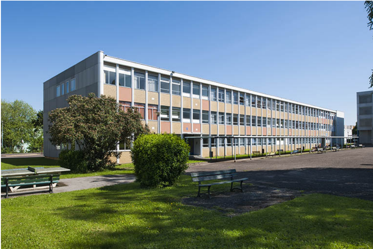
Pignon ouest et façade antérieure sud du bâtiment d'internat, externat, logements, infirmerie depuis la cour. 25, Besançon, 13 rue Goya