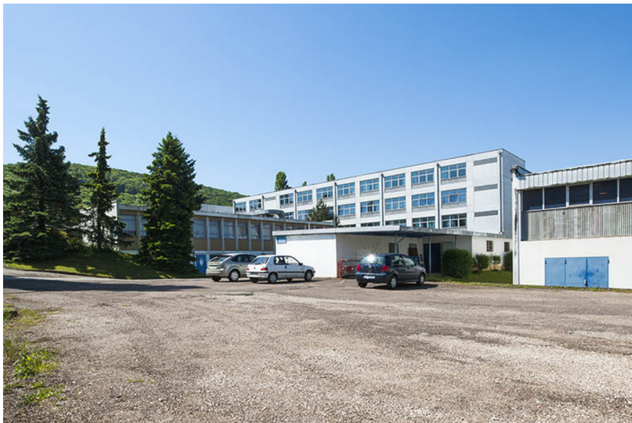
Vue d'ensemble depuis le nord-est sur le gymnase, le garage, la cantine et le bâtiment d'enseignement professionnel. 25, Besançon, 13 rue Goya