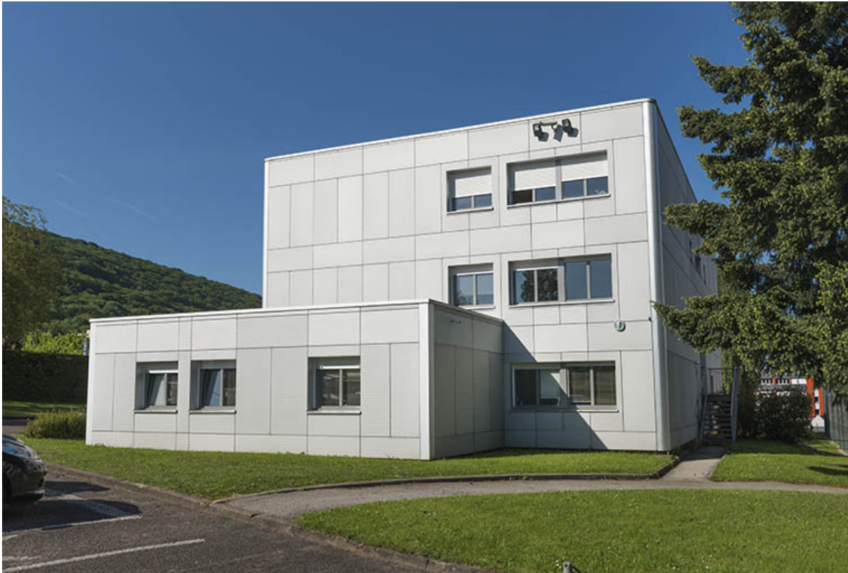
Détail de la façade est du bâtiment d'administration et logements.