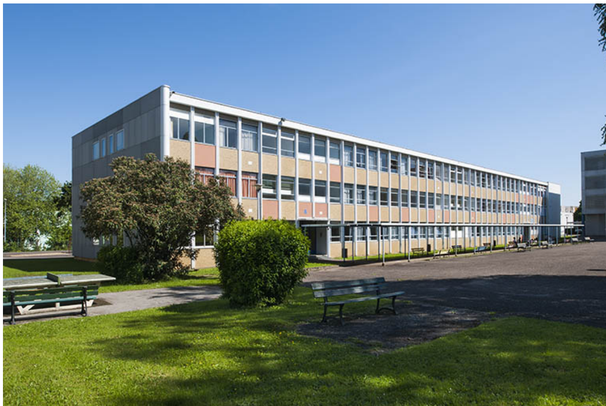
Pignon ouest et façade antérieure sud du bâtiment d'internat, externat, logements, infirmerie depuis la cour. 25, Besançon, 13 rue Goya