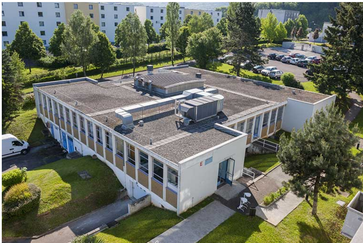
Angle nord-ouest du bâtiment de restauration.