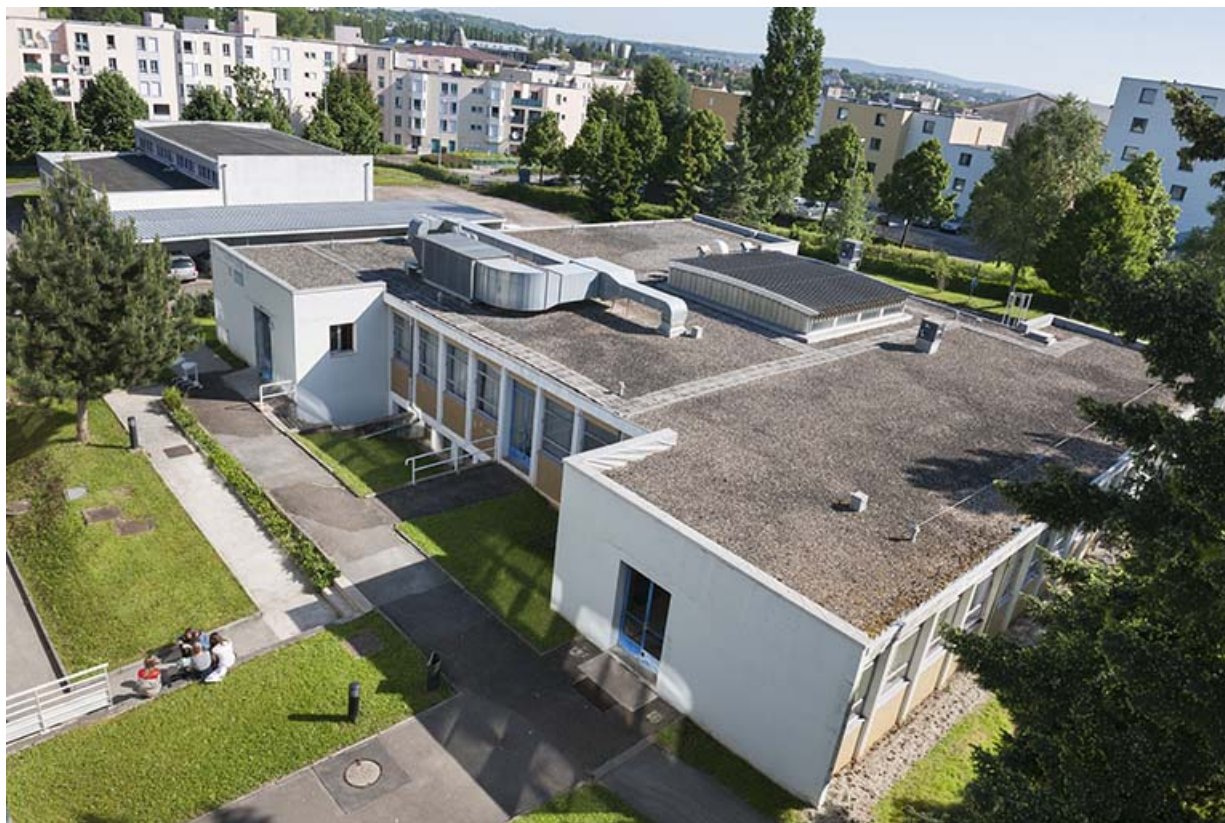
Angle sud-ouest du bâtiment de restauration.