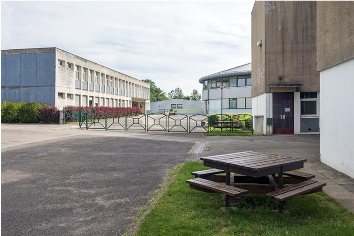
Cour devant l'entrée de l'internat-restauration.