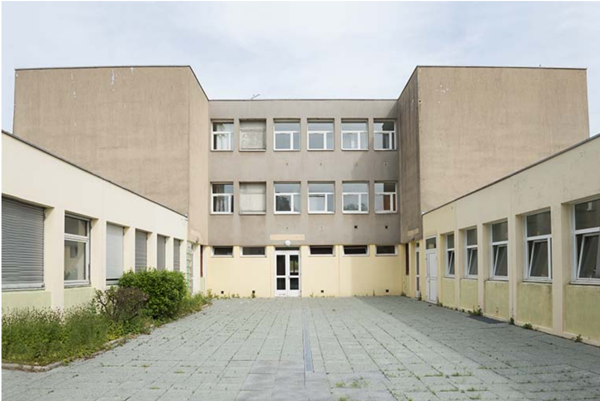
Cour postérieure du bâtiment d'internat et restauration.