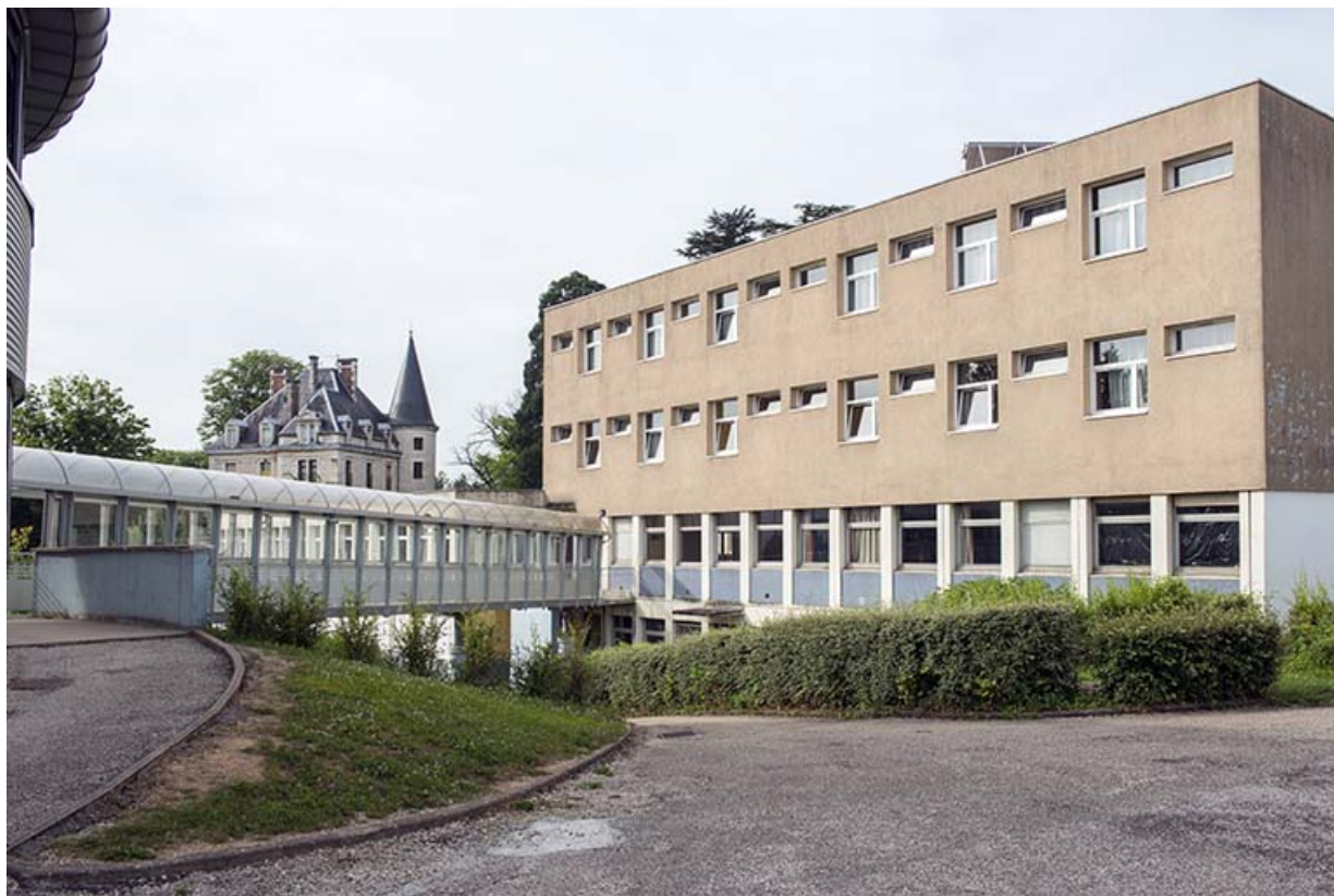
Détail de la passerelle entre la tour et le bâtiment d'internat et restauration.