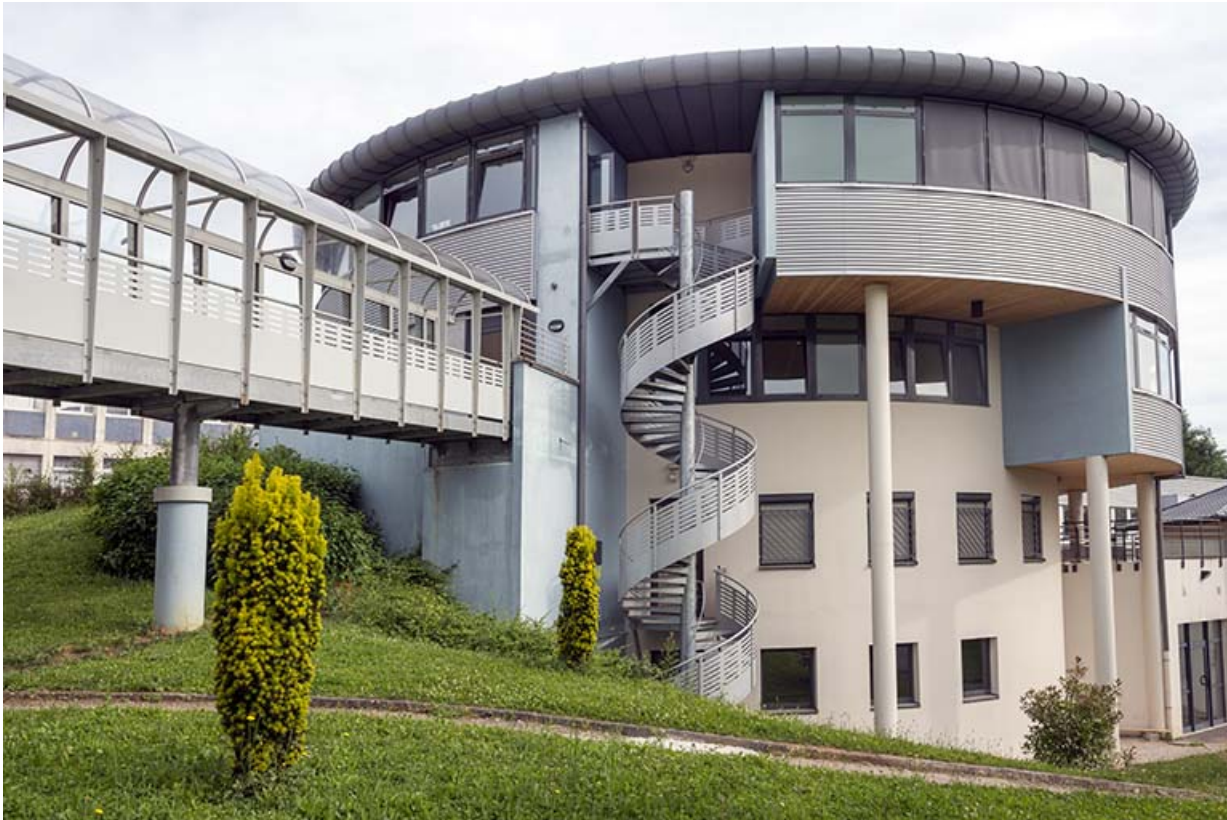
Passerelle, tour et son escalier au sud-ouest.