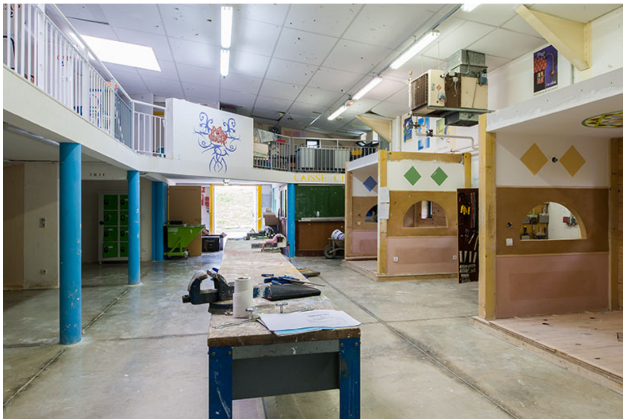
Détail de l'atelier peinture.