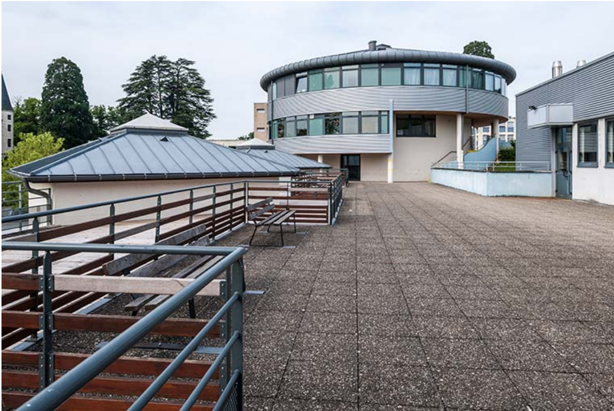
Face est de la tour vue depuis la terrasse du bâtiment des ateliers.