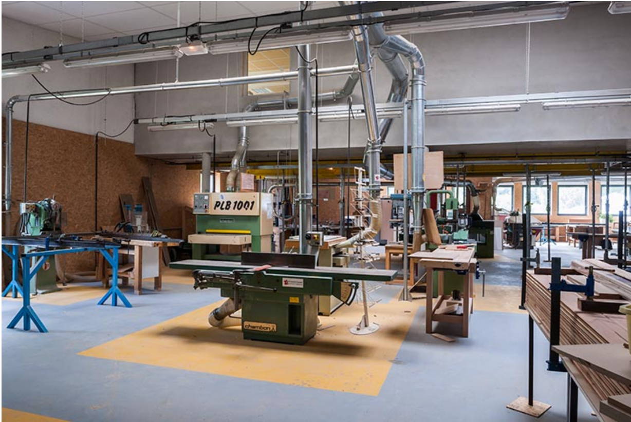
intérieur de l'atelier bois.