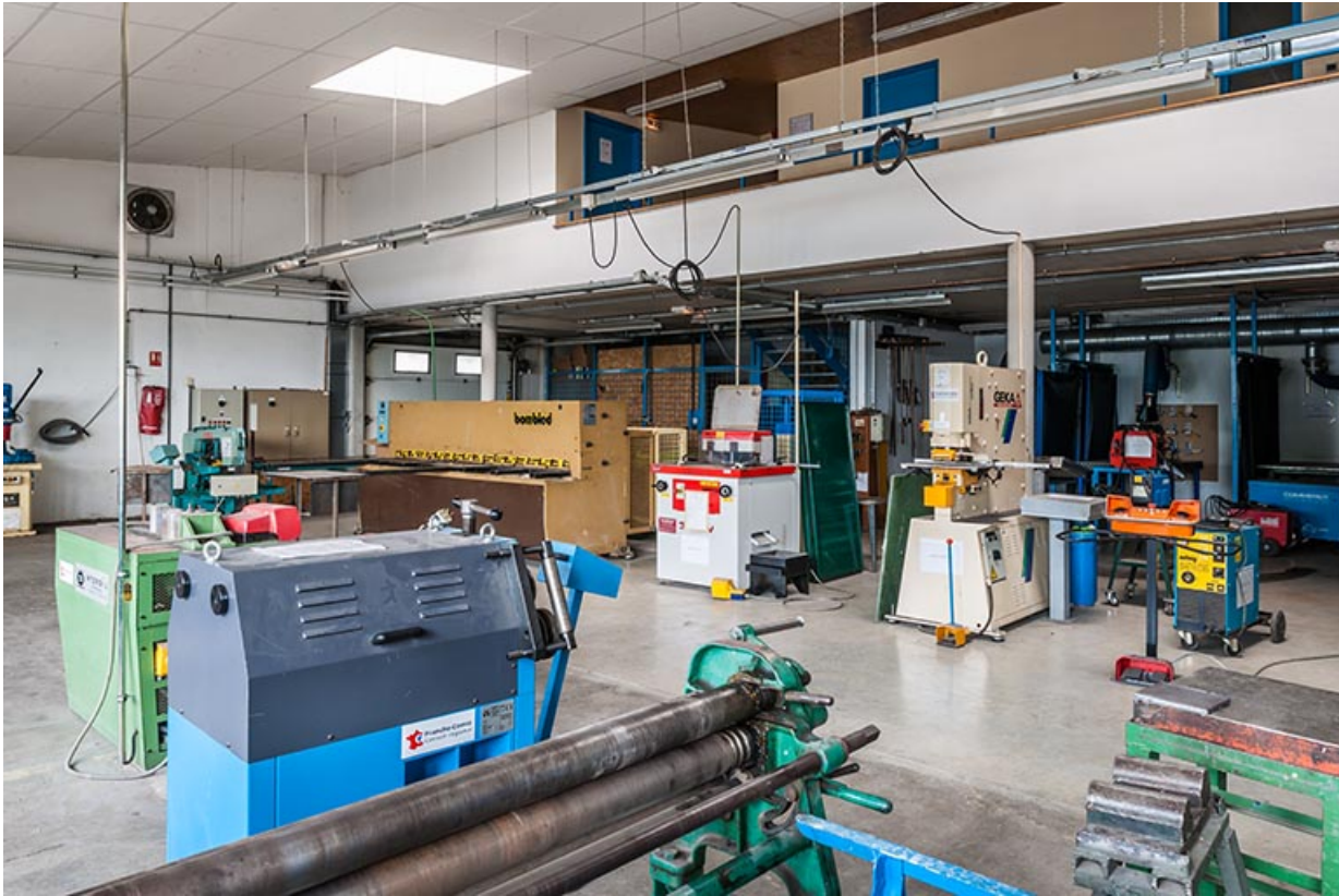
Détail d'intérieur d'atelier.