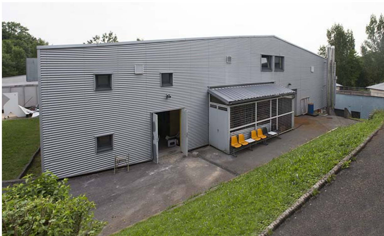
Façade sud-ouest des ateliers.