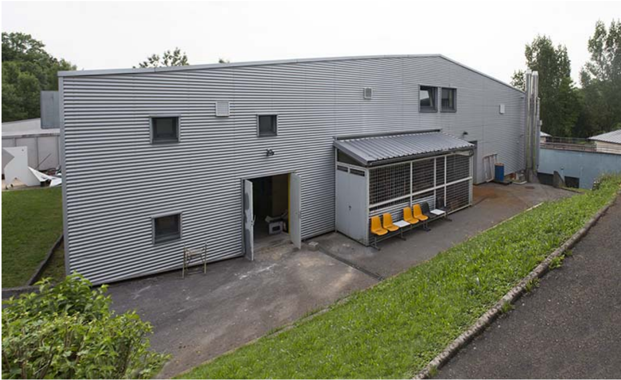
Façade sud-ouest des ateliers.