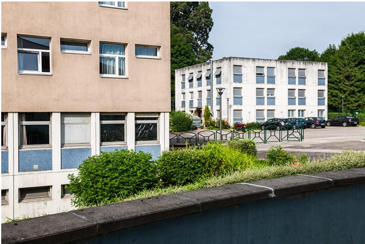
Angle nord de l'internat-restauration et vue sur les logements.