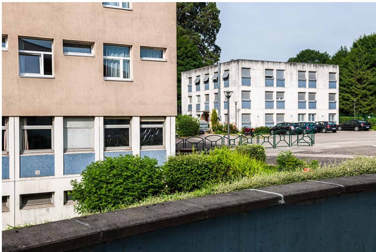
Angle nord de l'internat-restauration et vue sur les logements.