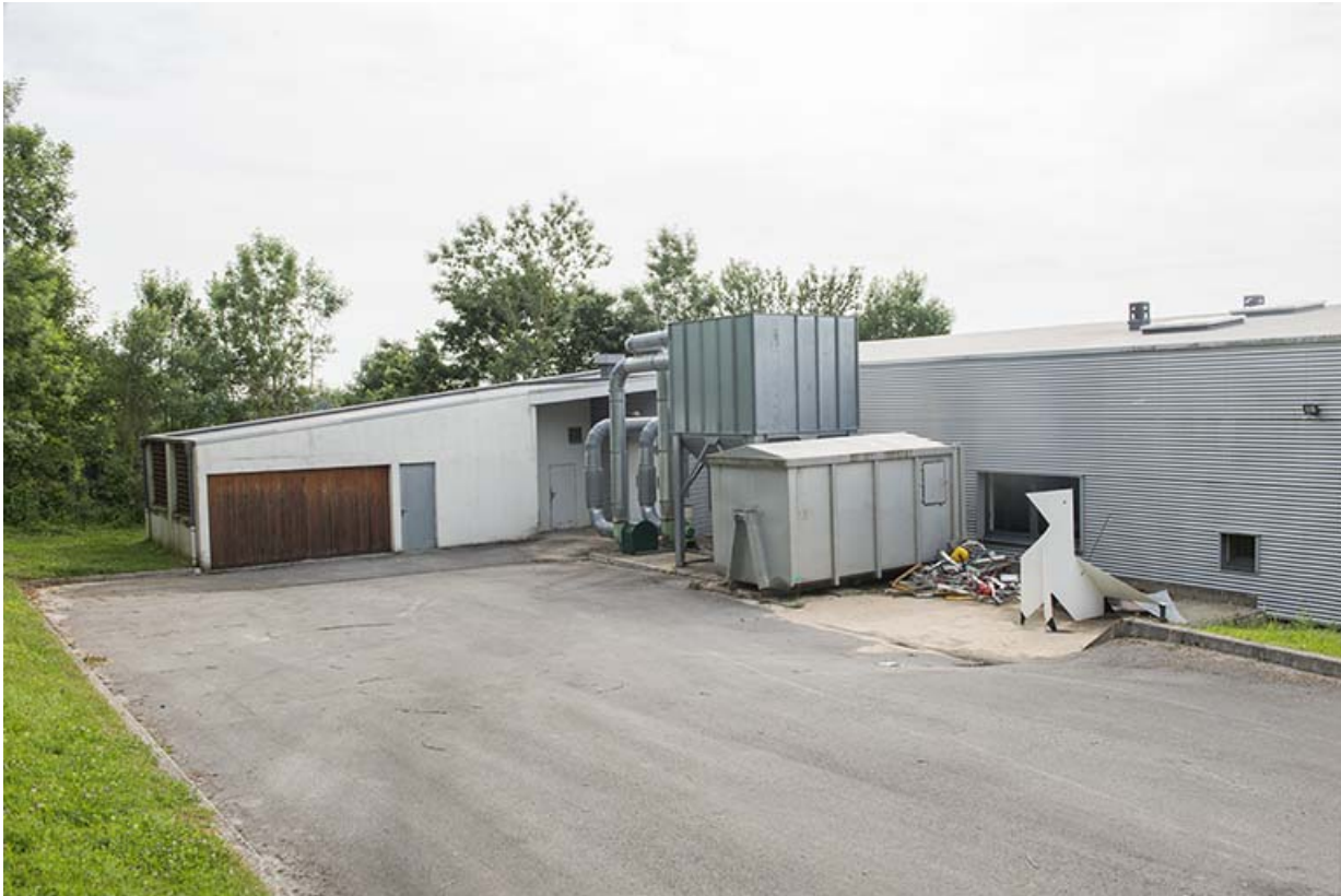
Angle nord de la parcelle, façade postérieure des ateliers.