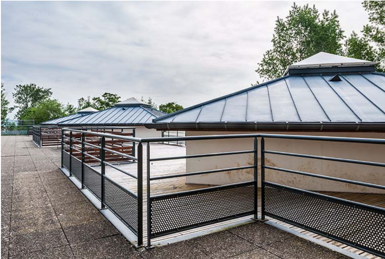
Terrasse et toiture des ateliers.