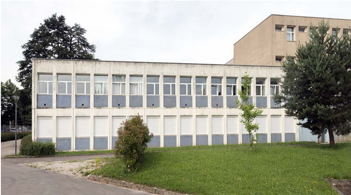
Façade nord-est du bâtiment d'internat et restauration.