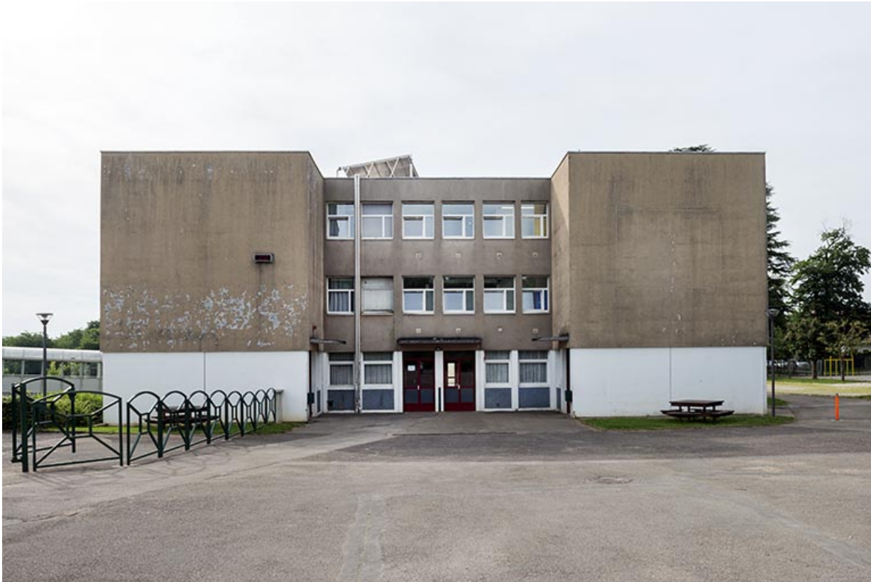
Entrée du bâtiment d'internat et restauration.