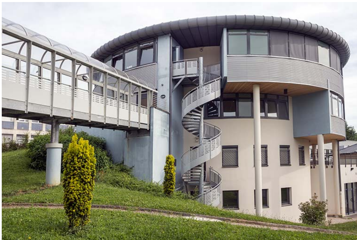
Passerelle, tour et son escalier au sud-ouest.