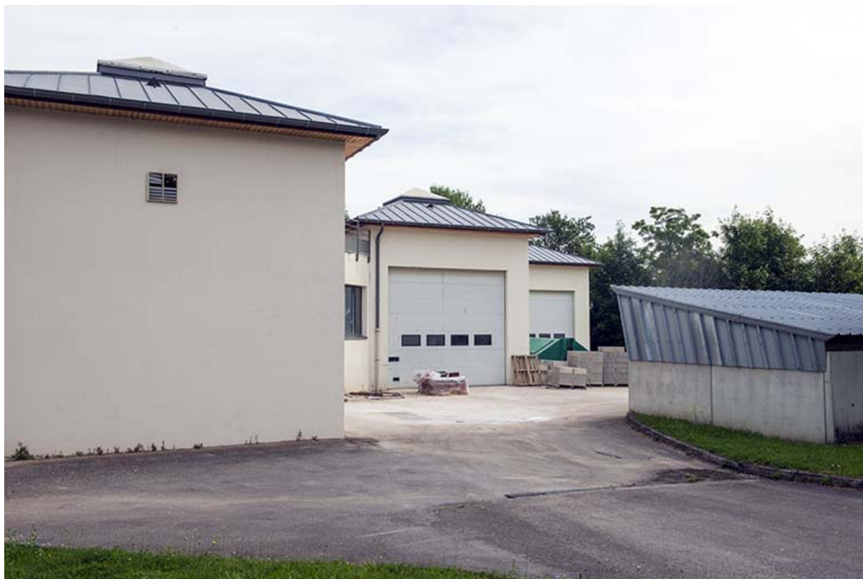
Cour et détail d'une des trois entrées des ateliers maçonnerie.