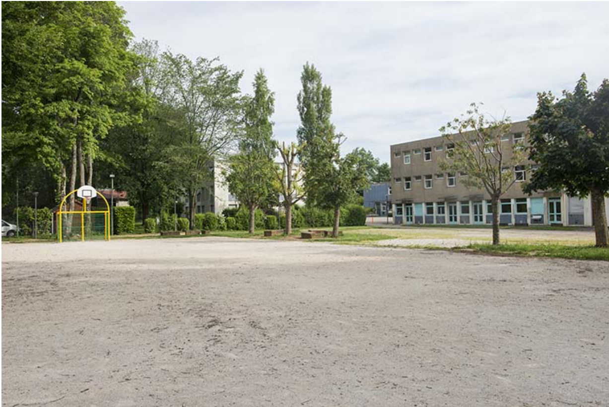
Le terrain de sport au sud-ouest de la parcelle.