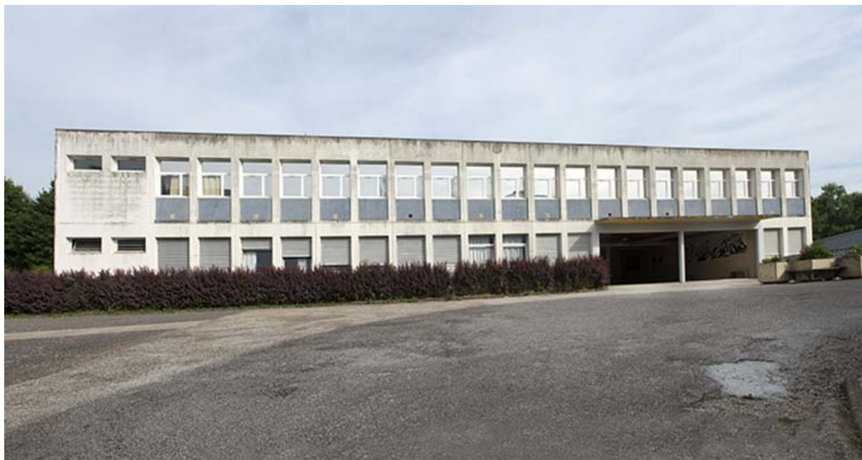
Façade sud-est de l'externat et préau.