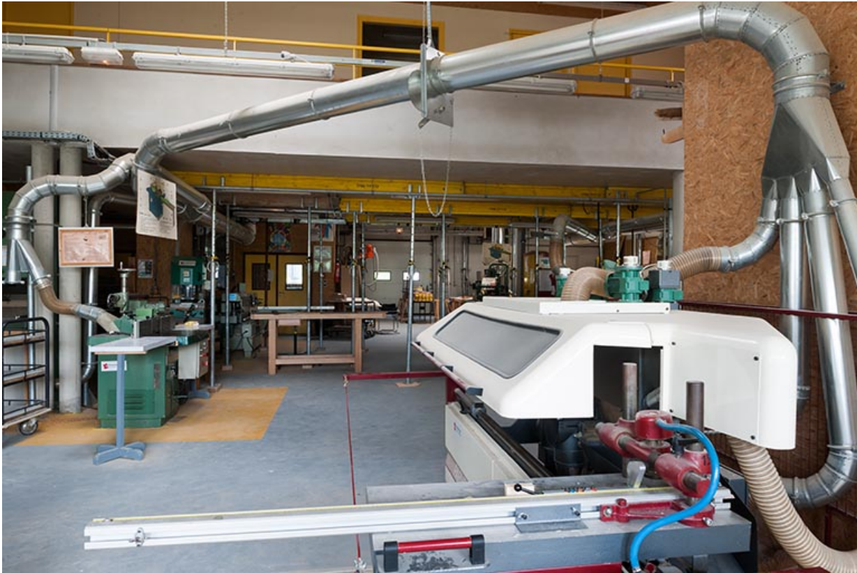
Intérieur de l'atelier.