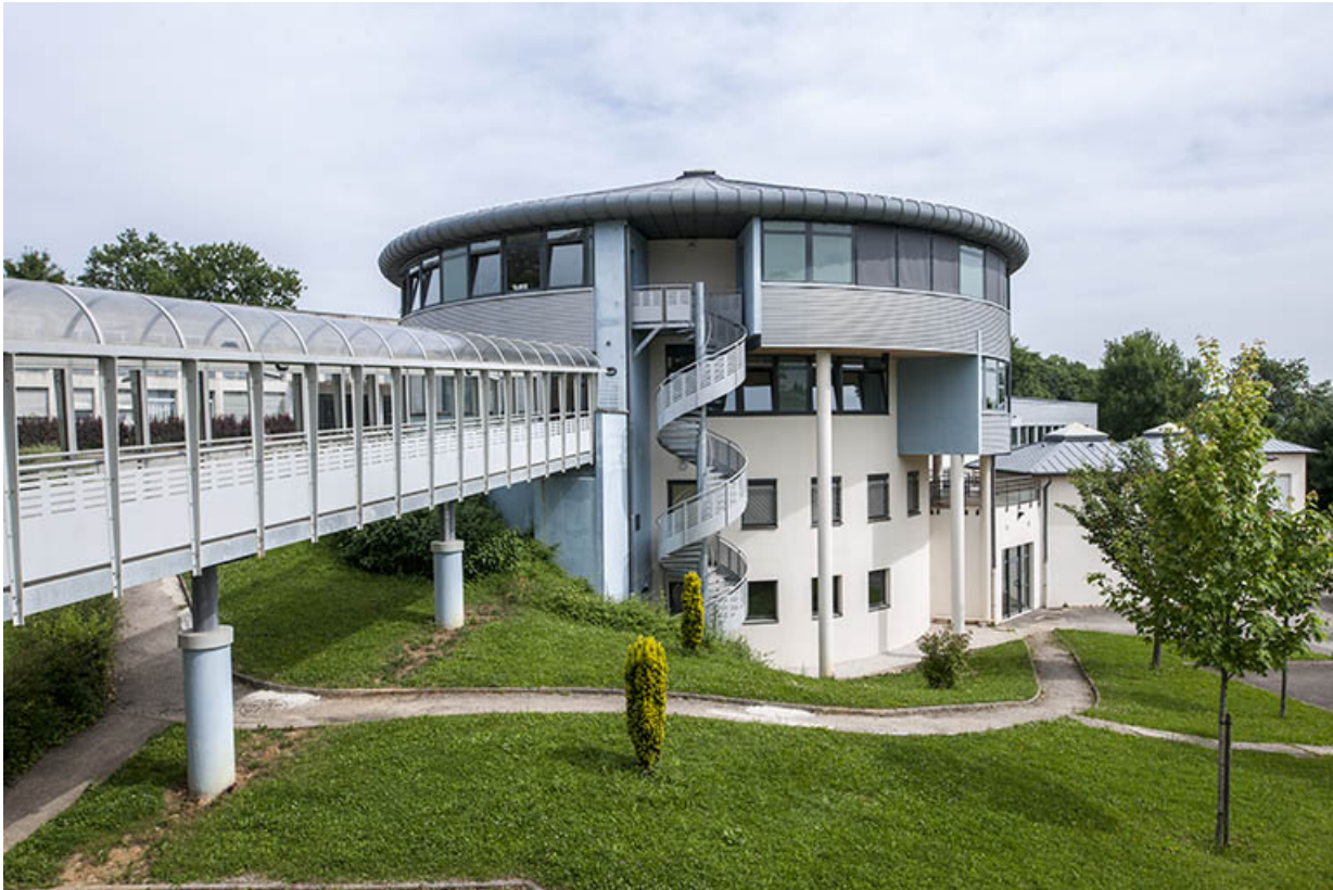
Vue d'ensemble de la passerelle, escalier et tour, ateliers.