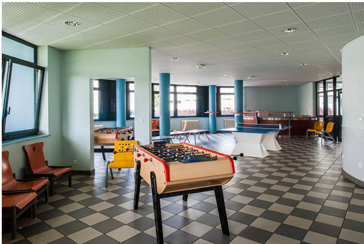
Détail intérieur de l'internat.