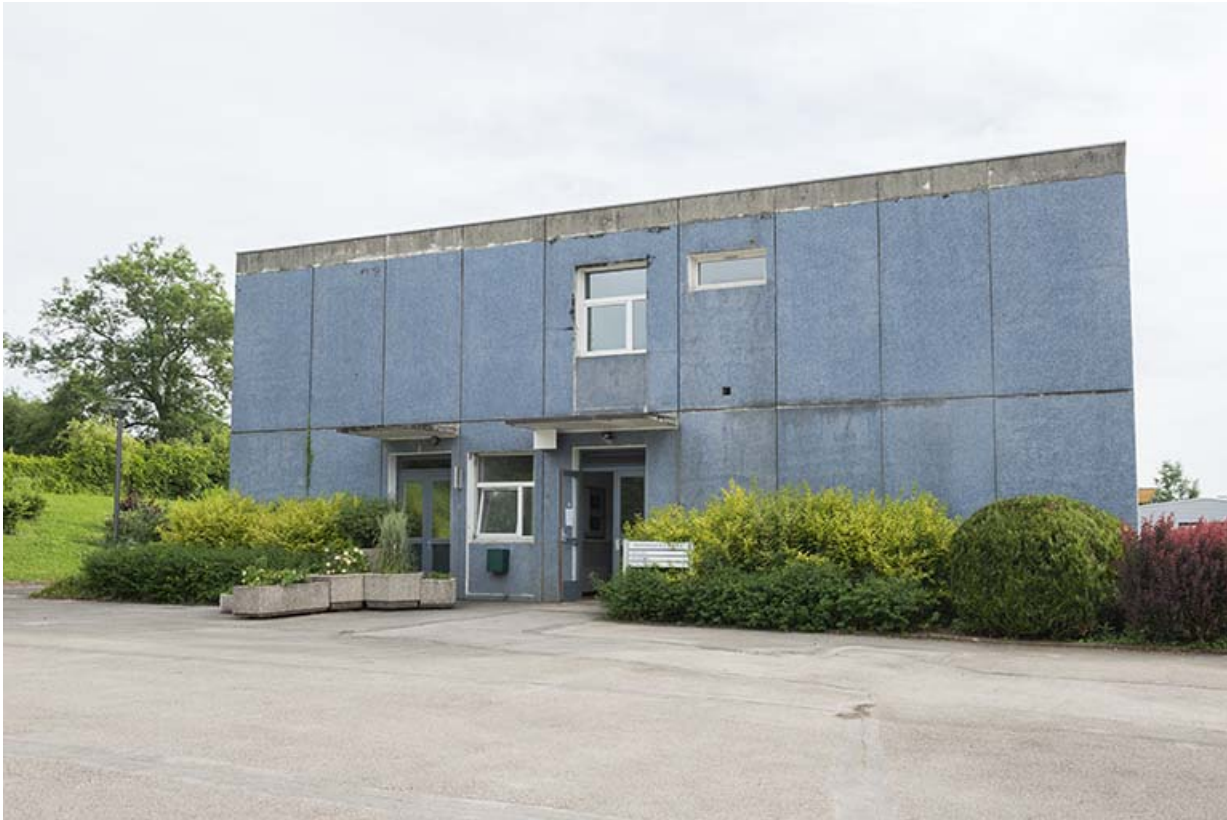
Détail du pignon sud-ouest de l'externat.