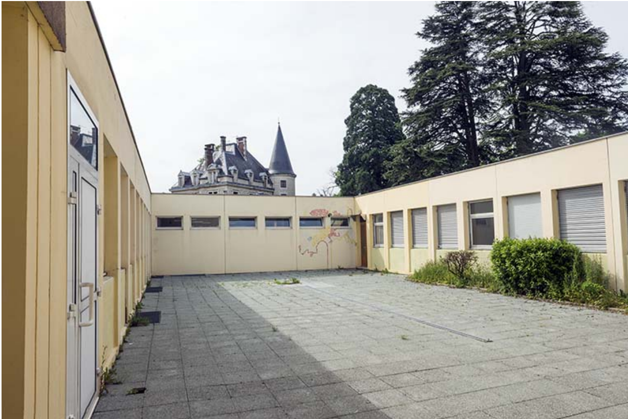
Cour de l'internat et cantine.