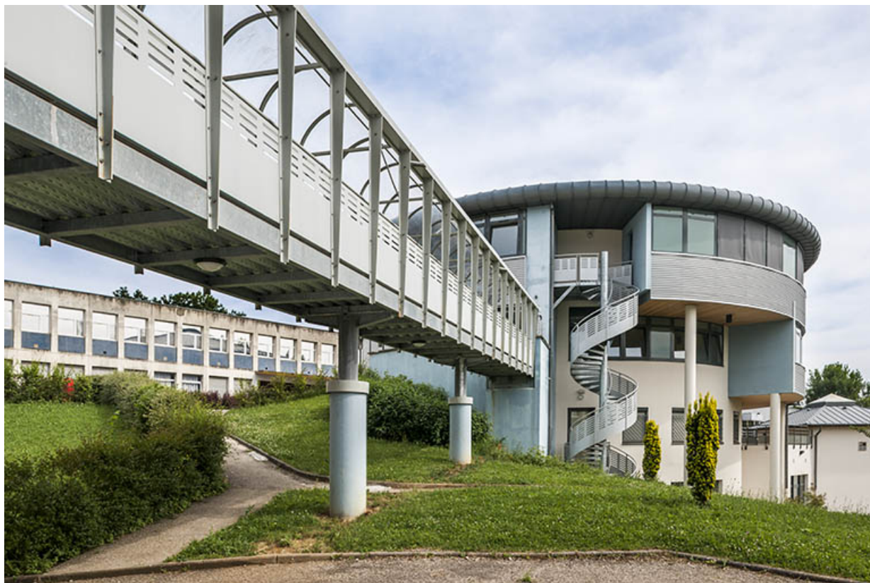
Vue d'ensemble de l'externat, la passerelle, l'escalier et la tour, les ateliers.