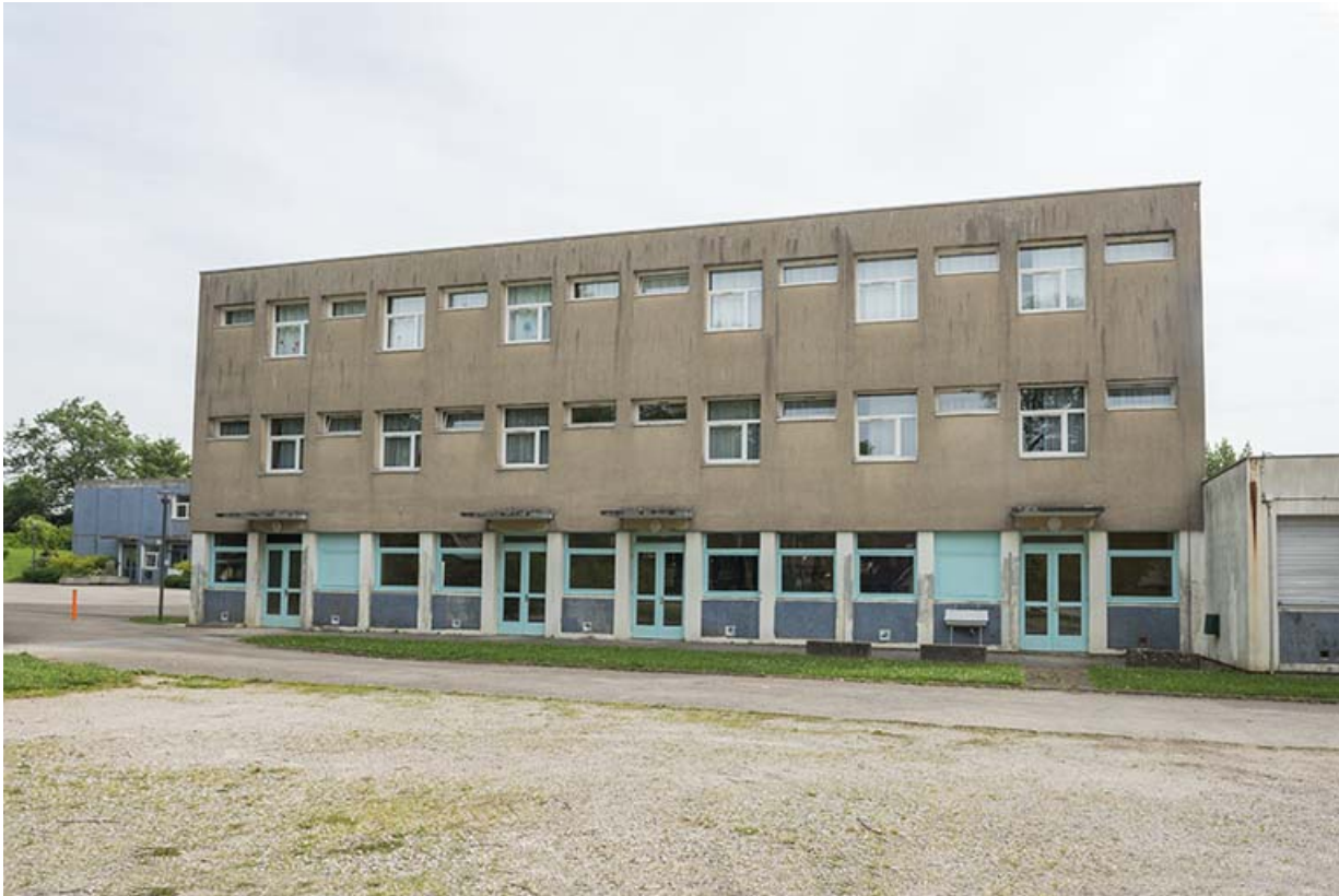
Façade sud-ouest de l'internat restauration.