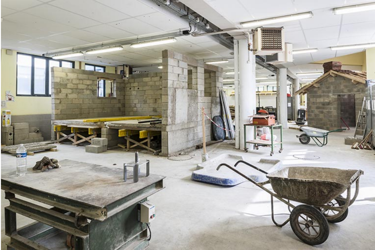
Vue intérieure de l'atelier bâtiment.