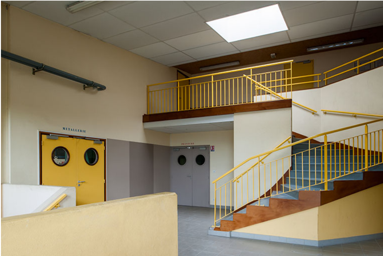
Détail de l'escalier intérieur de l'atelier.