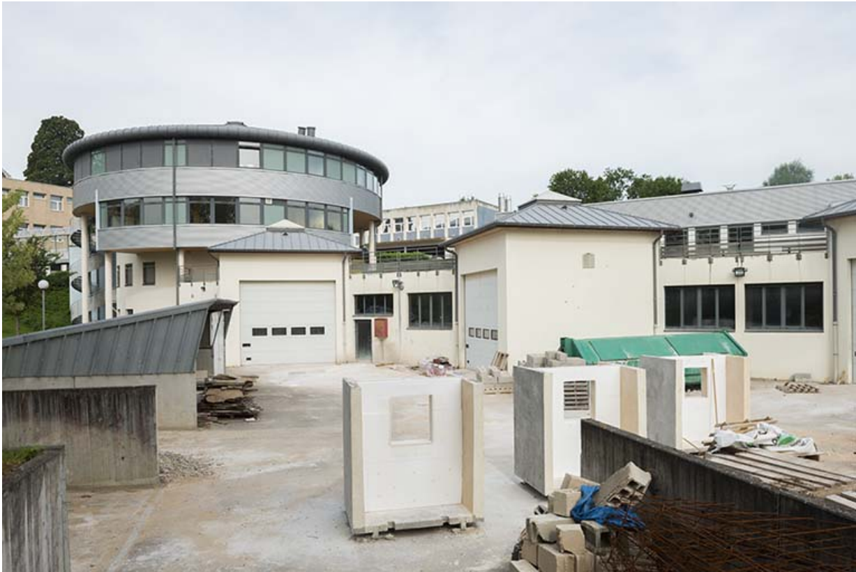
Vue sur la tour et les ateliers depuis l'est.