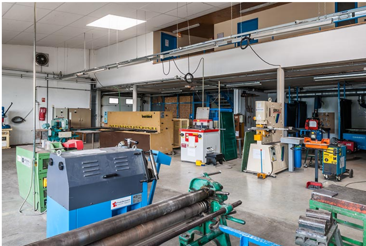
Détail d'intérieur d'atelier.