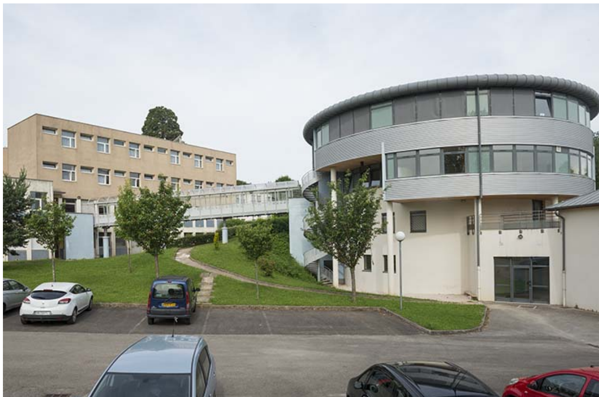
Vue sur l'internat-restauration et la passerelle depuis l'aire de stationnement.