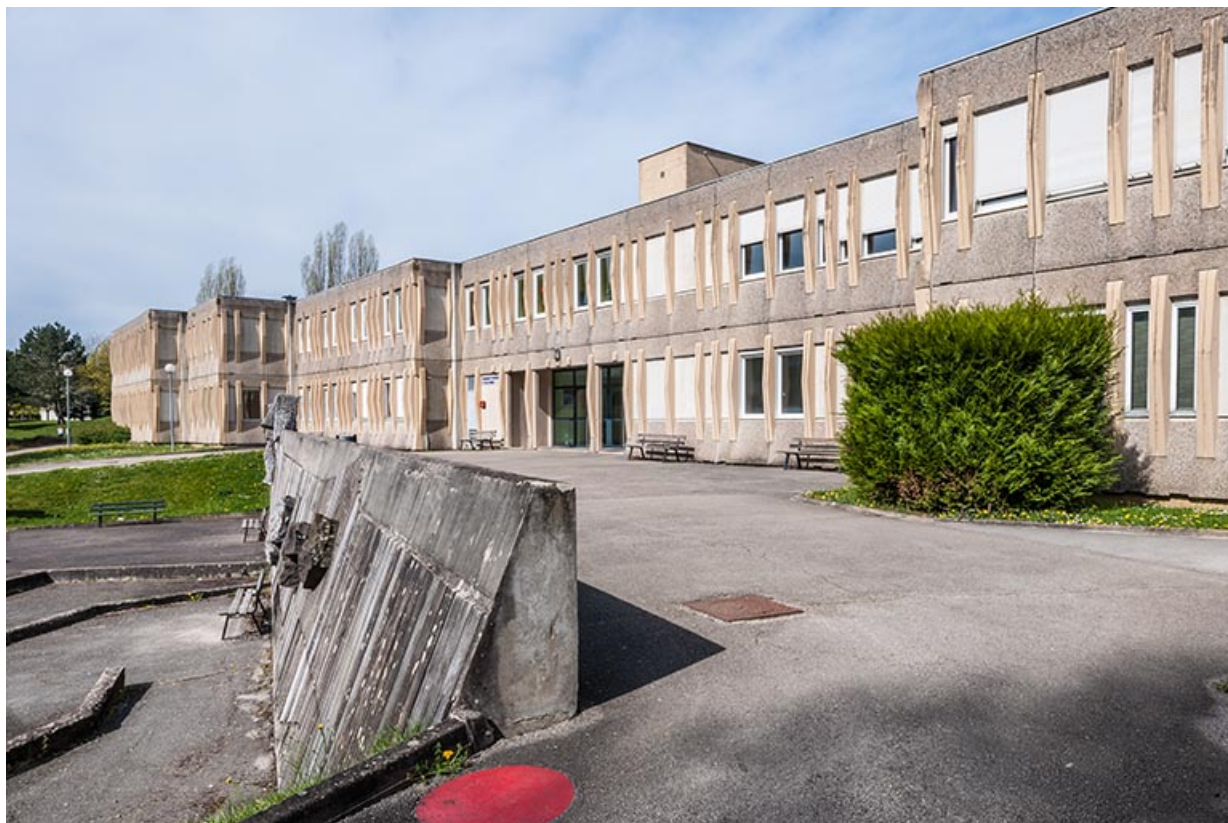
Depuis l'est, vue de profil de l'oeuvre de Jean Gilles et des façades sud des ateliers-externats. 25, Besançon, 1 rue Rembrandt