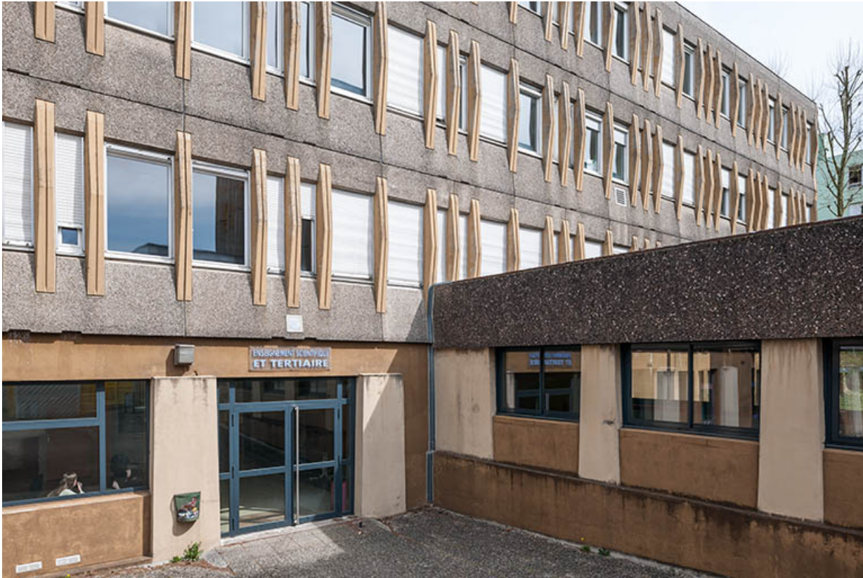
Façade sud-ouest et entrée sur cour de l'externat nord-est.