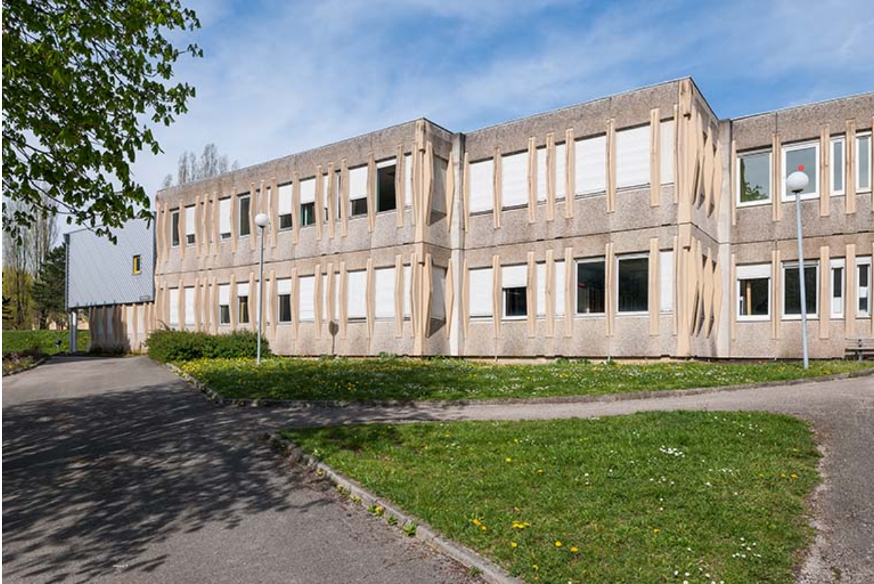
Aile nord-ouest des façades sud des externats - ateliers.