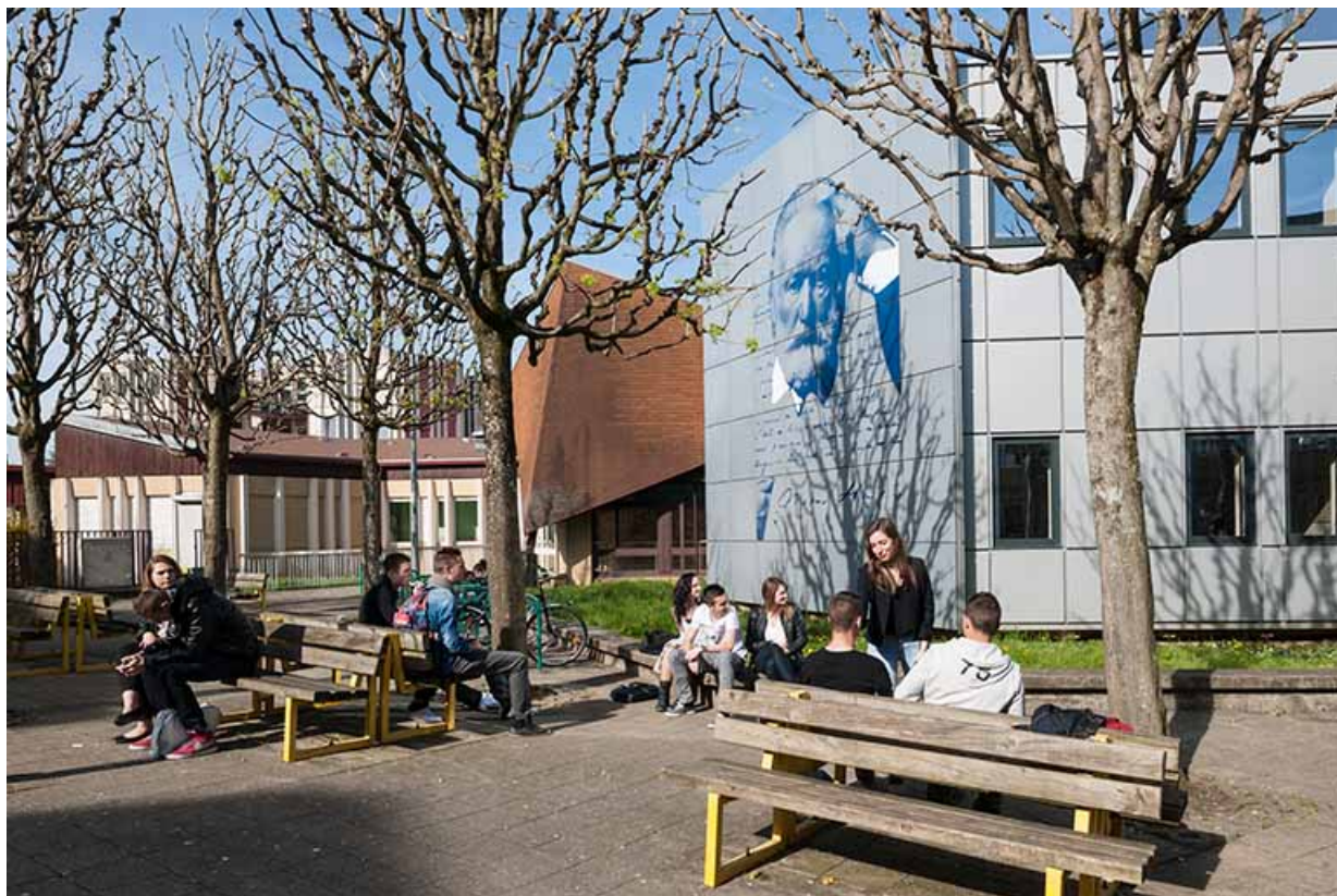
Vue de la place devant le lycée, la façade sud-est décorée à l'effigie de Victor Hugo. 25, Besançon, 1 rue Rembrandt