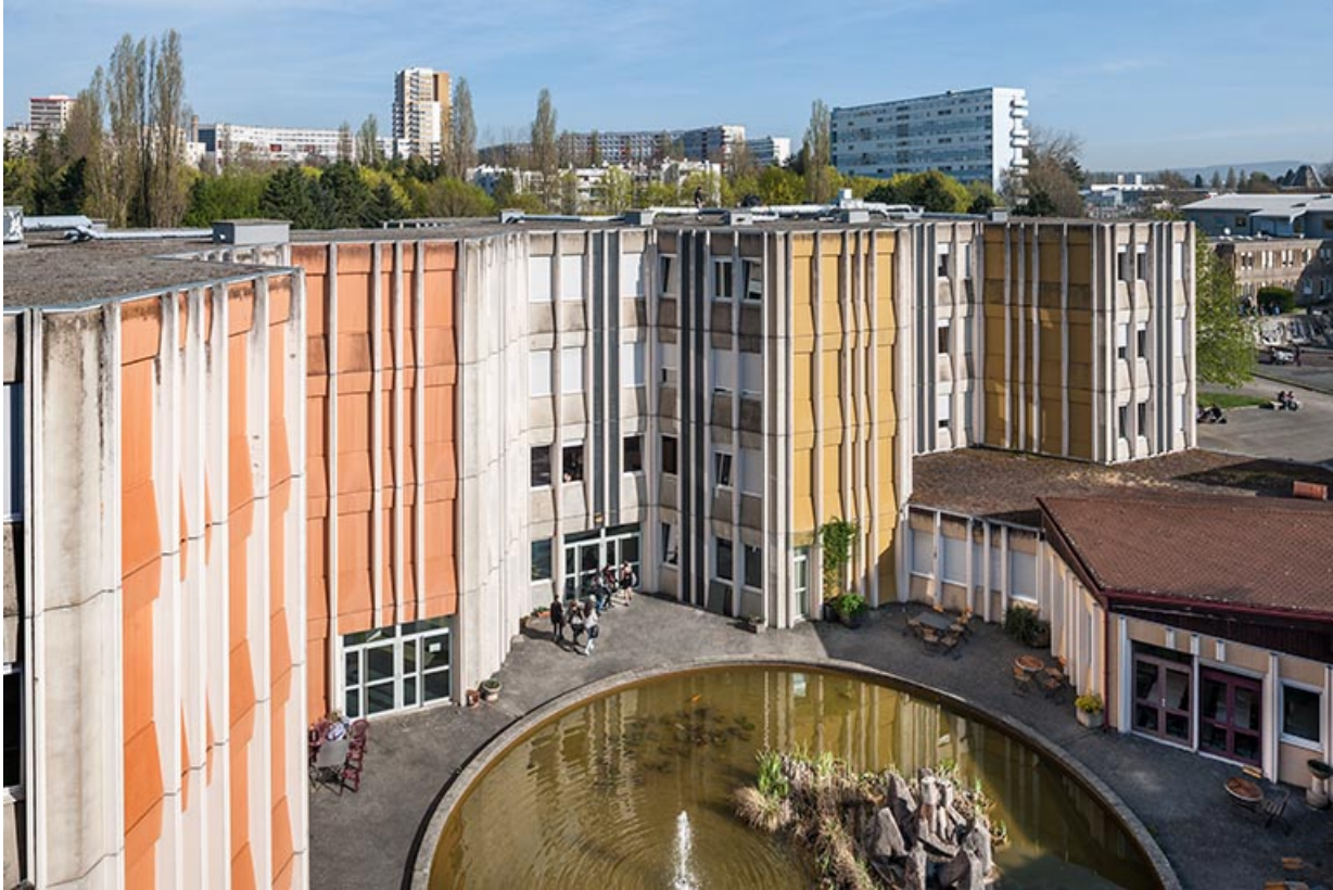
Bassin, façades sud et ouest des externats qui le bordent.