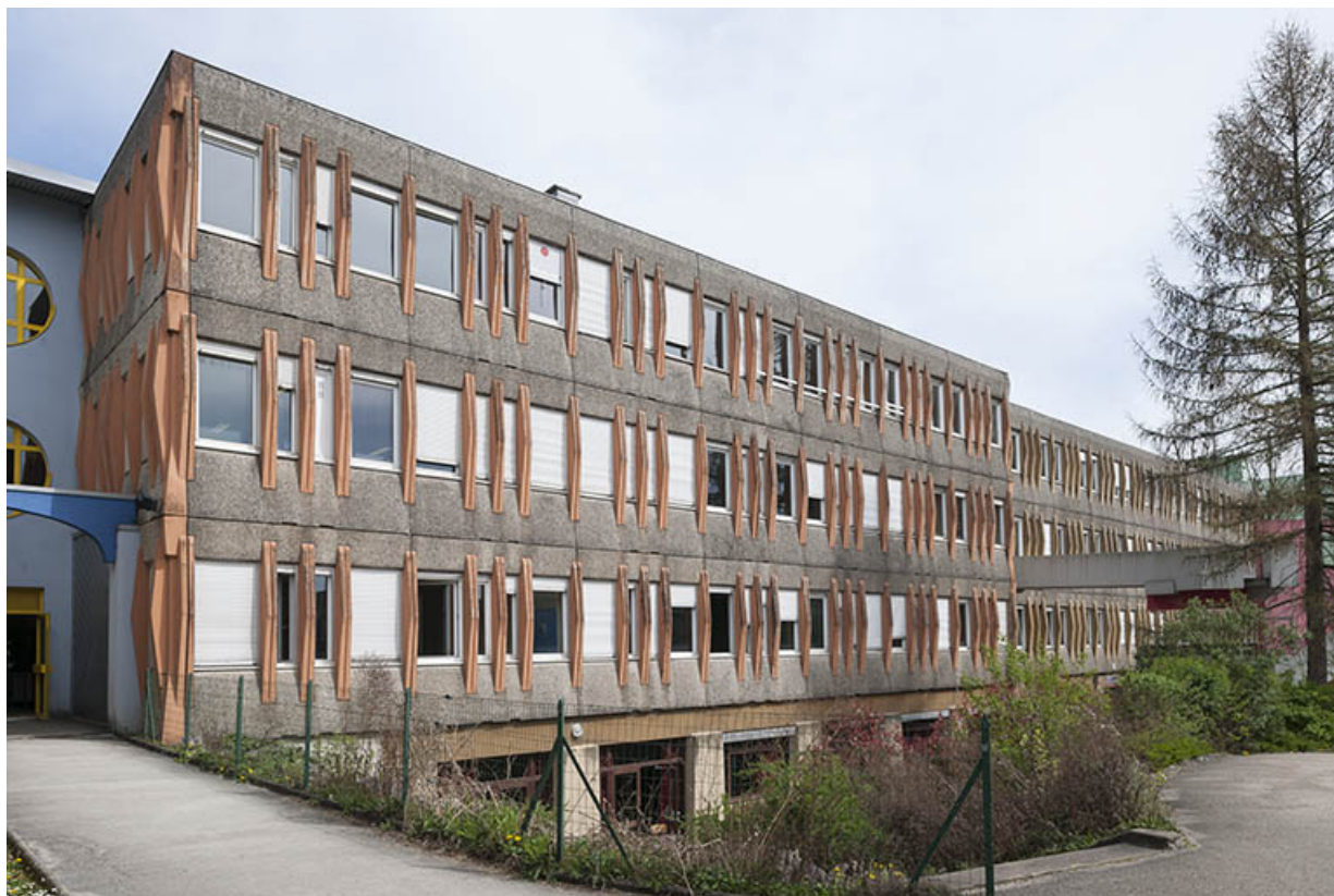
Angle nord-ouest de la façade antérieure sud-ouest sur cours de l'externat nord-est.