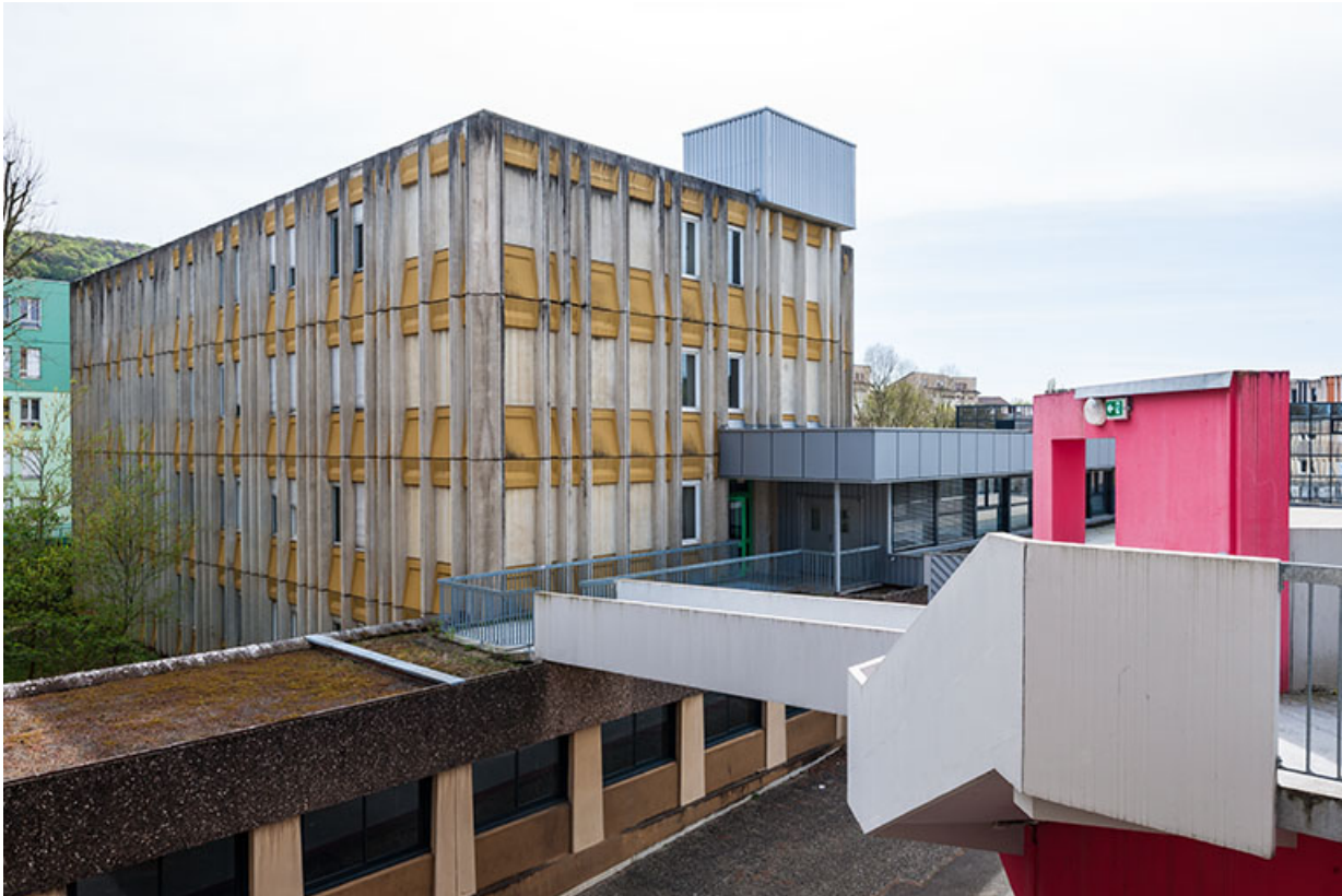
Circulation horizontale et escalier desservant les externats est et sud-est. 25, Besançon, 1 rue Rembrandt