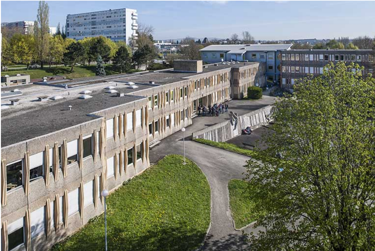
Façade antérieure sud-est des ateliers industriels, cour, bâtiment d'externat. 25, Besançon, 1 rue Rembrandt