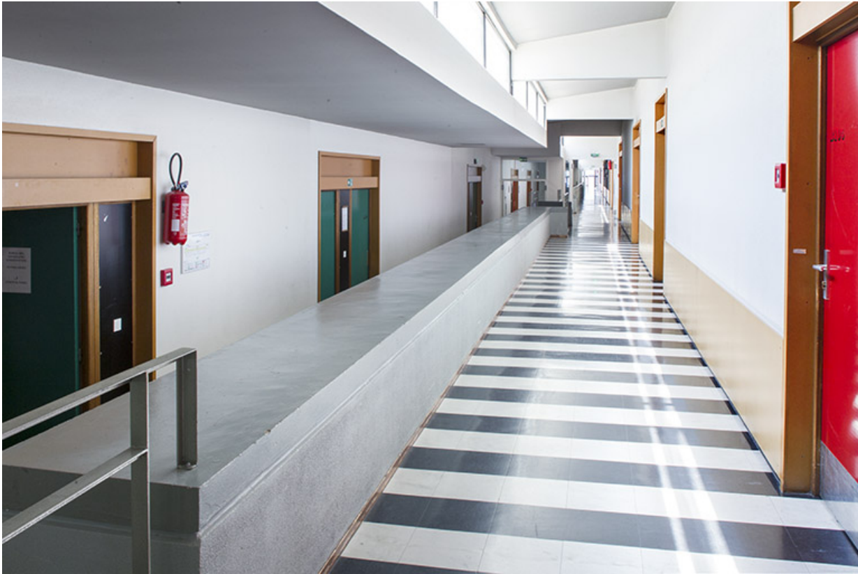
Couloir du bâtiment de l'externat.

25, Besançon, 14 rue Alain Savary, lieudit : Temis