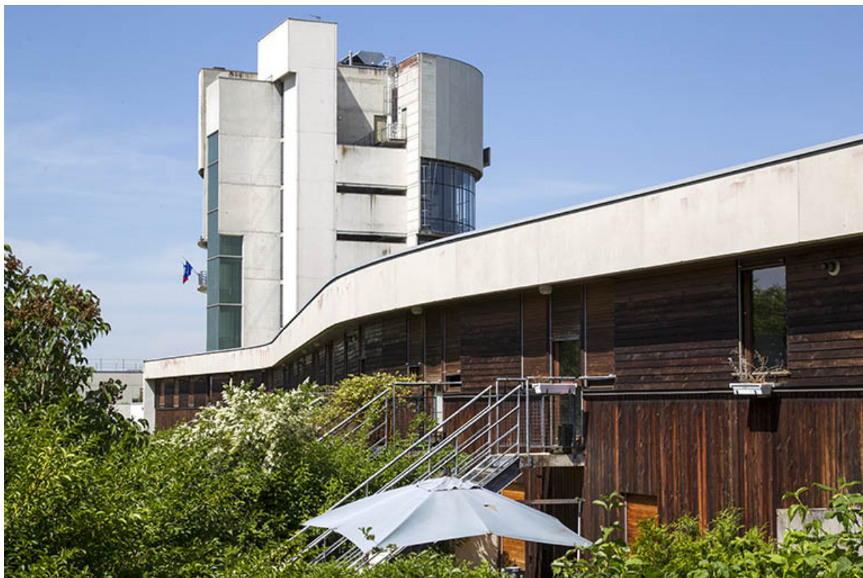
Les façades postérieures - sud - des logements vues de trois-quart est.

25, Besançon, 14 rue Alain Savary, lieudit : Temis