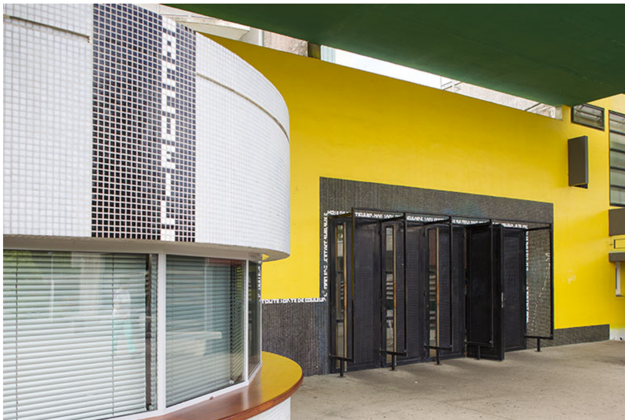
Détail de l'entrée vue de trois-quart sud.

25, Besançon, 14 rue Alain Savary, lieudit : Temis