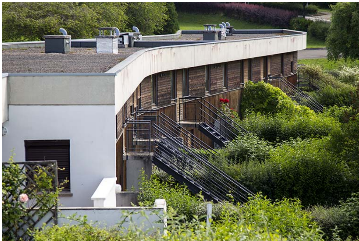
Les façades postérieures - sud - des logements vues de trois-quart ouest.

25, Besançon, 14 rue Alain Savary, lieudit : Temis