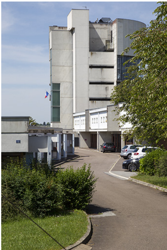
Façades antérieures -nord- des logements et vue depuis le nord-est sur le bâtiment "agencement" ainsi que sur la tour centrale. 25, Besançon, 14 rue Alain Savary, lieudit : Temis