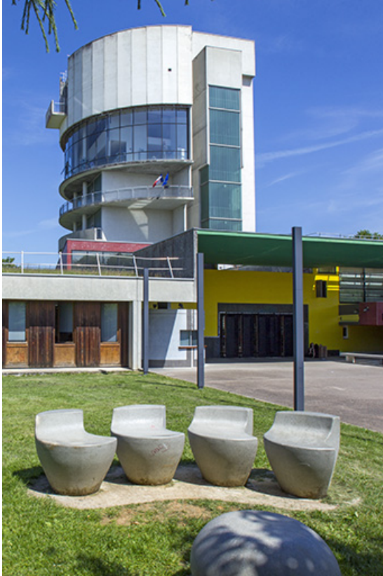
L'entrée et la tour depuis le sud-ouest.

25, Besançon, 14 rue Alain Savary, lieudit : Temis