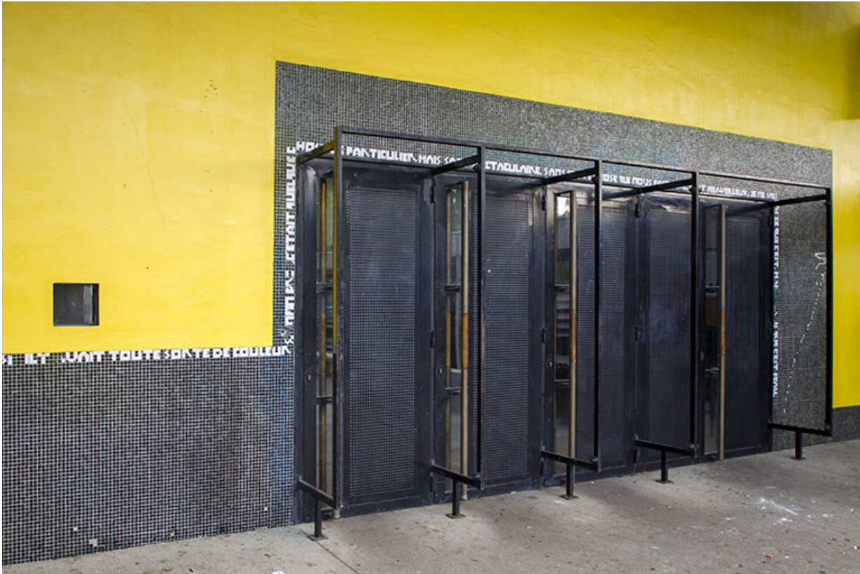
Détail de l'entrée vue de trois-quart ouest .

25, Besançon, 14 rue Alain Savary, lieudit : Temis