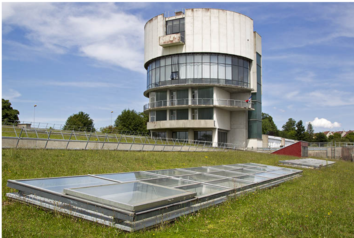
La tour vue du sud-ouest et détail de verrière sur terrasse.

25, Besançon, 14 rue Alain Savary, lieudit : Temis