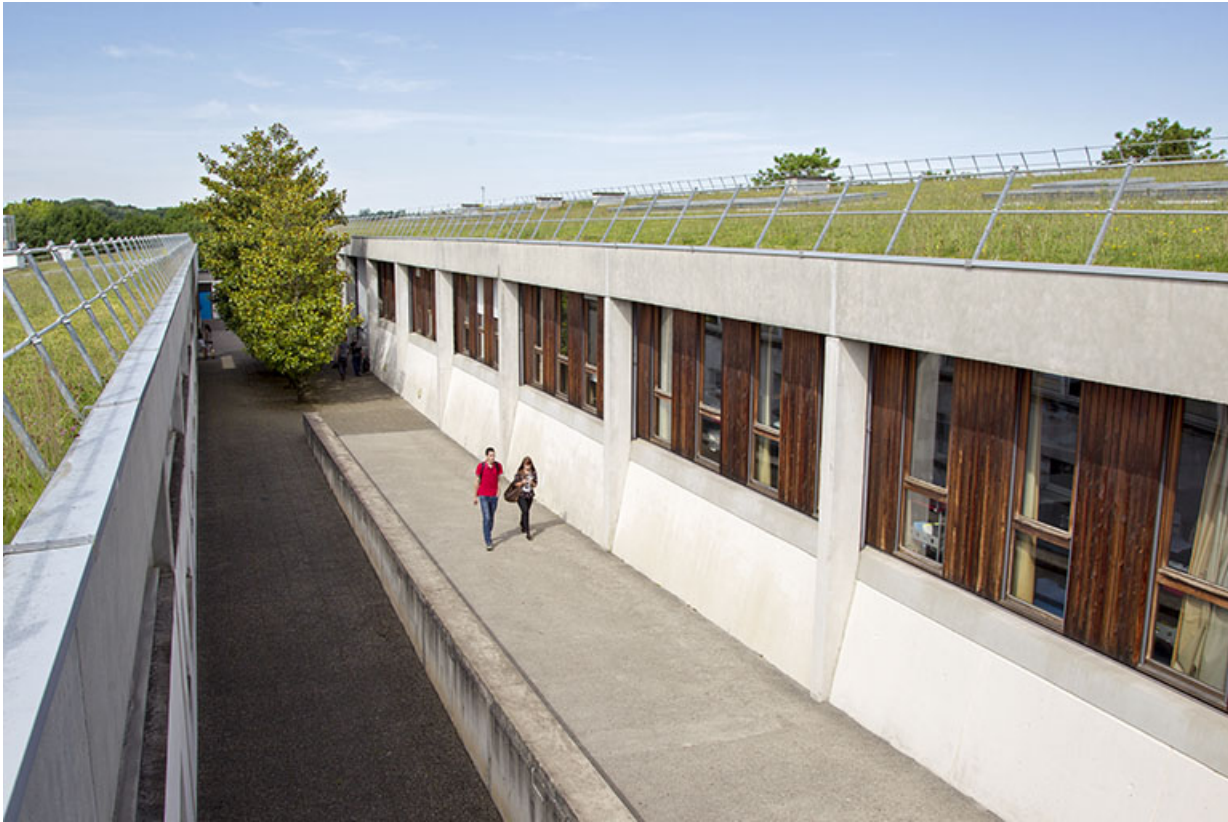
Vue vers l'ouest de l'allée entre les bâtiments d'externat.

25, Besançon, 14 rue Alain Savary, lieudit : Temis