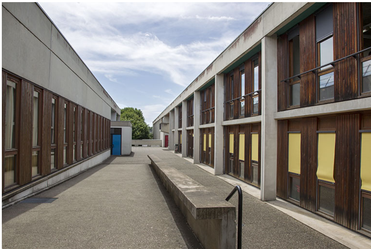
Vue vers l'ouest de l'allée entre les deux bâtiments d'externat.

25, Besançon, 14 rue Alain Savary, lieudit : Temis