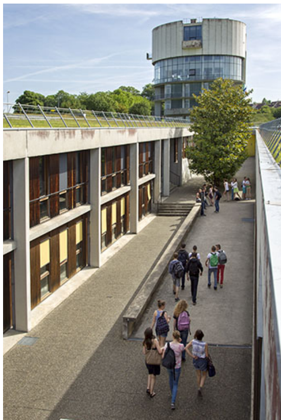
Vue vers l'est de l'allée entre les bâtiments d'externat.

25, Besançon, 14 rue Alain Savary, lieudit : Temis