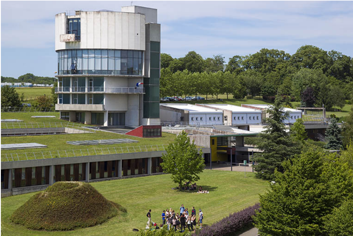
Vue de l'entrée et de la tour depuis le sud-ouest.

25, Besançon, 14 rue Alain Savary, lieudit : Temis