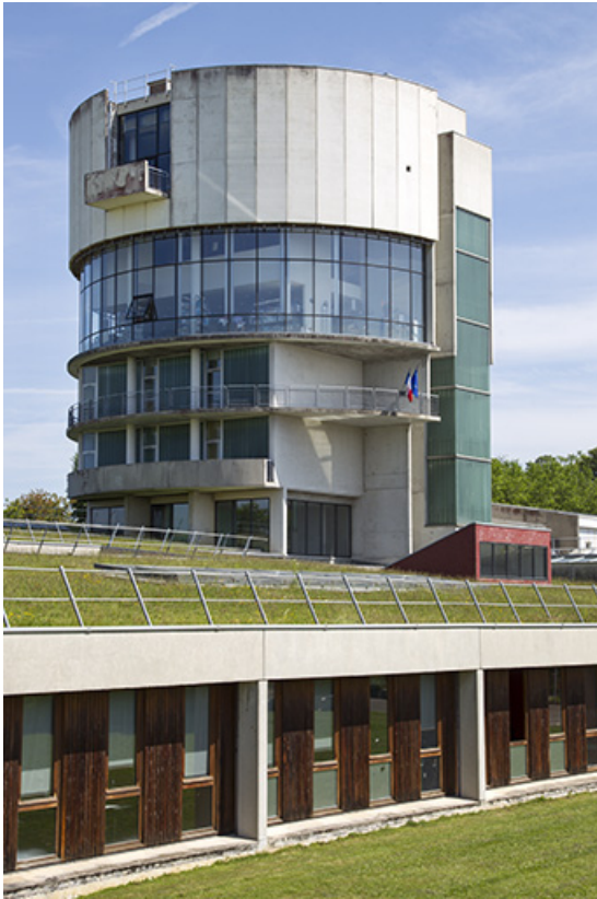
La tour et détail des façades sud de l'externat. 25, Besançon, 14 rue Alain Savary, lieudit : Temis