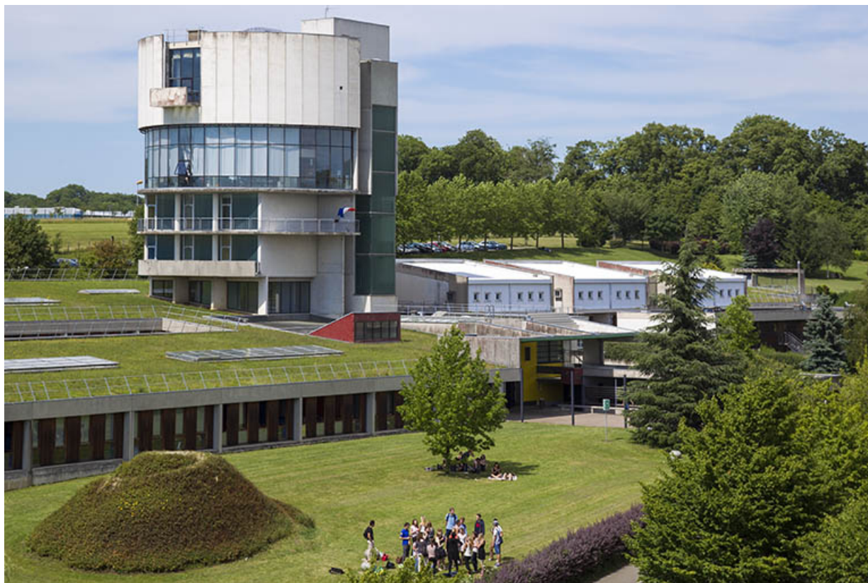
Vue de l'entrée et de la tour depuis le sud-ouest.

25, Besançon, 14 rue Alain Savary, lieudit : Temis