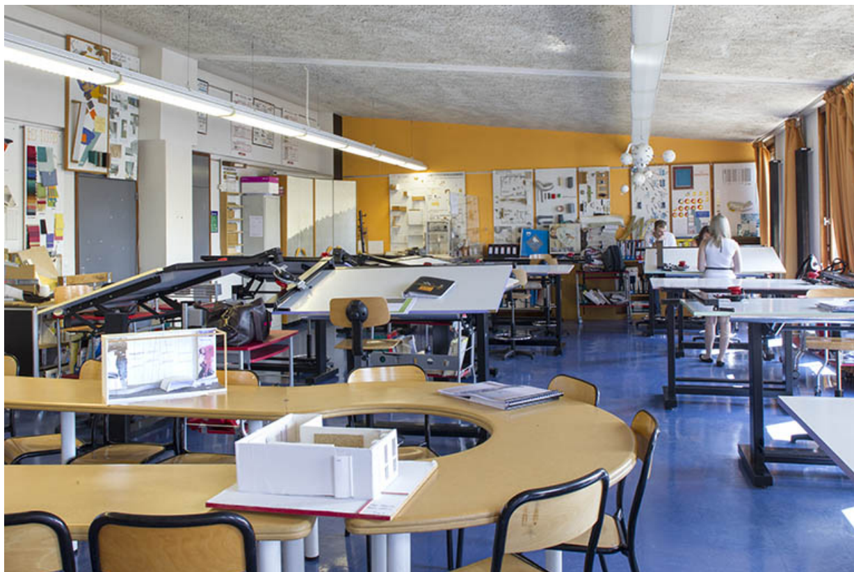
Salle de dessin au premier étage du bâtiment "agencement".

25, Besançon, 14 rue Alain Savary, lieudit : Temis