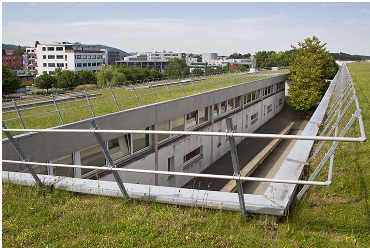
Terrasses et vue vers l'ouest de l'allée entre les bâtiments d'externat.

25, Besançon, 14 rue Alain Savary, lieudit : Temis