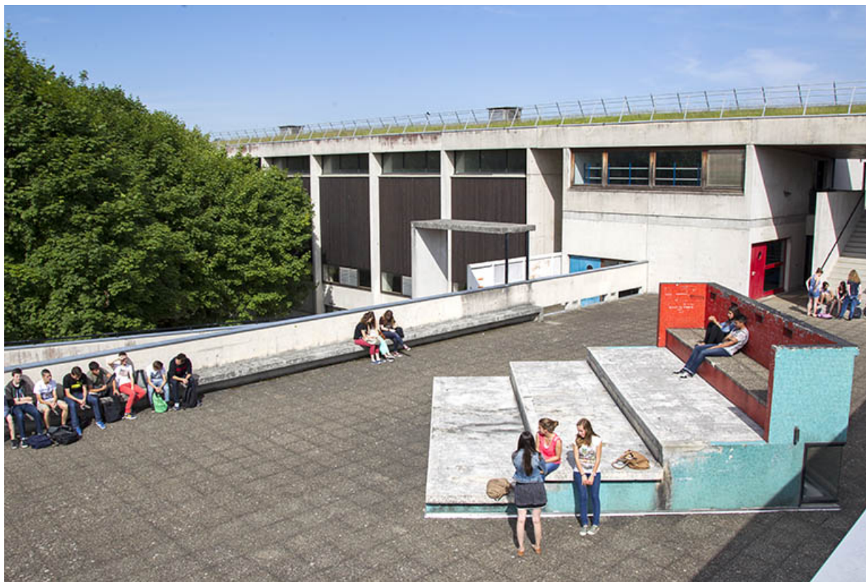
Détail de la terrasse devant la cantine au sud-ouest de l'ensemble.

25, Besançon, 14 rue Alain Savary, lieudit : Temis