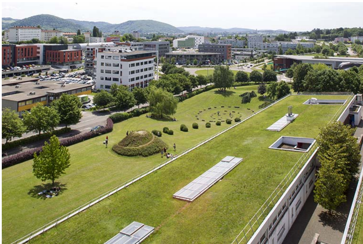
Terrasses, installation paysagère et vue sur la ville au sud.

25, Besançon, 14 rue Alain Savary, lieudit : Temis