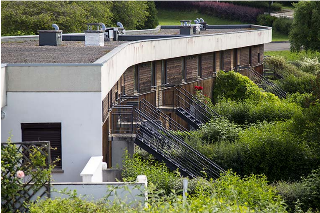
Les façades postérieures - sud - des logements vues de trois-quart ouest.

25, Besançon, 14 rue Alain Savary, lieudit : Temis