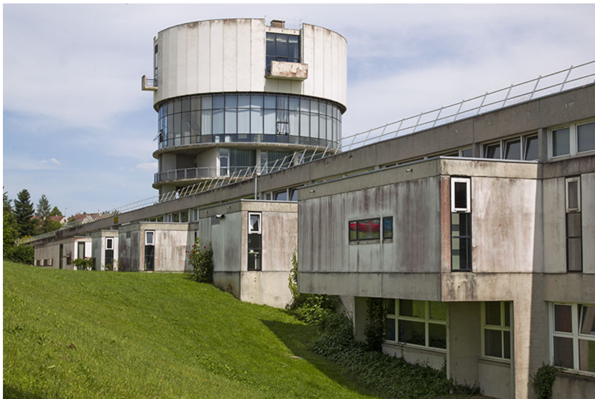
Les façades postérieures de l'externat, vues de l'ouest.

25, Besançon, 14 rue Alain Savary, lieudit : Temis