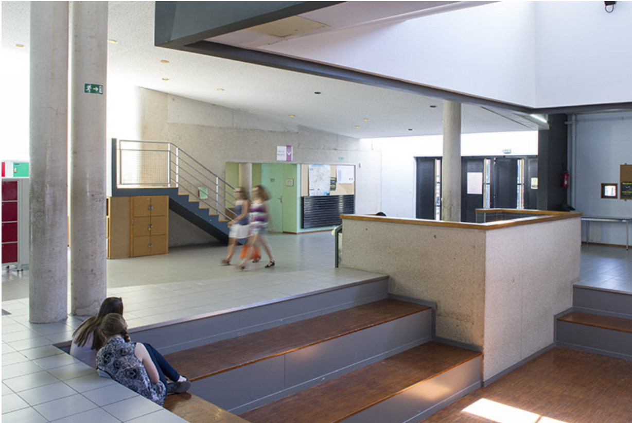
Vue intérieure du hall d'entrée.

25, Besançon, 14 rue Alain Savary, lieudit : Temis