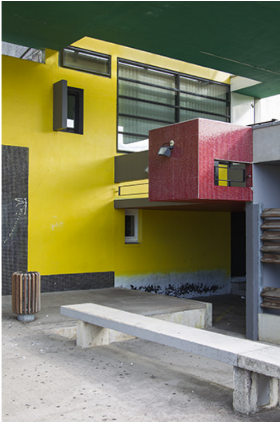
Détail constructif à droite de l'entrée.

25, Besançon, 14 rue Alain Savary, lieudit : Temis