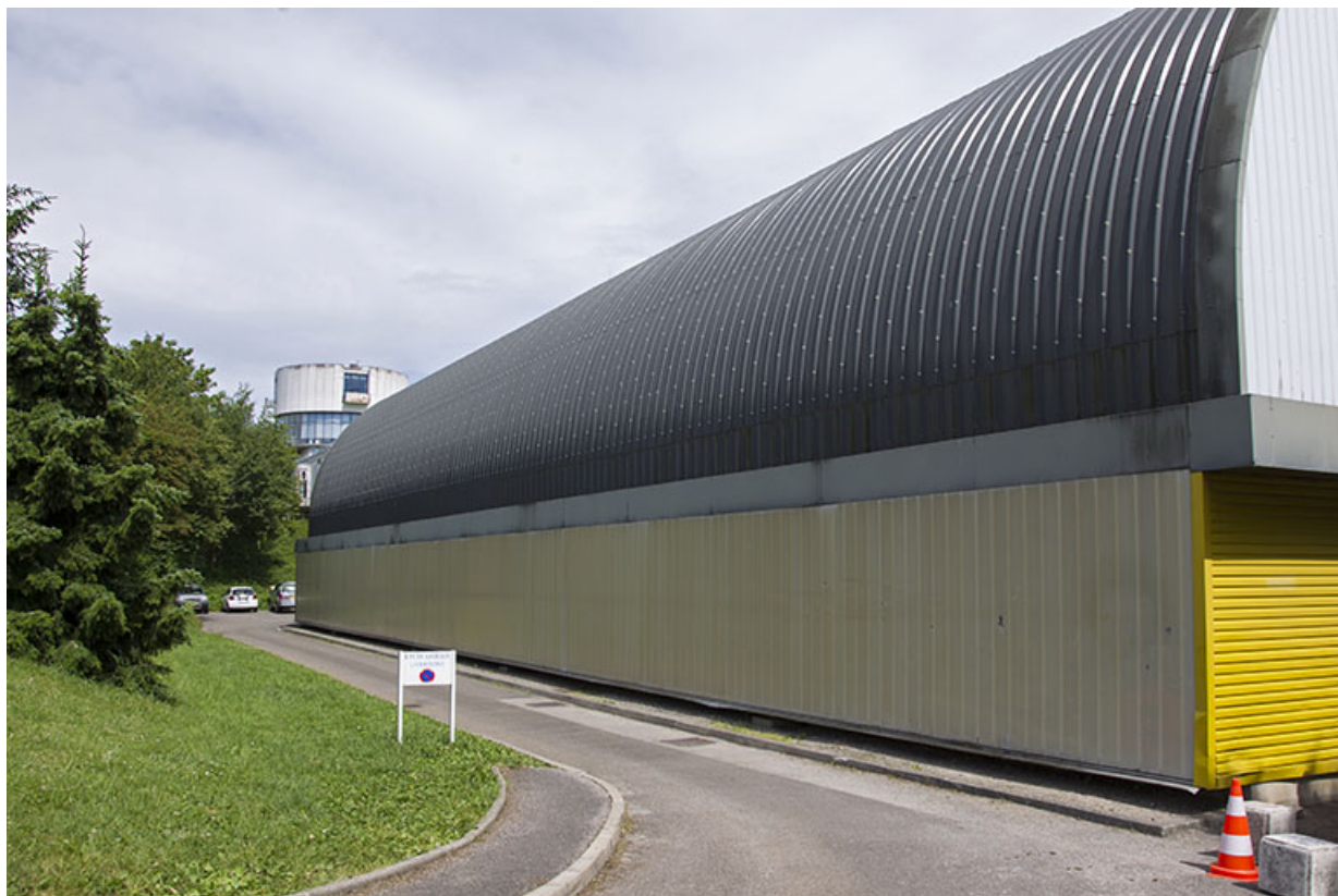
Vue postérieure du gymnase, angle nord-ouest.

25, Besançon, 14 rue Alain Savary, lieudit : Temis