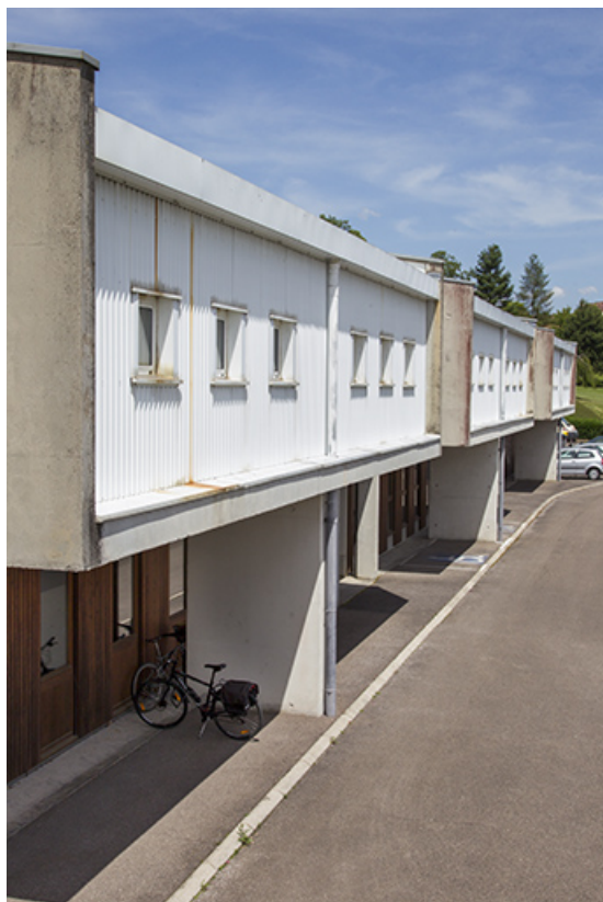
Façades antérieures (sud) du bâtiment "agencement", vues de trois-quart. 25, Besançon, 14 rue Alain Savary, lieudit : Temis