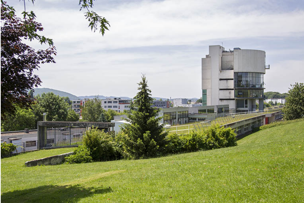
Vue d'ensemble des façades postérieures depuis le nord-est.

25, Besançon, 14 rue Alain Savary, lieudit : Temis