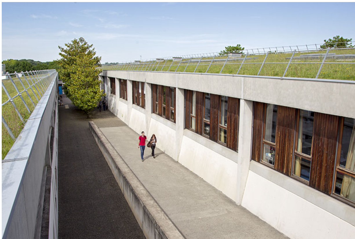
Vue vers l'ouest de l'allée entre les bâtiments d'externat.

25, Besançon, 14 rue Alain Savary, lieudit : Temis