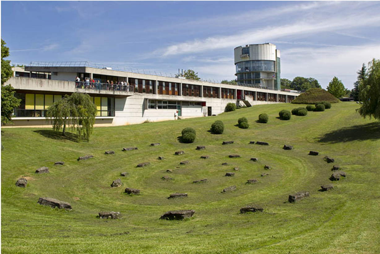
Vue partielle sur l'installation paysagère et les façades antérieures depuis le sud-ouest.

25, Besançon, 14 rue Alain Savary, lieudit : Temis