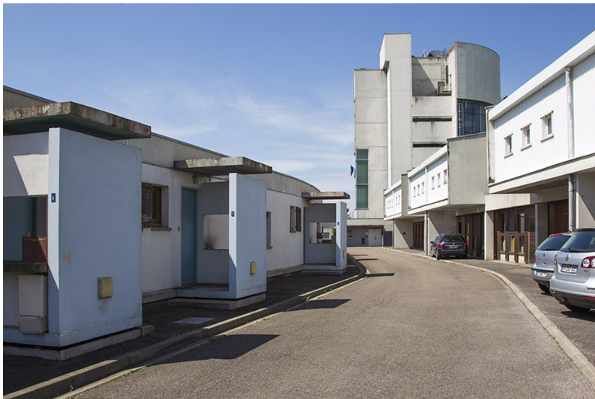
Entre les façades antérieures des logements et le bâtiment "agencement".

25, Besançon, 14 rue Alain Savary, lieudit : Temis