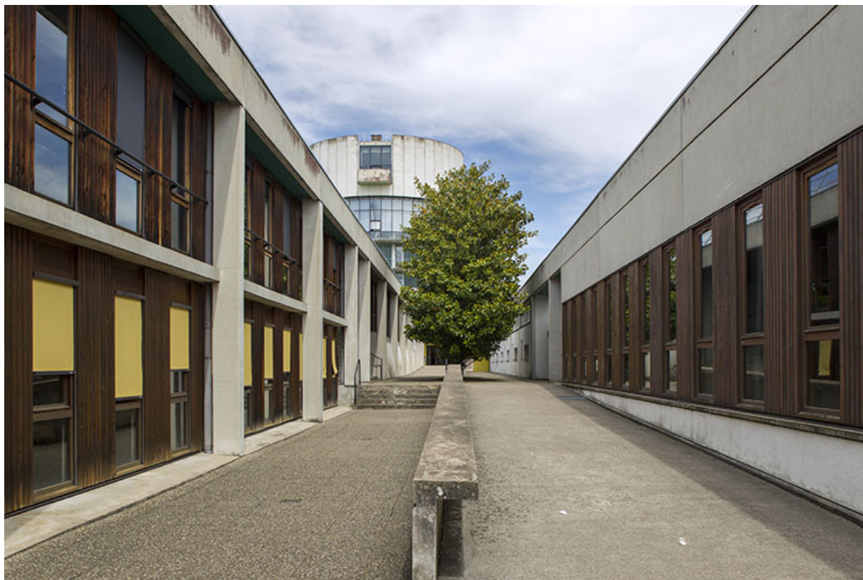
Vue vers l'est de l'allée entre les bâtiments d'externat.

25, Besançon, 14 rue Alain Savary, lieudit : Temis