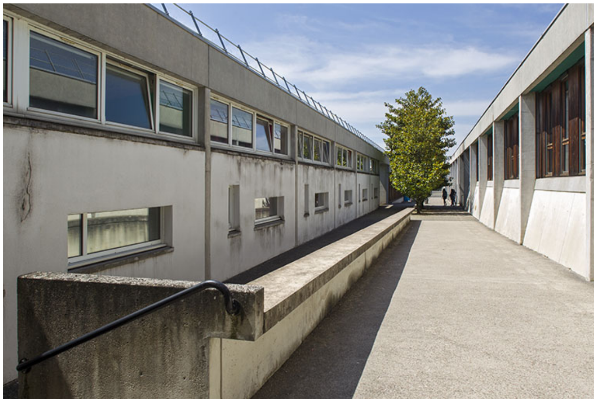
Vue vers l'ouest de l'allée entre les bâtiments d'externat.

25, Besançon, 14 rue Alain Savary, lieudit : Temis