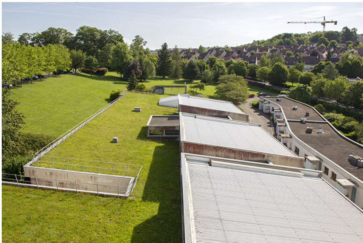
Vue d'ensemble des terrasses au nord-est.

25, Besançon, 14 rue Alain Savary, lieudit : Temis