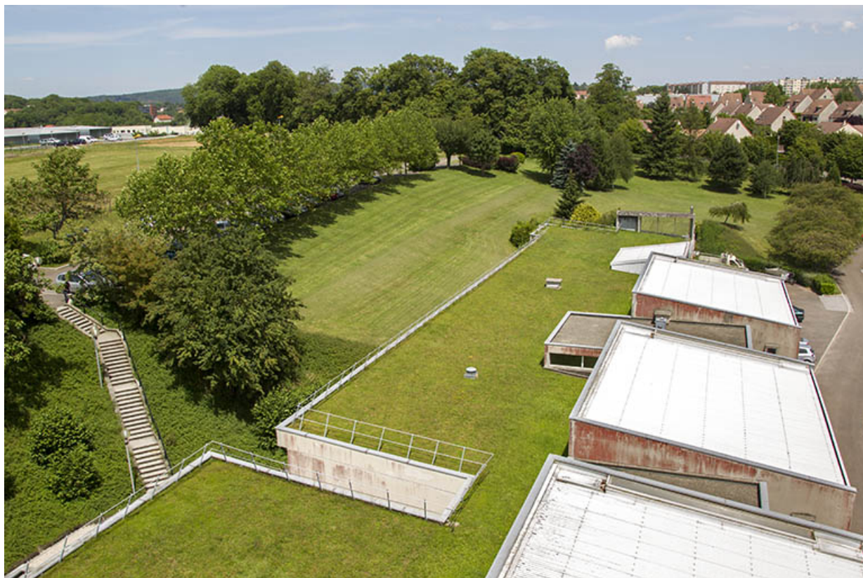
Détail de toiture et escalier indépendant desservant la façade postérieure au nord.

25, Besançon, 14 rue Alain Savary, lieudit : Temis