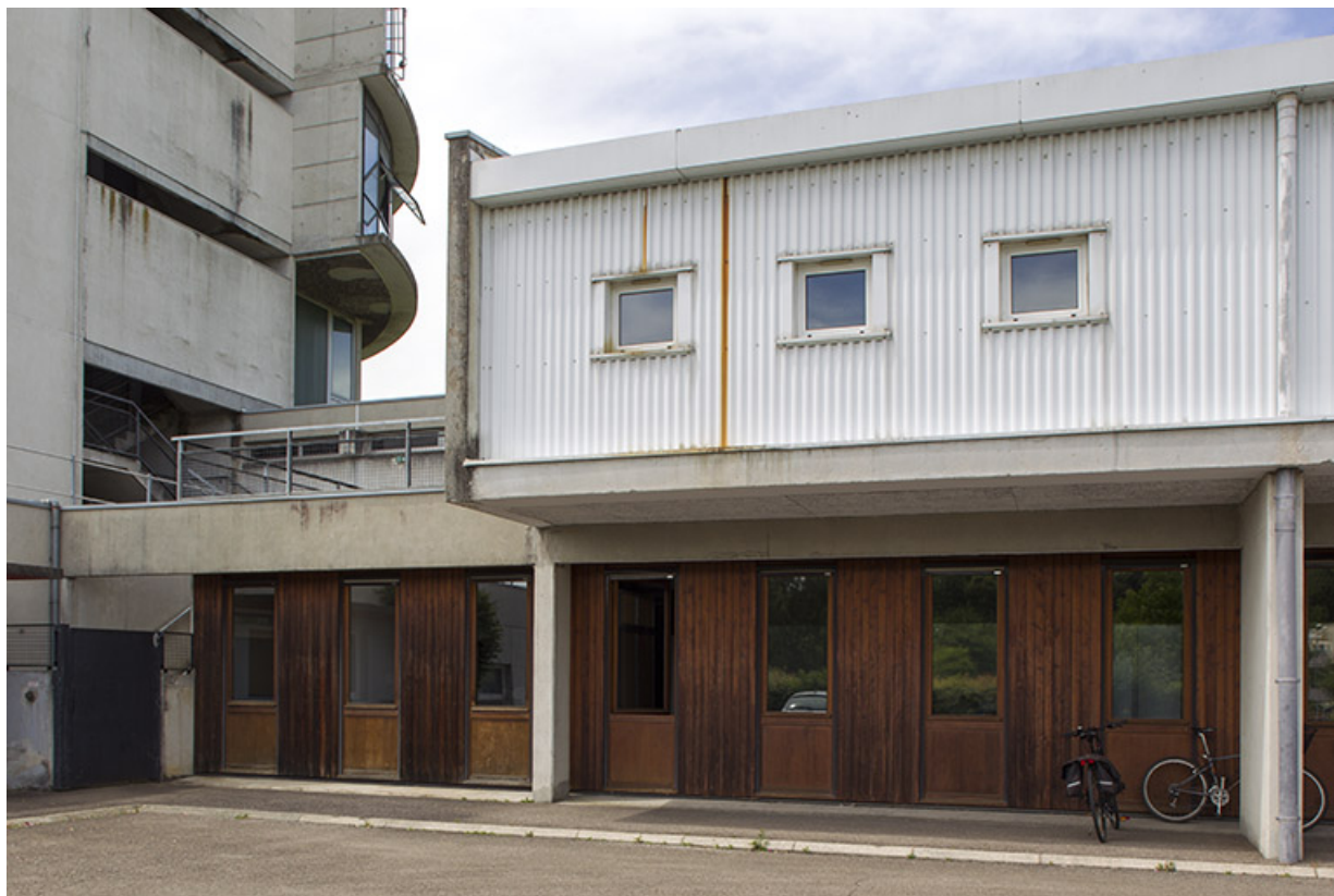
Entrée au rez-de-chaussée du bâtiment "agencement".

25, Besançon, 14 rue Alain Savary, lieudit : Temis