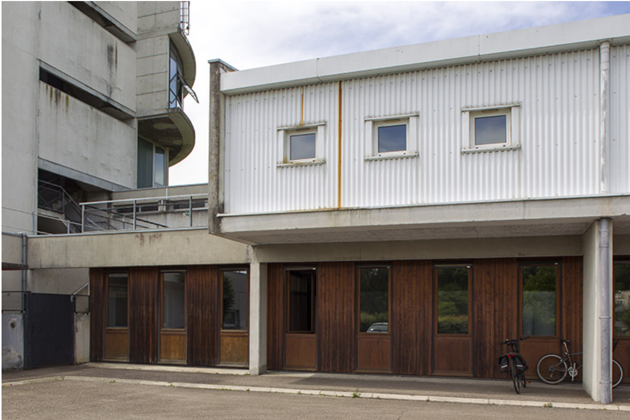
Entrée au rez-de-chaussée du bâtiment "agencement".

25, Besançon, 14 rue Alain Savary, lieudit : Temis