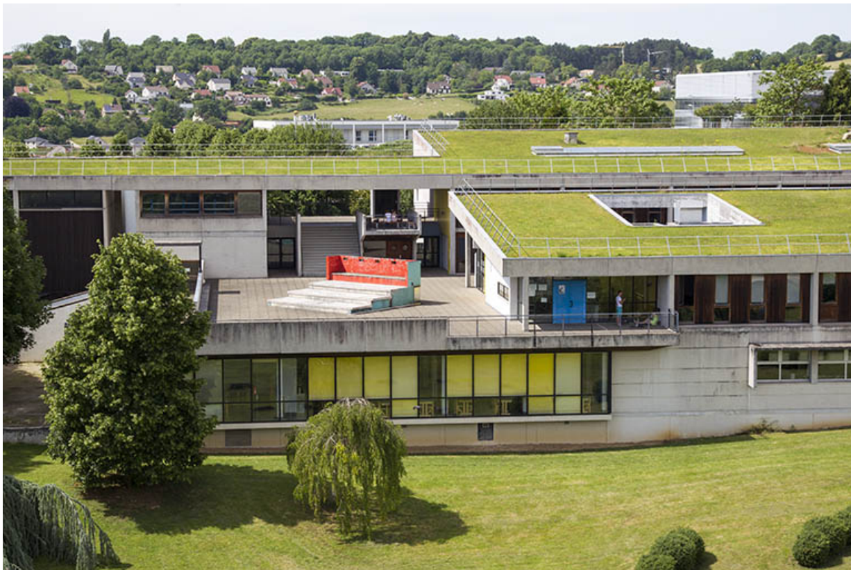
Détail des façades antérieures (sud) et des terrasses, devant la cantine, à l'ouest de l'ensemble. 25, Besançon, 14 rue Alain Savary, lieudit : Temis