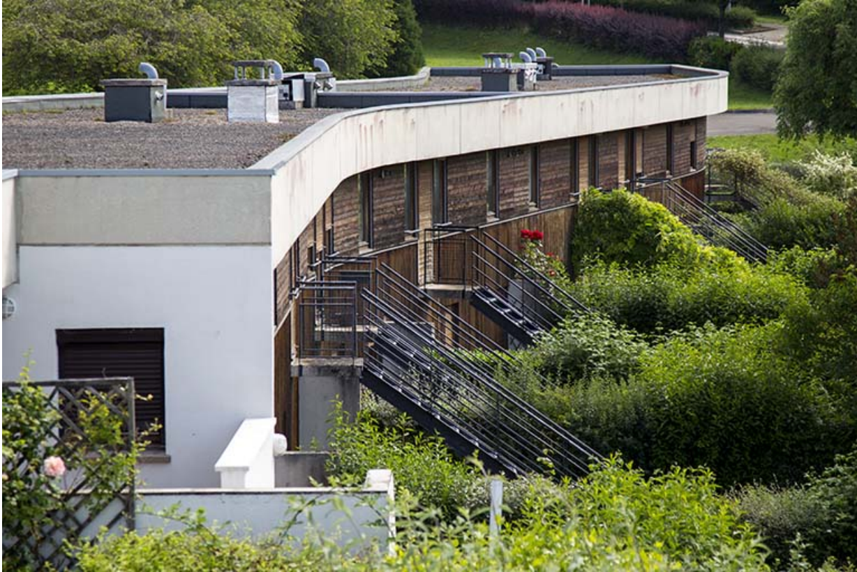
Les façades postérieures - sud - des logements vues de trois-quart ouest.

25, Besançon, 14 rue Alain Savary, lieudit : Temis