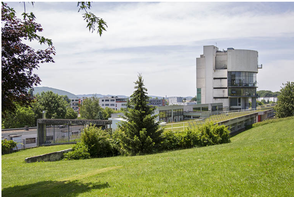
Vue d'ensemble des façades postérieures depuis le nord-est.

25, Besançon, 14 rue Alain Savary, lieudit : Temis