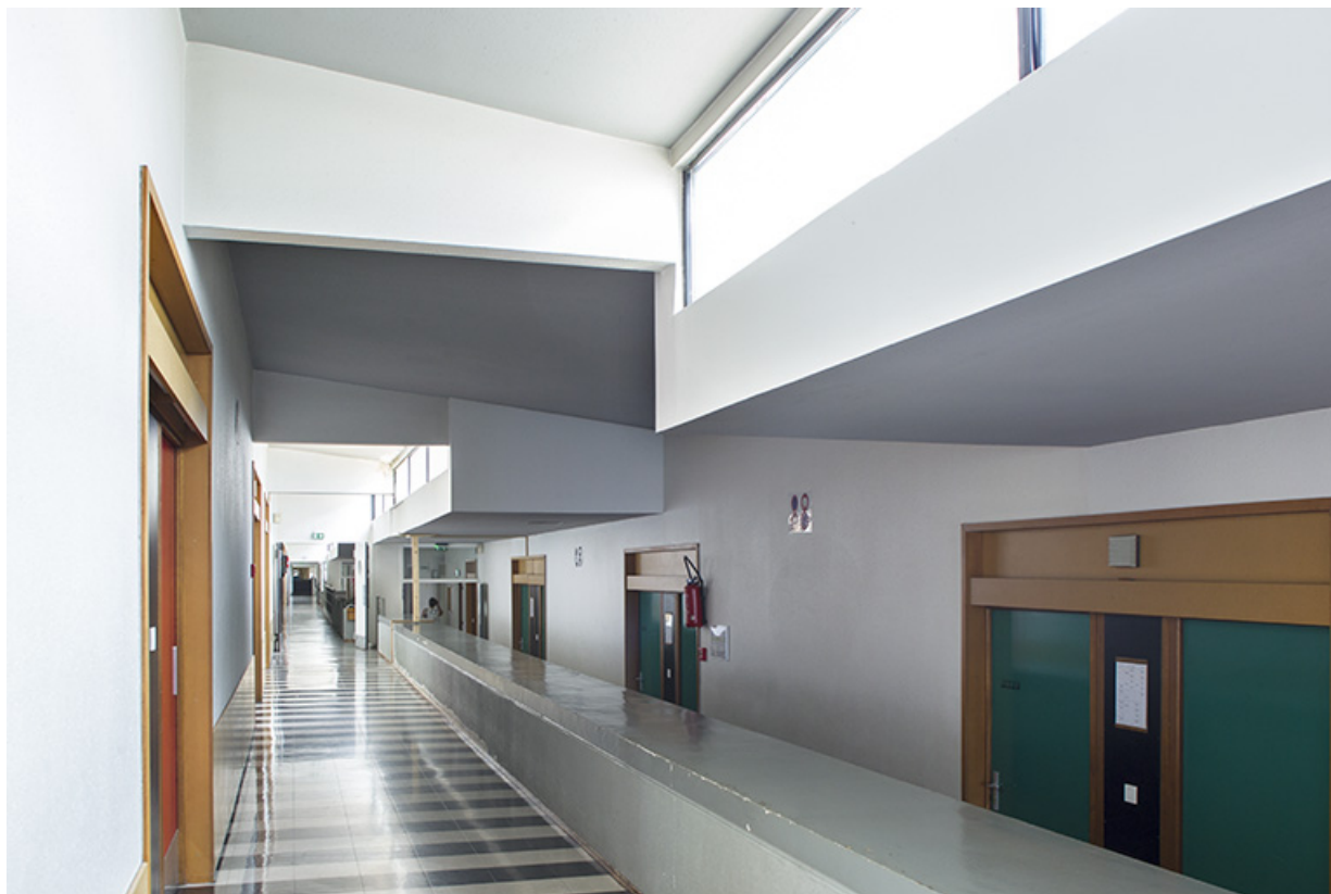
Couloir du bâtiment d'externat.

25, Besançon, 14 rue Alain Savary, lieudit : Temis