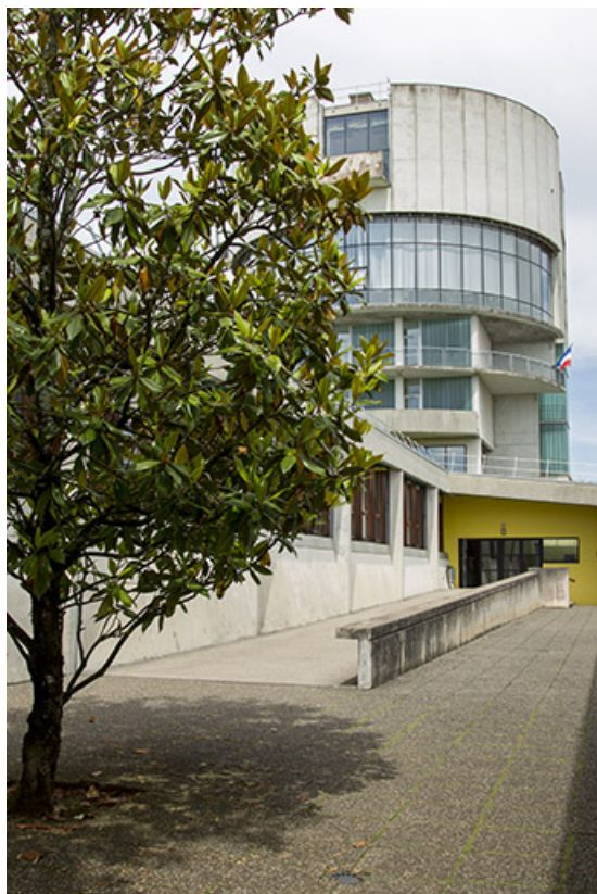
La tour vue entre les façades de l'externat depuis le sud-ouest.

25, Besançon, 14 rue Alain Savary, lieudit : Temis