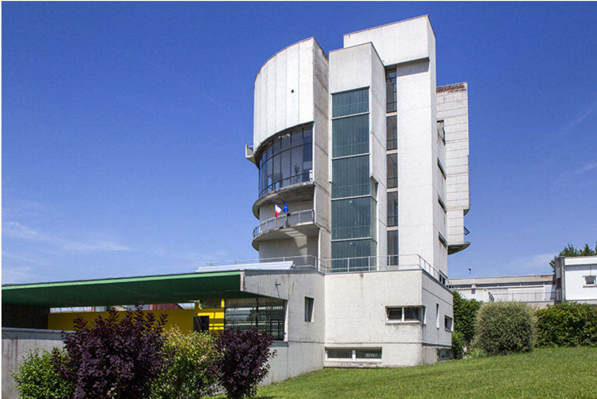
La tour et l'entrée, vues de l'est.

25, Besançon, 14 rue Alain Savary, lieudit : Temis