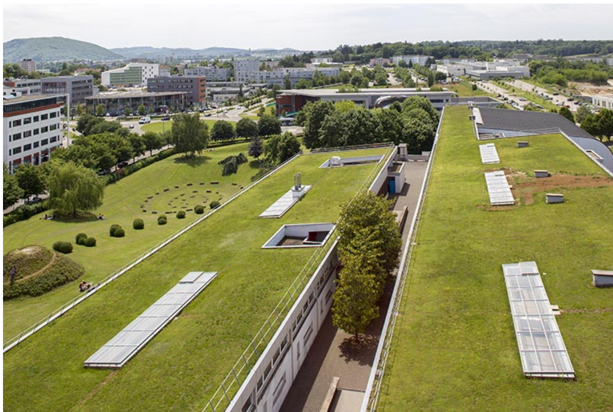
Depuis la tour, vue d'ensemble sur la partie sud-ouest.

25, Besançon, 14 rue Alain Savary, lieudit : Temis