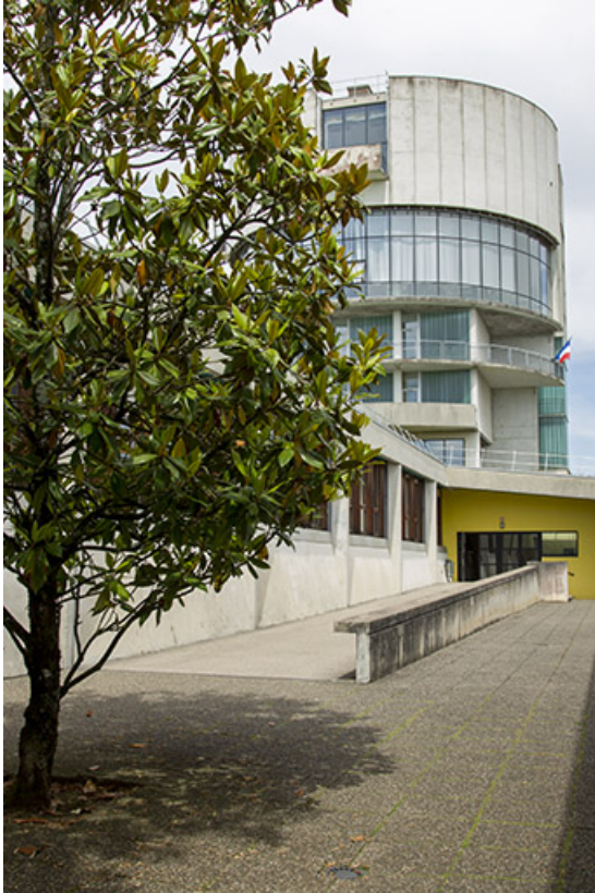
La tour vue entre les façades de l'externat depuis le sud-ouest.

25, Besançon, 14 rue Alain Savary, lieudit : Temis