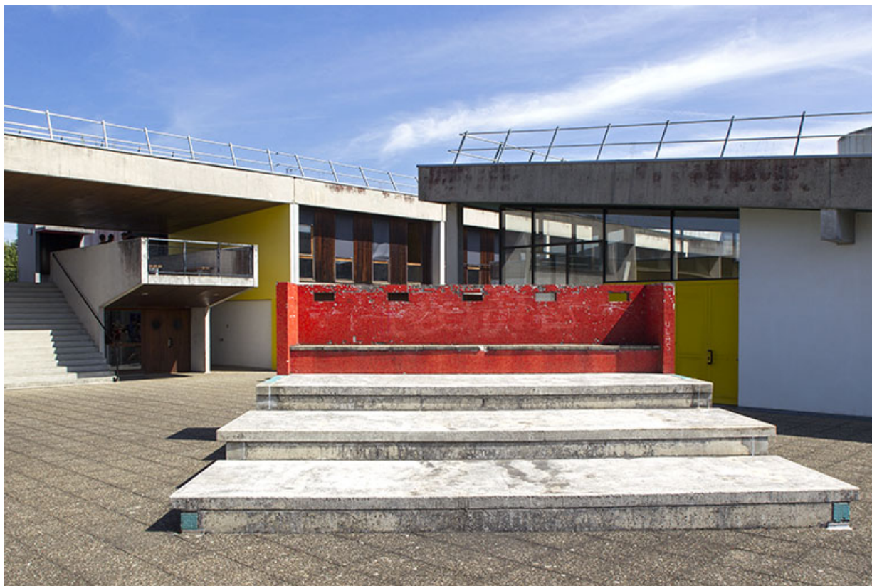
Détail de la terrasse devant la cantine au sud-ouest de l'ensemble.

25, Besançon, 14 rue Alain Savary, lieudit : Temis