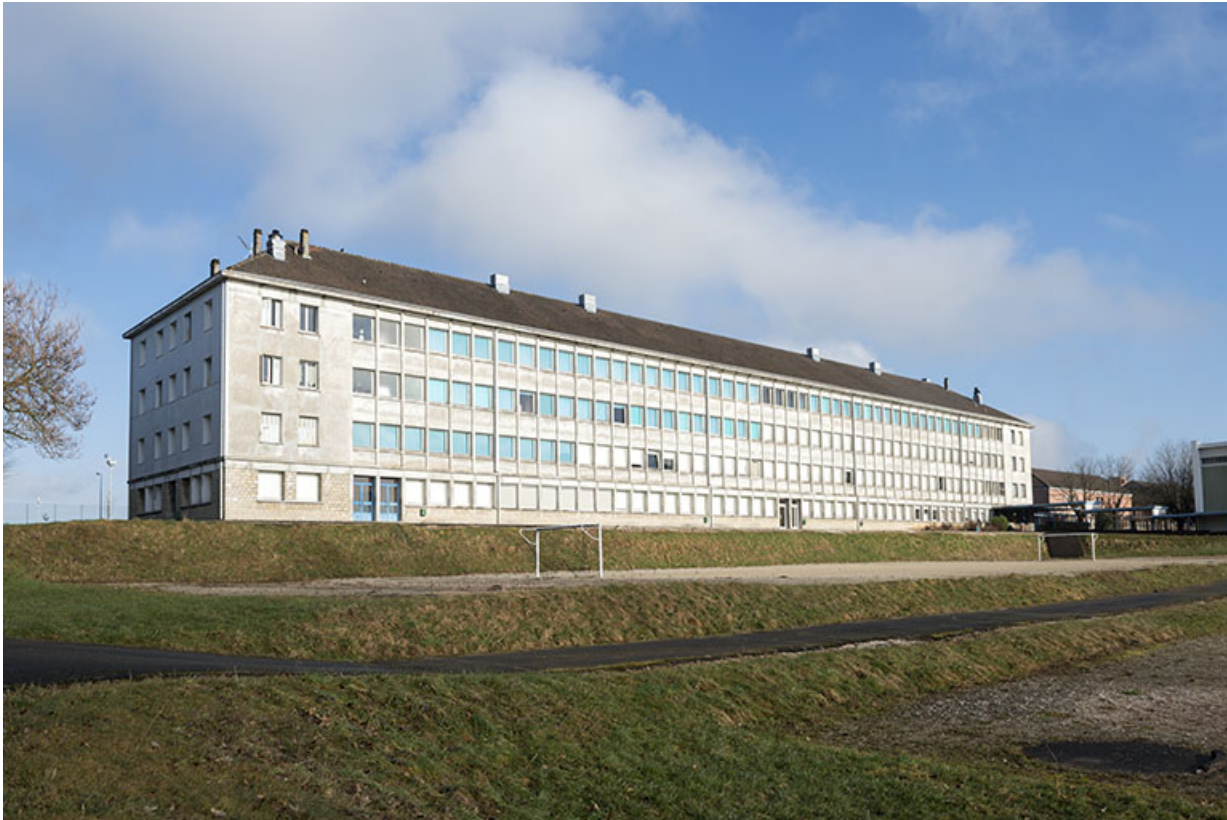
Vue de trois-quart est de la façade sud-est de l'internat de filles.

25, Besançon, 91, 93 boulevard Léon Blum, lieudit : Palente