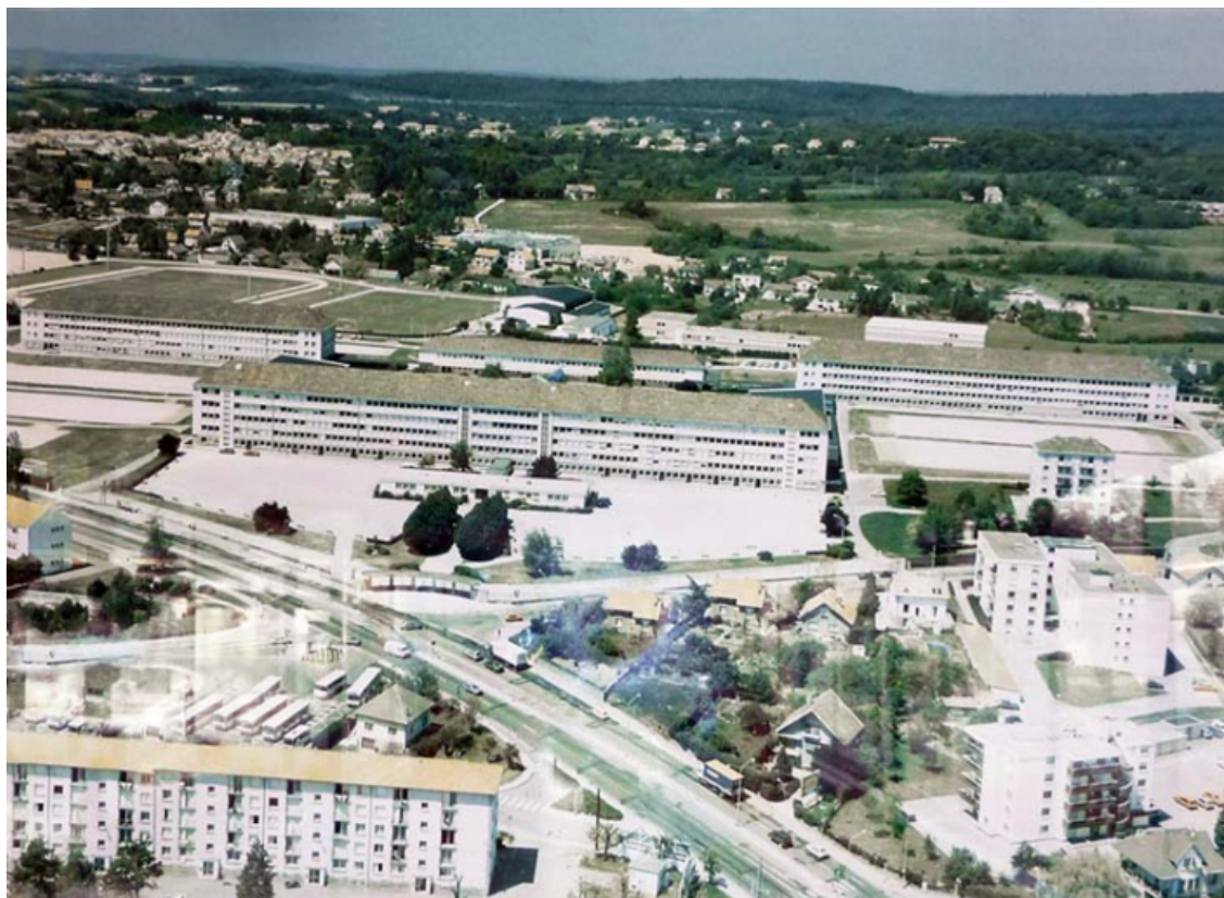
Vue aérienne du lycée (sans date).

25, Besançon, 91, 93 boulevard Léon Blum, lieudit : Palente