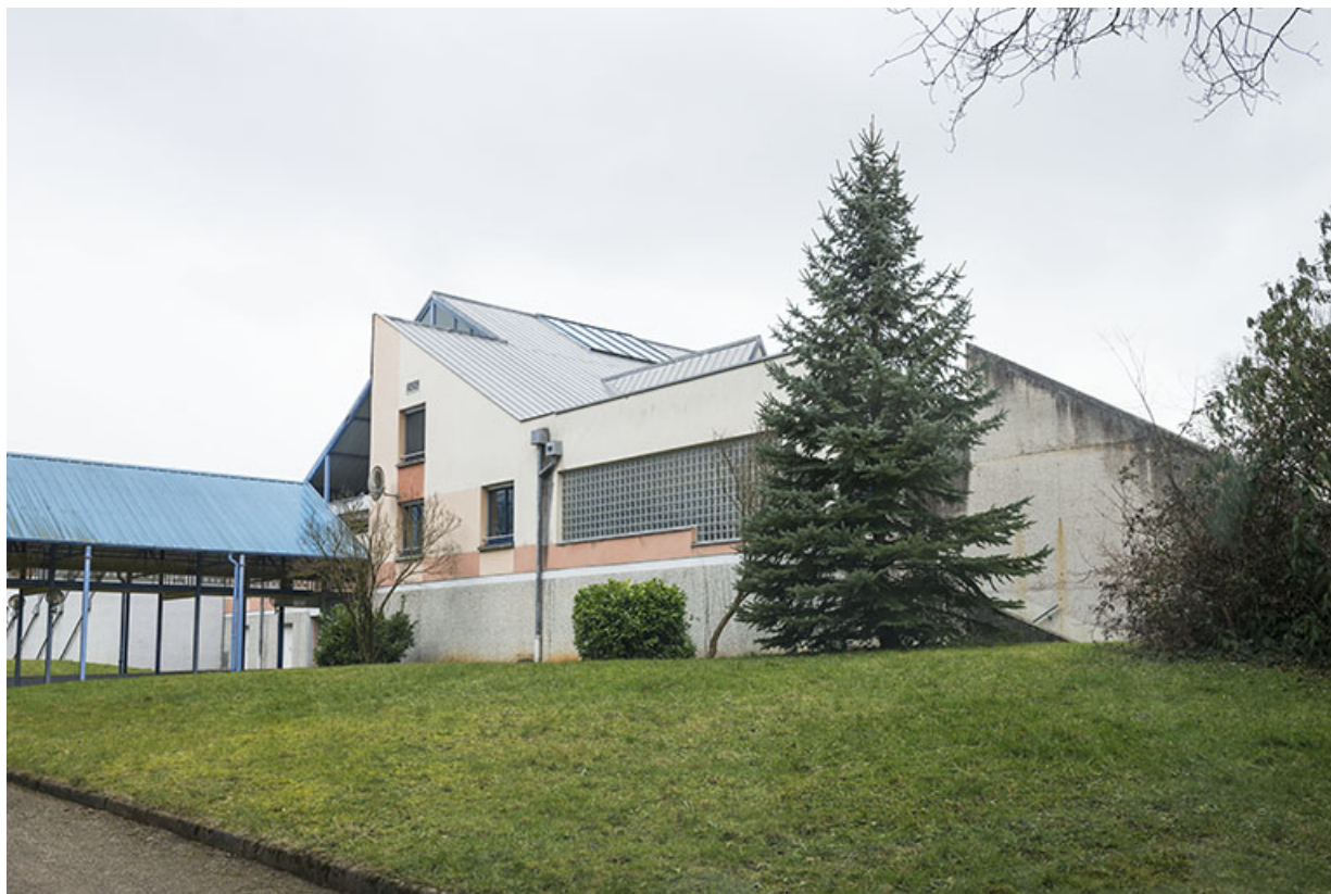
Vue de trois-quart est de la façade postérieure sud-est du cdi et circulation abritée vers l'externat.

25, Besançon, 91, 93 boulevard Léon Blum, lieudit : Palente