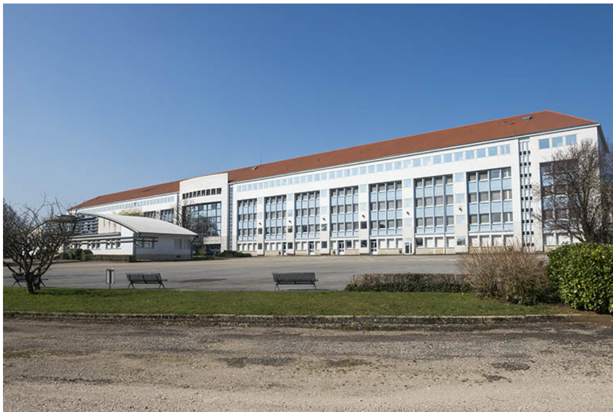
Vue générale de l'externat et de l'administration depuis la cour est.

25, Besançon, 91, 93 boulevard Léon Blum, lieudit : Palente