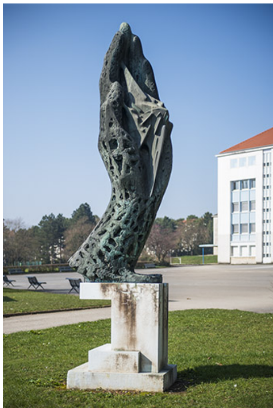
L'oeuvre d'Oudot dans son contexte.