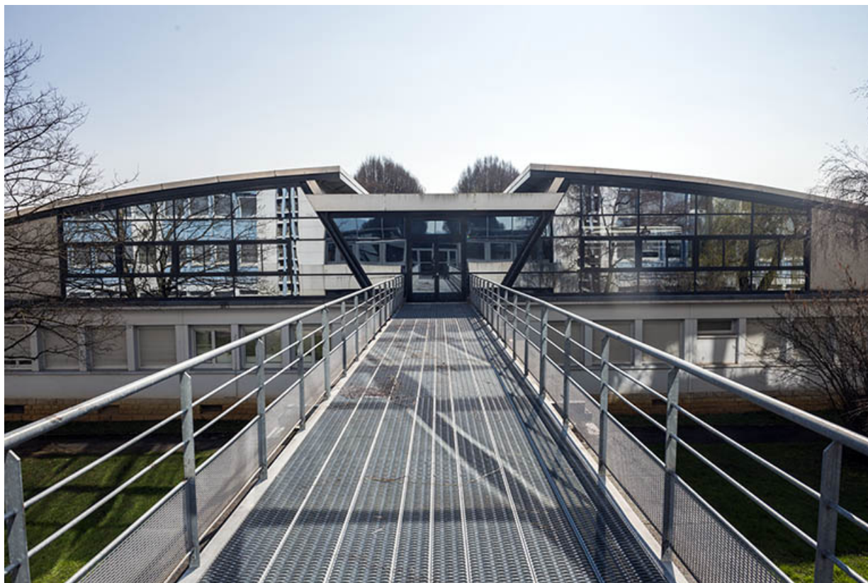
Passerelle menant de l'externat au bâtiment de l'administration.

25, Besançon, 91, 93 boulevard Léon Blum, lieudit : Palente