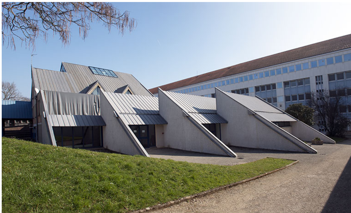
Vue du centre de documentation et d'information depuis le nord-ouest et façade postérieure de l'externat. 25, Besançon, 91, 93 boulevard Léon Blum, lieudit : Palente