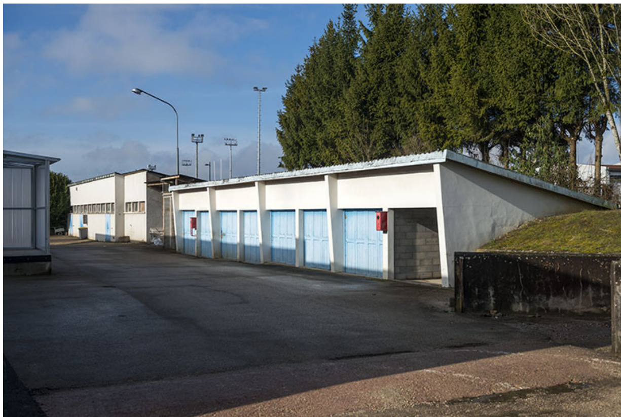
Façades sud-est des ateliers au nord-ouest de la parcelle, derrière les services communs, vus de l'est. 25, Besançon, 91, 93 boulevard Léon Blum, lieudit : Palente