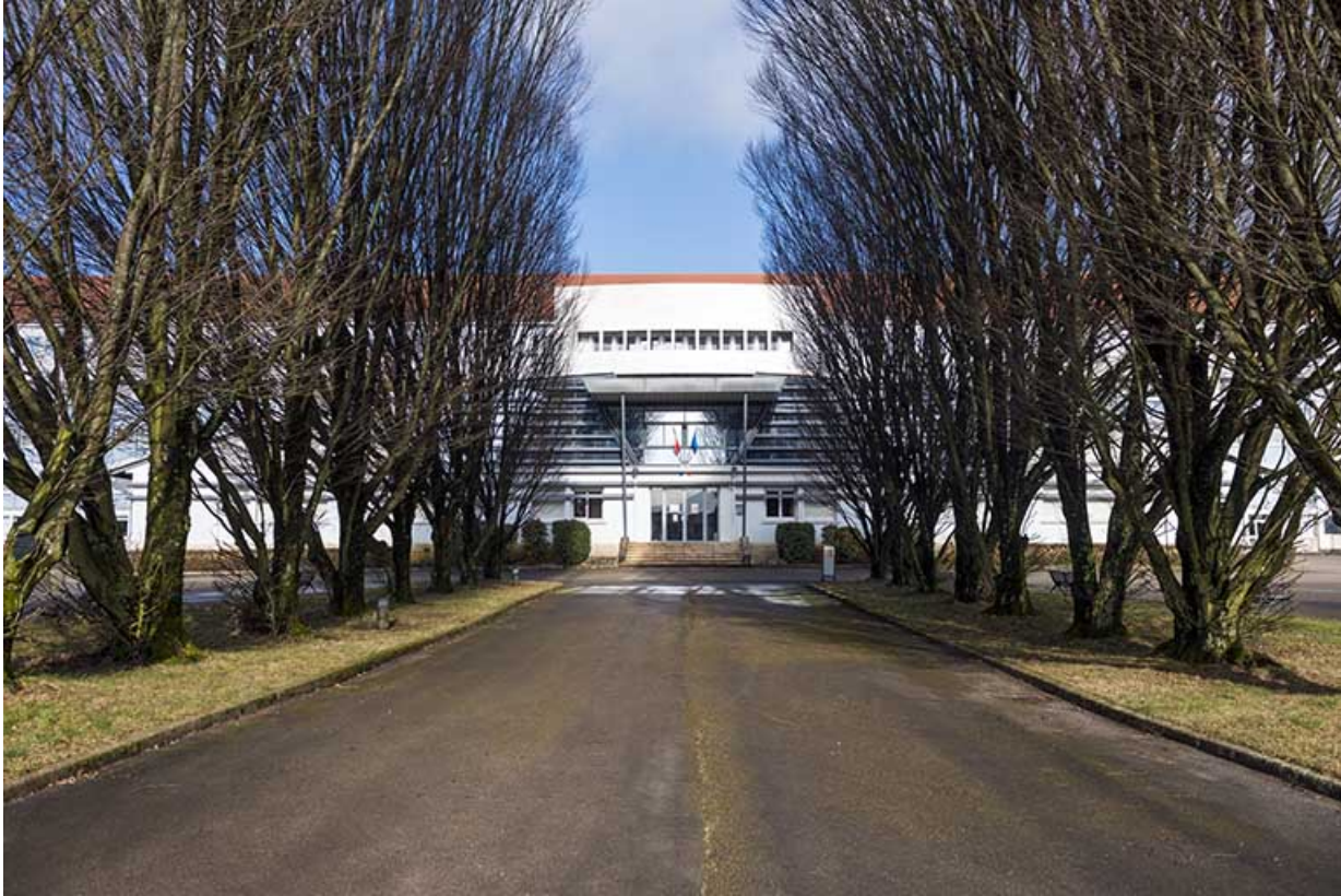
L'allée de l'entrée principale vers la façade sud-est de l'administration.

25, Besançon, 91, 93 boulevard Léon Blum, lieudit : Palente