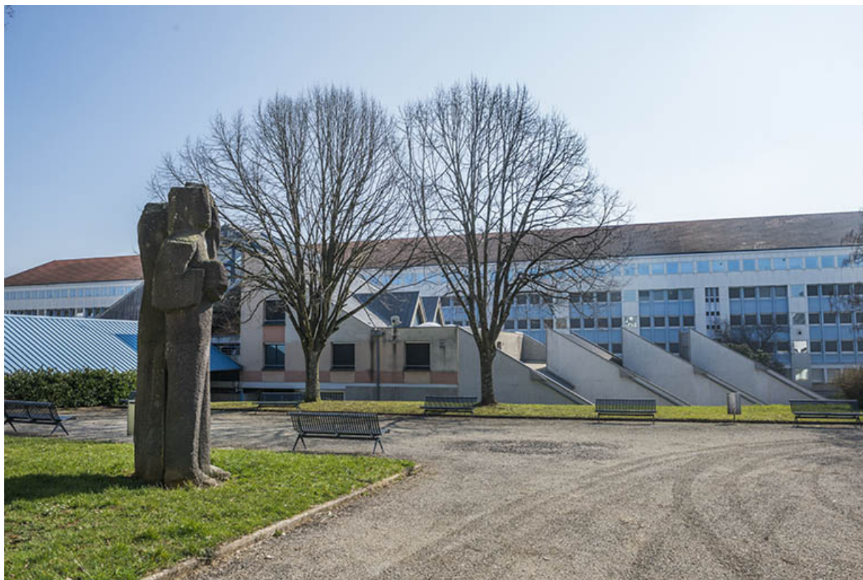
Le groupe sculpté devant les façades postérieures du centre de documentation et d'information et de l'externat. 91, 93 boulevard Léon Blum