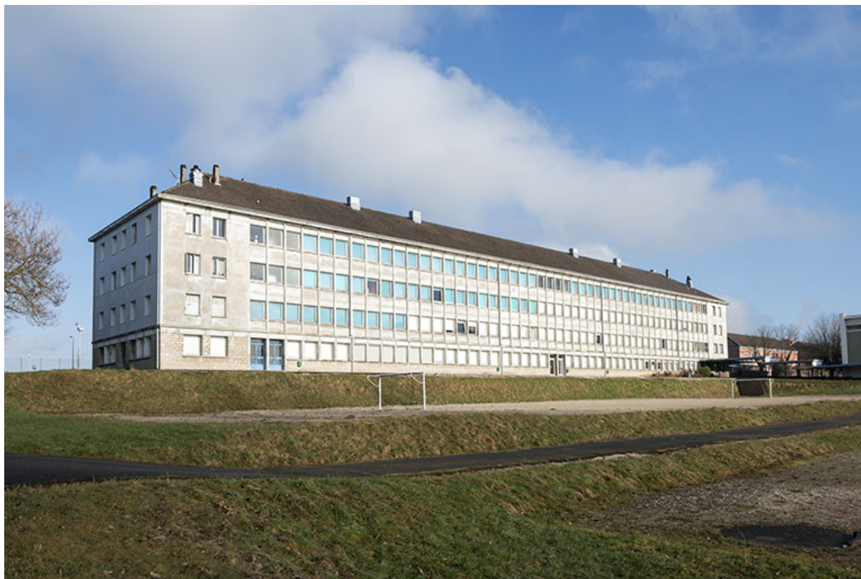
Vue de trois-quart est de la façade sud-est de l'internat de filles.

25, Besançon, 91, 93 boulevard Léon Blum, lieudit : Palente