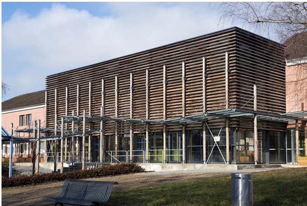
Vue rapprochée de trois-quart de l'entrée sur la façade antérieure sud-est des services communs.

25, Besançon, 91, 93 boulevard Léon Blum, lieudit : Palente