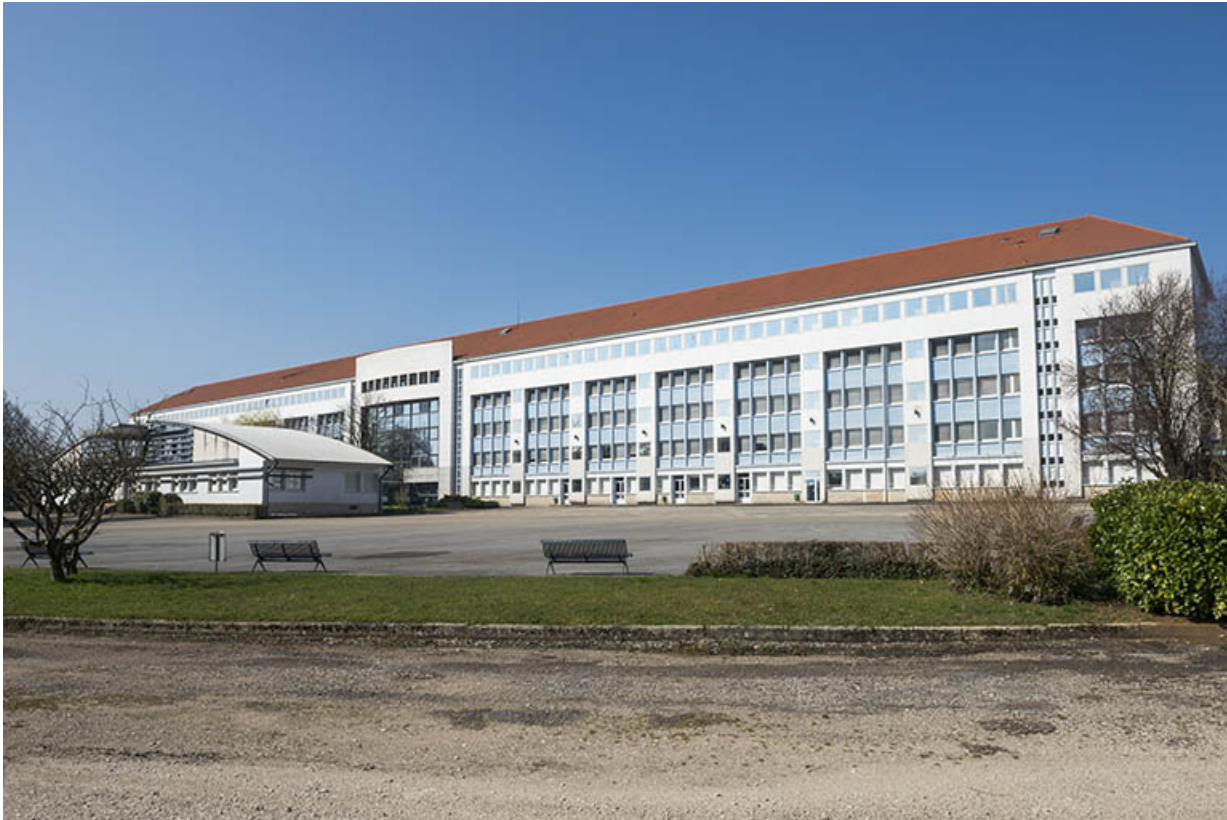
Vue générale de l'externat et de l'administration depuis la cour est.

25, Besançon, 91, 93 boulevard Léon Blum, lieudit : Palente