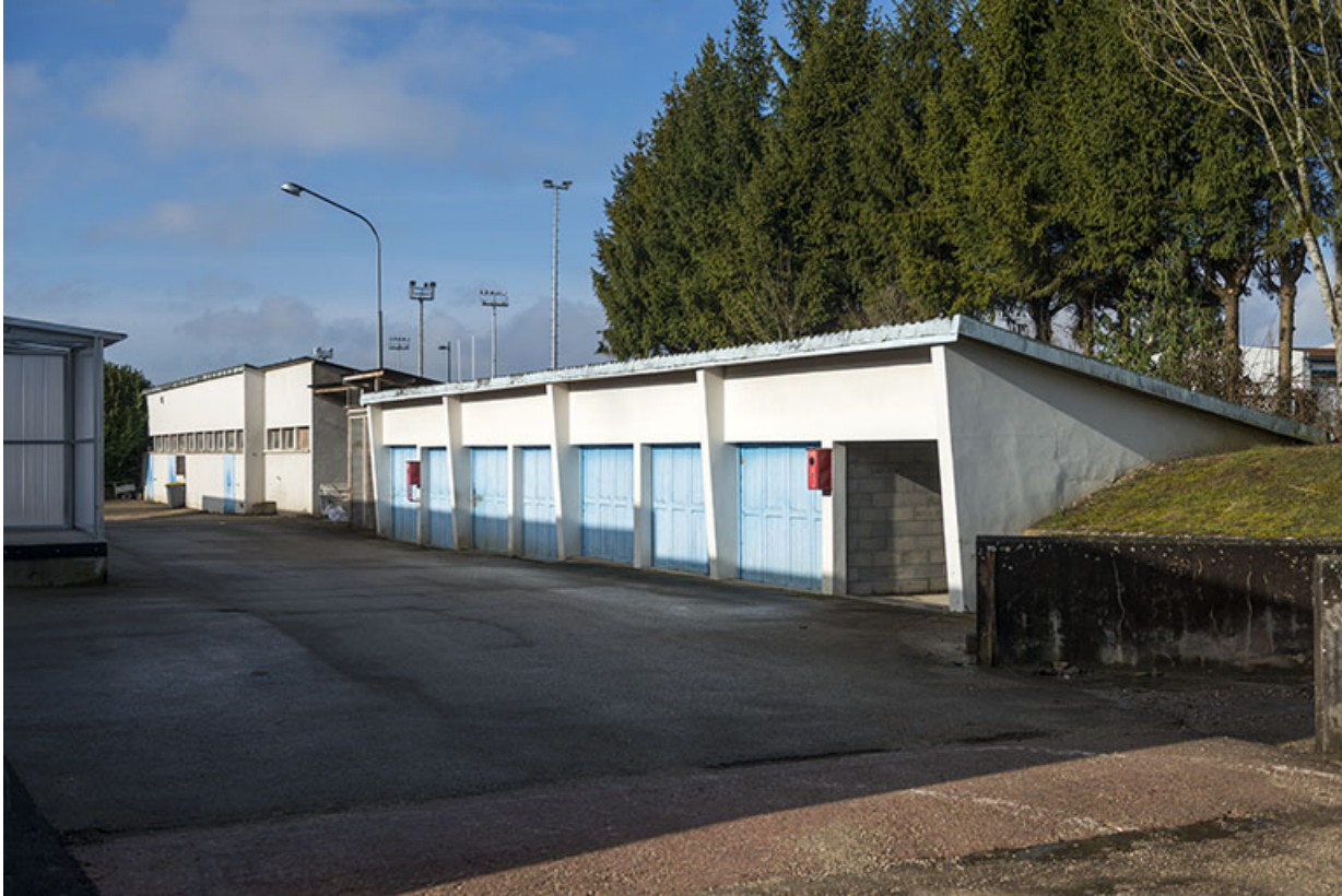
Façades sud-est des ateliers au nord-ouest de la parcelle, derrière les services communs, vus de l'est. 25, Besançon, 91, 93 boulevard Léon Blum, lieudit : Palente