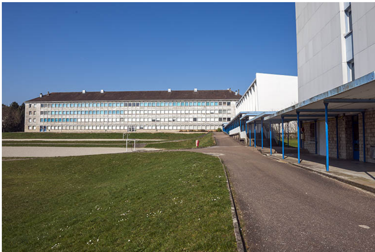
Vue de la façade sud de l'internat de garçons.

25, Besançon, 91, 93 boulevard Léon Blum, lieudit : Palente