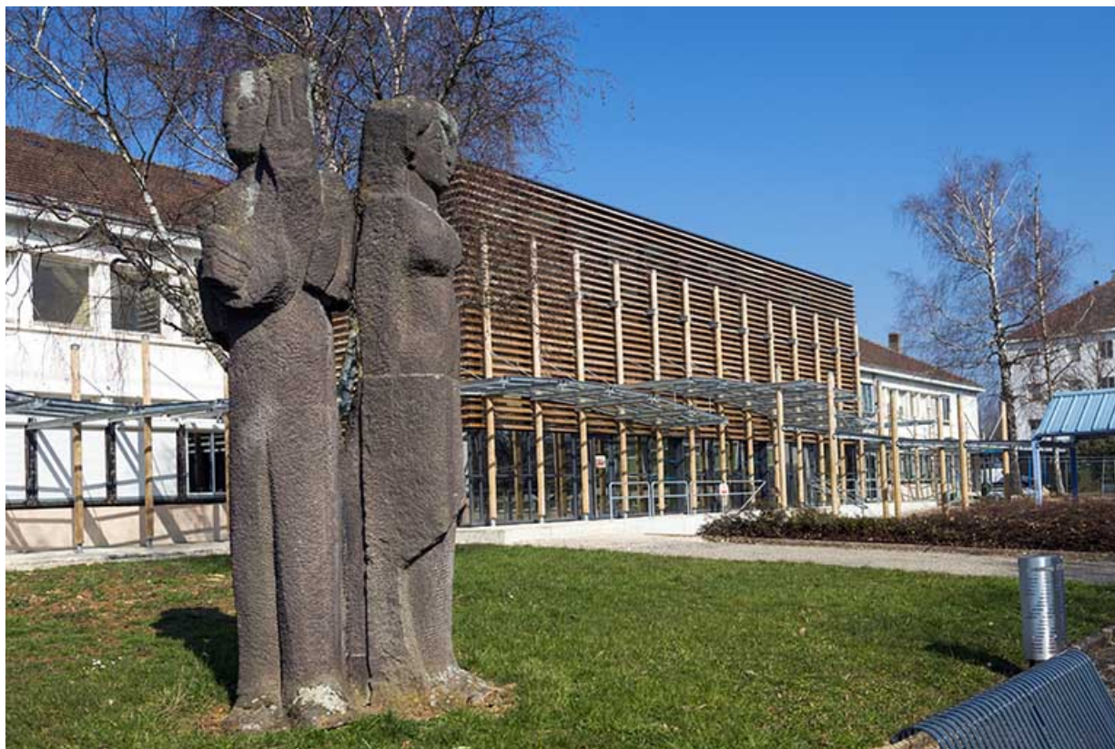
Le groupe sculpté de Salomé Venard dans son contexte. 91, 93 boulevard Léon Blum