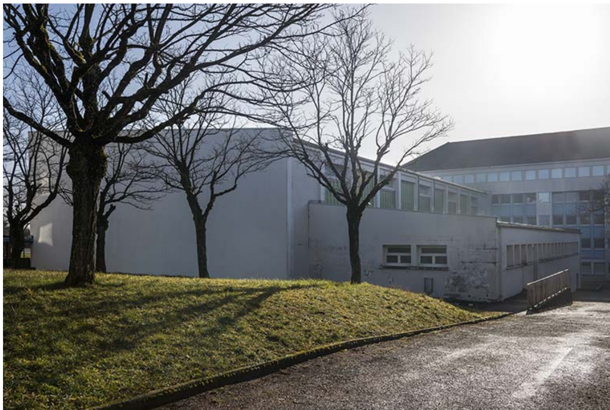
Vue de trois-quart nord-ouest du gymnase de filles.

25, Besançon, 91, 93 boulevard Léon Blum, lieudit : Palente