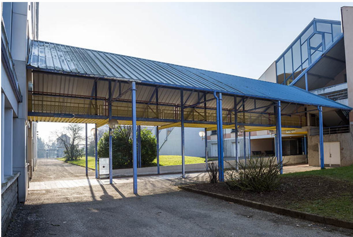
Passage couvert reliant l'externat au centre de documentation et d'information.

25, Besançon, 91, 93 boulevard Léon Blum, lieudit : Palente