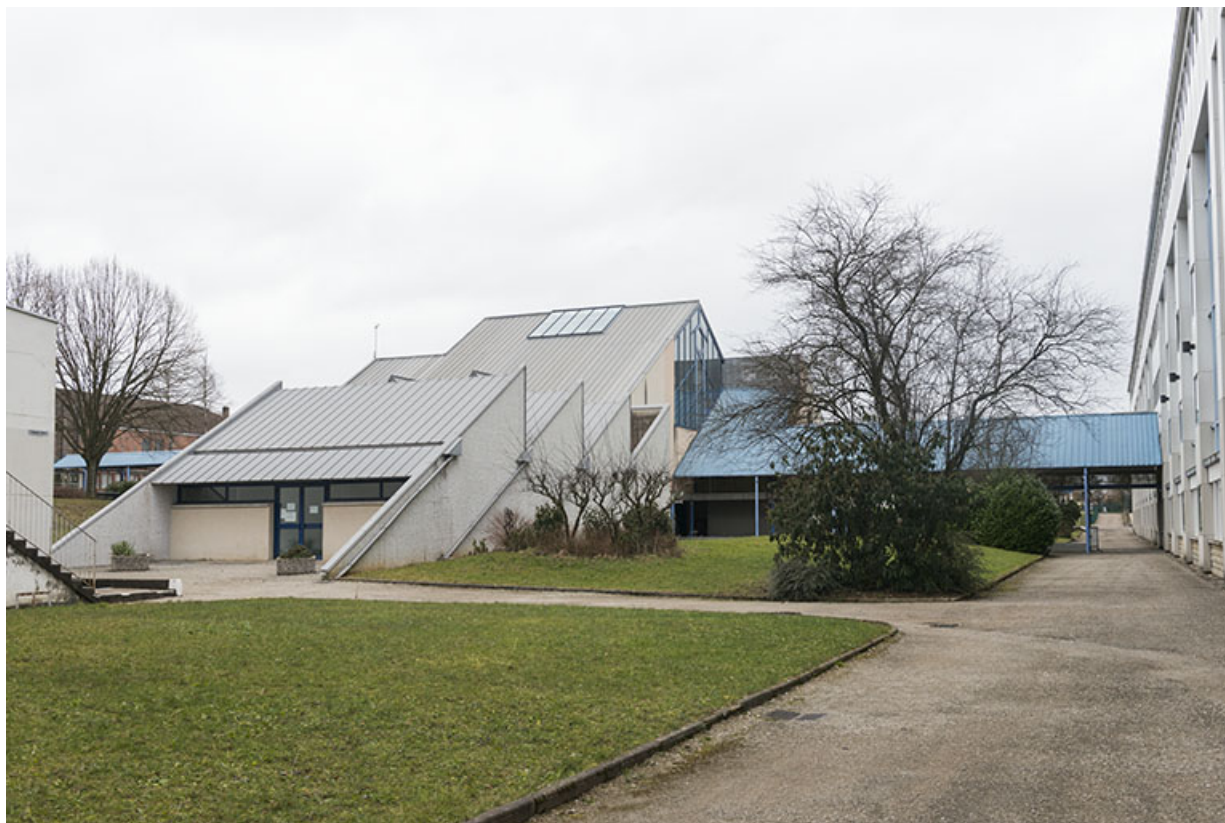
Vue du centre de documentation et d'information depuis le sud-ouest le long de la façade postérieure de l'externat. 25, Besançon, 91, 93 boulevard Léon Blum, lieudit : Palente