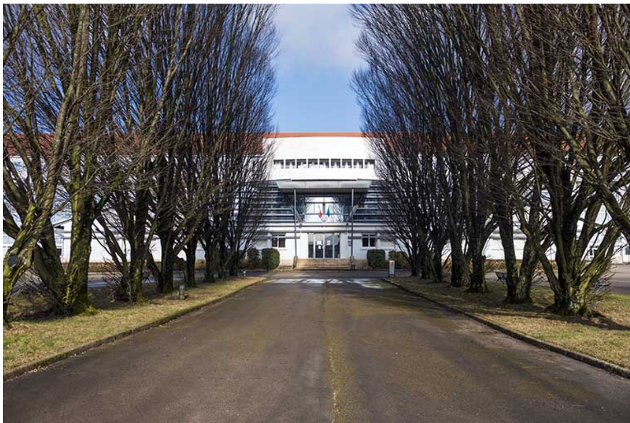
L'allée de l'entrée principale vers la façade sud-est de l'administration.

25, Besançon, 91, 93 boulevard Léon Blum, lieudit : Palente