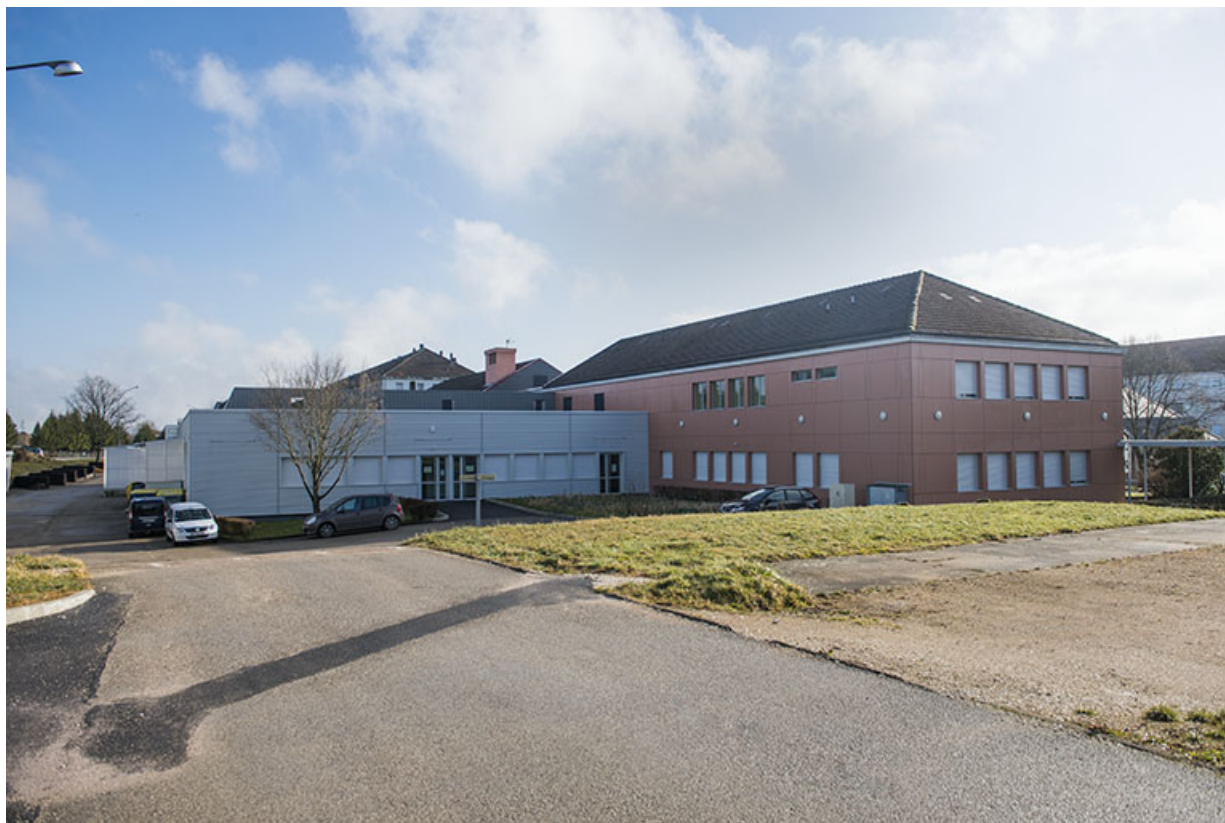
Vue de trois quart arrière ouest des services communs. 25, Besançon, 91, 93 boulevard Léon Blum, lieudit : Palente