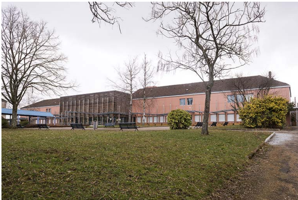
Vue de trois-quart de la façade antérieure sud-est des services communs.

25, Besançon, 91, 93 boulevard Léon Blum, lieudit : Palente