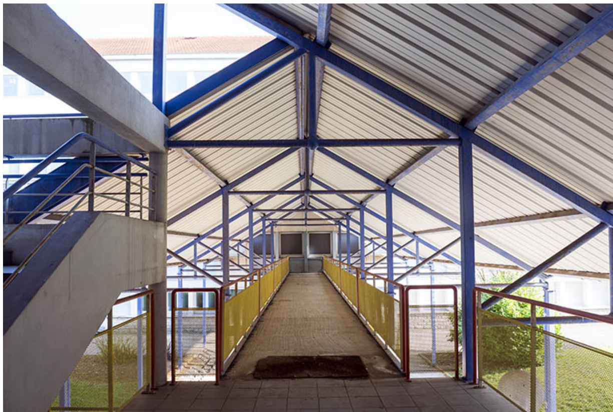
Passerelle aérienne (non affectée) menant du centre de documentation et d'information à l'externat.

25, Besançon, 91, 93 boulevard Léon Blum, lieudit : Palente