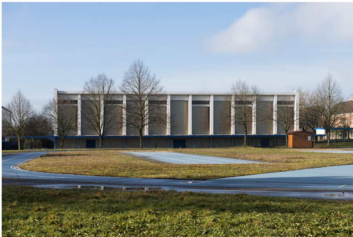
Vue de face de la façade nord-est du gymnase de filles.

25, Besançon, 91, 93 boulevard Léon Blum, lieudit : Palente