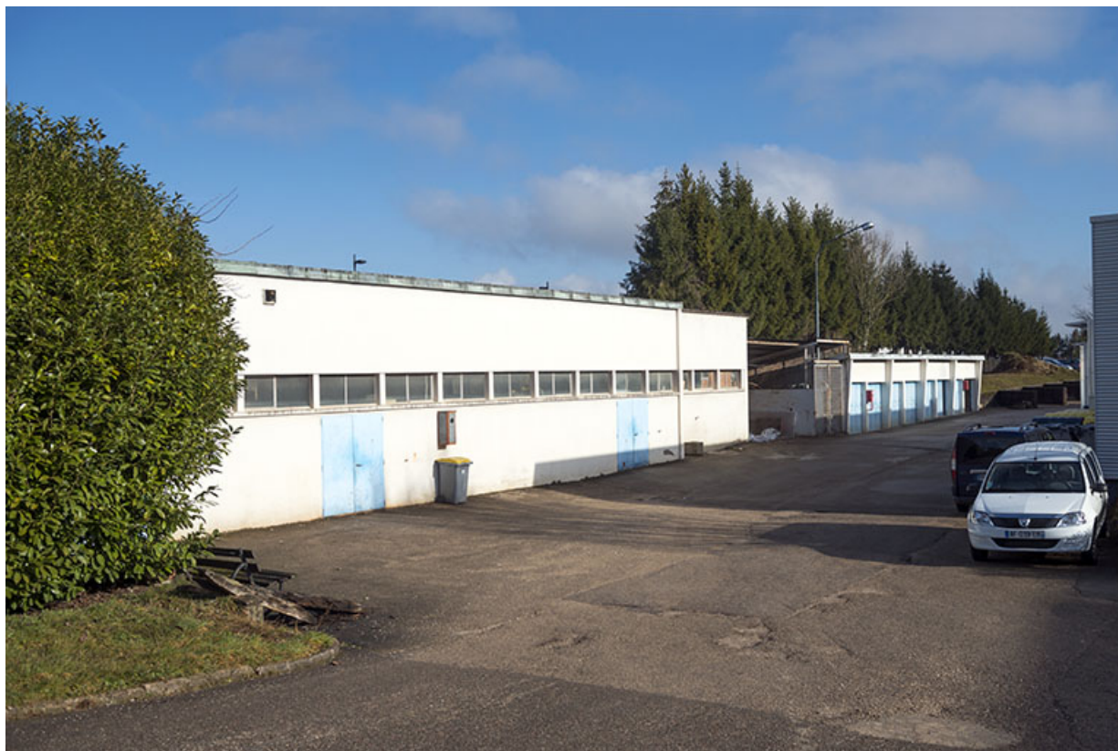
Façades sud-est des ateliers au nord-ouest de la parcelle, derrière les services communs, vus de l'ouest.

25, Besançon, 91, 93 boulevard Léon Blum, lieudit : Palente