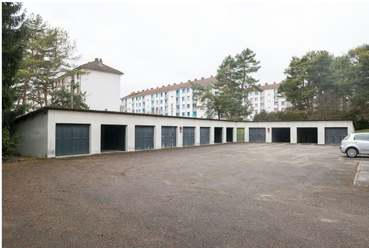
Vue sur les garages et l'environnement bâti, au sud-ouest de la parcelle.

25, Besançon, 91, 93 boulevard Léon Blum, lieudit : Palente