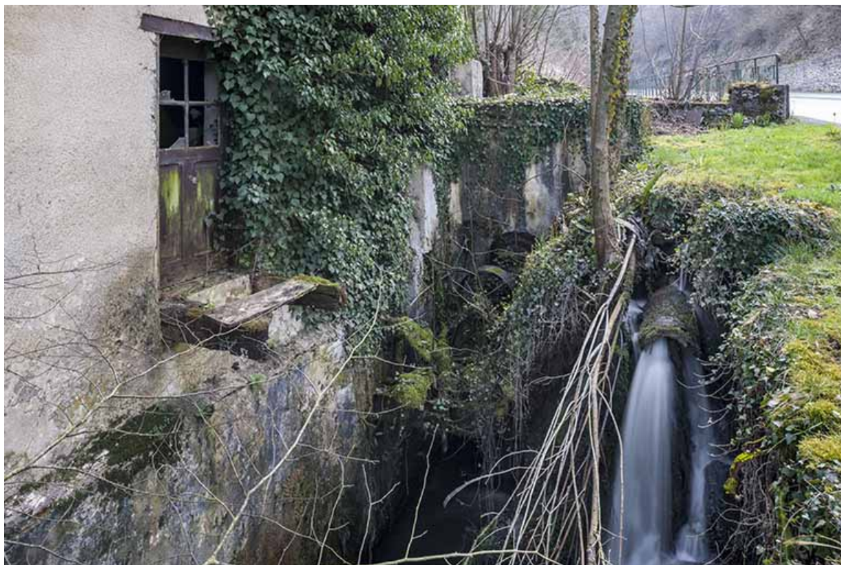
Canal d'amenée et vestiges de la turbine.