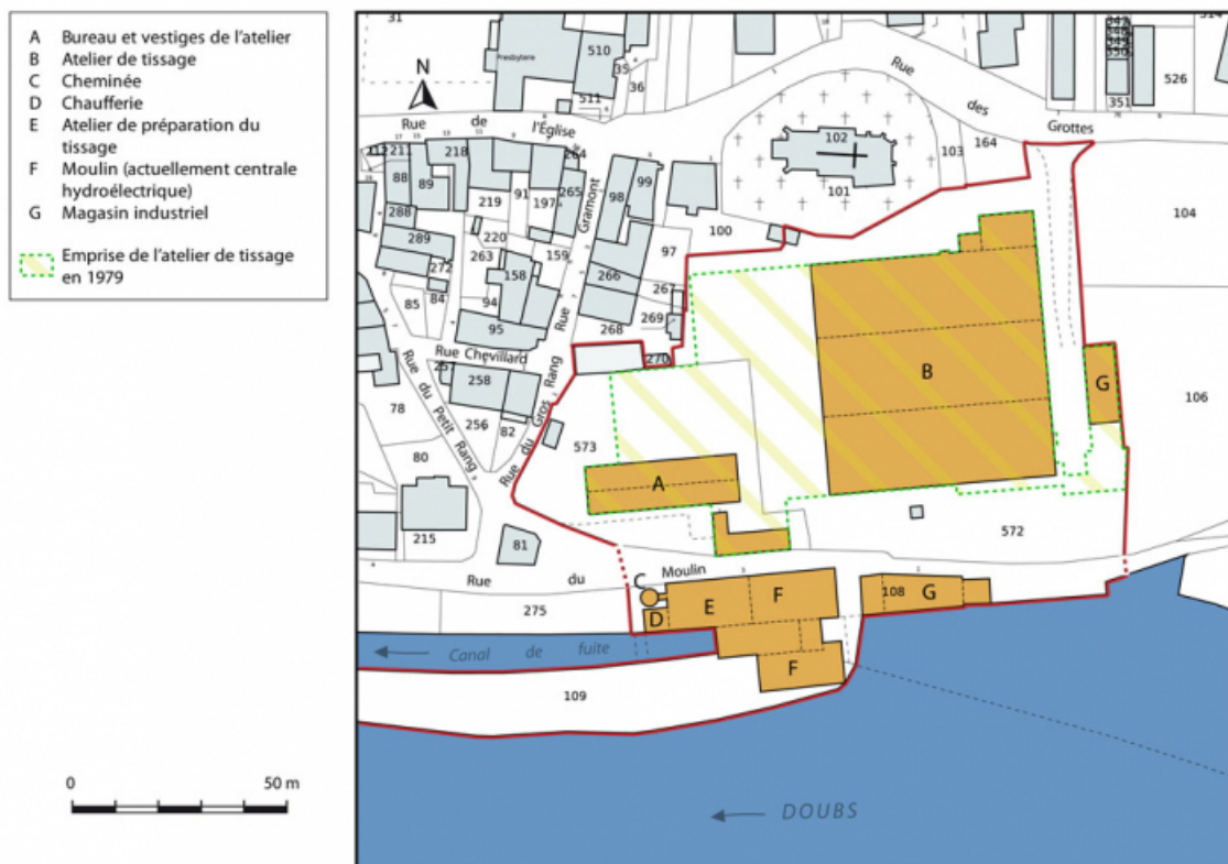
Plan-masse et de situation. Extrait du plan cadastral, 2015, section AN.