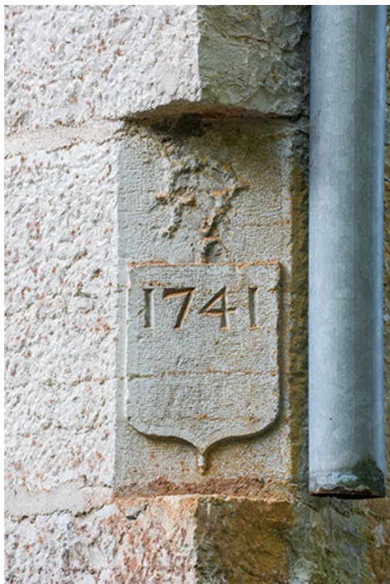
Moulin nord. Pierre d'angle nord-est.