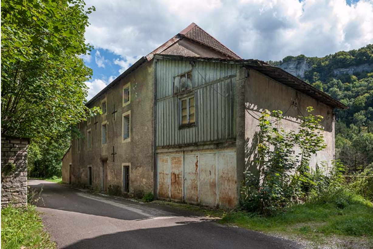
Magasin industriel vu de trois quarts.