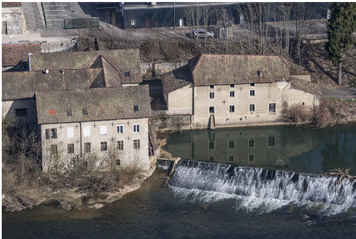
Vue plongeante rapprochée depuis le sud.