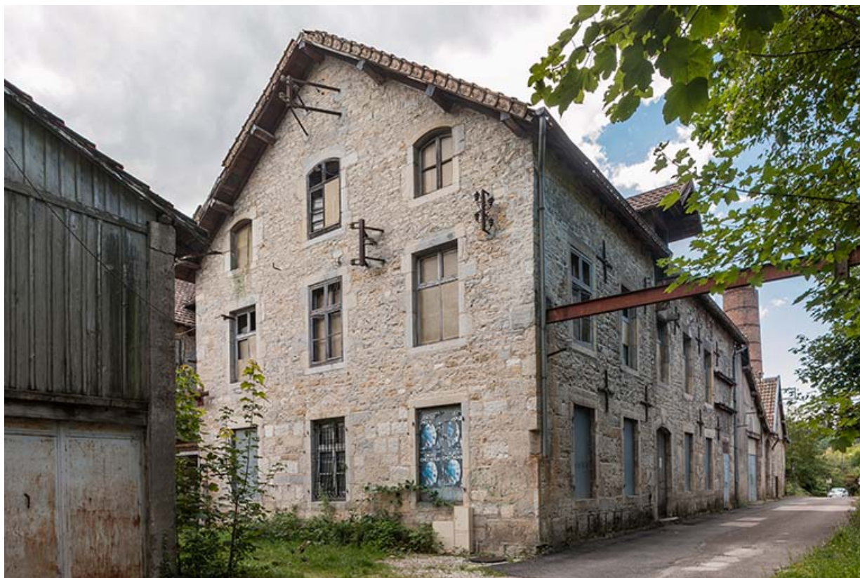
Atelier nord du moulin, vu de trois quarts.