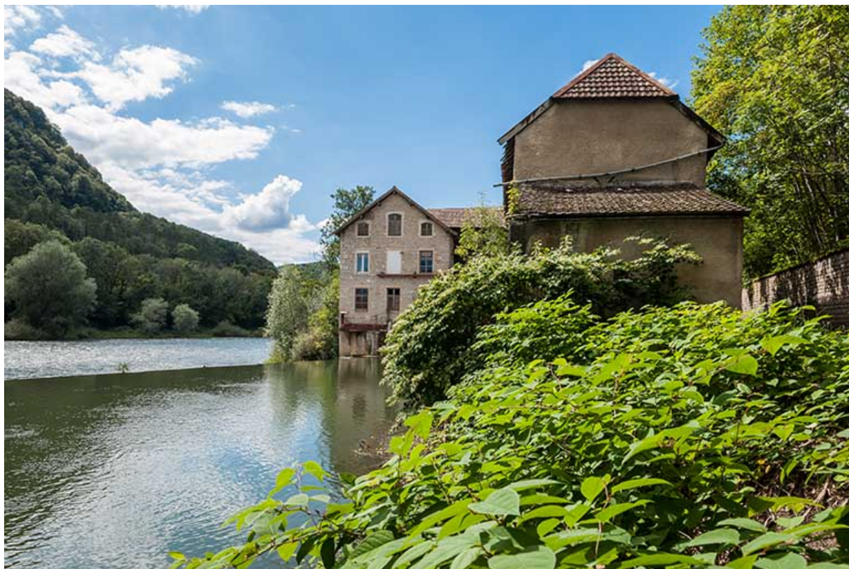
Moulin (sud) et magasin industriel depuis l'amont.