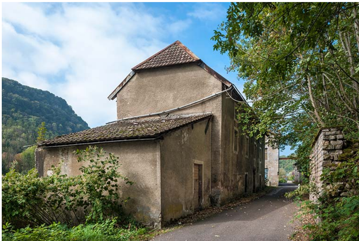
Magasin industriel vu depuis le nord-est.