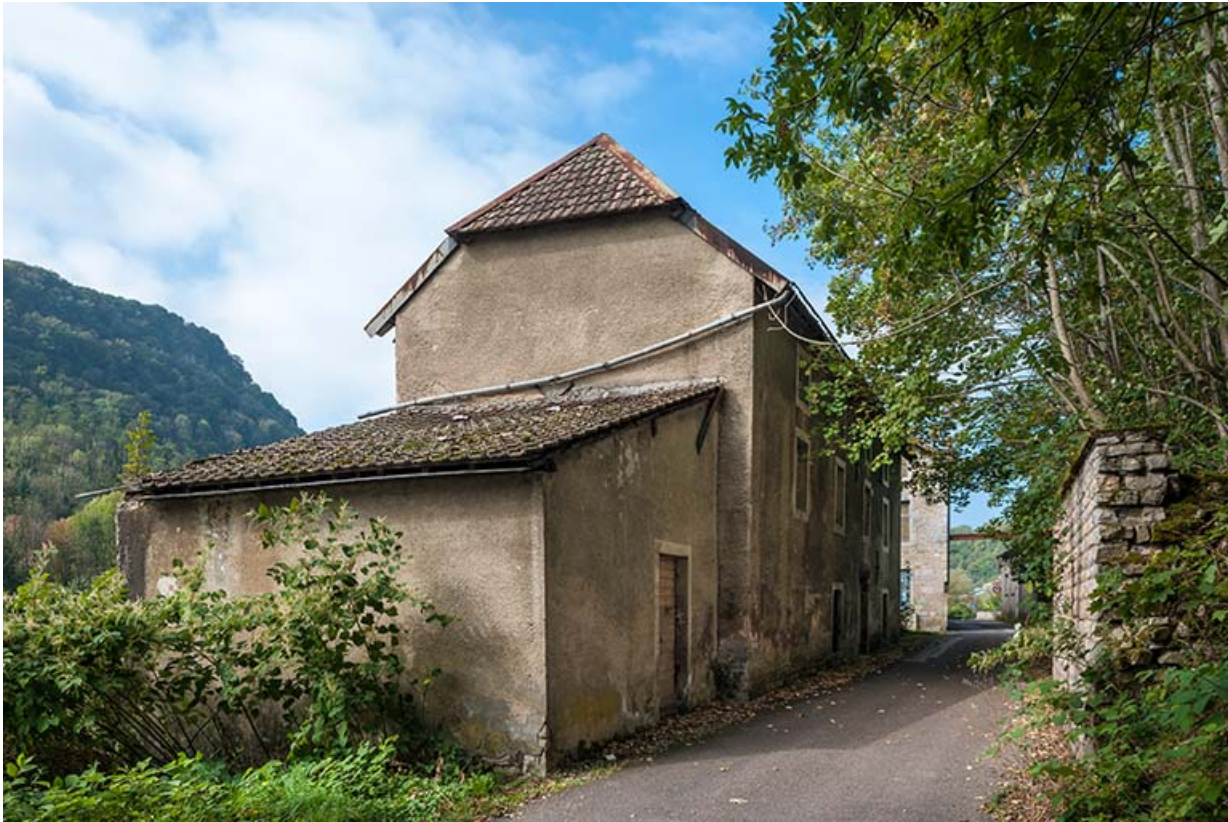
Magasin industriel vu depuis le nord-est.