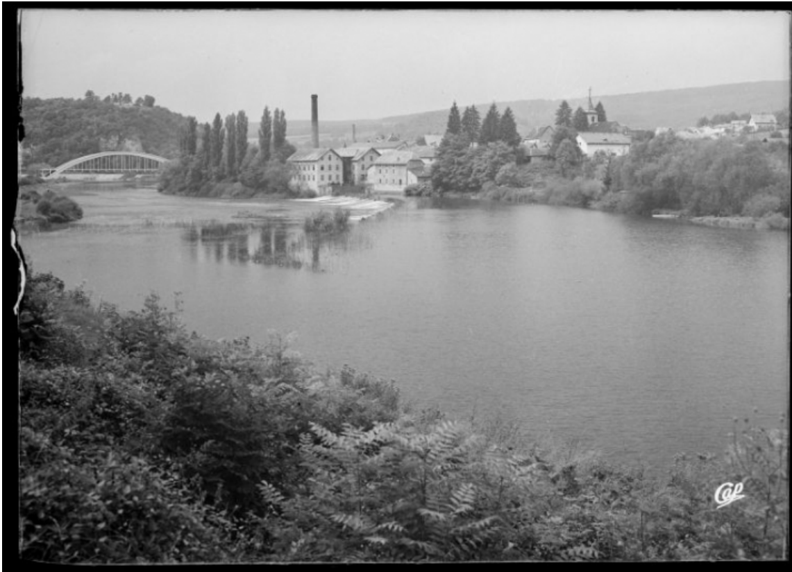
[Vue d'ensemble depuis le sud-ouest], s.d. [vers 1930]