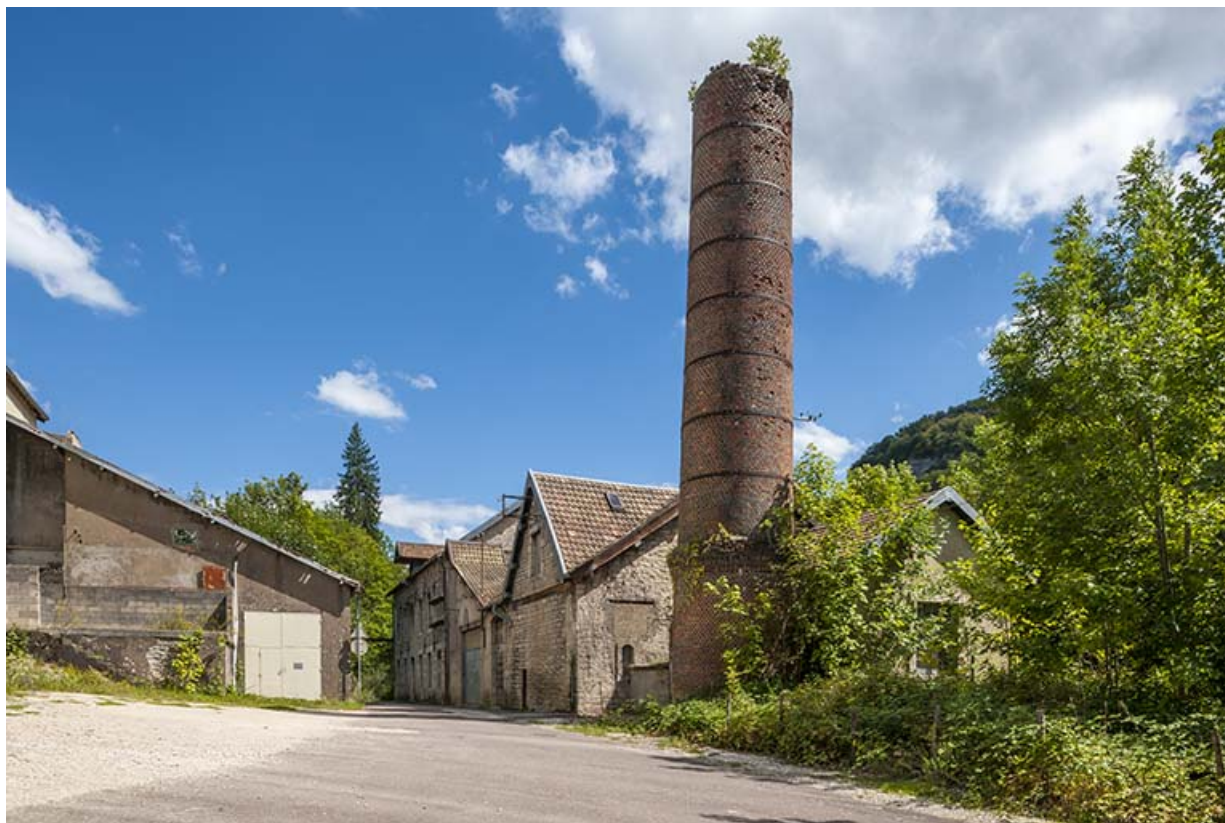
Vue des bâtiments du moulin depuis l'ouest.