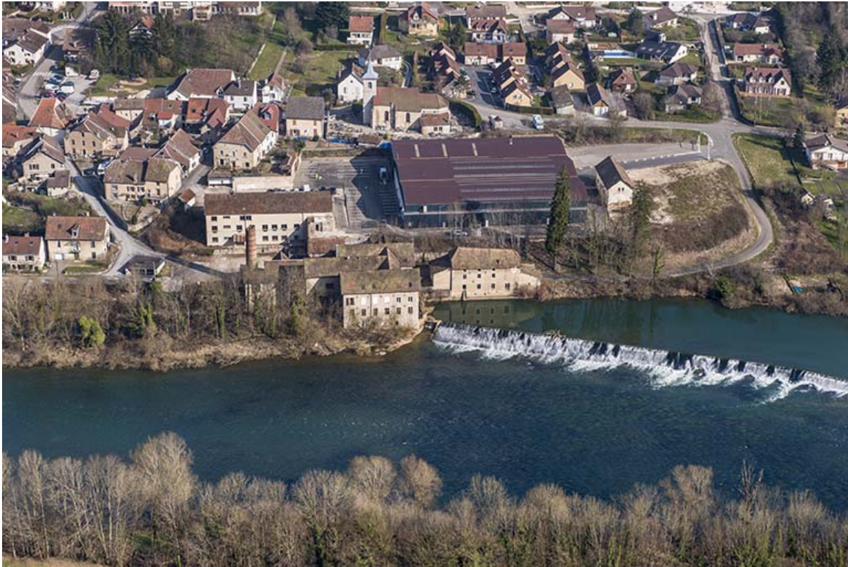
Vue d'ensemble plongeante depuis le sud.