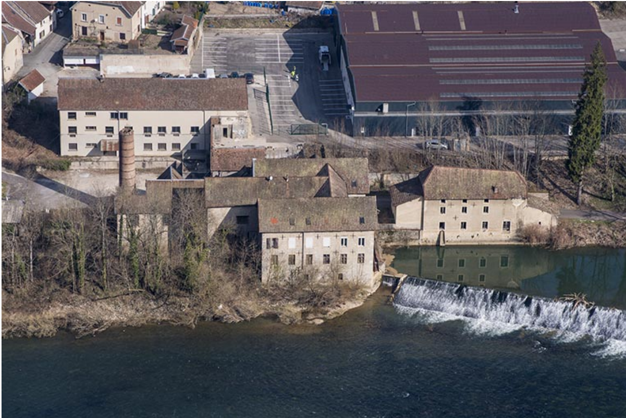
Vue plongeante depuis le sud.