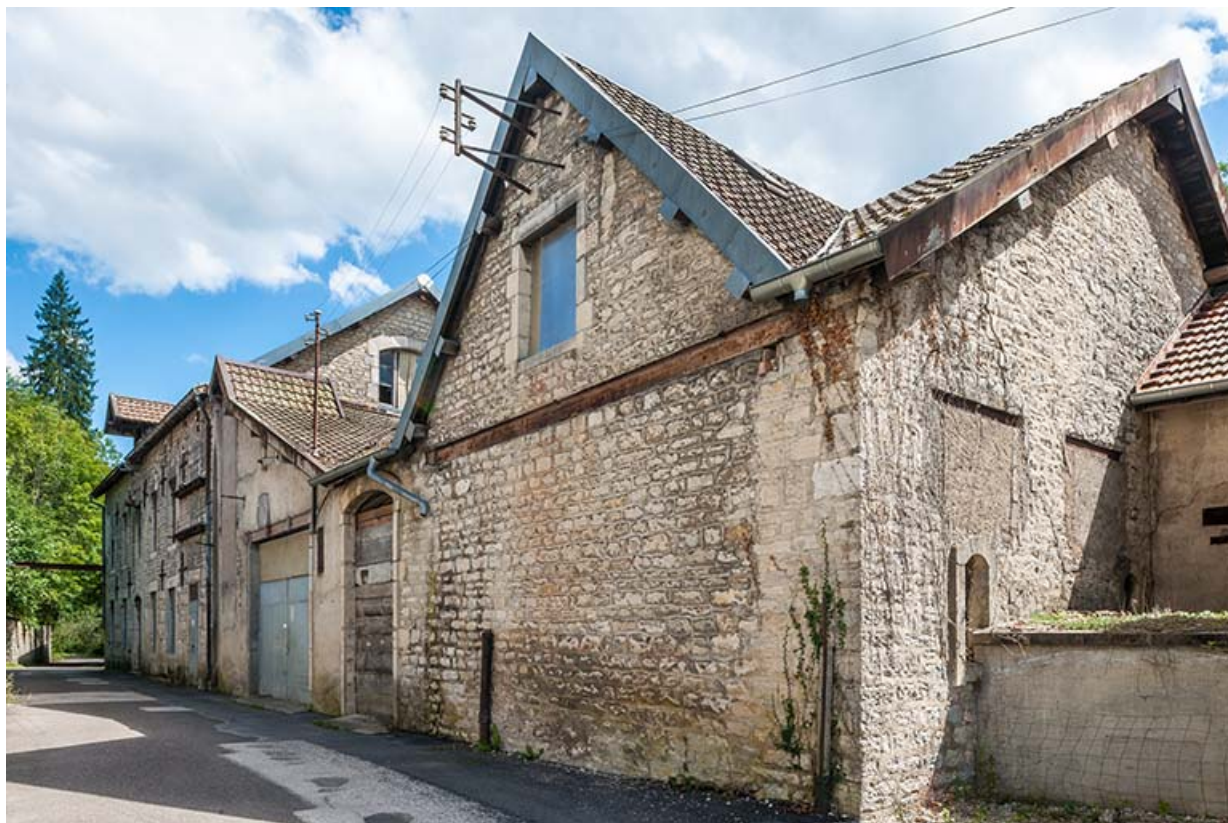
De gauche à droite : moulin et bâtiments du tissage.