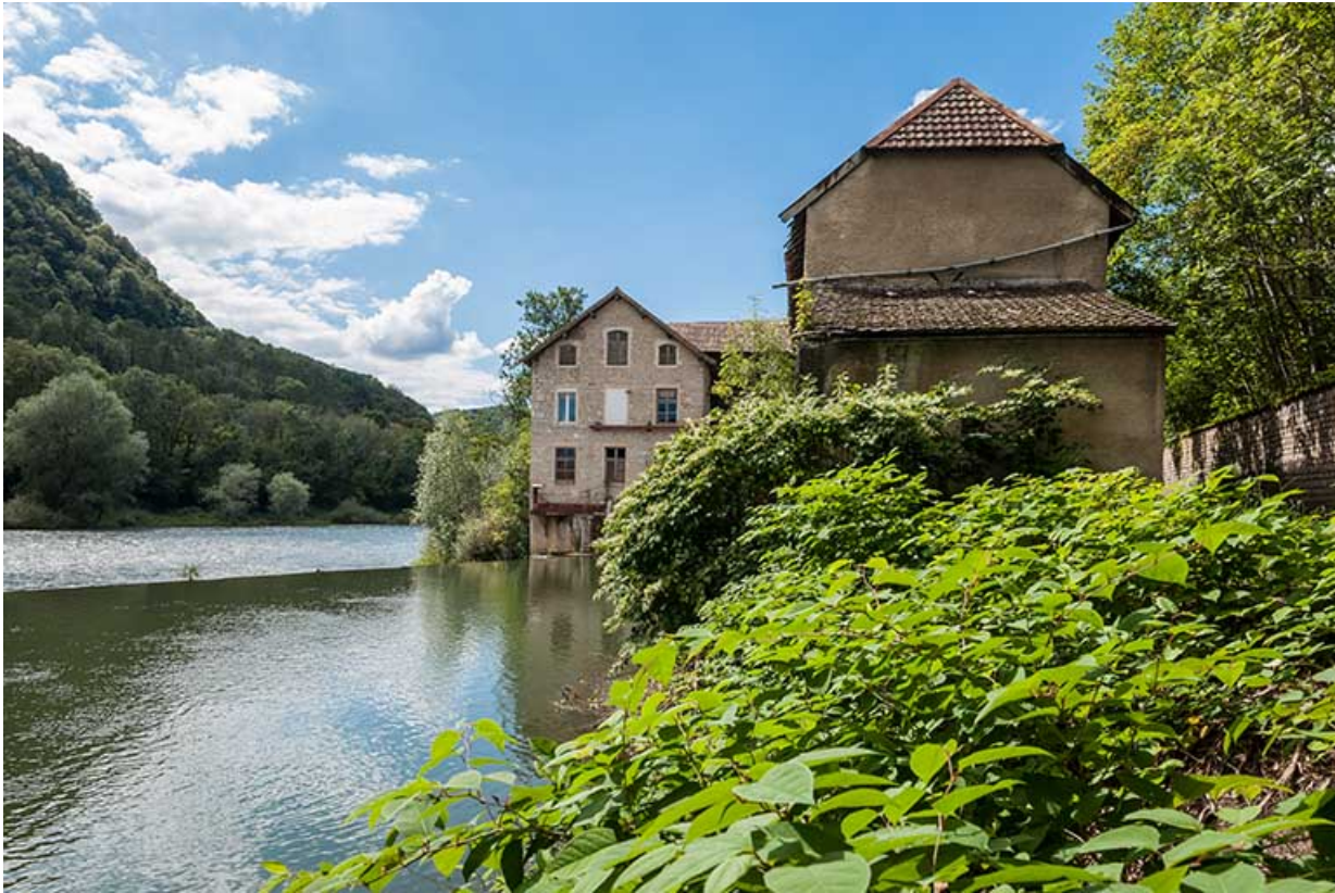
Moulin (sud) et magasin industriel depuis l'amont.