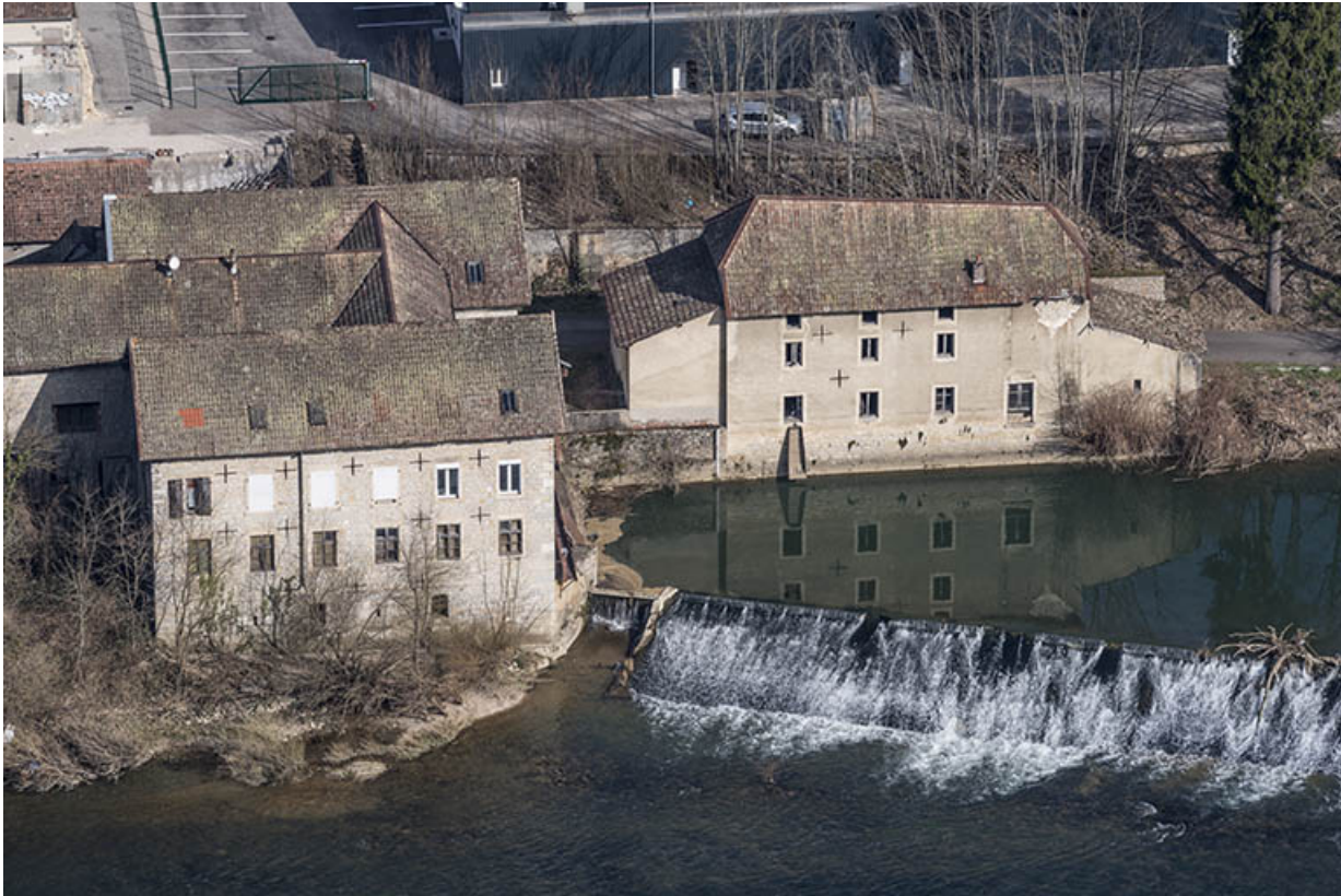
Vue plongeante rapprochée depuis le sud.