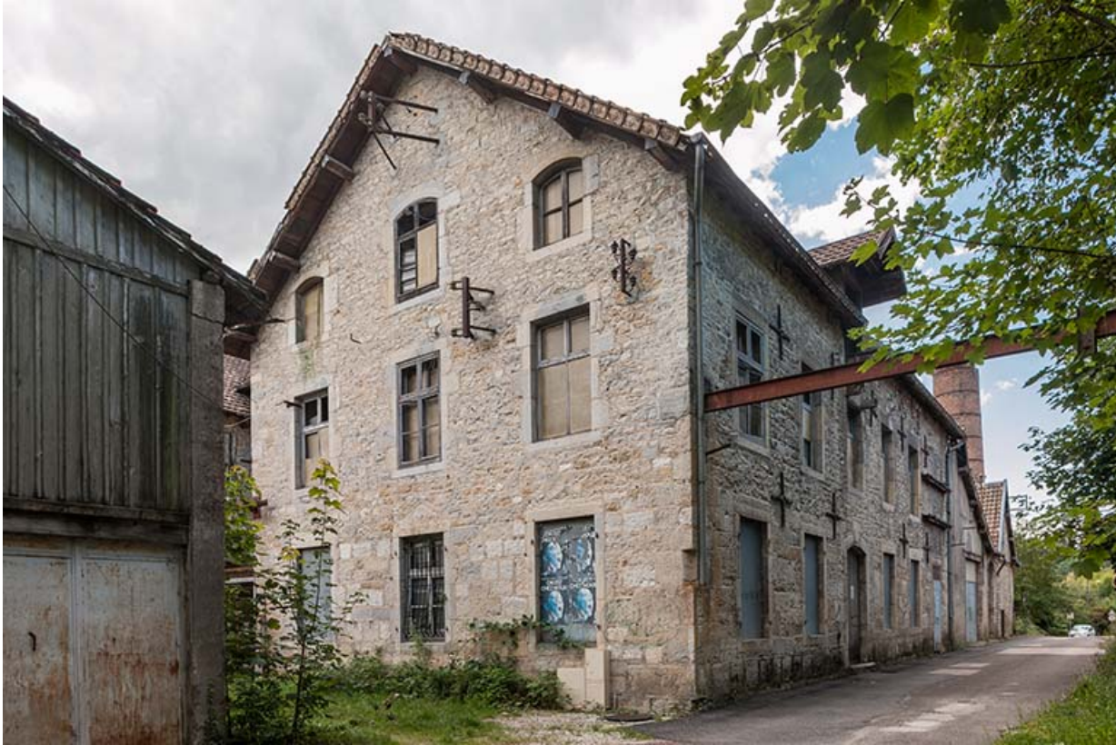
Atelier nord du moulin, vu de trois quarts.