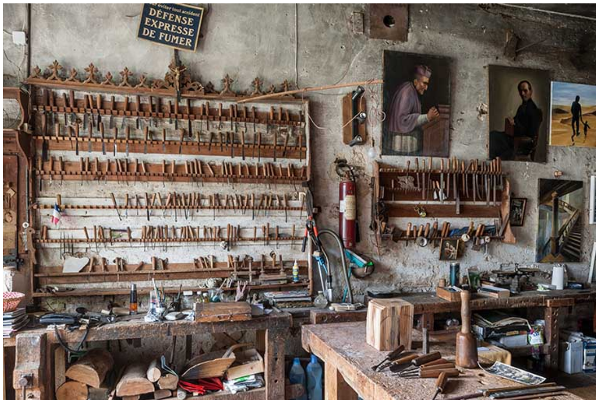
Atelier (rez-de-chaussée surélevé). Le mur sud. 25, Sancey-le-Long, 8 rue de Lattre de Tassigny