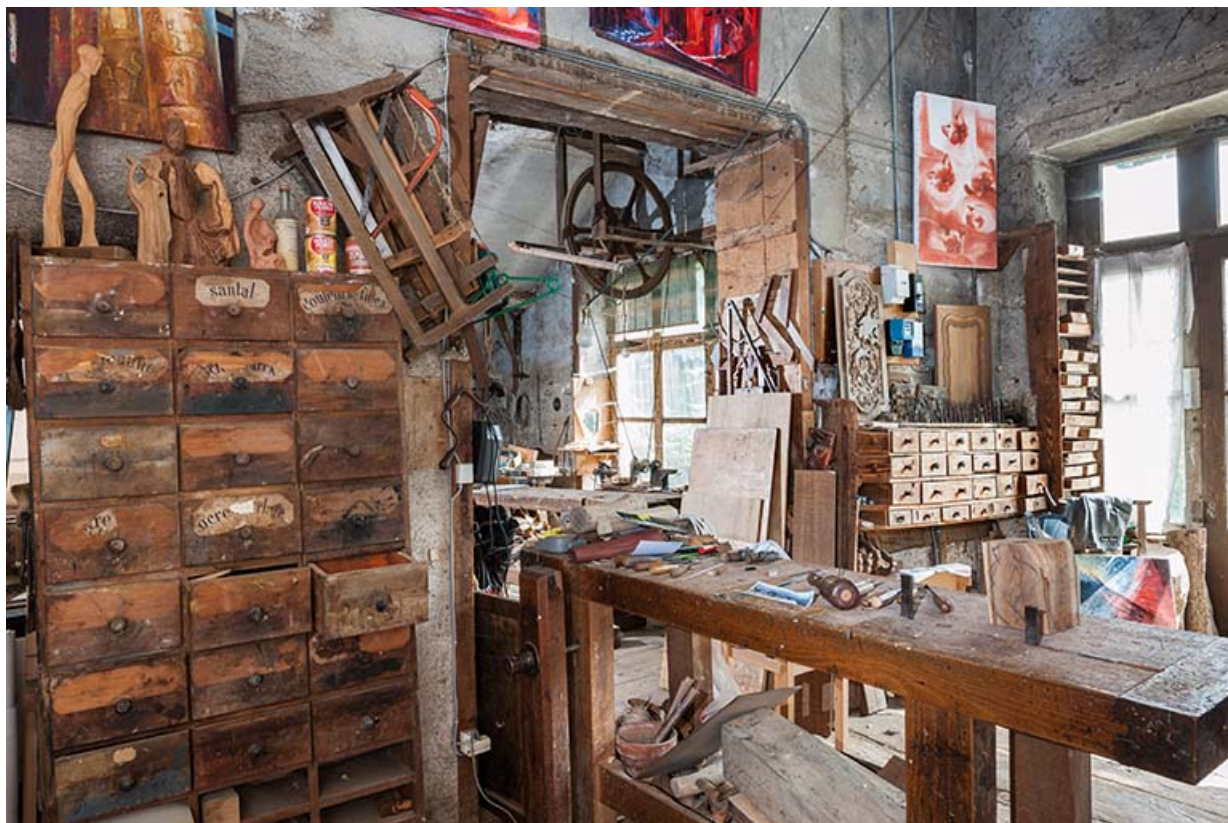
Atelier (rez-de-chaussée surélevé). Meubles de rangement contre le mur nord. 25, Sancey-le-Long, 8 rue de Lattre de Tassigny