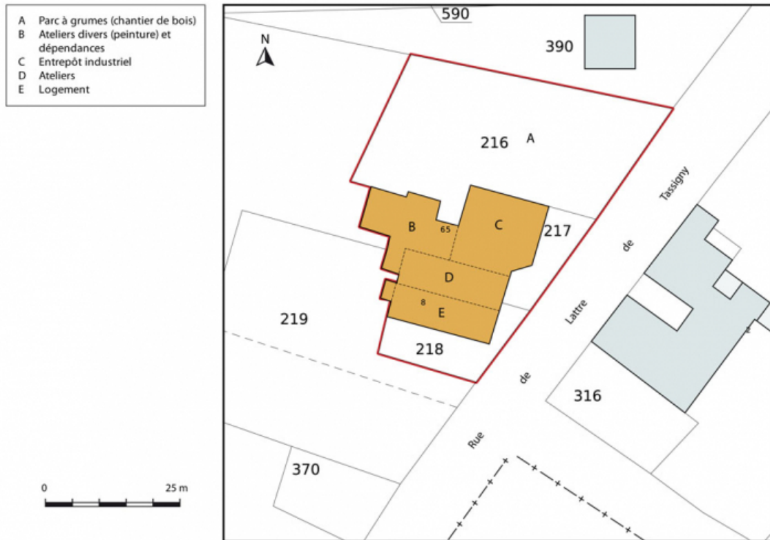
Plan-masse et de situation. Extrait du plan cadastral, 2015, section B. 25, Sancey-le-Long, 8 rue de Lattre de Tassigny