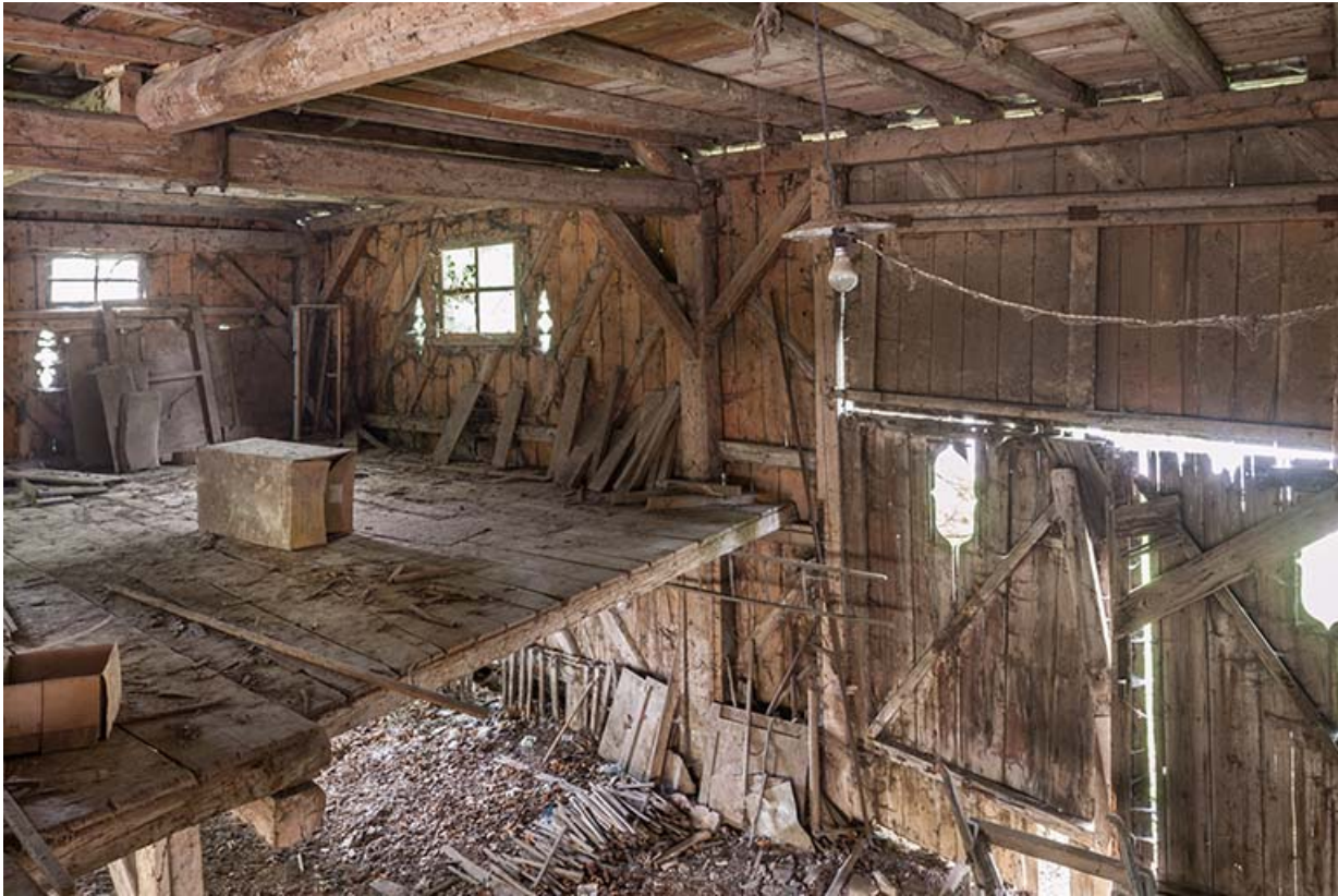
Magasin industriel. Vue depuis l'étage.

25, Sancey-le-Long, 8 rue de Lattre de Tassigny