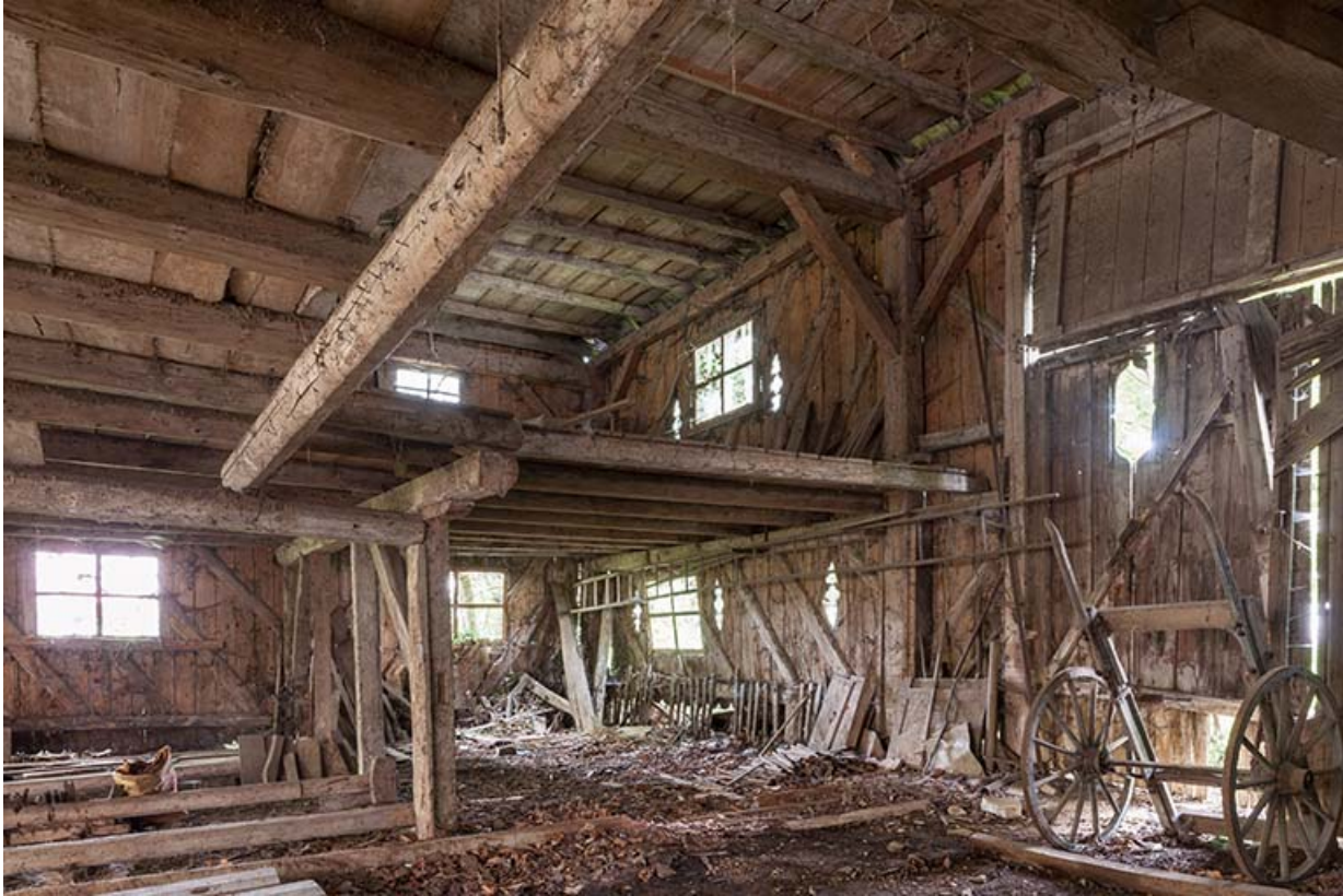
Magasin industriel. Vue depuis l'ouest.

25, Sancey-le-Long, 8 rue de Lattre de Tassigny