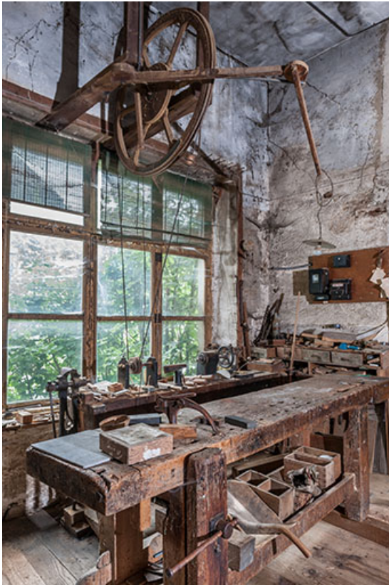
Etabli et tour à pédalier.