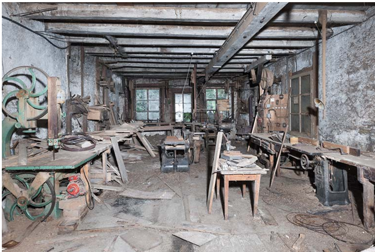
Atelier à l'étage de soubassement. Vue d'ensemble depuis l'entrée.

25, Sancey-le-Long, 8 rue de Lattre de Tassigny