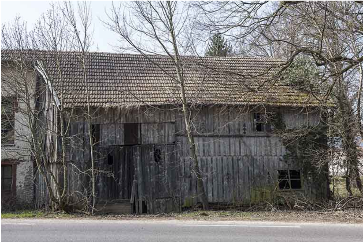
Façade est de l'entrepôt industriel.

25, Sancey-le-Long, 8 rue de Lattre de Tassigny