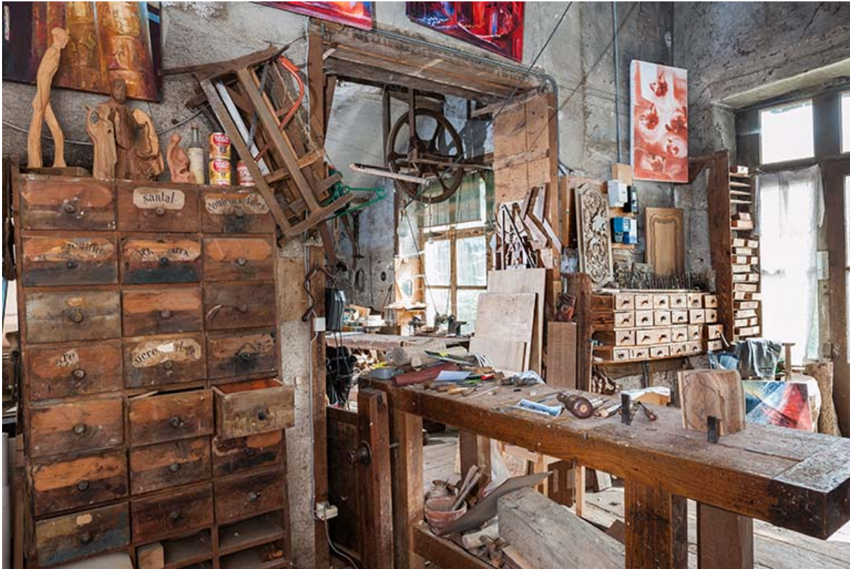
Atelier (rez-de-chaussée surélevé). Meubles de rangement contre le mur nord. 25, Sancey-le-Long, 8 rue de Lattre de Tassigny