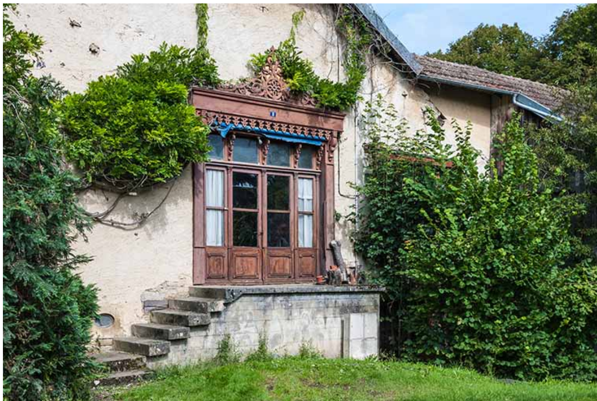
Façade sud. Devanture ouvragée de l'atelier à l'étage.

25, Sancey-le-Long, 8 rue de Lattre de Tassigny