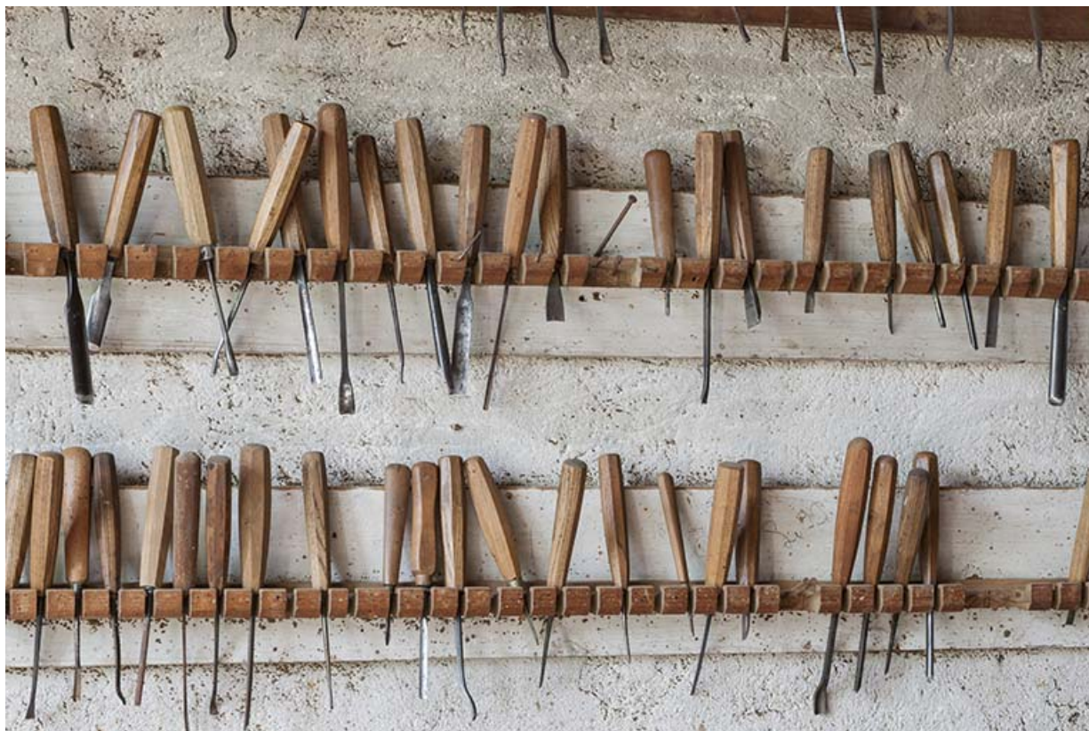
Détail du râtelier : gouges et ciseaux à bois.

25, Sancey-le-Long, 8 rue de Lattre de Tassigny