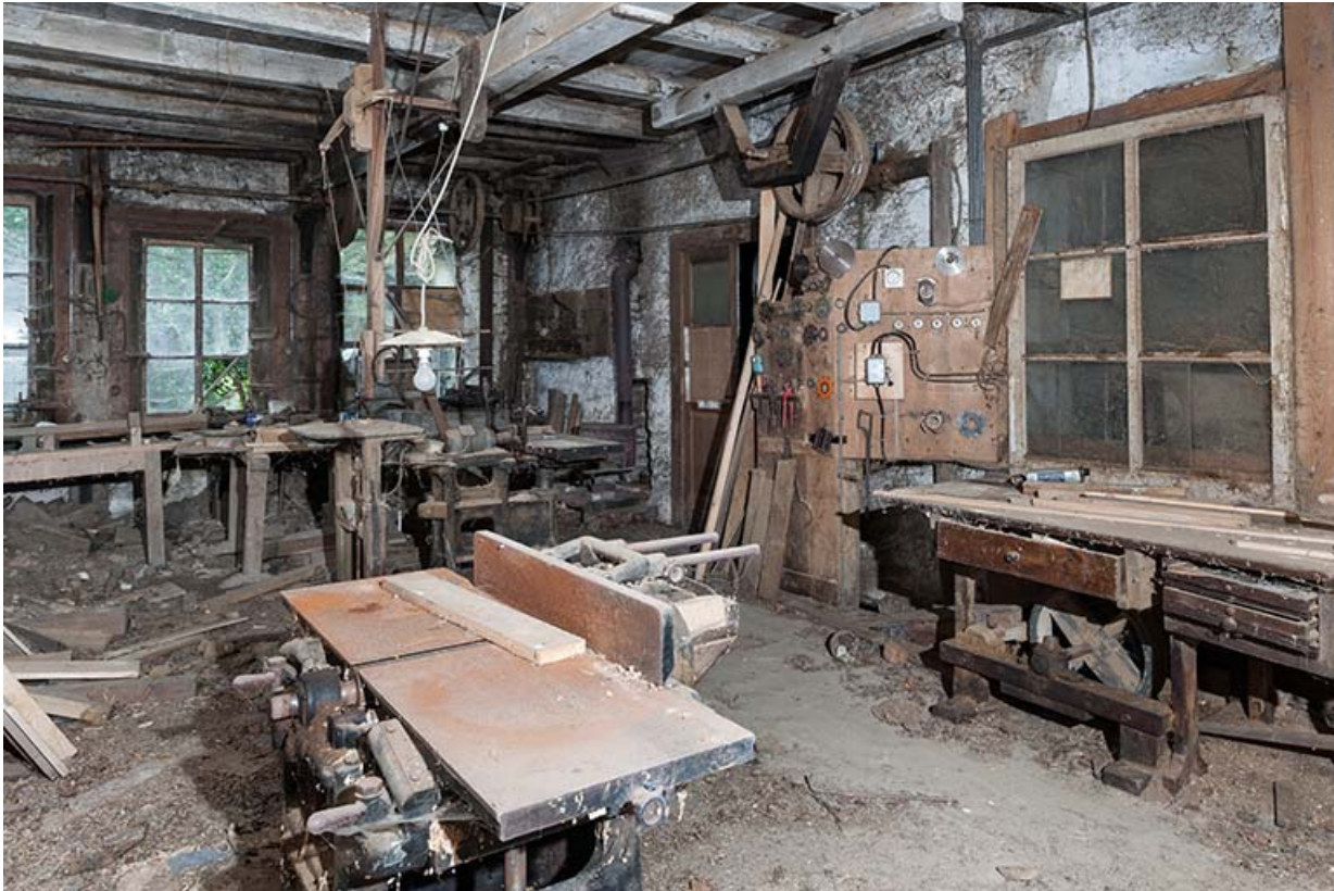
Atelier à l'étage de soubassement. Machine à raboter Betic (au premier plan).

25, Sancey-le-Long, 8 rue de Lattre de Tassigny