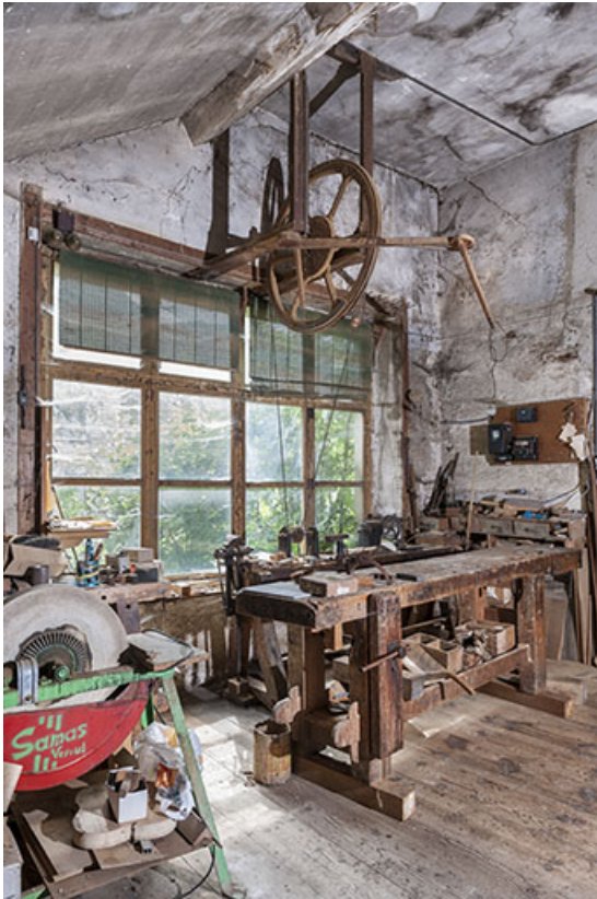
Atelier au rez-de-chaussée surélevé : partie nord.

25, Sancey-le-Long, 8 rue de Lattre de Tassigny