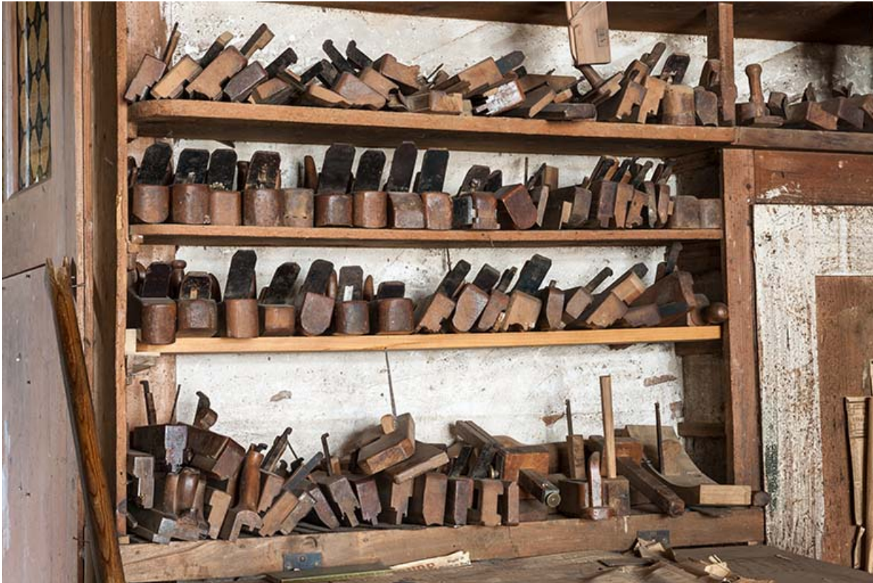
Rabots, guillaumes, varlopes, etc.

25, Sancey-le-Long, 8 rue de Lattre de Tassigny