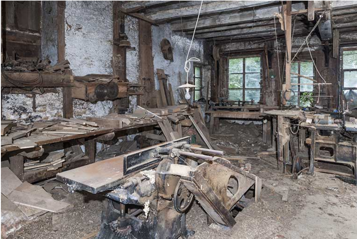
Atelier à l'étage de soubassement. Machine à raboter Betic et établis contre le mur.

25, Sancey-le-Long, 8 rue de Lattre de Tassigny