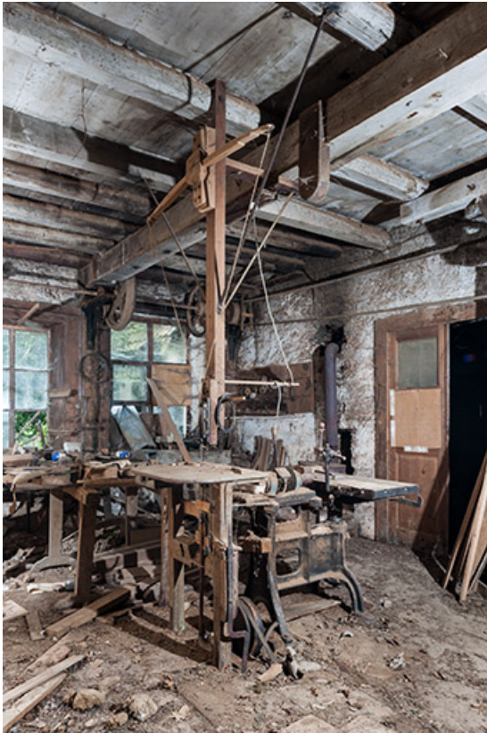
Atelier à l'étage de soubassement. Scie "arbalète" alternative et machine à mortaiser. 25, Sancey-le-Long, 8 rue de Lattre de Tassigny