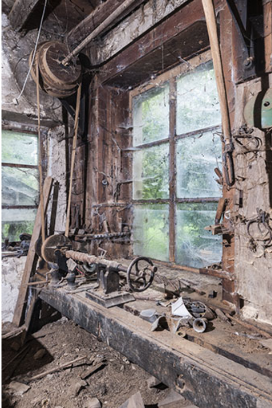
Tour à bois horizontal.

25, Sancey-le-Long, 8 rue de Lattre de Tassigny