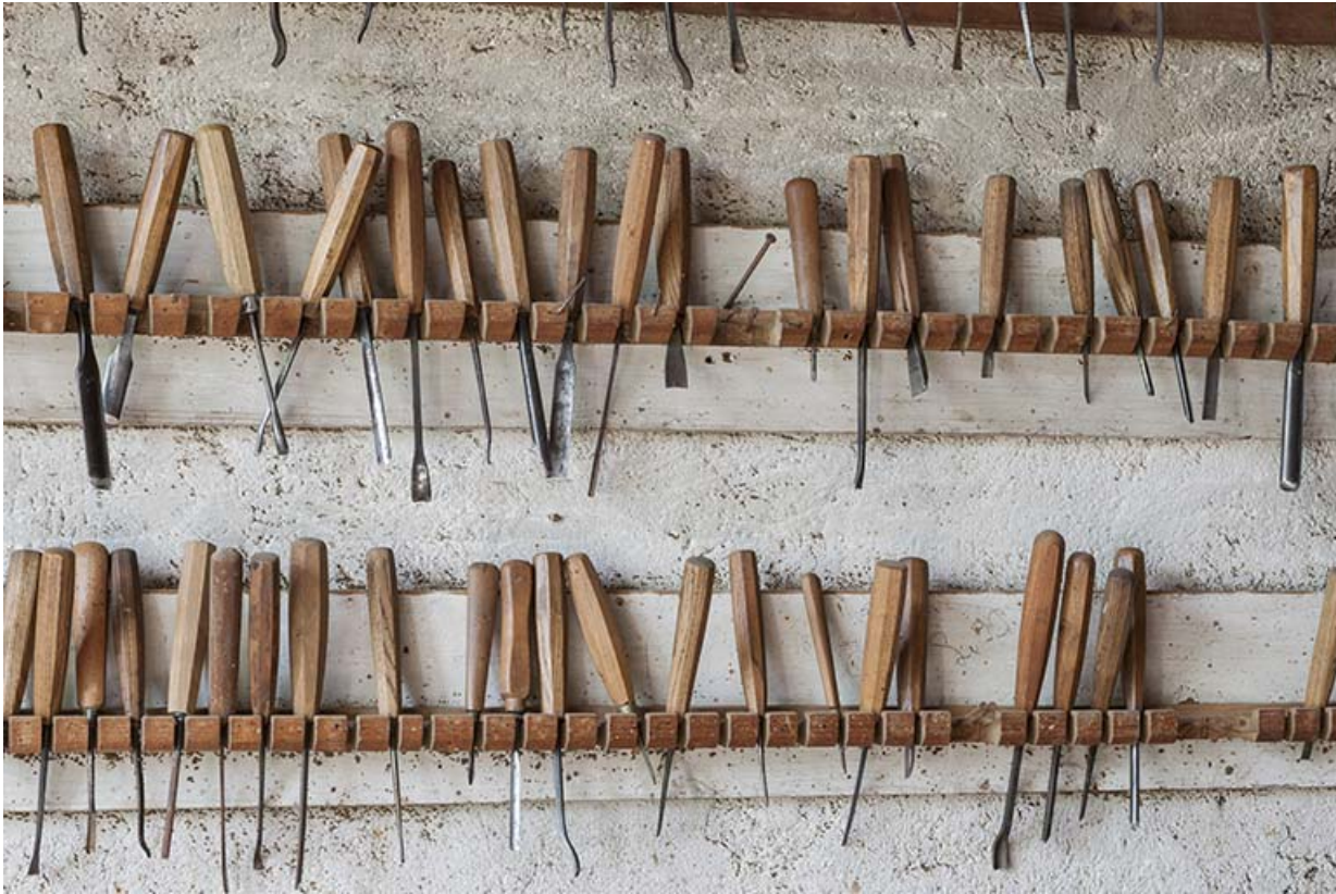
Détail du râtelier : gouges et ciseaux à bois.

25, Sancey-le-Long, 8 rue de Lattre de Tassigny