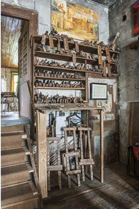
Outils divers : serre-joints, rabots, varlopes.

25, Sancey-le-Long, 8 rue de Lattre de Tassigny