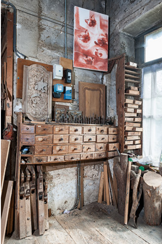
Atelier au rez-de-chaussée surélevé : meuble à tiroirs.

25, Sancey-le-Long, 8 rue de Lattre de Tassigny