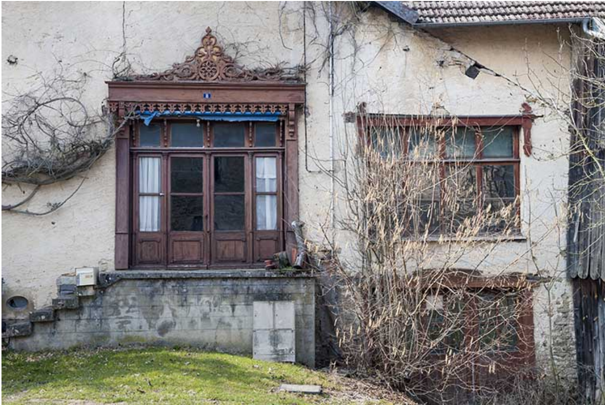
Façade sud. Entrées des ateliers.

25, Sancey-le-Long, 8 rue de Lattre de Tassigny