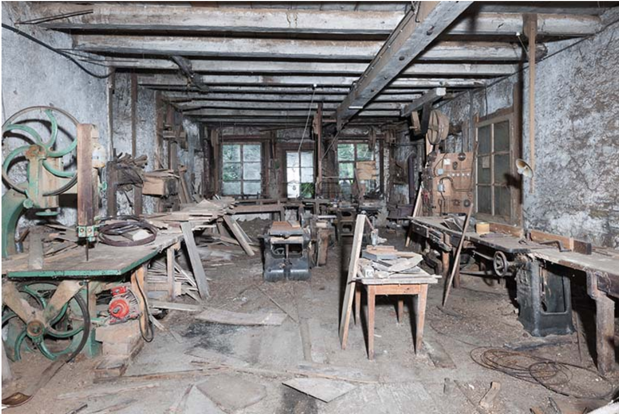
Atelier à l'étage de soubassement. Vue d'ensemble depuis l'entrée.

25, Sancey-le-Long, 8 rue de Lattre de Tassigny