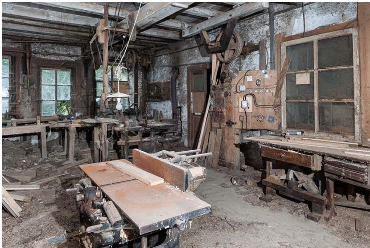
Atelier à l'étage de soubassement. Machine à raboter Betic (au premier plan). 25, Sancey-le-Long, 8 rue de Lattre de Tassigny