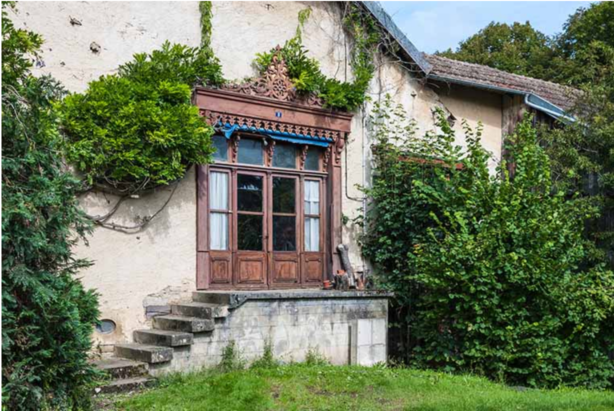
Façade sud. Devanture ouvragée de l'atelier à l'étage.

25, Sancey-le-Long, 8 rue de Lattre de Tassigny