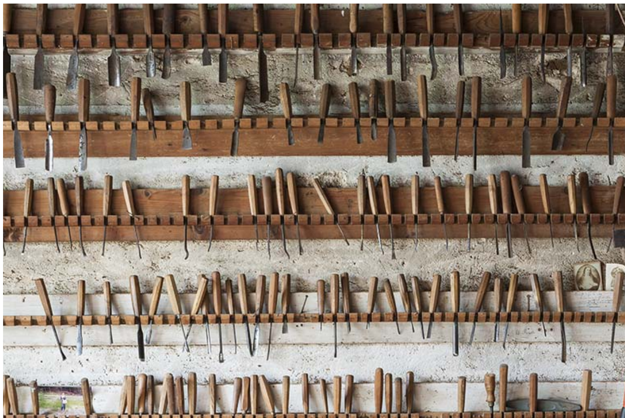
Détail du râtelier des gouges et ciseaux à bois.

25, Sancey-le-Long, 8 rue de Lattre de Tassigny