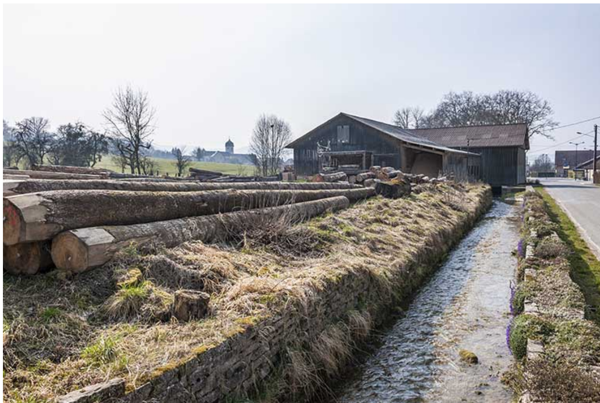
Vue d'ensemble depuis le parc à grumes, à l'est. 25, Sancey-le-Long, 2 Grande-rue