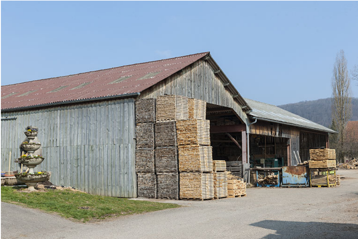
Atelier de sciage vu de trois quarts.