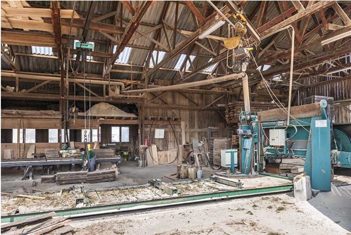
Intérieur de l'atelier de sciage.