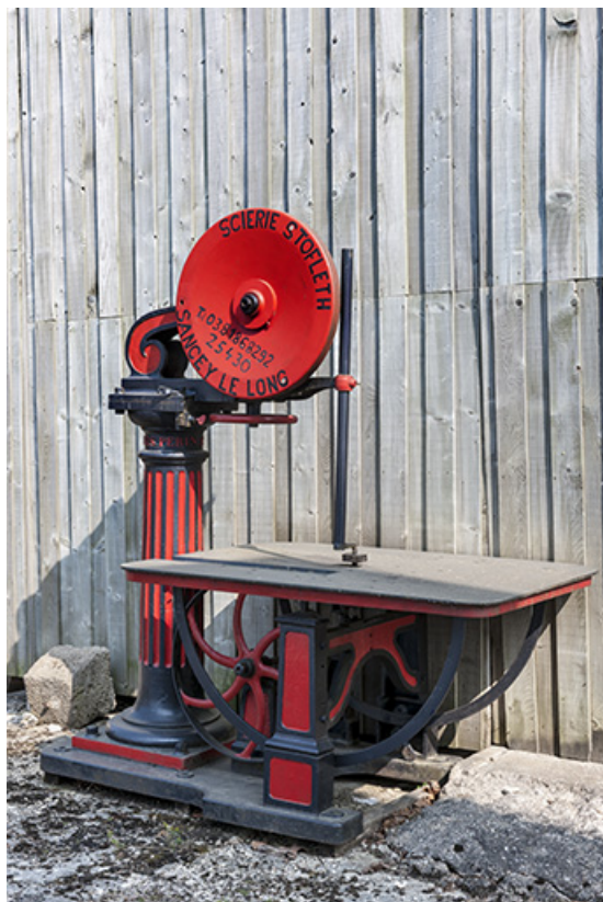
Scie à ruban Perrin (Paris), déposée.