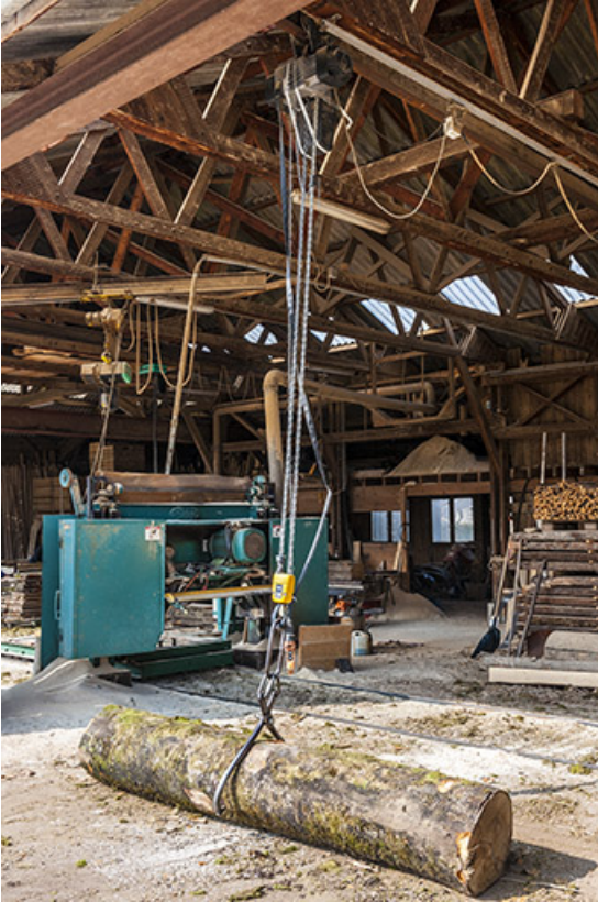
Levage d'une grume.