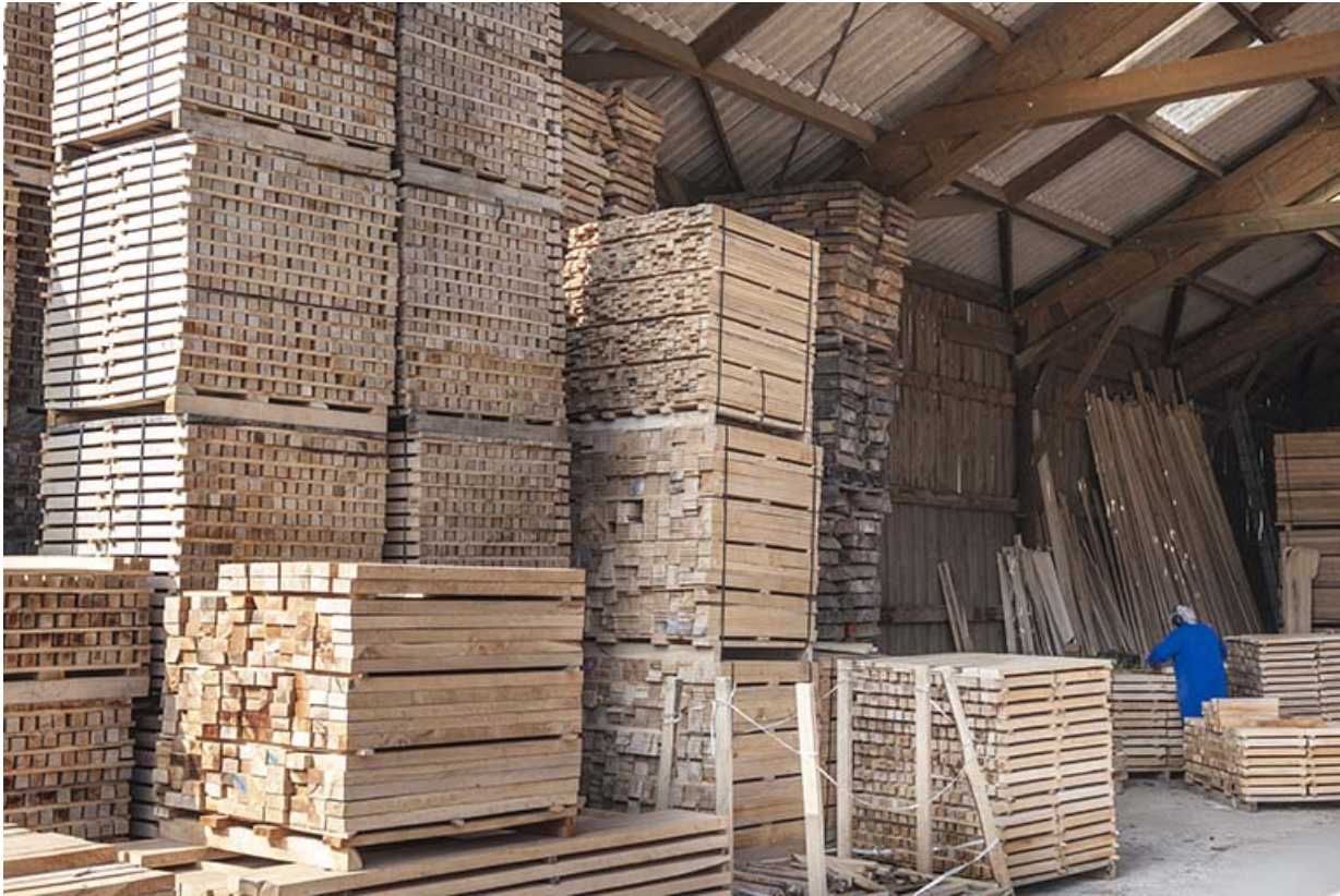
Stockage des pièces découpées.