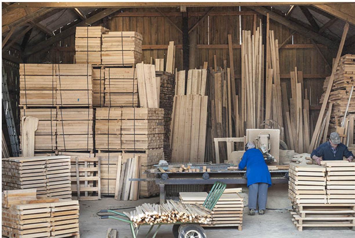
Mise sur palettes des palettes des pièces découpées.