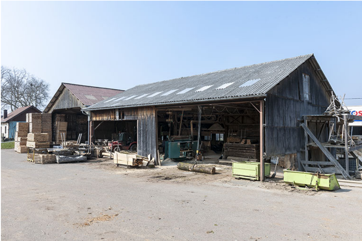
Atelier de sciage depuis le sud-est.