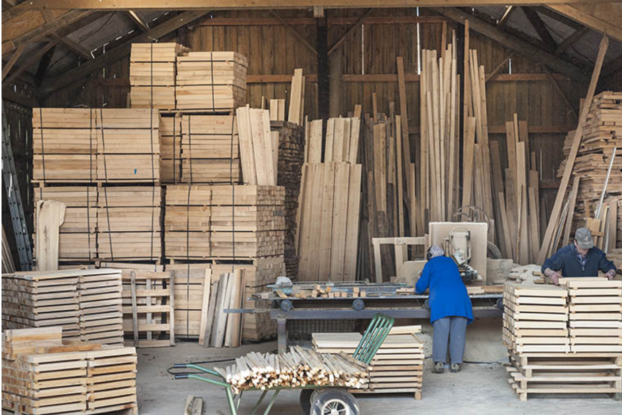
Mise sur palettes des palettes des pièces découpées.