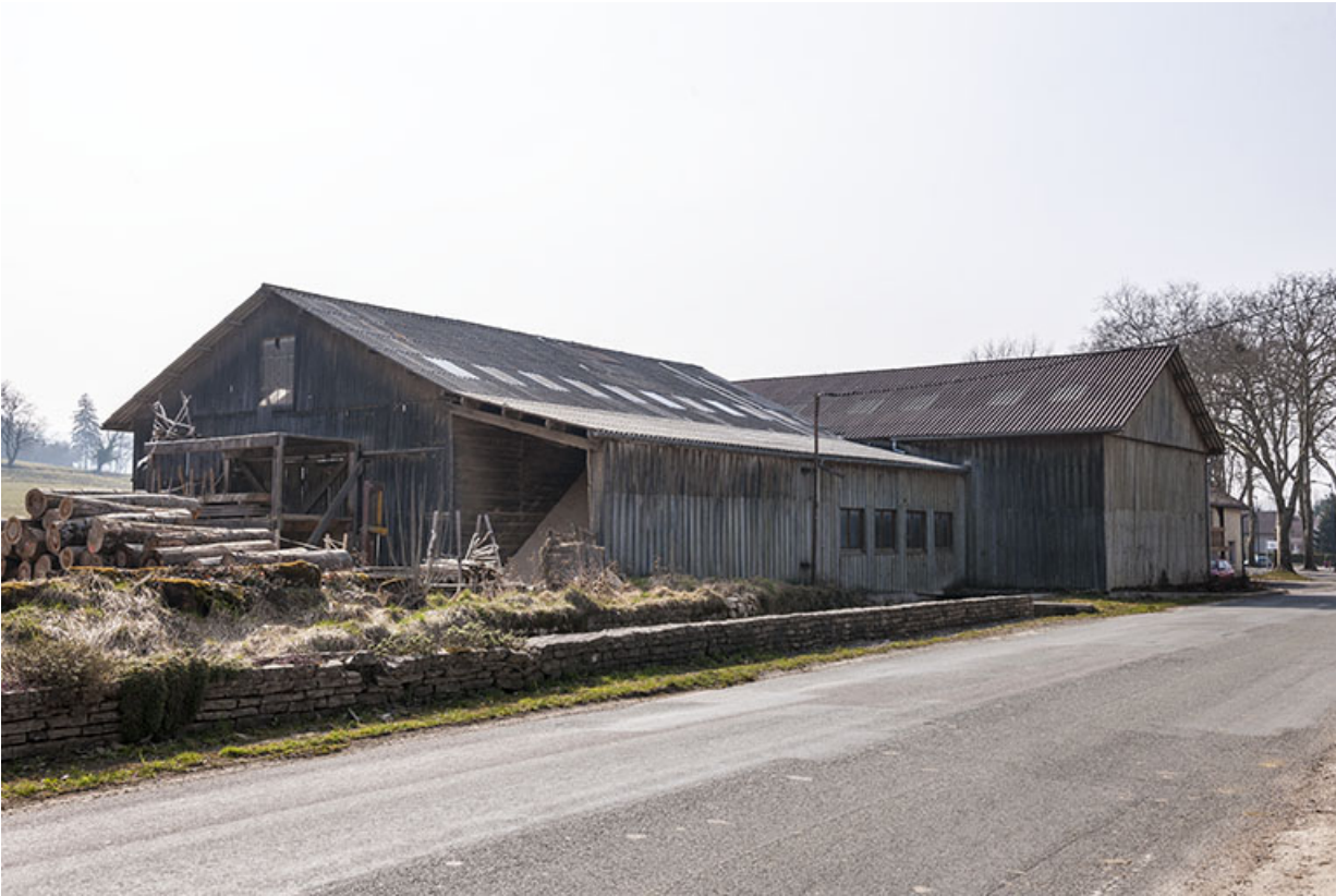
Atelier de sciage depuis le nord-est.