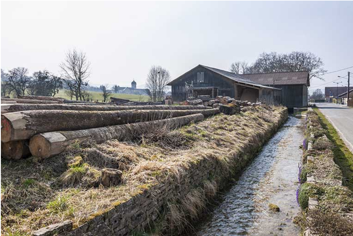
Vue d'ensemble depuis le parc à grumes, à l'est.