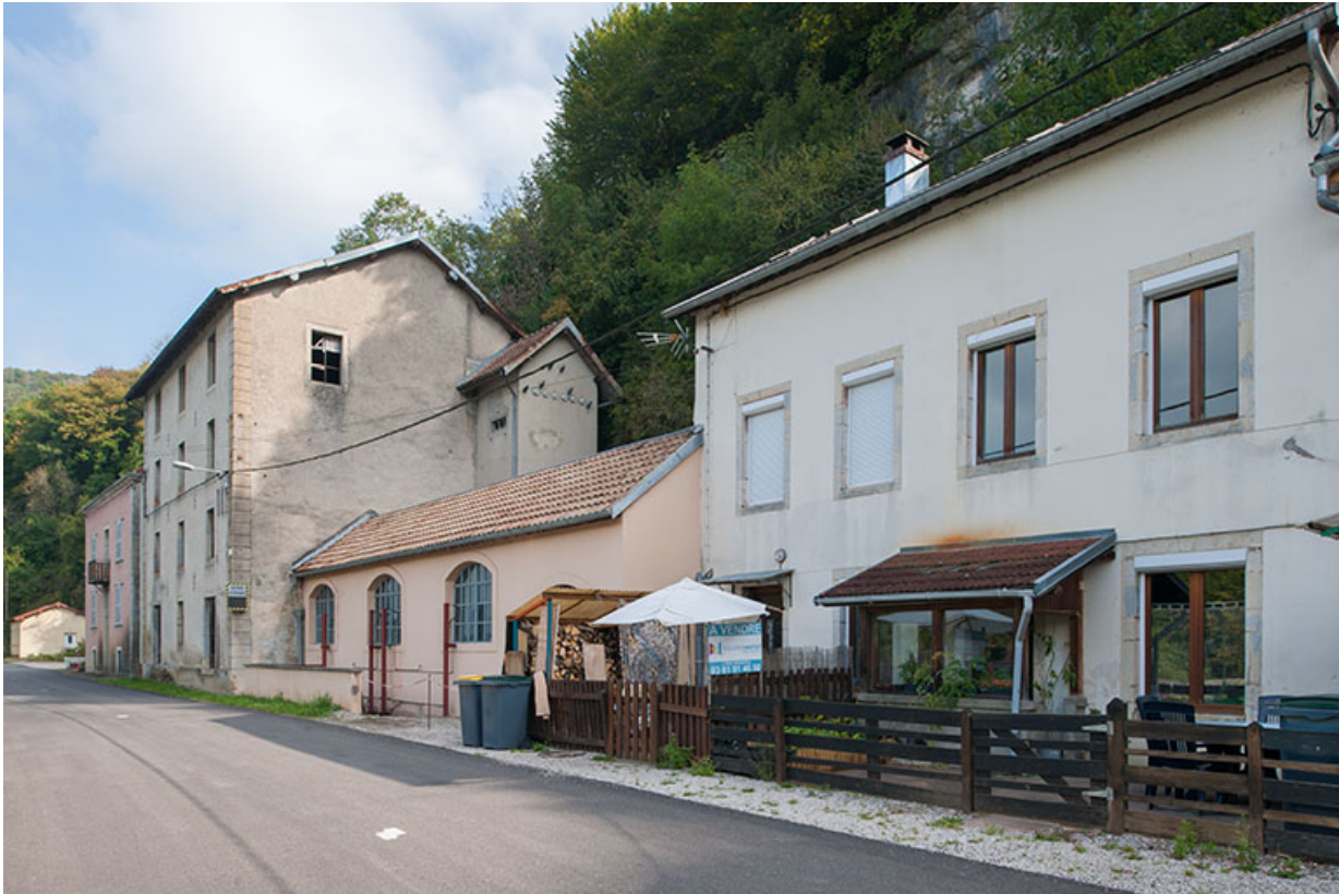
Les bâtiments industriels et un logement depuis le sud.

25, Chaux-lès-Clerval, 14, 16 rue de la Scie, lieudit : Verger Tronchot