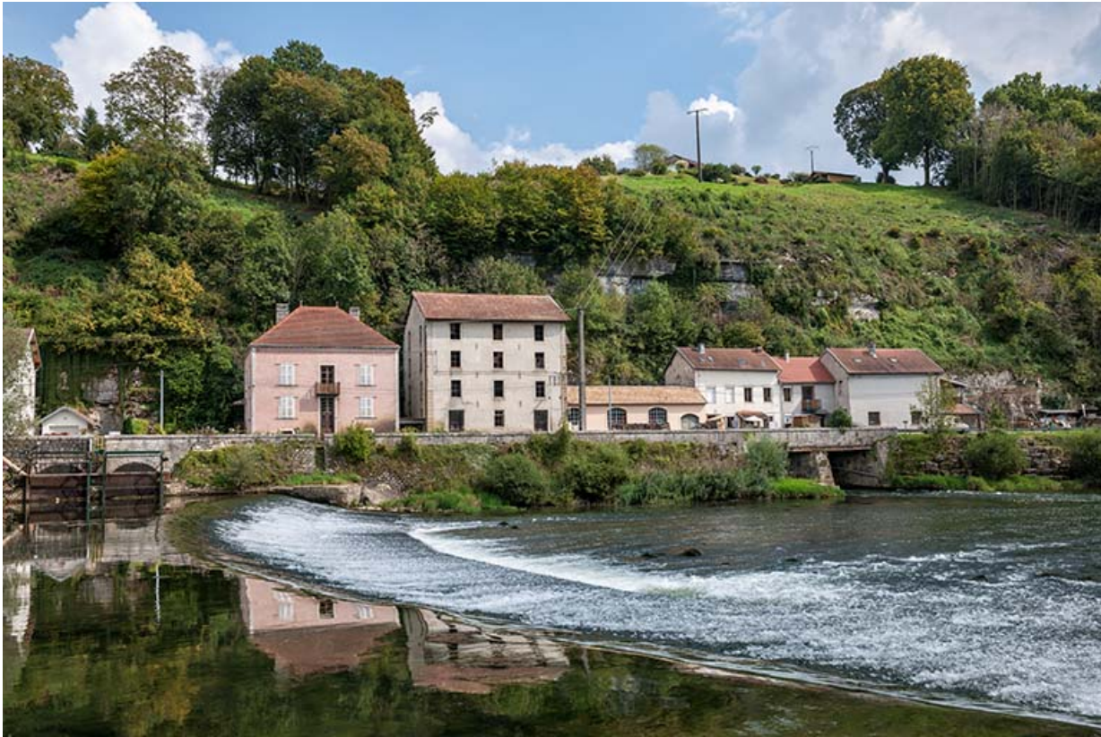
Vue d'ensemble depuis la rive droite.