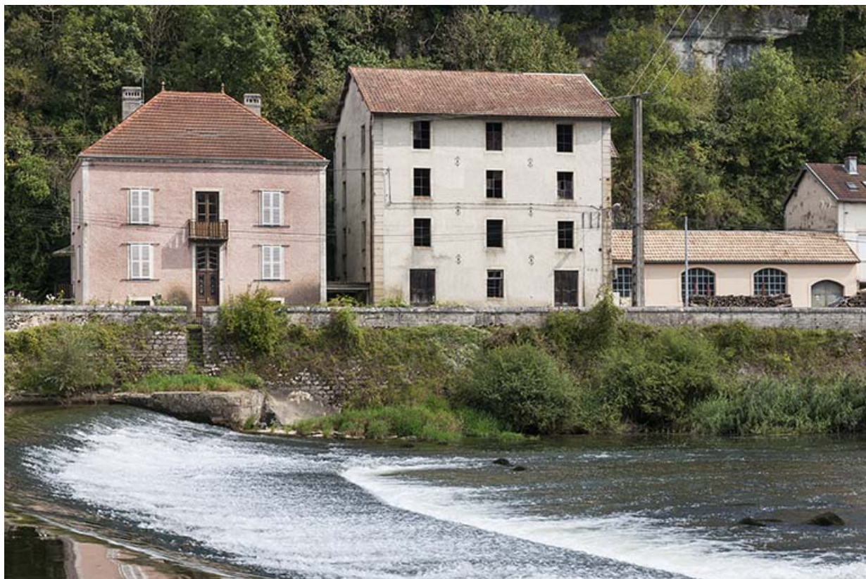
Le logement patronal, la minoterie et la centrale hydroélectrique depuis l'ouest.

25, Chaux-lès-Clerval, 14, 16 rue de la Scie, lieudit : Verger Tronchot