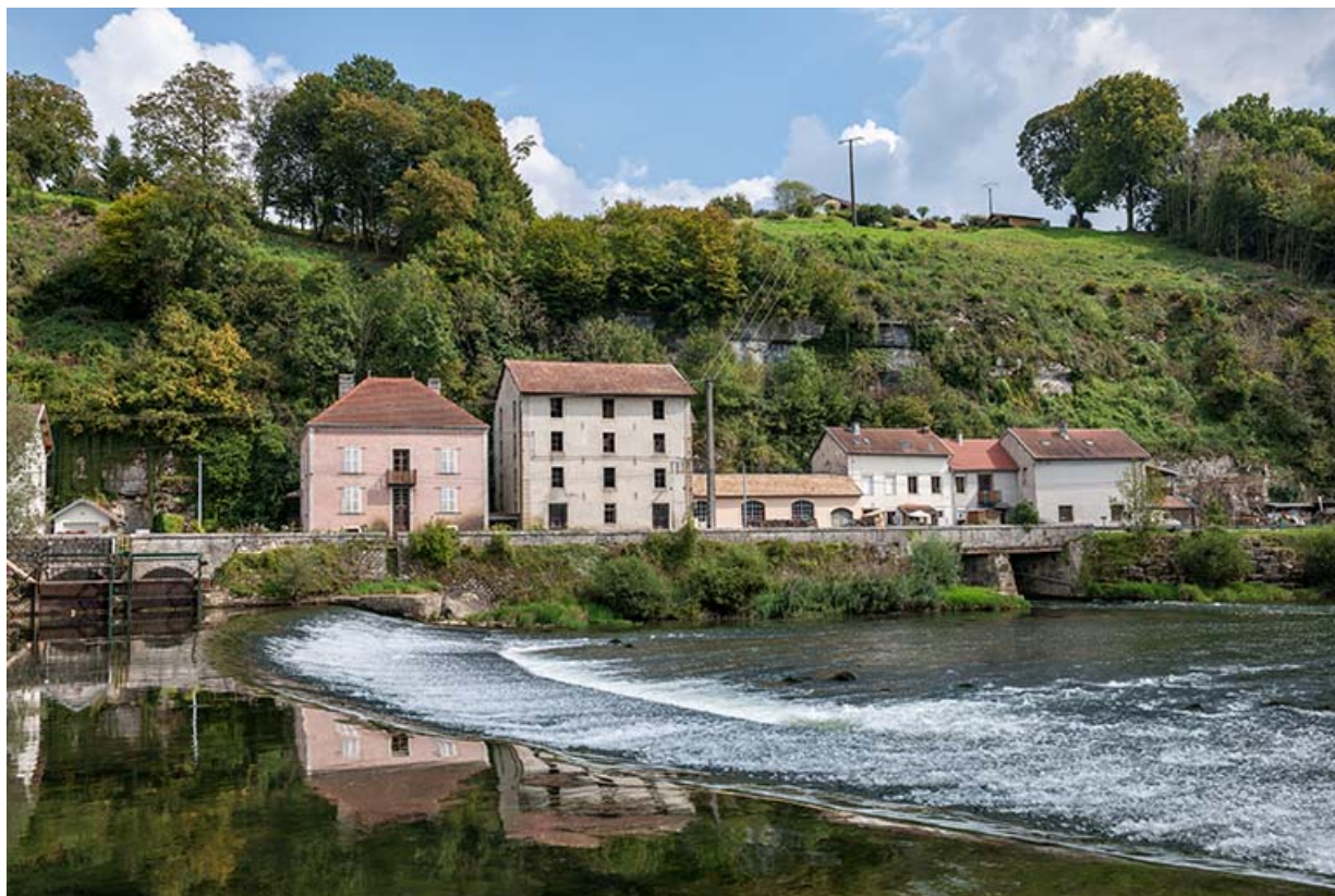
Vue d'ensemble depuis la rive droite.