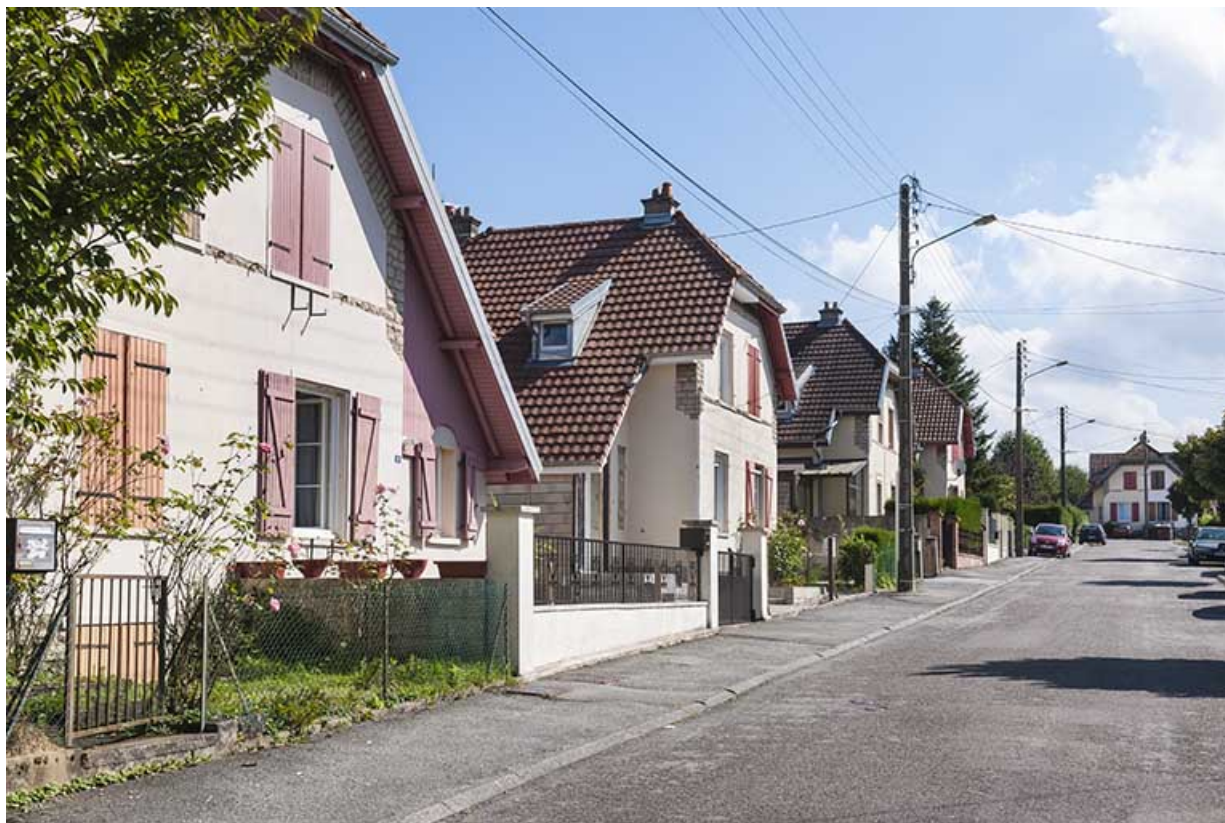
Maisons jumelées (côté est) dans le haut de la rue.