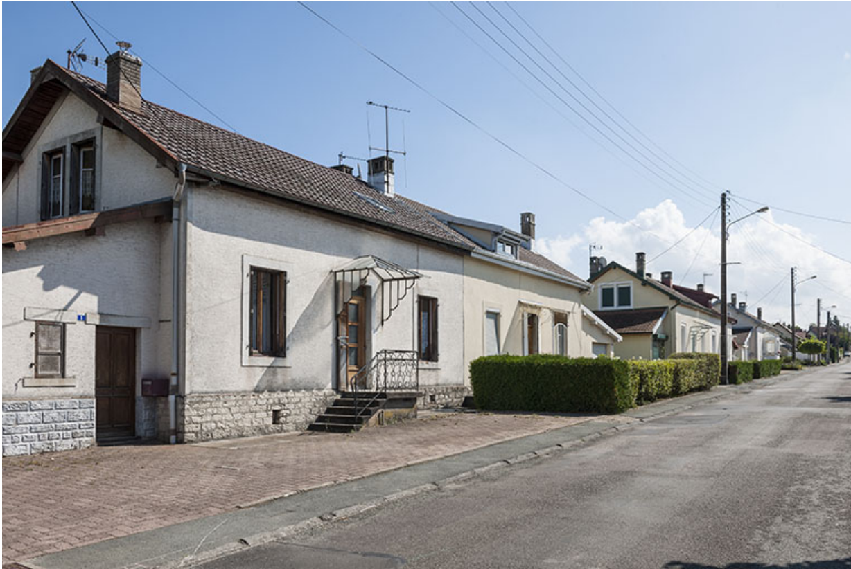
Maisons situées côté est de la rue Voulot. 25, L'Isle-sur-le-Doubs rue Voulot