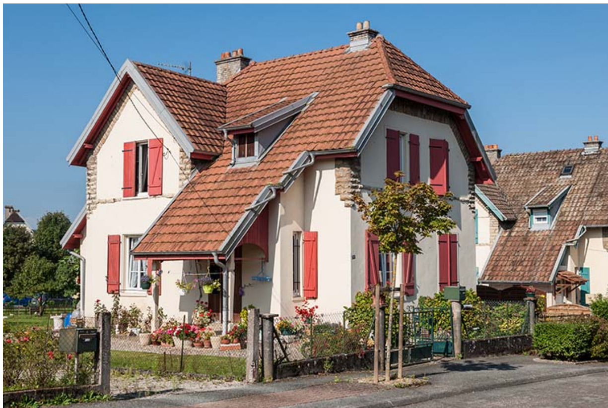
Maison vue de trois quarts gauche.