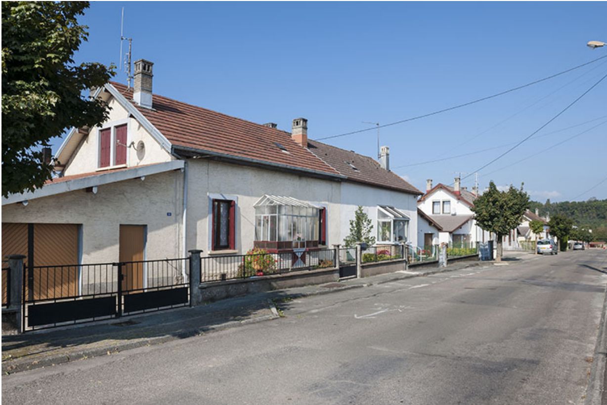
Maisons jumelées sur le côté ouest de la rue Voulot.