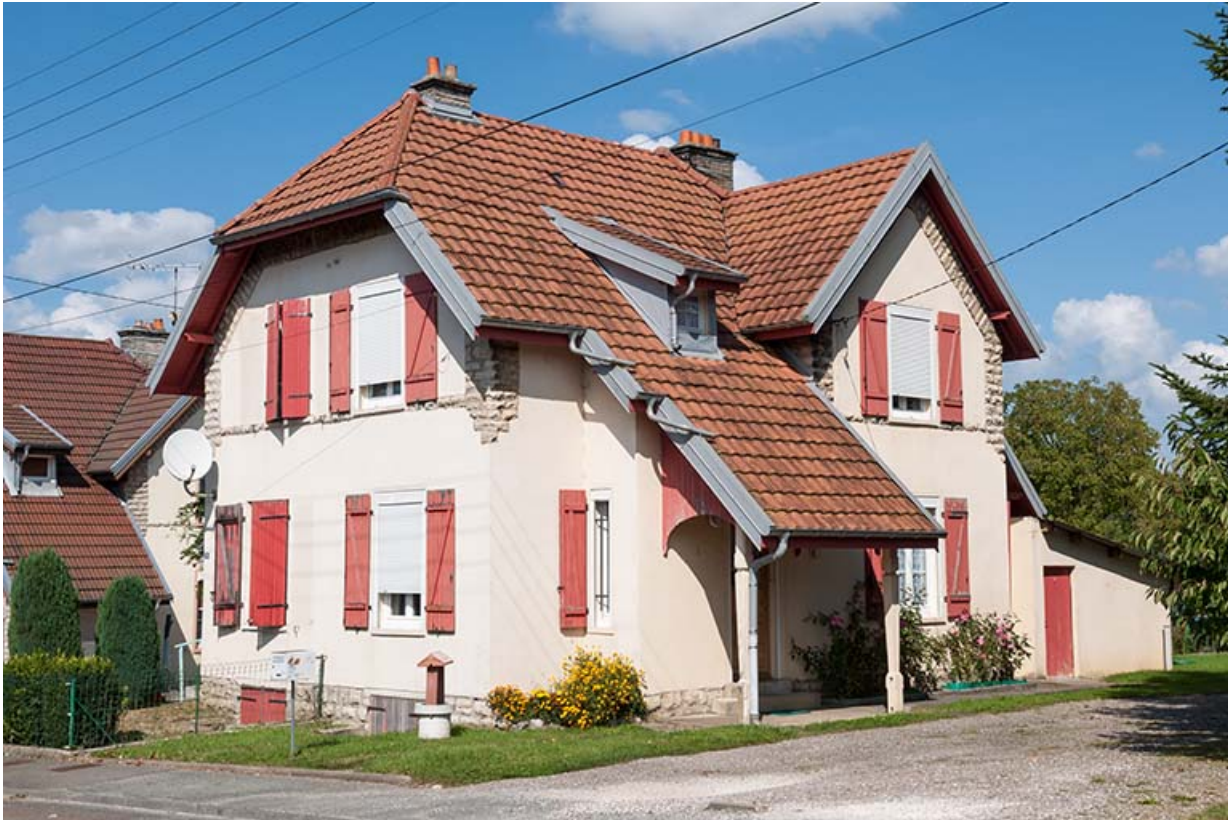
Maison vue de trois quarts droite.