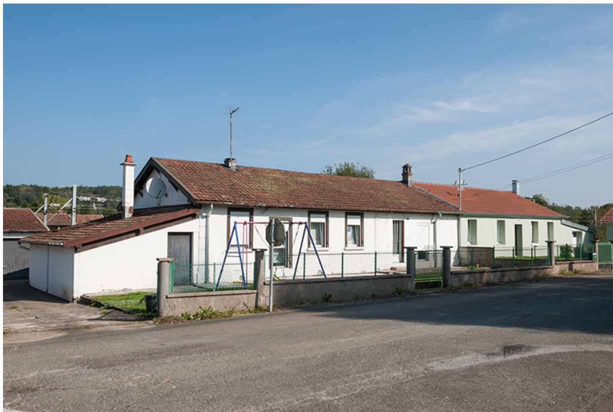
Habitation en rez-de-chaussée (3 logements). 25, L'Isle-sur-le-Doubs rue Voulot