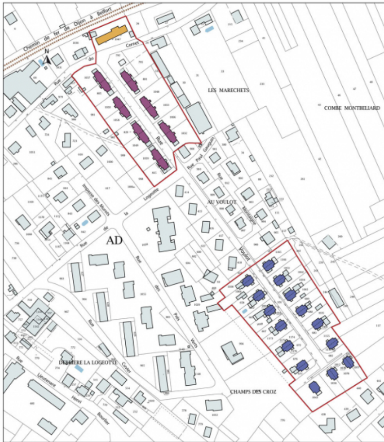
Plan-masse et de situation. Extrait du plan cadastral, 2015, section AD. 25, L'Isle-sur-le-Doubs rue Voulot