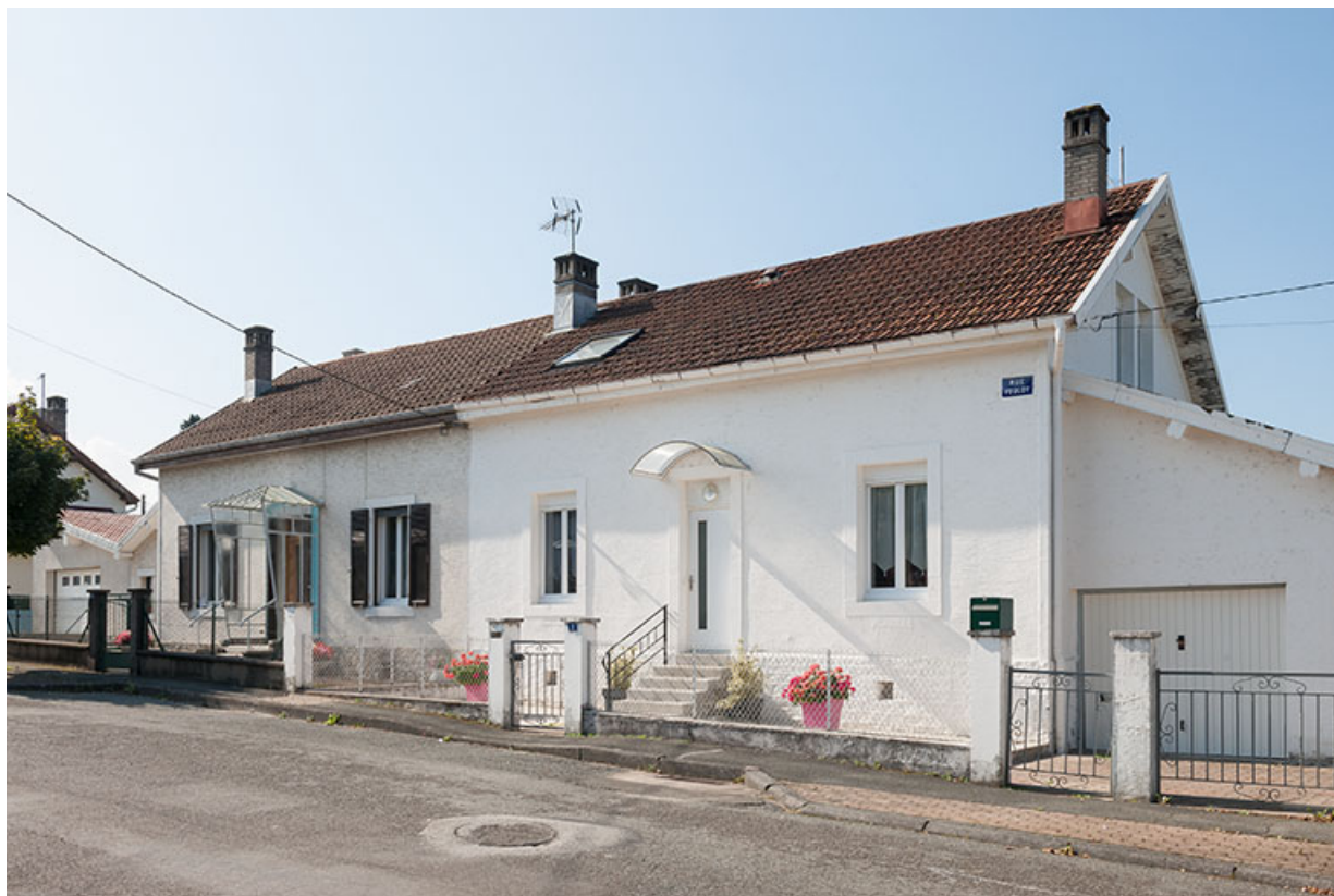
Maison jumelée vue de trois quarts droite.