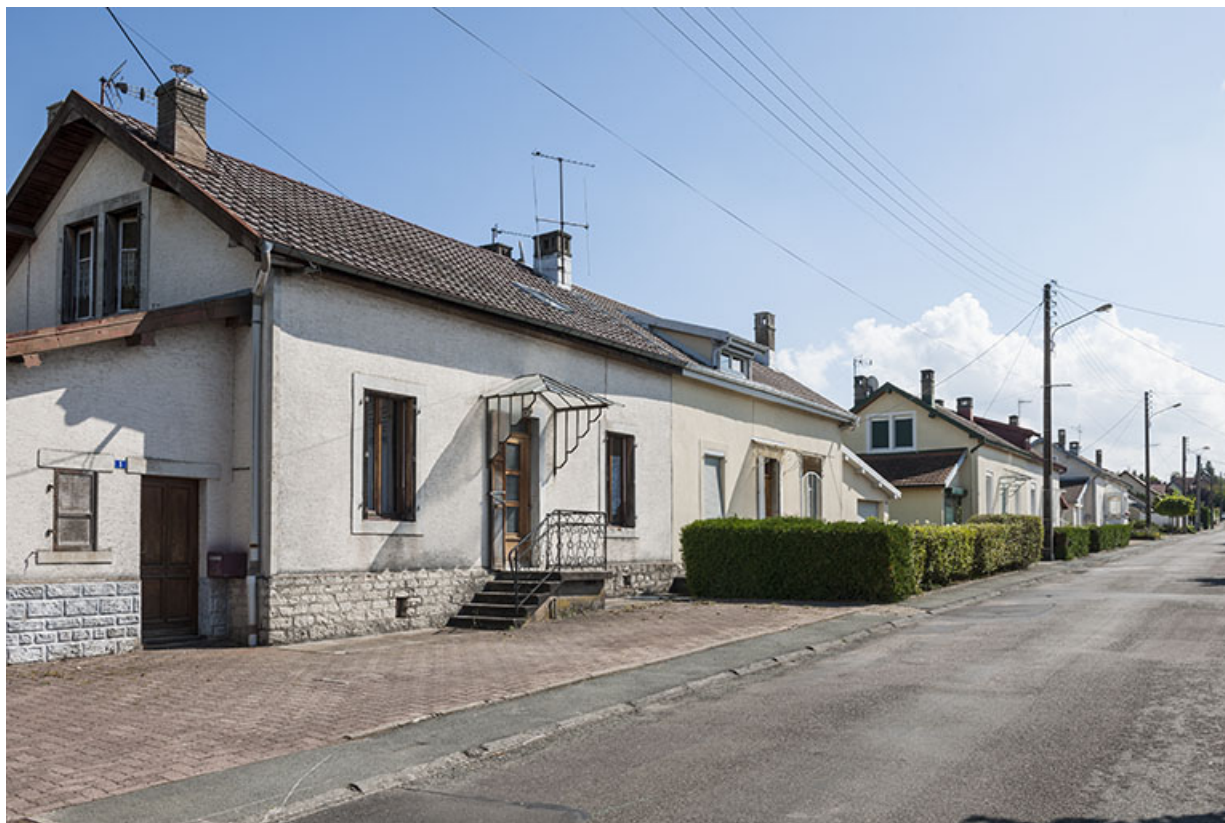
Maisons situées côté est de la rue Voulot. 25, L'Isle-sur-le-Doubs rue Voulot