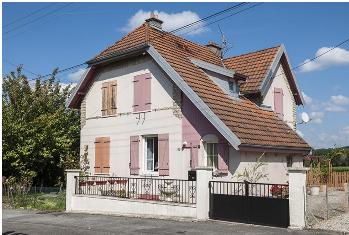
Maison vue de trois quarts droite.