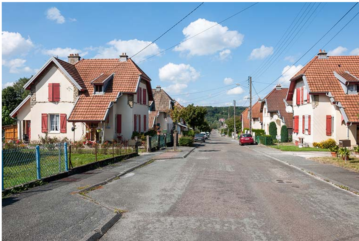
Vue d'ensemble depuis le haut de la rue Voulot. 25, L'Isle-sur-le-Doubs rue Voulot