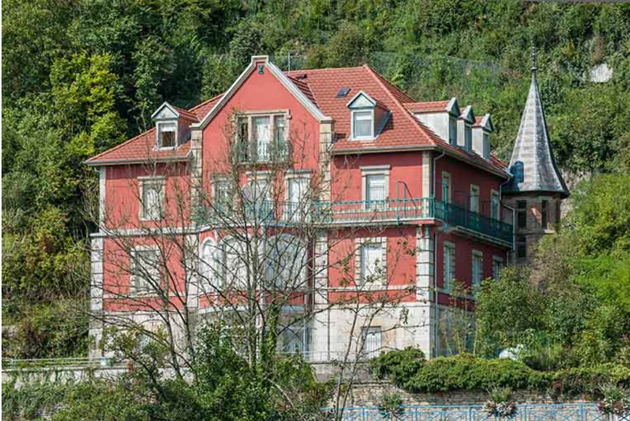
La demeure vue de trois quarts droite.