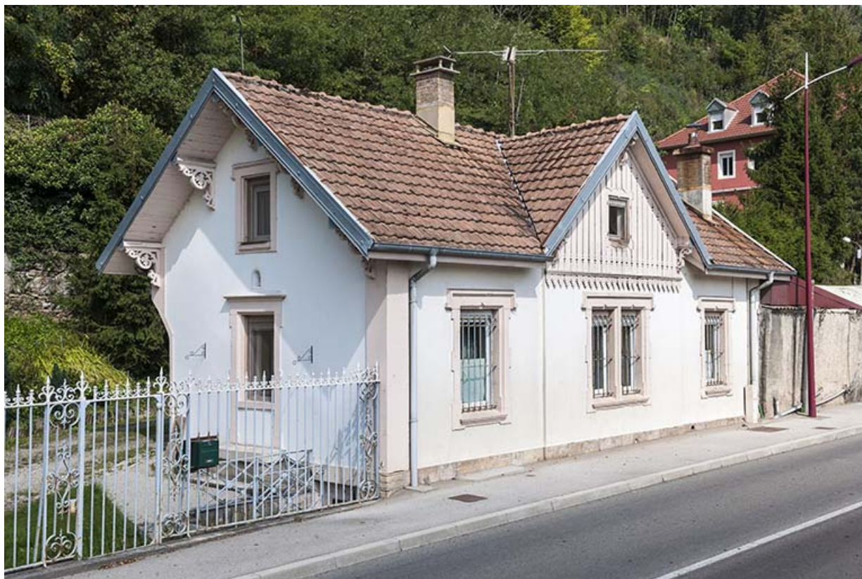
La conciergerie vue de trois quarts gauche.