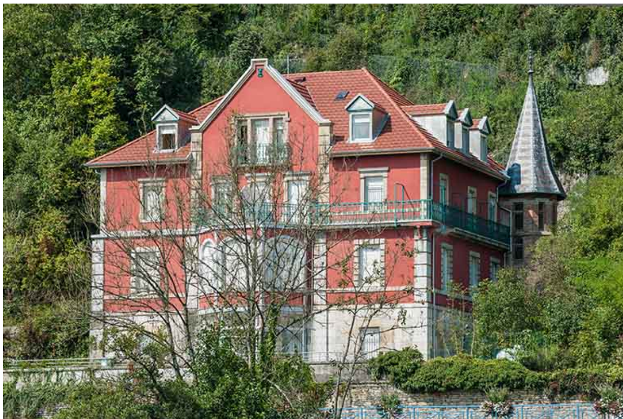
La demeure vue de trois quarts droite.