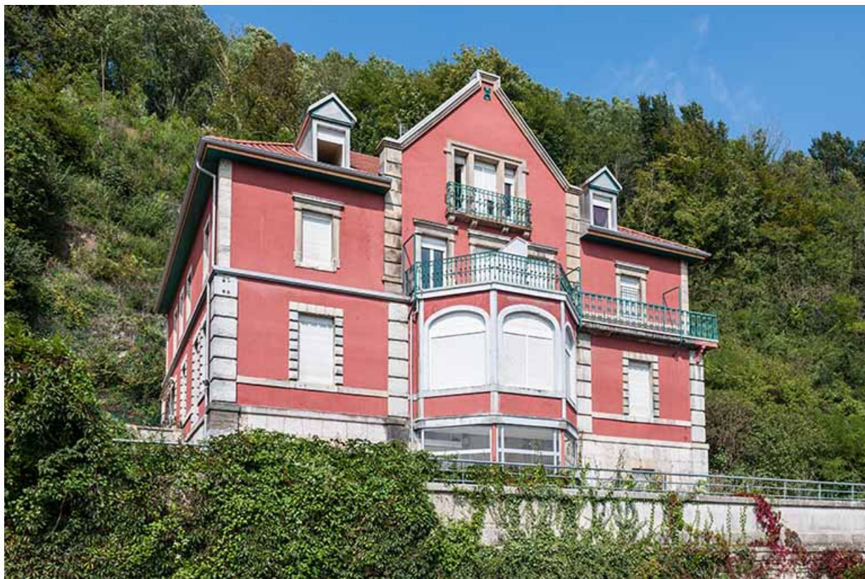
La demeure vue depuis la route nationale.