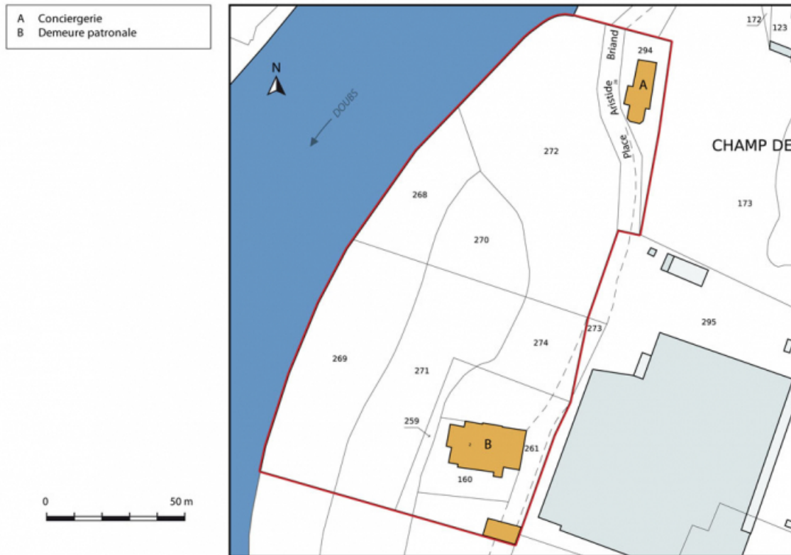
Plan-masse et de situation. Extrait du plan cadastral, 2015, section AI. 25, L'Isle-sur-le-Doubs, 2 et 2 bis place Aristide Briand