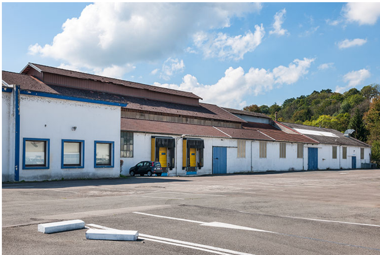
Façade nord vue de trois quarts. 25, L'Isle-sur-le-Doubs avenue Foch