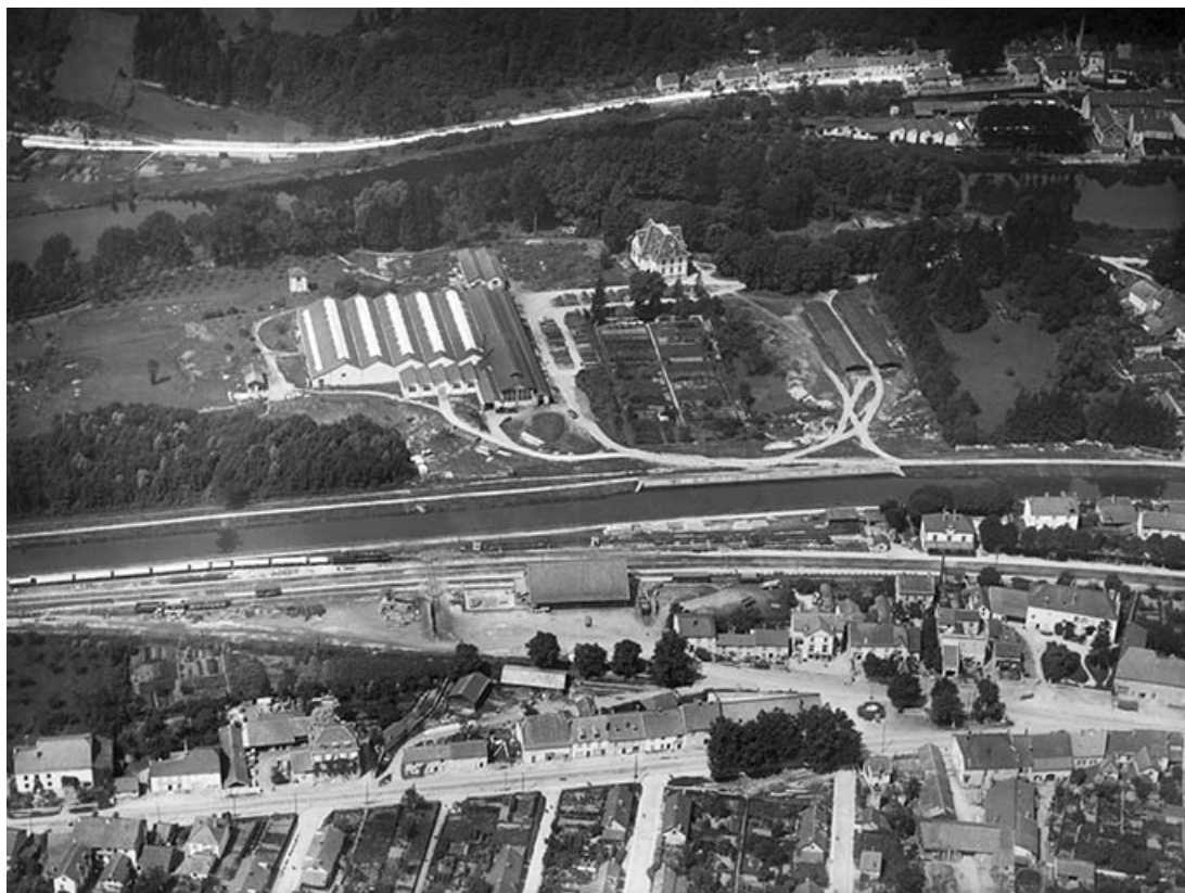
Vue aérienne depuis l'est vers 1950. 25, L'Isle-sur-le-Doubs avenue Foch