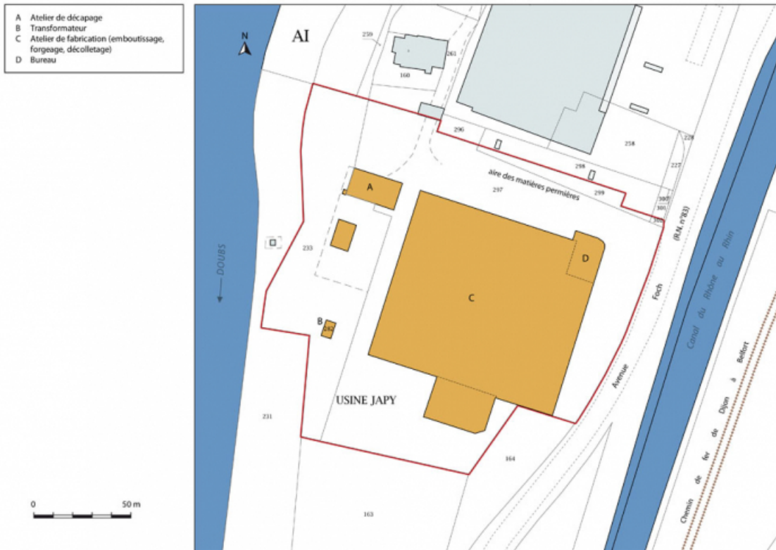
Plan-masse et de situation. Extrait du plan cadastral, 2015, section AI. 25, L'Isle-sur-le-Doubs avenue Foch