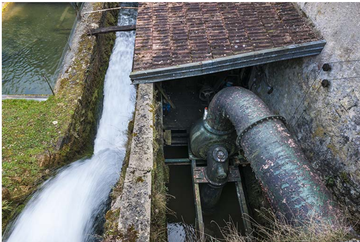
Déversoir (à gauche) et conduite forcée de la turbine. 25, Villars-sous-Dampjoux, lieudit : Les Grandes Planches