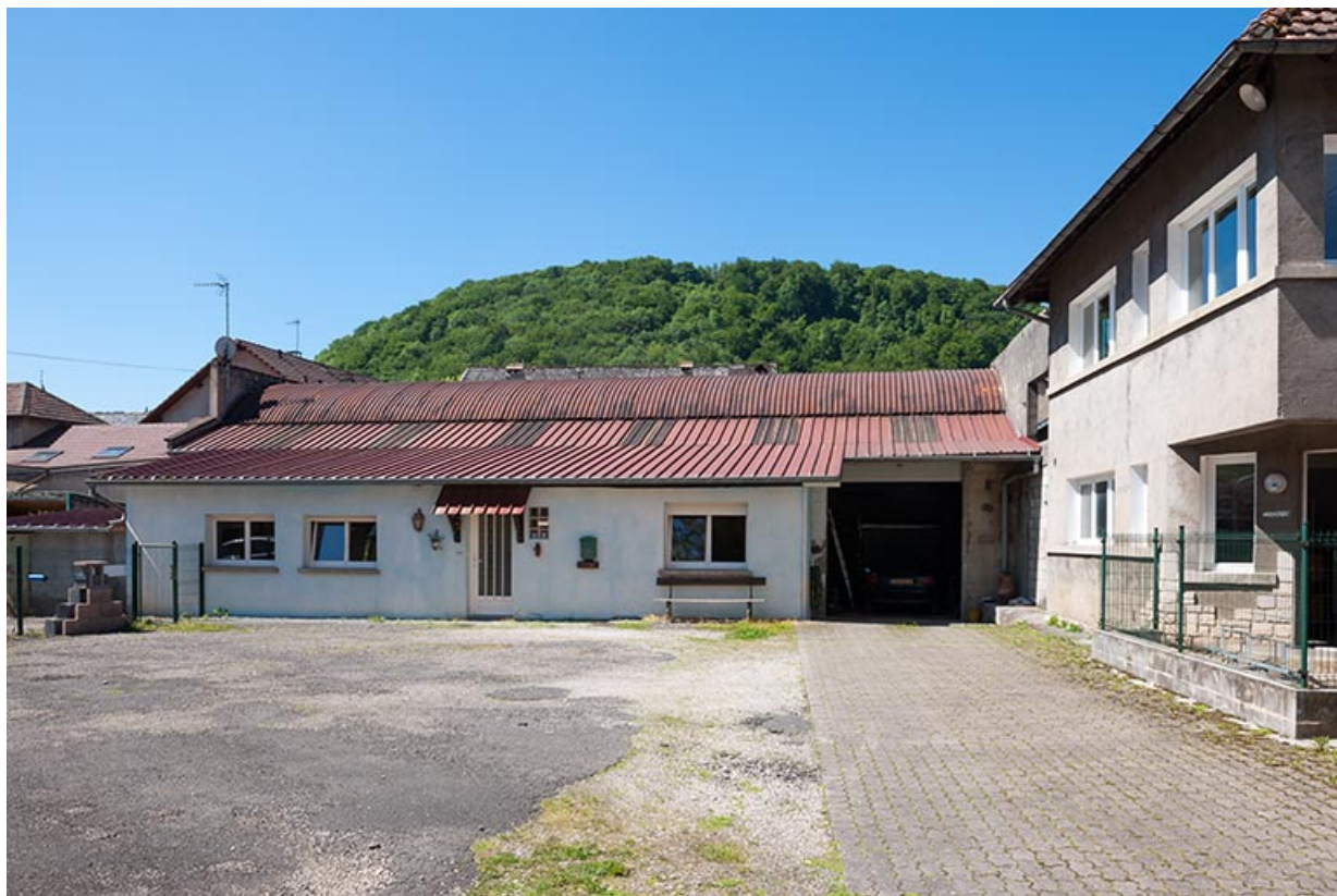
Atelier primitif (?) et bureau (à droite). 25, Villars-sous-Dampjoux rue du Stade