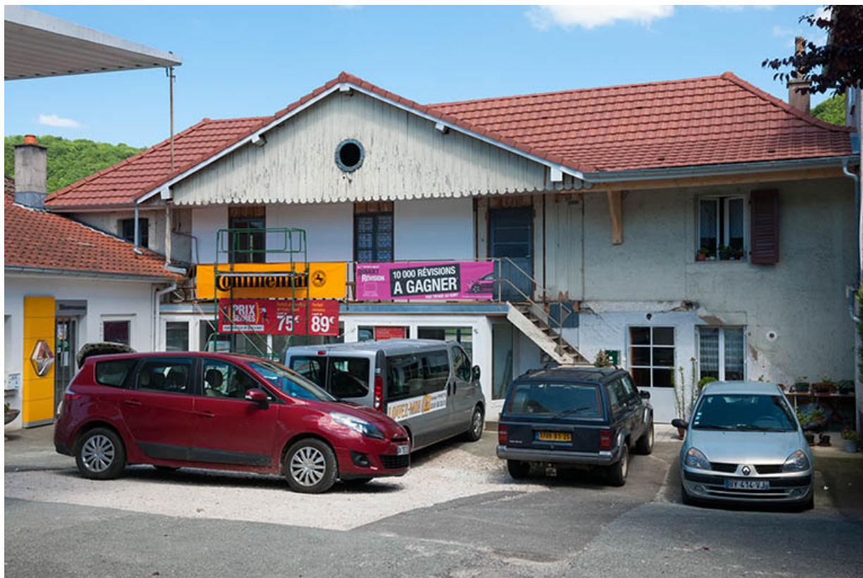
Façade ouest (ancien atelier de menuiserie). 25, Pont-de-Roide, 23 rue de Montbéliard