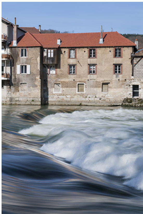
Façade est de l'atelier de menuiserie.

25, Pont-de-Roide, 23 rue de Montbéliard