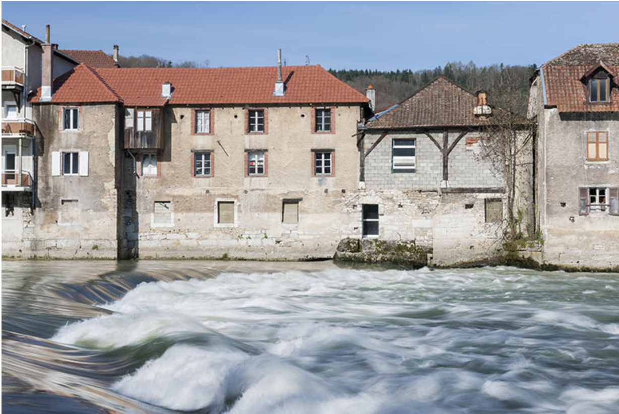
Façade sur le Doubs des ateliers.

25, Pont-de-Roide, 23 rue de Montbéliard