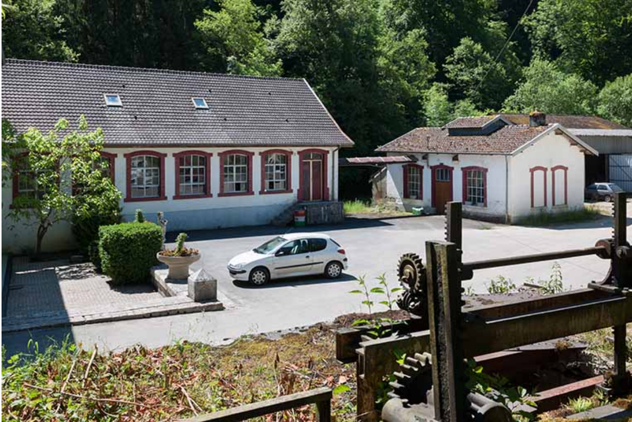
Atelier de quincaillerie et forge depuis le nord.

25, Feule, lieudit : le moulin de chez la Dinette