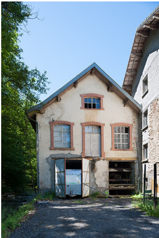
Pignon est de l'atelier de quincaillerie. La turbine est visible à droite, à l'étage de soubassement. 25, Feule, lieudit : le moulin de chez la Dinette