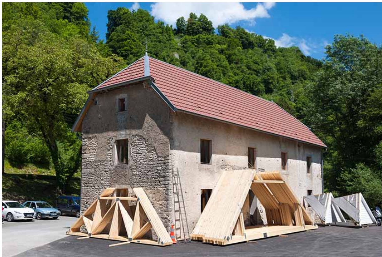
Bâtiment agricole depuis le sud-ouest.