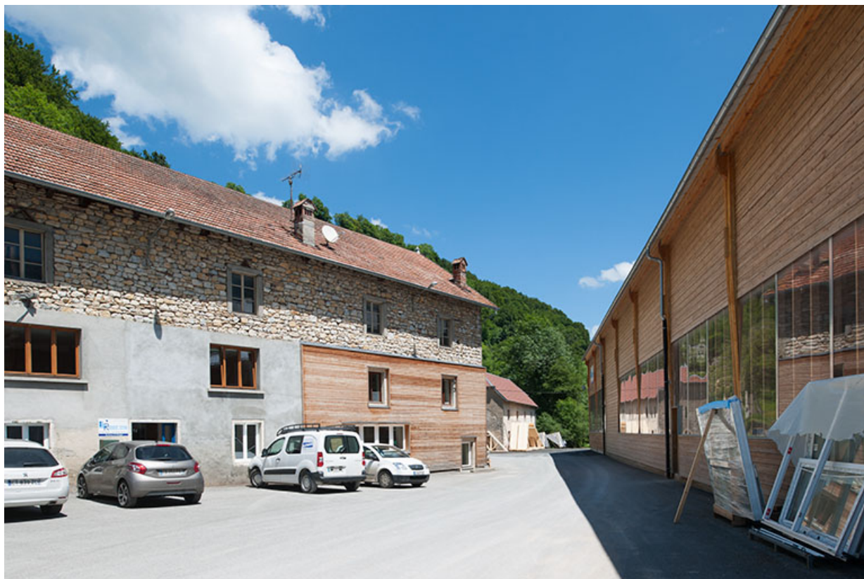
Bâtiment du moulin (à gauche) et de l'entreprise de charpente (à droite). 25, Feule, lieudit : la Barbèche