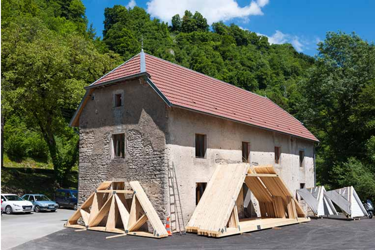
Bâtiment agricole depuis le sud-ouest.