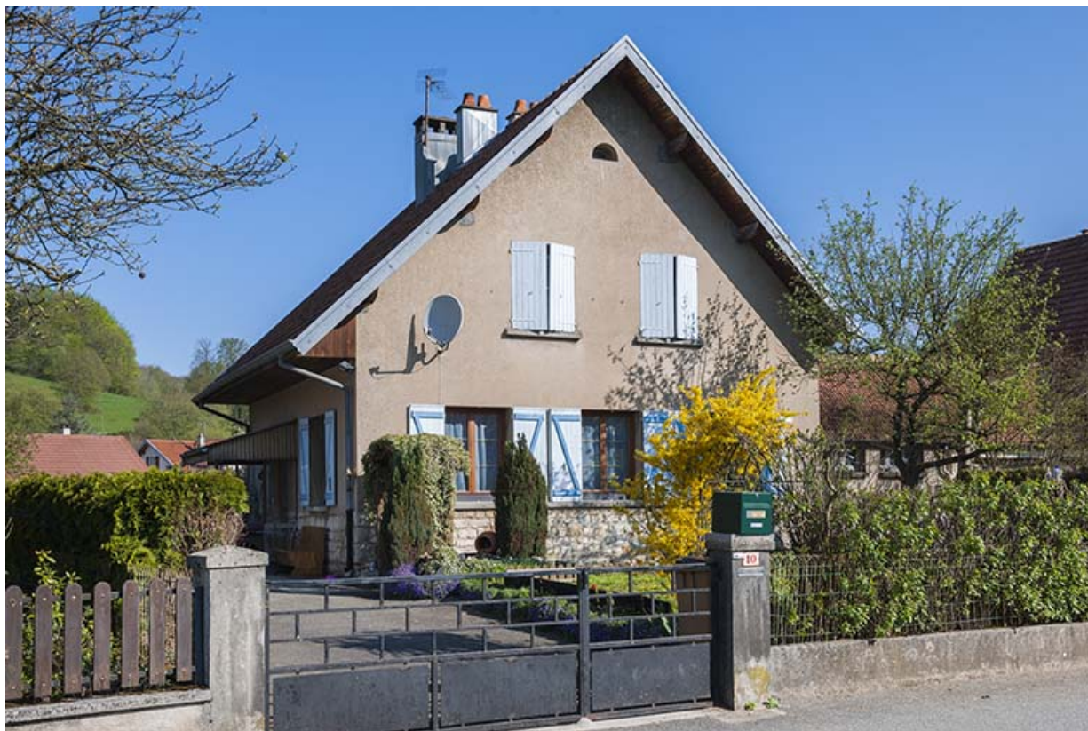
Façade antérieure d'une maison (rue des Ecoles).

25, Bourguignon, 4 à 17 rue de Champagne