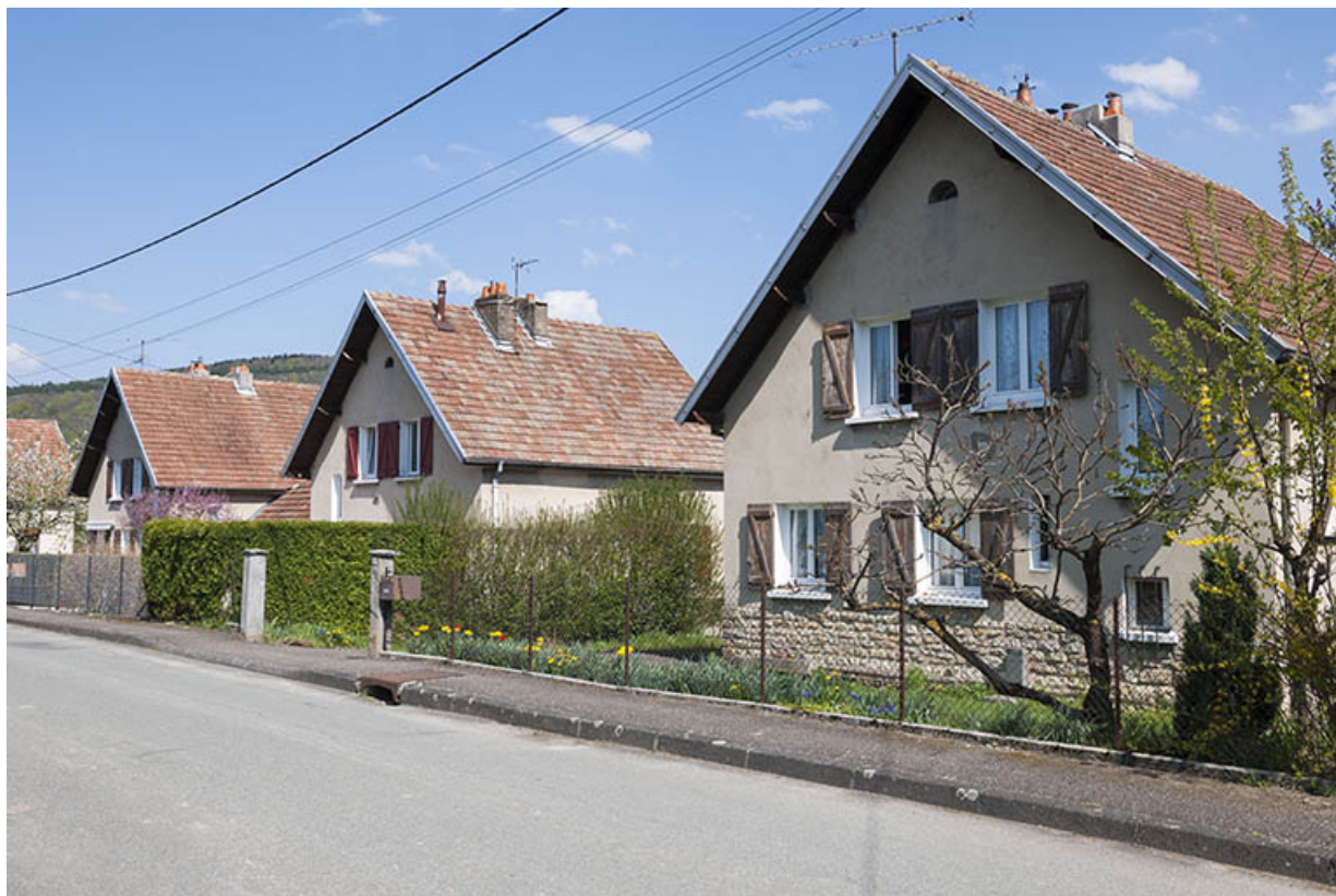
Alignement de façades rue de Champagne. 25, Bourguignon, 4 à 17 rue de Champagne