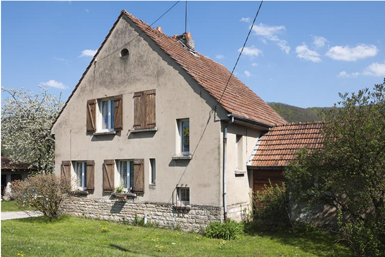
Façade antérieure d'une maison.

25, Bourguignon, 4 à 17 rue de Champagne