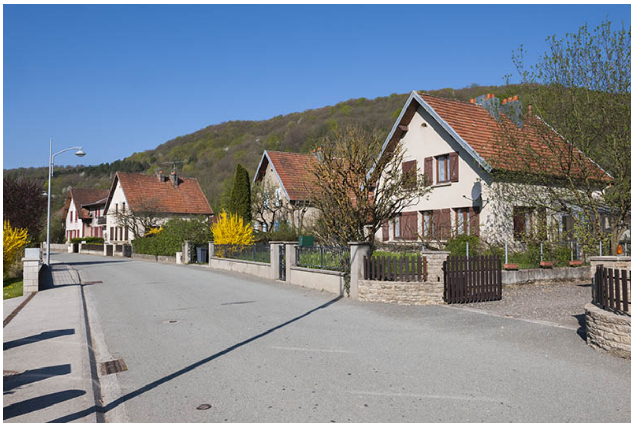
Vue d'ensemble depuis la rue des Ecoles. 25, Bourguignon, 4 à 17 rue de Champagne