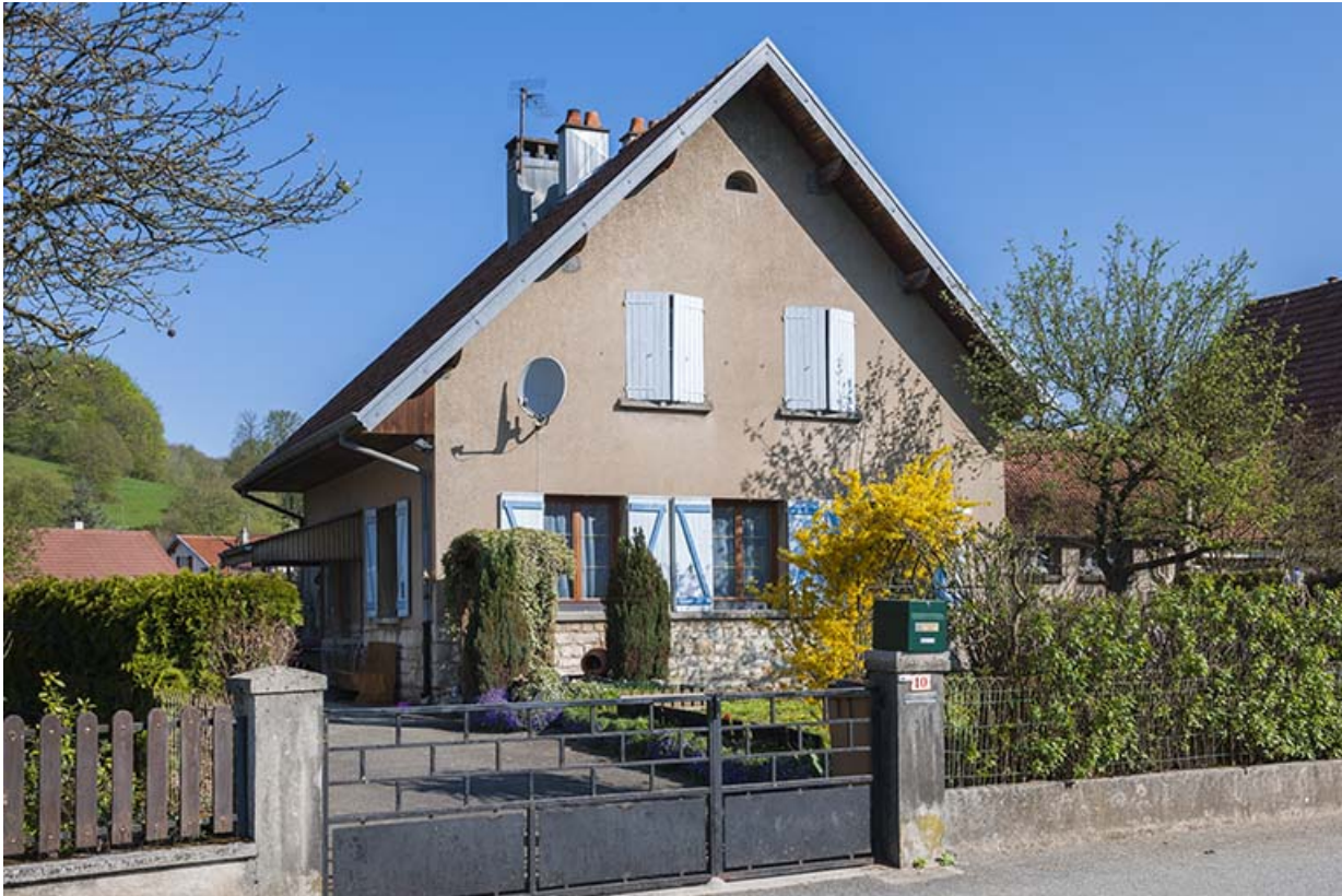
Façade antérieure d'une maison (rue des Ecoles).

25, Bourguignon, 4 à 17 rue de Champagne