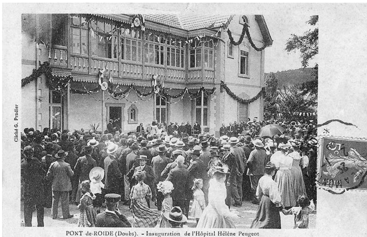
Pont-de-Roide (Doubs) - Inauguration de l'hôpital Héléne Peugeot. Carte postale, s.d. [1907] 25, Pont-de-Roide, 42 rue du général Herr