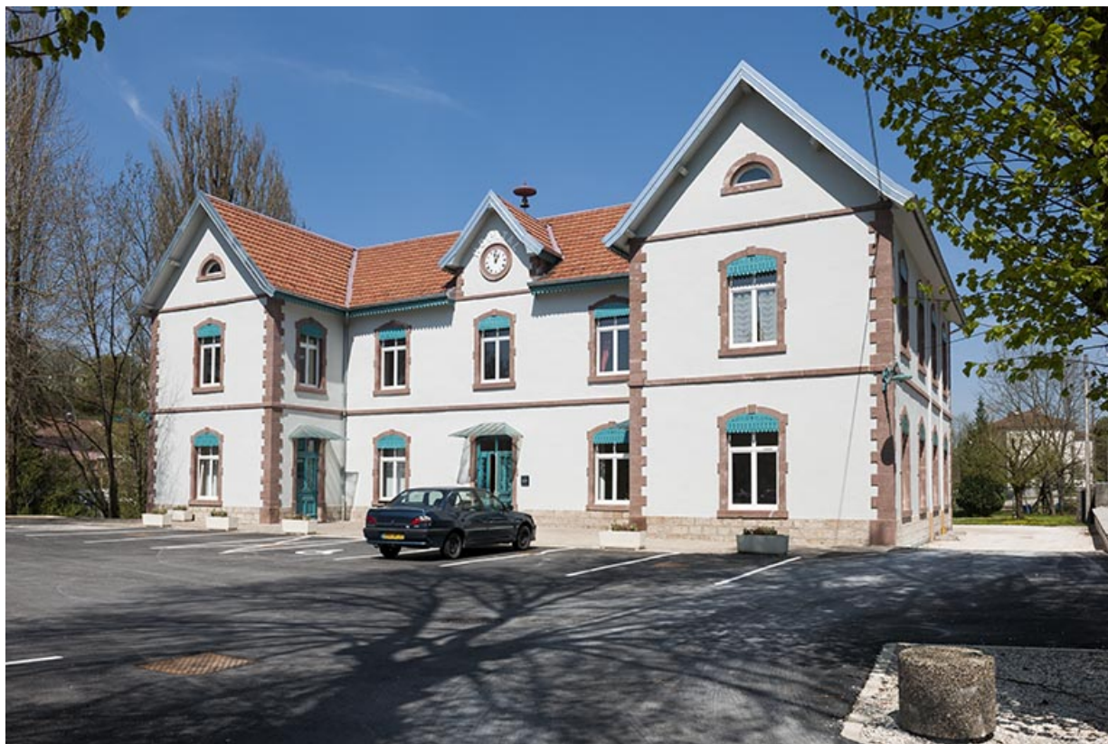
Façade sud vue de trois quarts.

25, Pont-de-Roide, 42 rue du général Herr