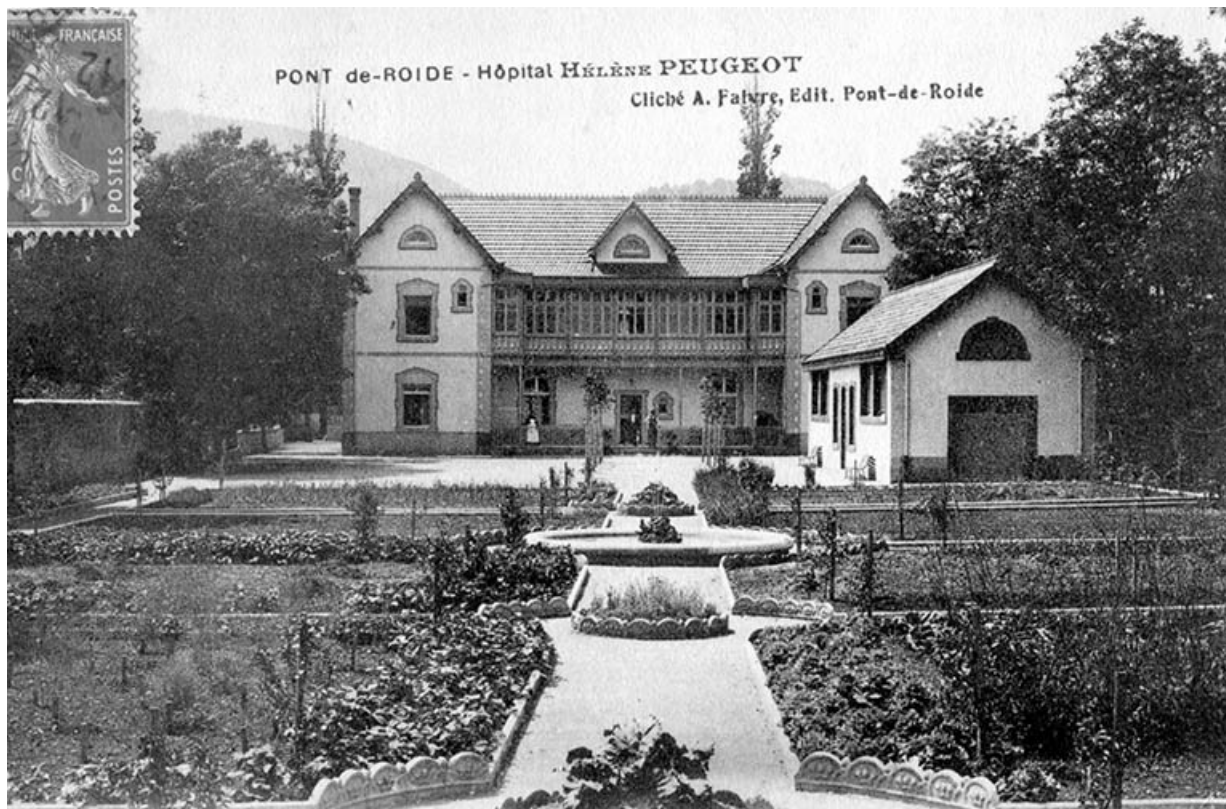
Pont-de-Roide - Hôpital Hélène Peugeot. Carte postale, s.d. [vers 1910] 25, Pont-de-Roide, 42 rue du général Herr