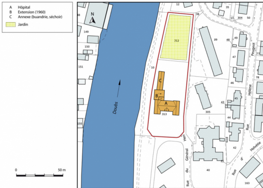
Plan-masse et de situation. Extrait du plan cadastral numérisé, section AM, échelle 1:1000.

25, Pont-de-Roide, 42 rue du général Herr