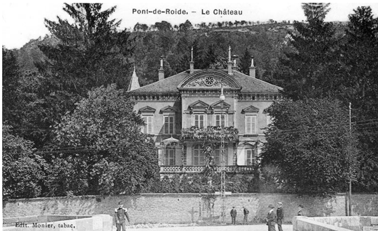
Pont-de-Roide - Le Château. Carte postale, édit. Monier, s.d. [fin 19e ou début 20e siècle]. 25, Pont-de-Roide, 1 rue du général Herr