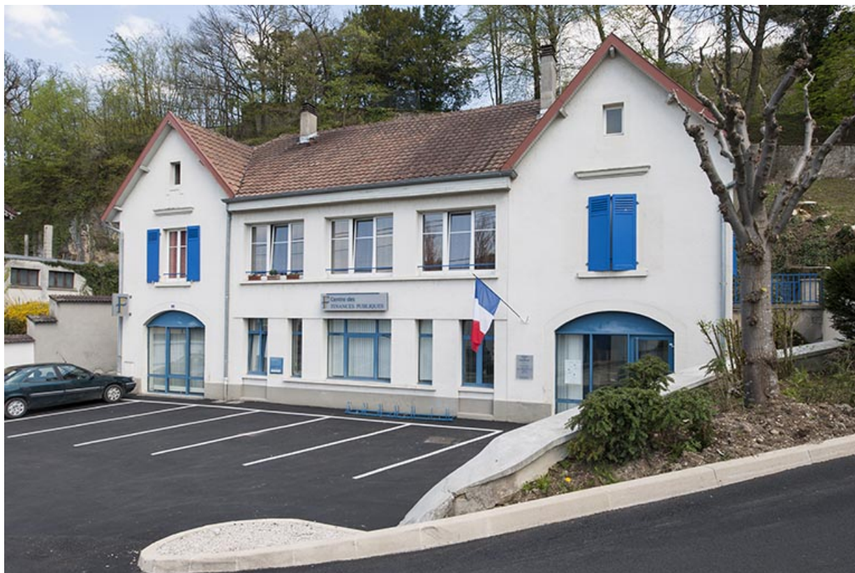
Dépendances (remises et écuries). Vue de trois quarts.

25, Pont-de-Roide, 1 rue du général Herr