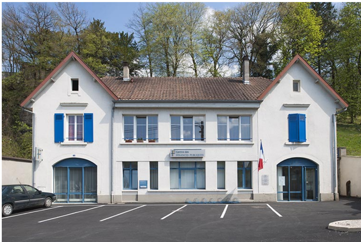
Dépendances (remises et écuries). Vue de face.

25, Pont-de-Roide, 1 rue du général Herr