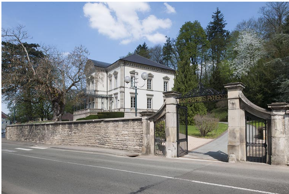
Vue rapprochée depuis le sud-ouest.

25, Pont-de-Roide, 1 rue du général Herr