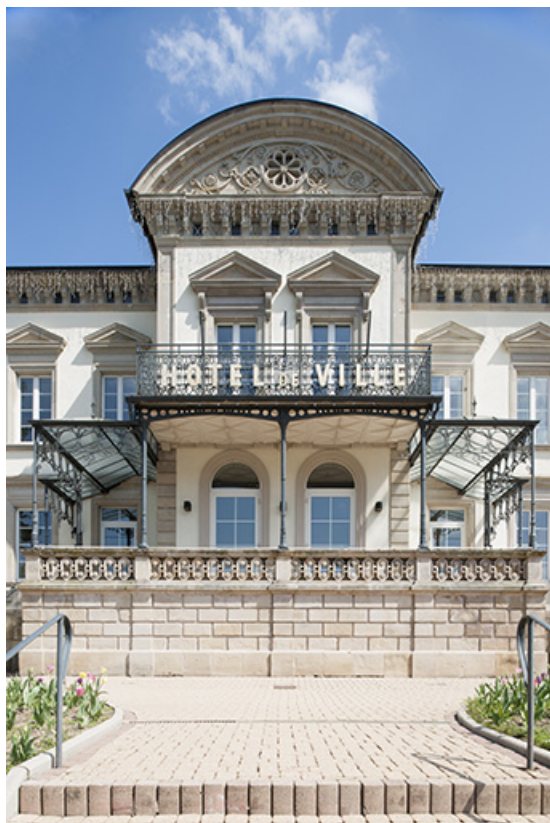
Façade antérieure. Détail de l'avant-corps central.

25, Pont-de-Roide, 1 rue du général Herr