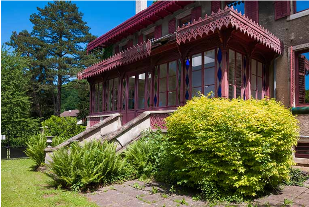
Véranda sur la façade ouest.