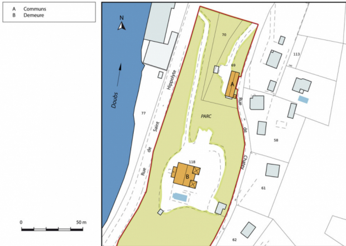
Plan-masse et de situation. Extrait du plan cadastral numérisé, section AO, échelle 1:1000. 25, Pont-de-Roide, 1 rue de Chatey