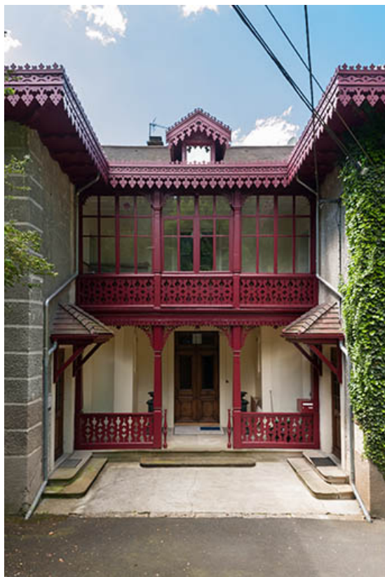
Façade est. Détail de l'entrée.