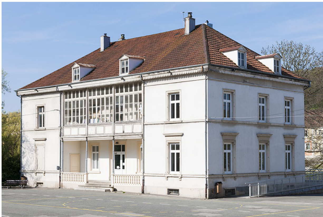
Façade est vue de trois quarts droite.

25, Pont-de-Roide, 14 rue du général Herr