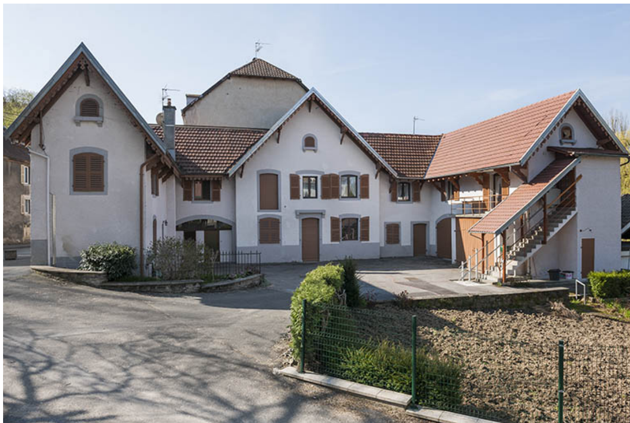
Dépendances (logement, remises et écuries).