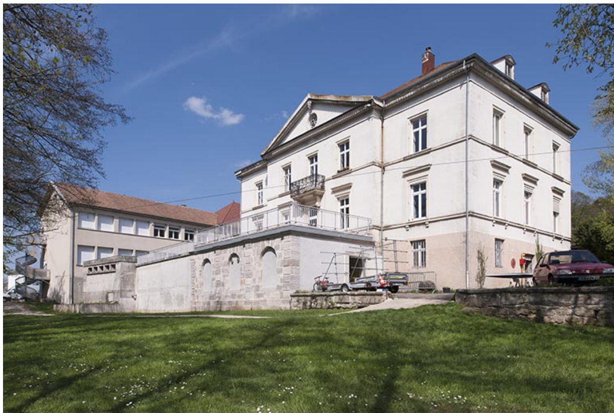
Façade ouest et sa terrasse. Vue de trois quarts.

25, Pont-de-Roide, 14 rue du général Herr