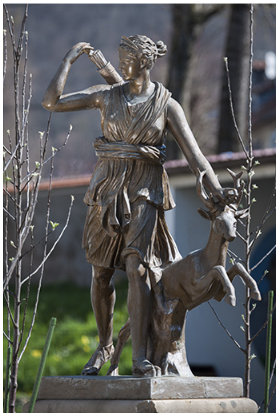
Statue en fonte de Diane (aujourd'hui dans la cour de l'école).

25, Pont-de-Roide, 14 rue du général Herr