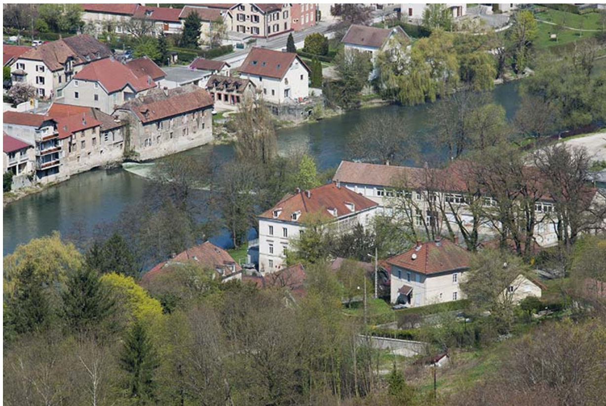
Vue d'ensemble plongeante depuis le sud-est.

25, Pont-de-Roide, 14 rue du général Herr