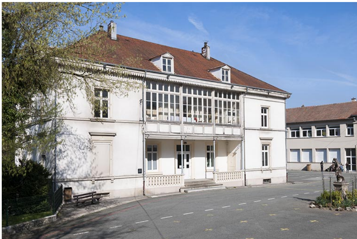
Façade est vue de trois quarts gauche. 25, Pont-de-Roide, 14 rue du général Herr