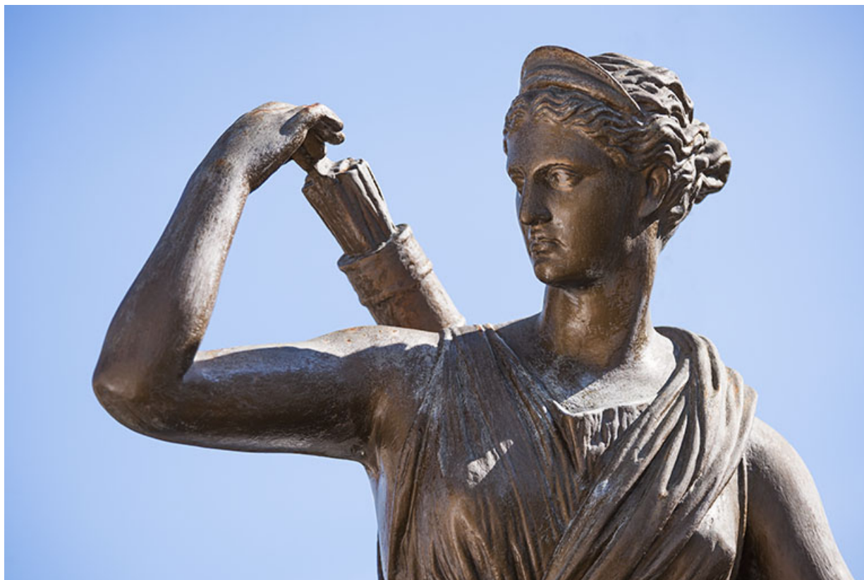
Statue en fonte de Diane. Détail de la partie supérieure.

25, Pont-de-Roide, 14 rue du général Herr