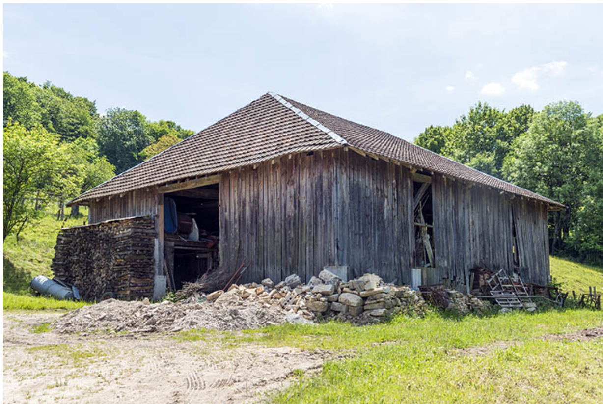
Manège (transféré au hameau de Chatey). 25, Pont-de-Roide, 14 rue du général Herr