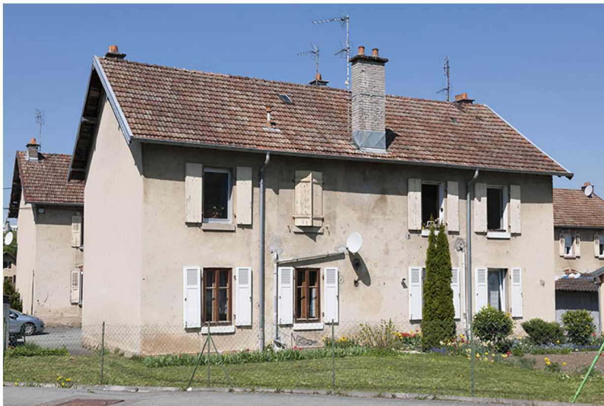
Façade postérieure d'une habitation.