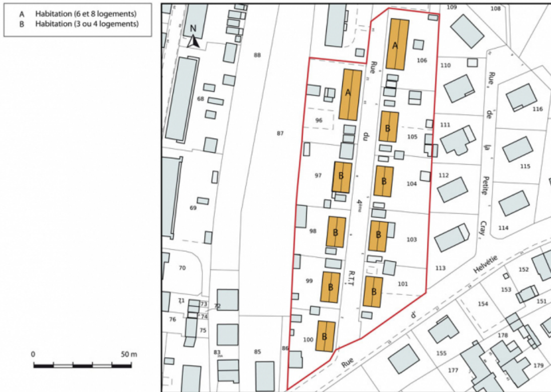
Plan-masse et de situation. Extrait du plan cadastral numérisé, section AM, échelle 1:1000. 25, Pont-de-Roide rue du 4ème RTT