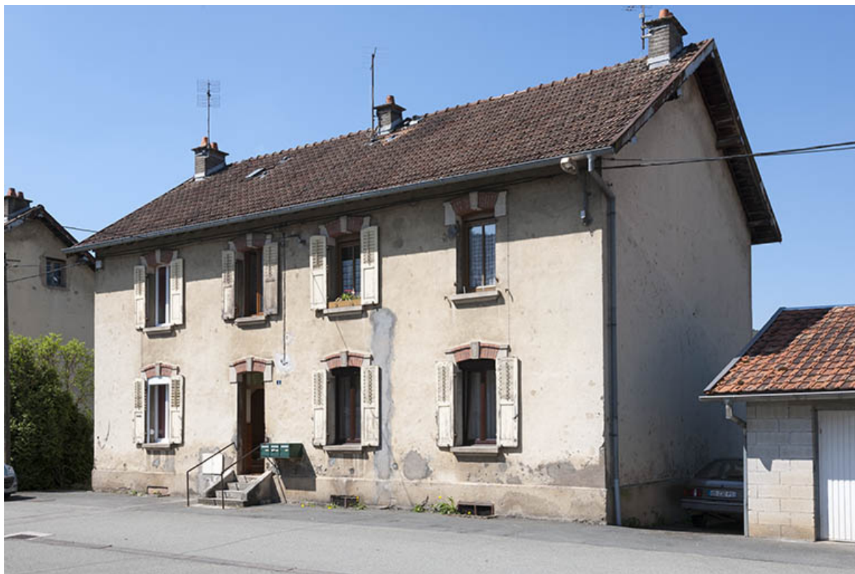
Habitation vue de trois quarts droite. 25, Pont-de-Roide rue du 4ème RTT