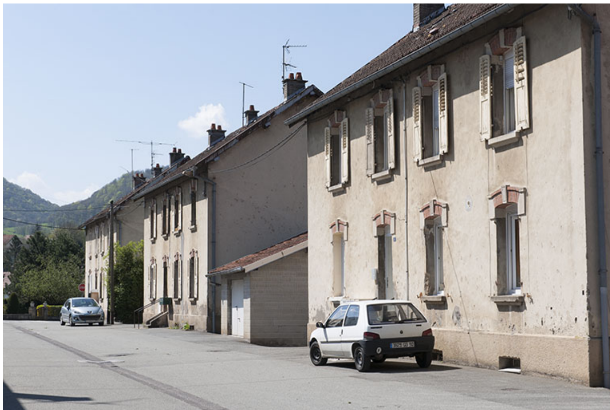
Façades antérieures d'habitations (3-4 logements). 25, Pont-de-Roide rue du 4ème RTT