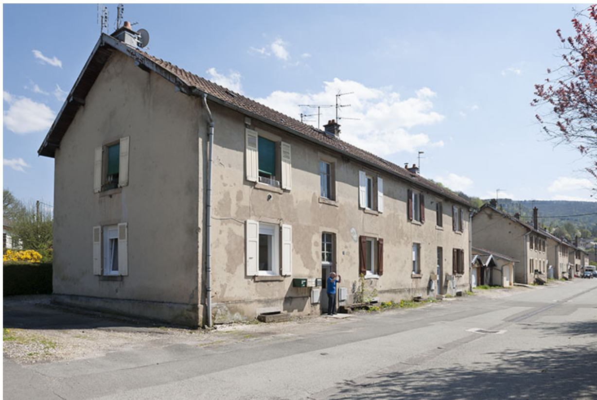
Façades ouest des habitations (côté impair). 25, Pont-de-Roide rue du 4ème RTT