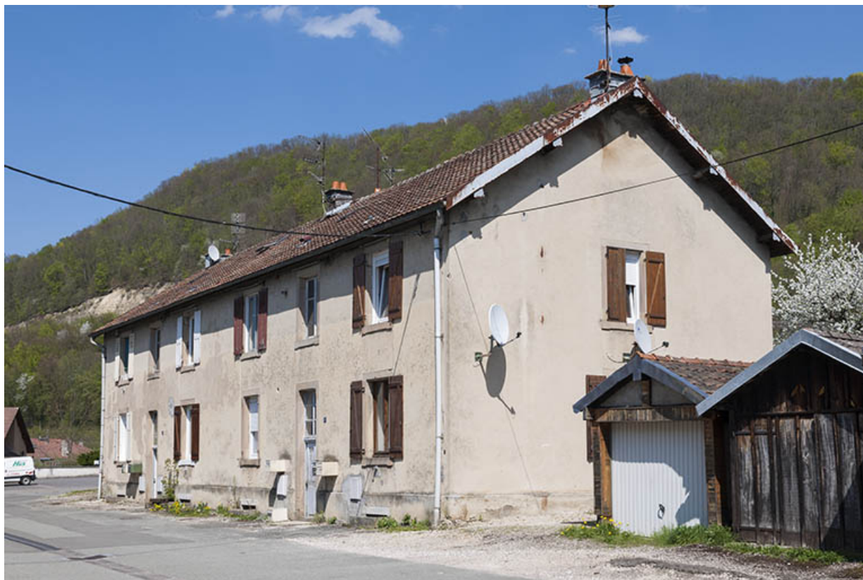
Habitation (6-8 logements) vue de trois quarts. 25, Pont-de-Roide rue du 4ème RTT