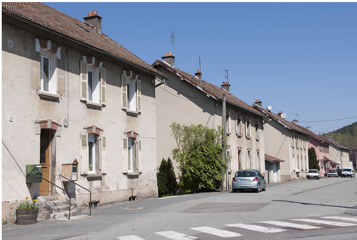
Alignement de façades rue du 4e R.T.T. 25, Pont-de-Roide rue du 4ème RTT