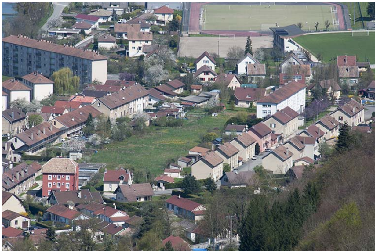
Vue d'ensemble depuis le sud (à droite). 25, Pont-de-Roide rue du 4ème RTT