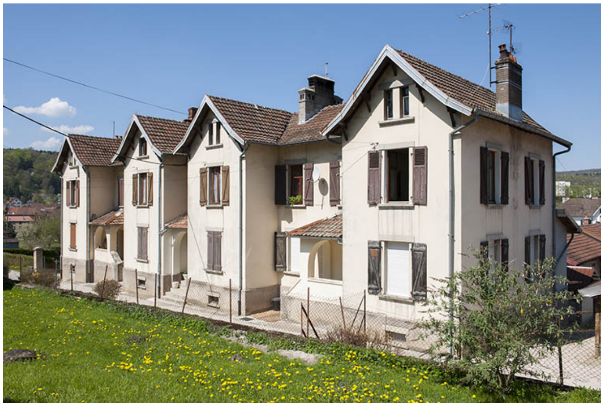
Logement de cadres (6 logements). Vue de trois quarts.