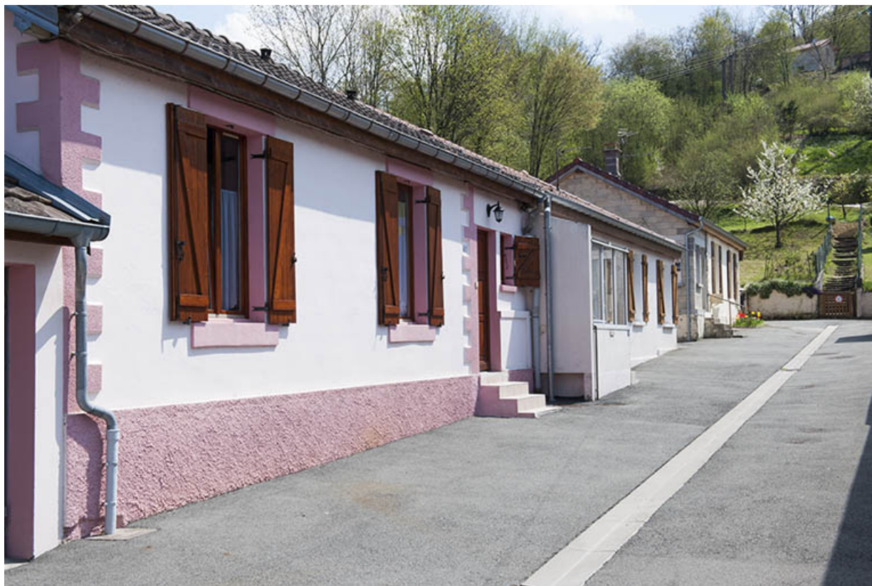
Ruelle perpendiculaire à la rue Emile Peugeot.