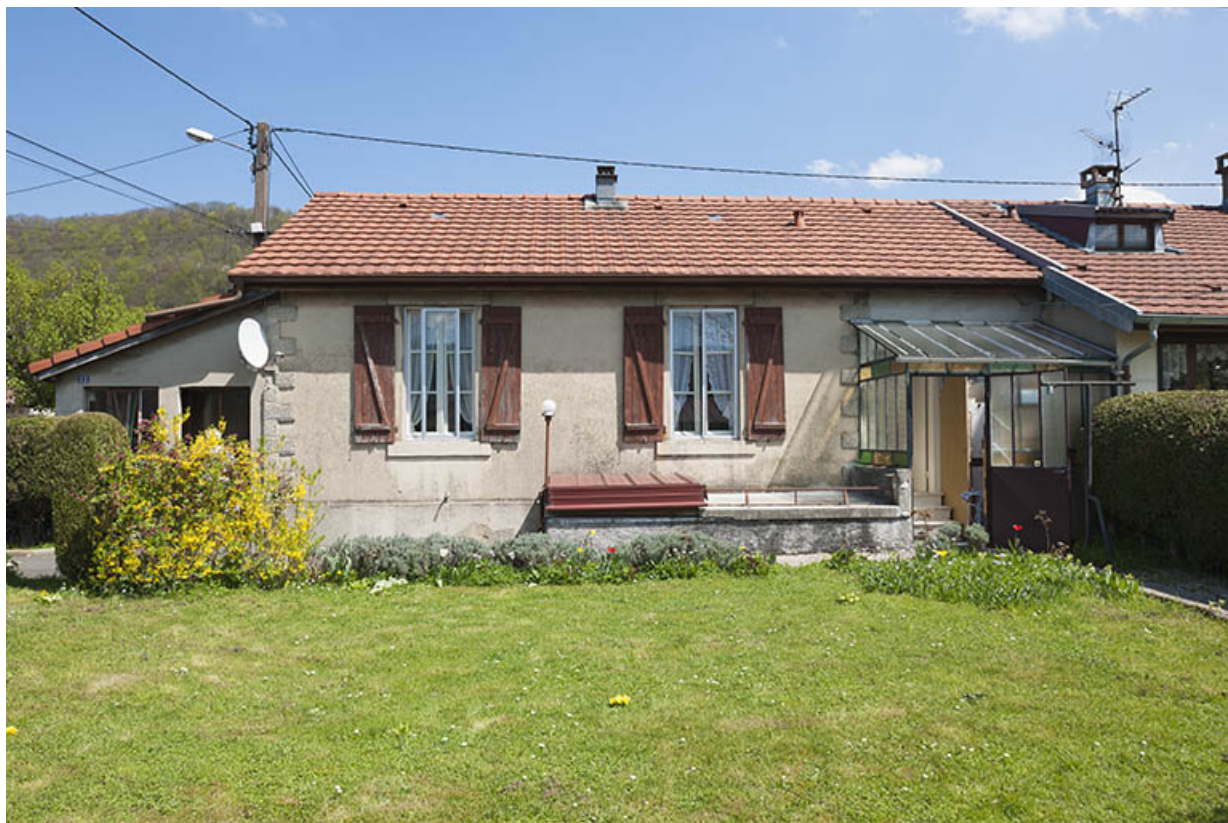
Façade postérieure d'une maison individuelle.