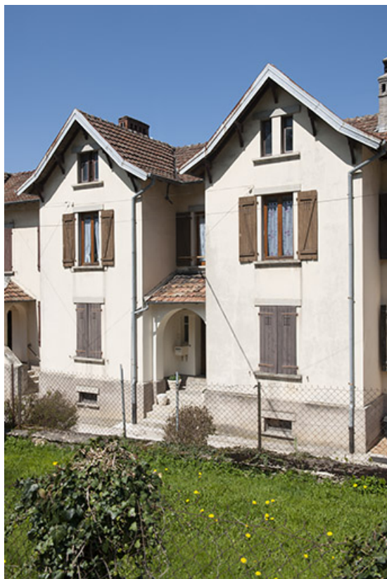
Logement de cadres. Détail de la façade sud.