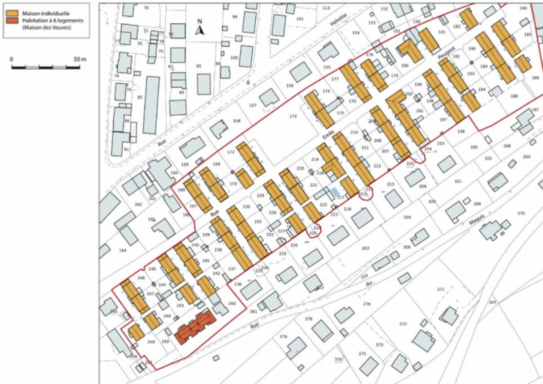
Plan-masse et de situation. Extrait du plan cadastral numérisé, section AM, échelle 1:1000. 25, Pont-de-Roide rue Emile Peugeot