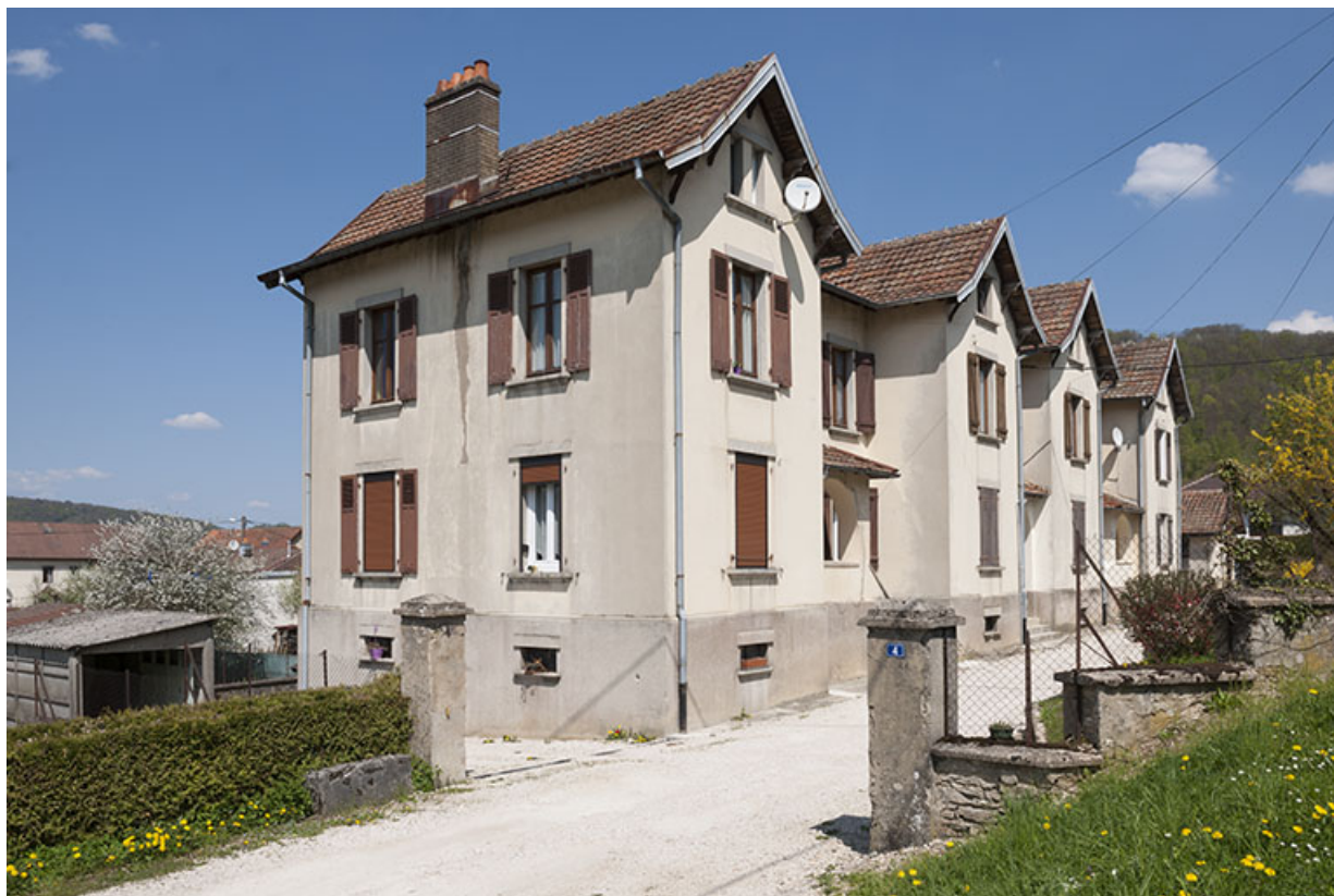
Maison de cadres (6 logements). Vue de trois quarts gauche.