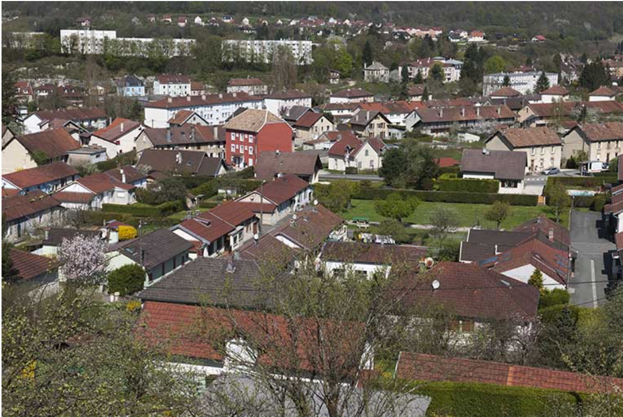
Vue d'ensemble depuis le sud (au second plan).