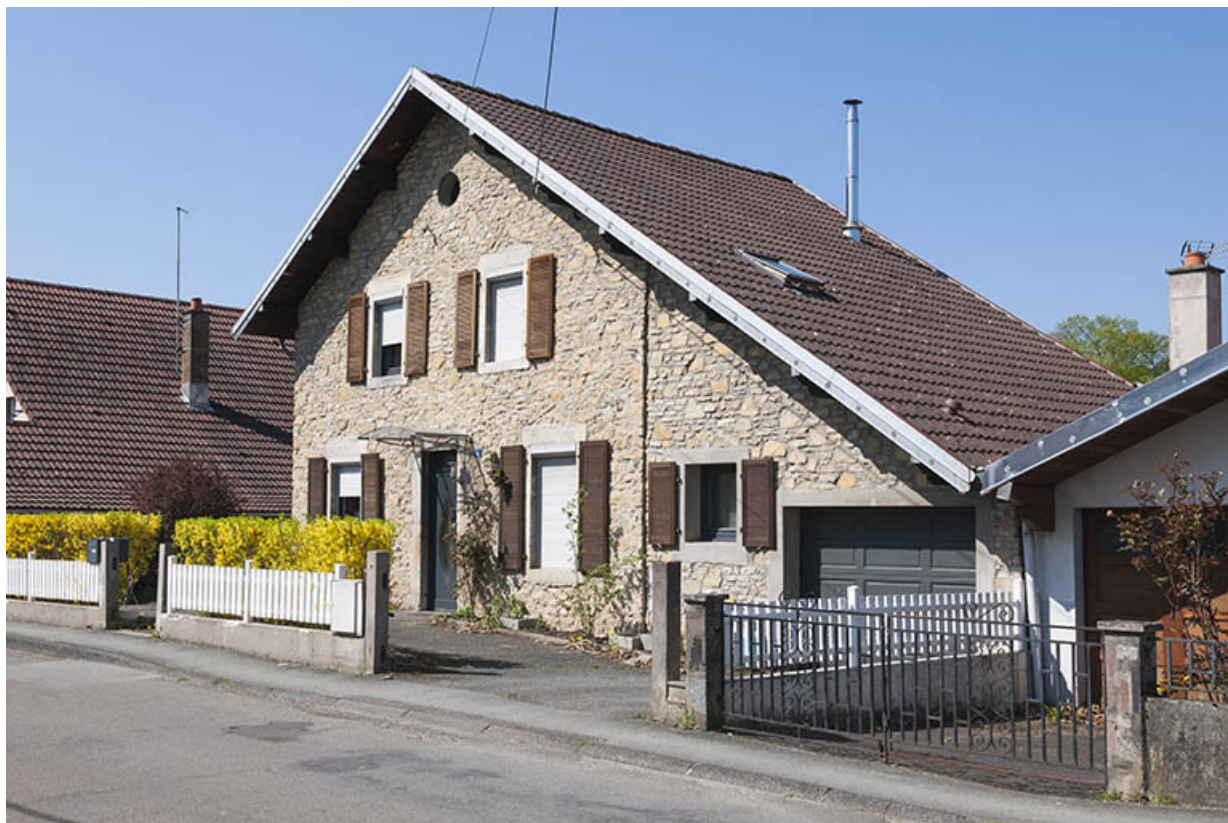
Maison individuelle (vers 1875). Vue de trois quarts droite.