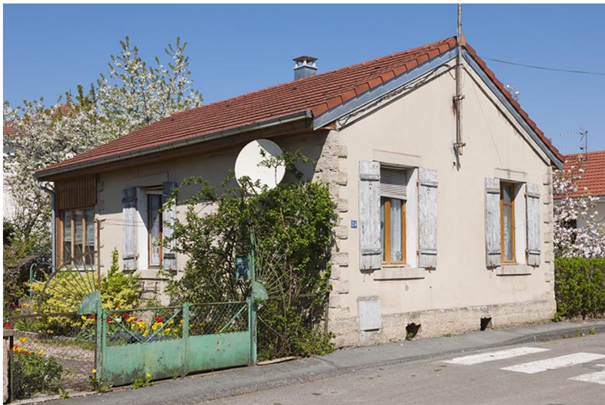
Maison individuelle (vers 1920).