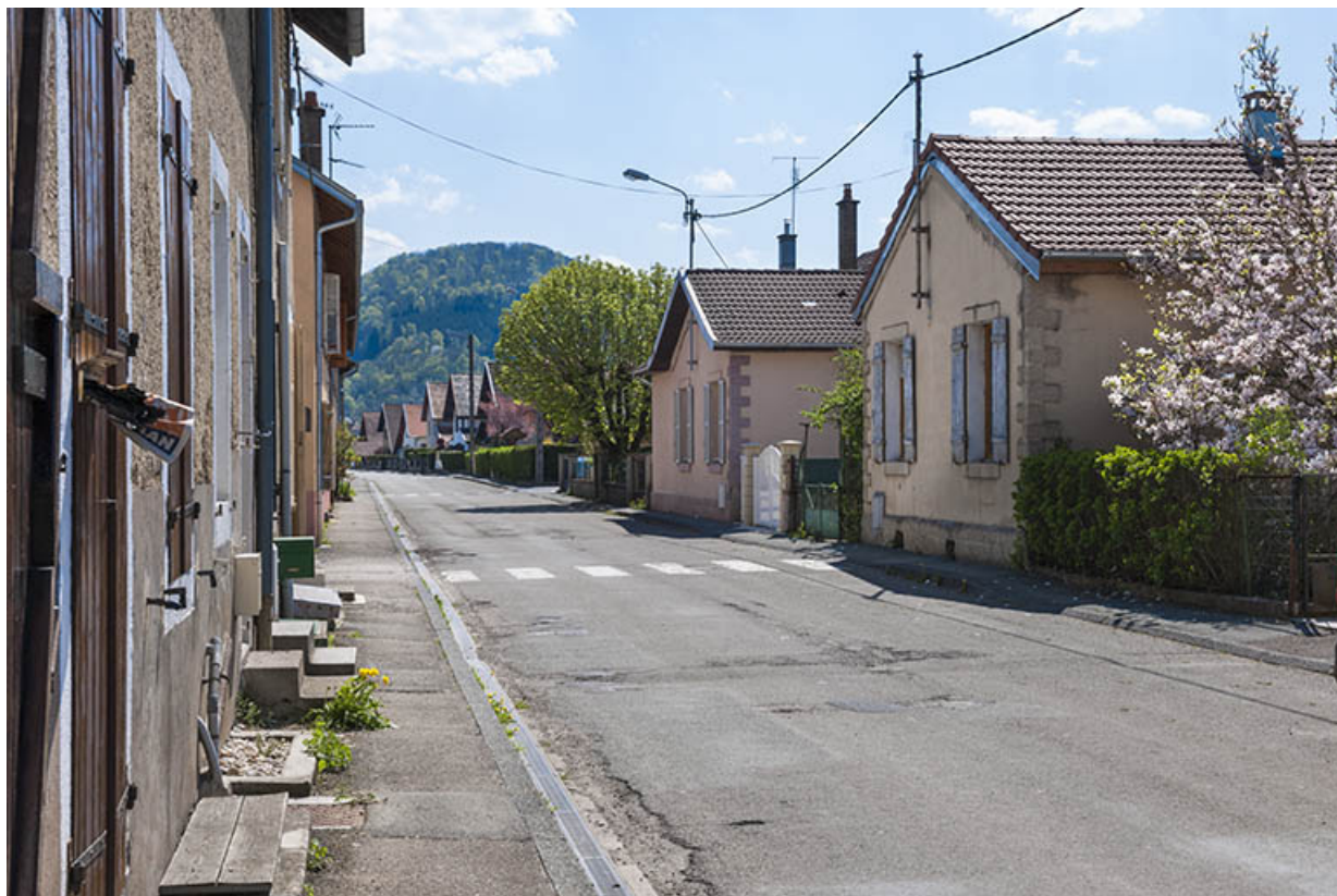
Vue d'ensemble de la rue depuis le nord.