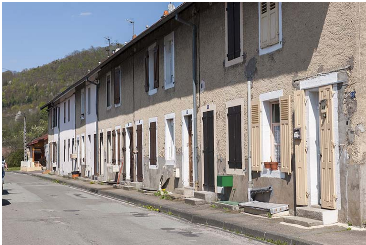
Vue de trois quarts de la façade d'une caserne.