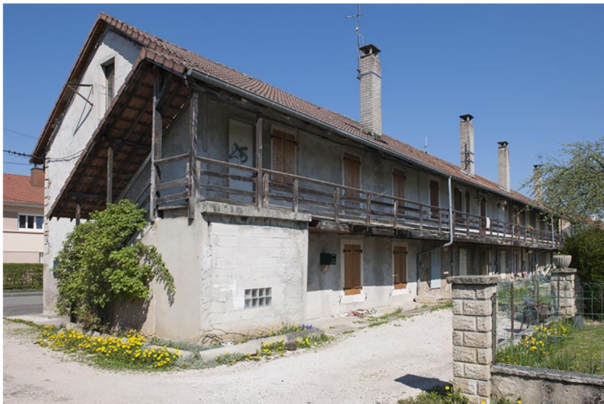
Façade postérieure d'une caserne.