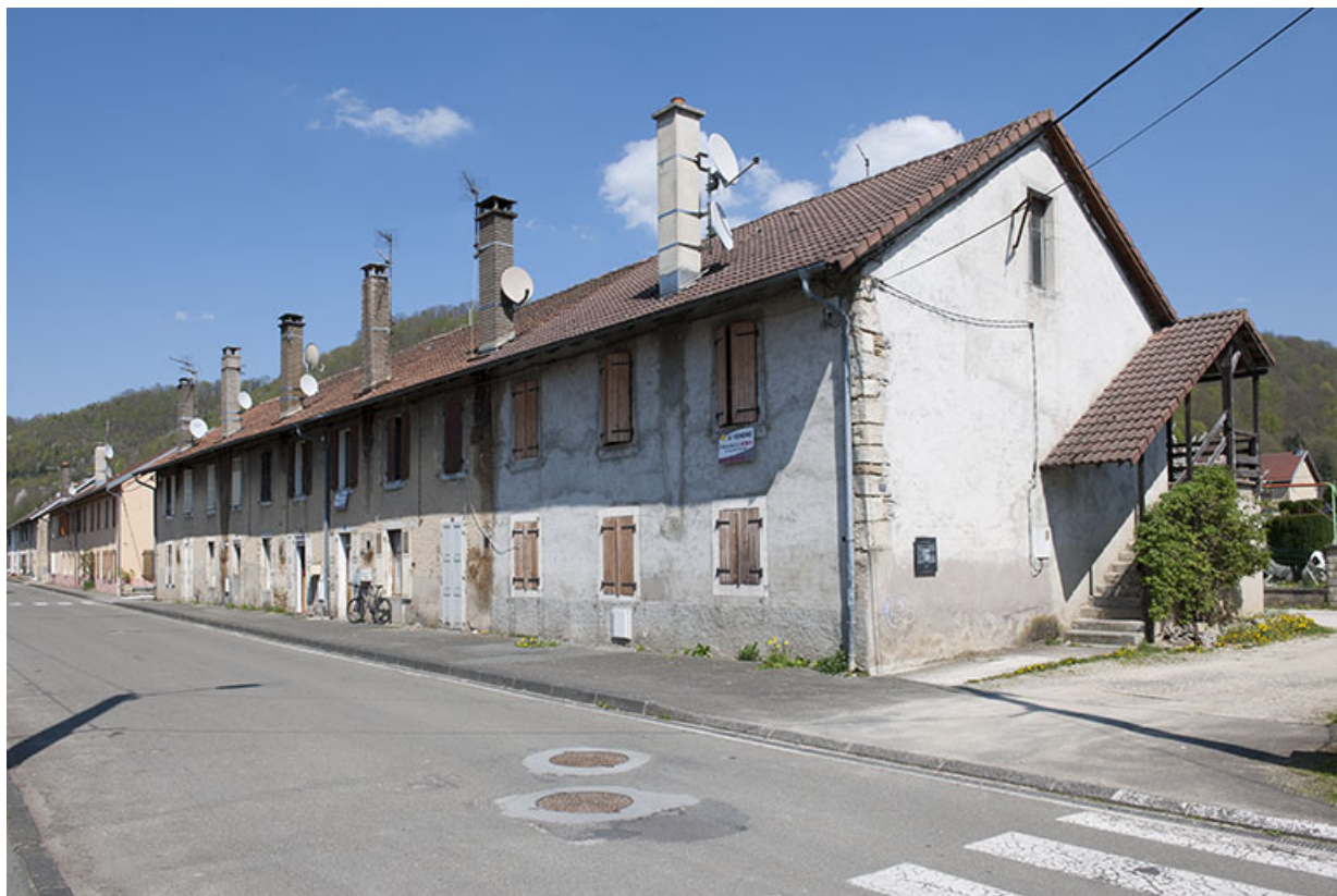
Alignement des façades des casernes (côté impair).