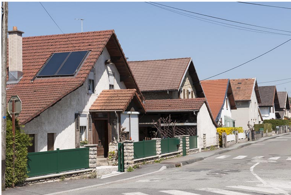
Maisons individuelles depuis l'entrée de la rue (côté pair).