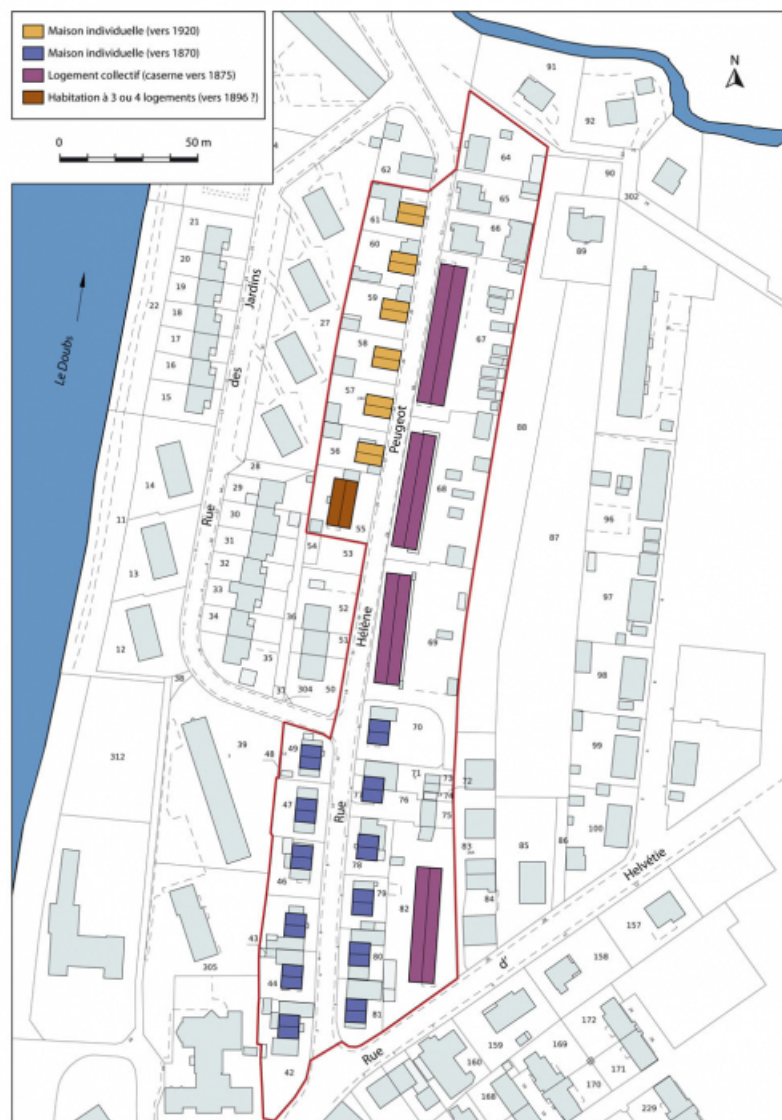
Plan-masse et de situation. Extrait du plan cadastral numérisé, section AM, échelle 1:1000. 25, Pont-de-Roide rue Hélène Peugeot