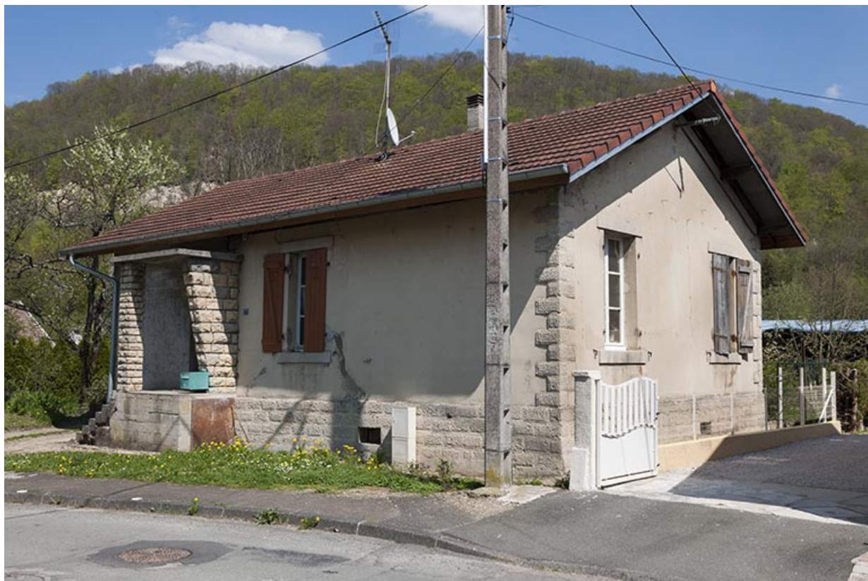
Maison individuelle vue de trois quarts (vers 1920).