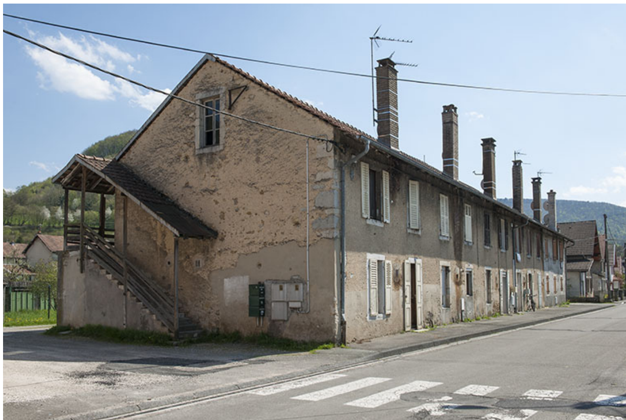
Habitation de type caserne vue de trois quarts gauche.