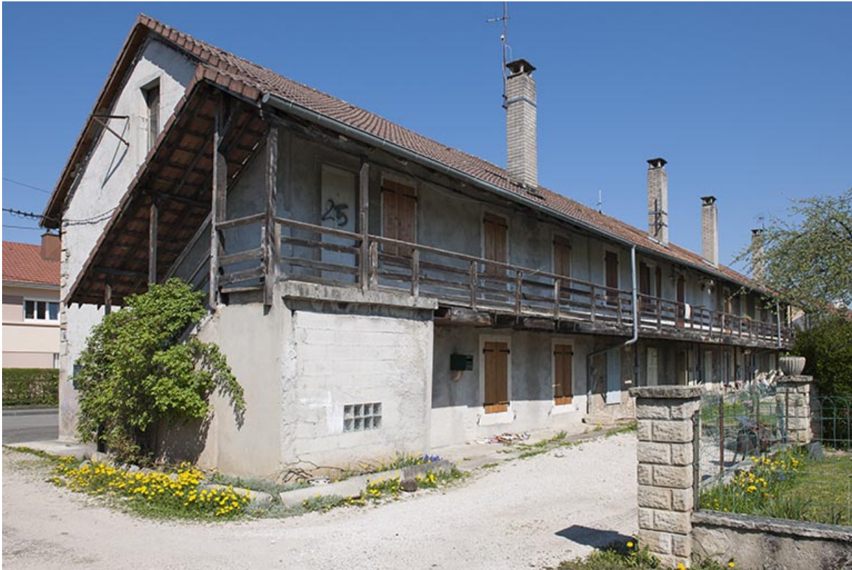
Façade postérieure d'une caserne.