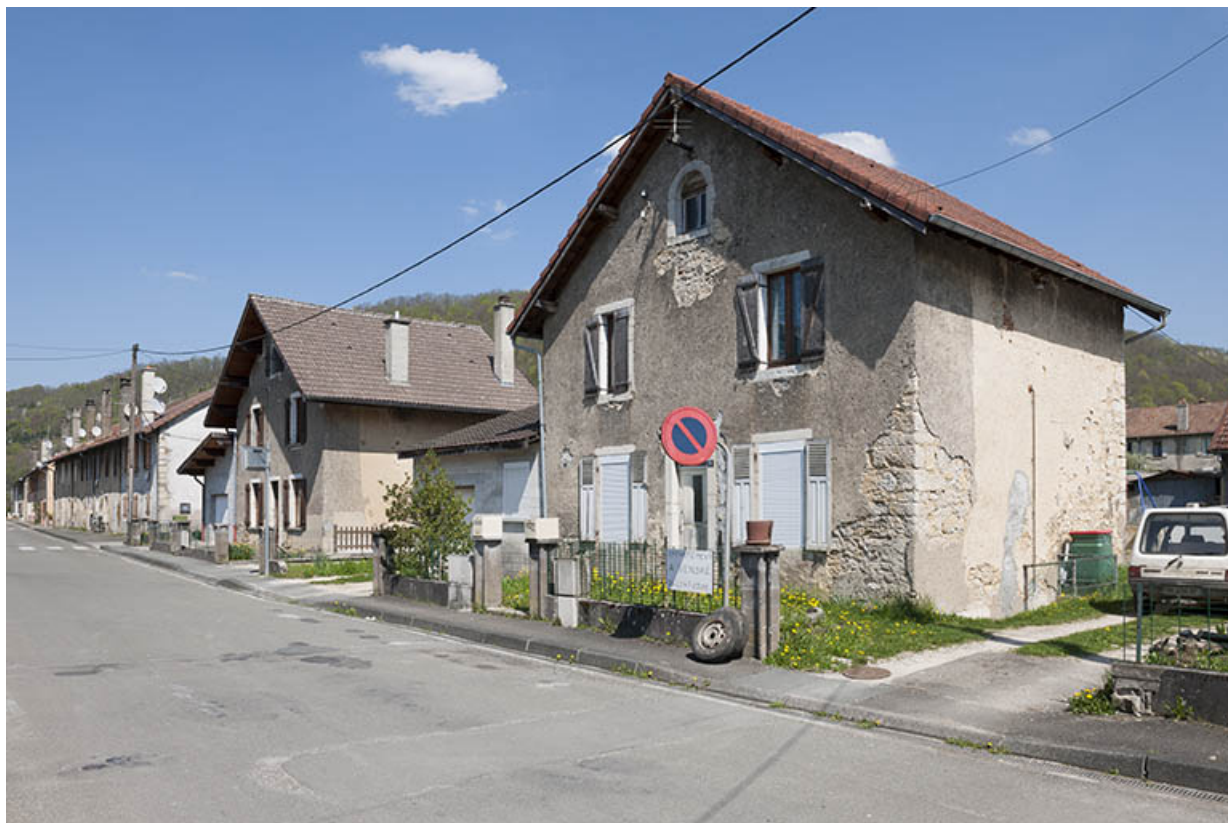
Habitations côté impair : caserne et maisons individuelles.