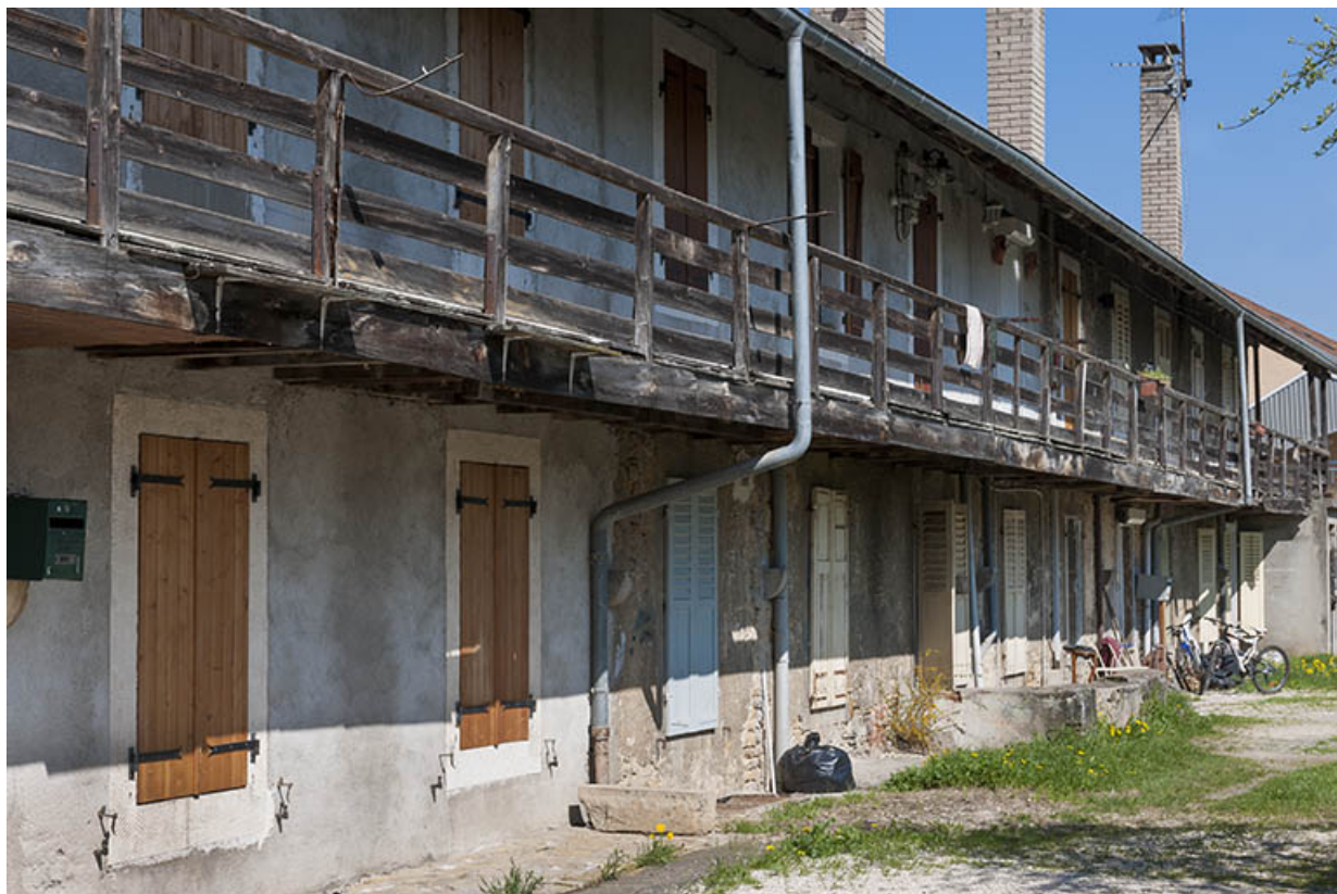
Façade postérieure d'une caserne. Détail de la galerie de desserte.