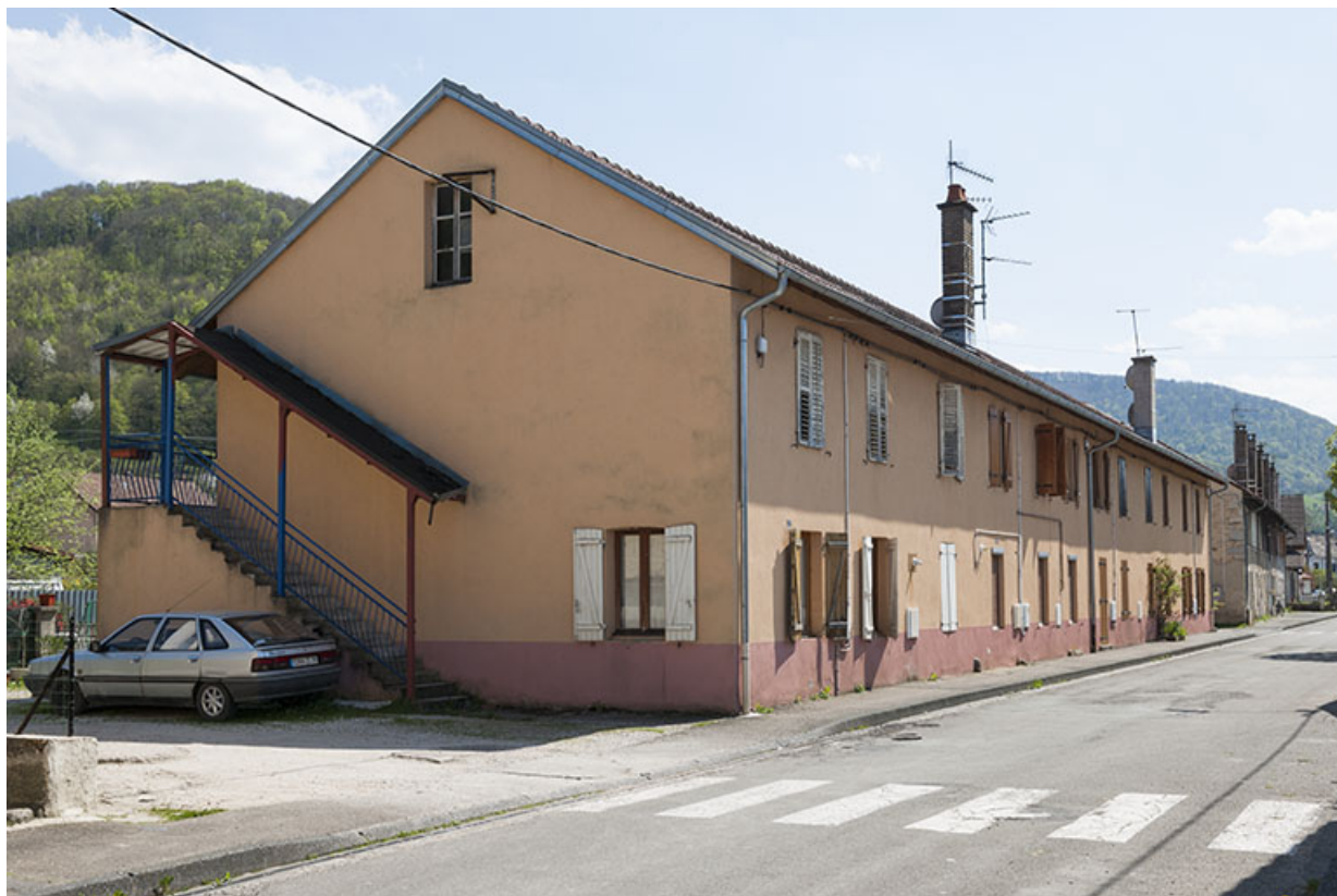
Vue de trois quarts d'une habitation de type caserne.