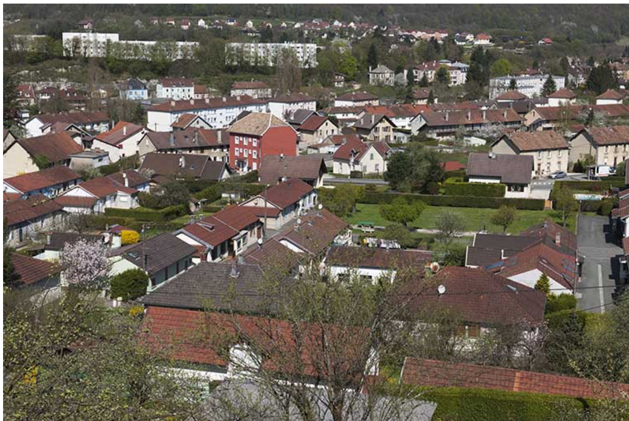
Vue d'ensemble depuis le sud (au second plan).