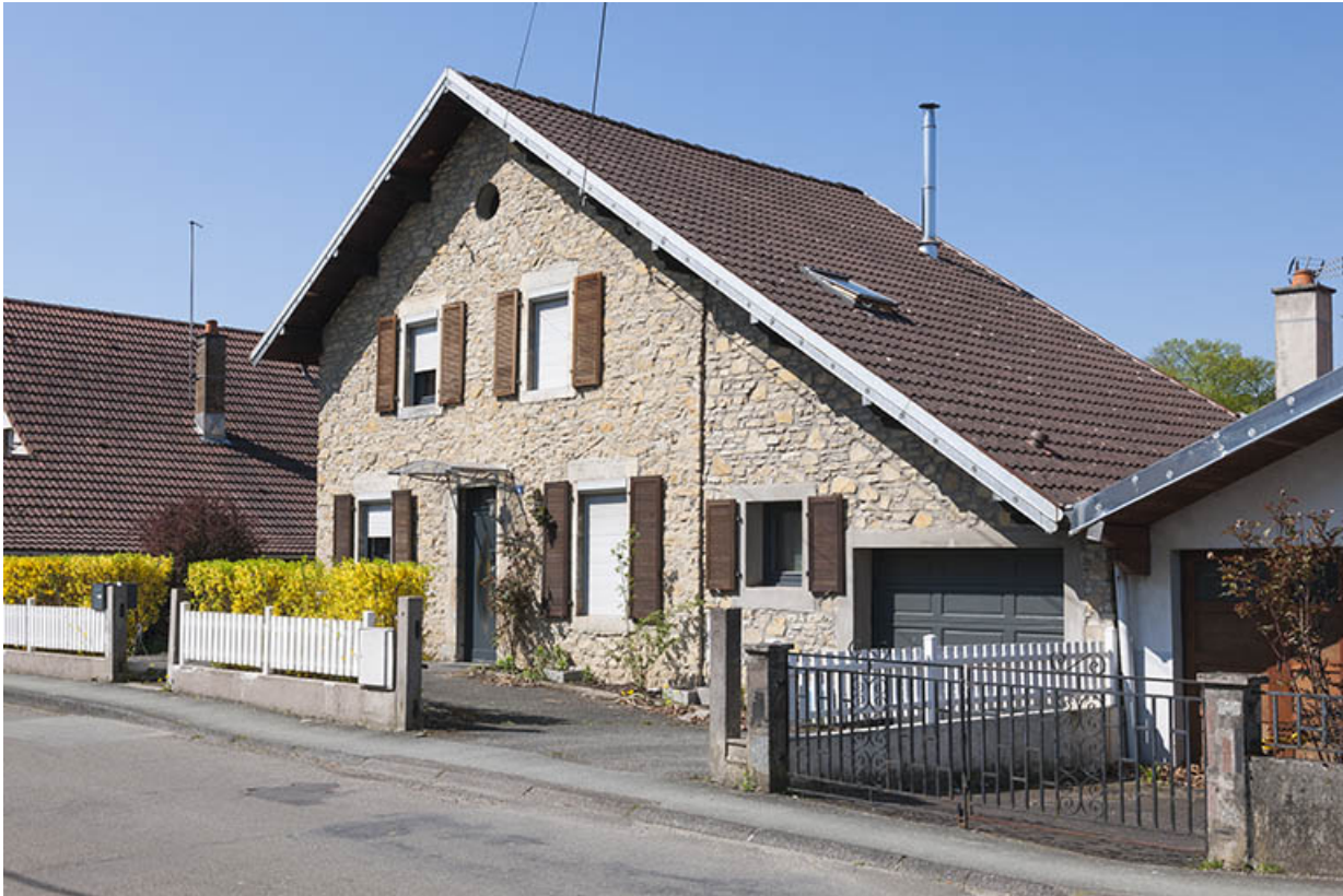
Maison individuelle (vers 1875). Vue de trois quarts droite.