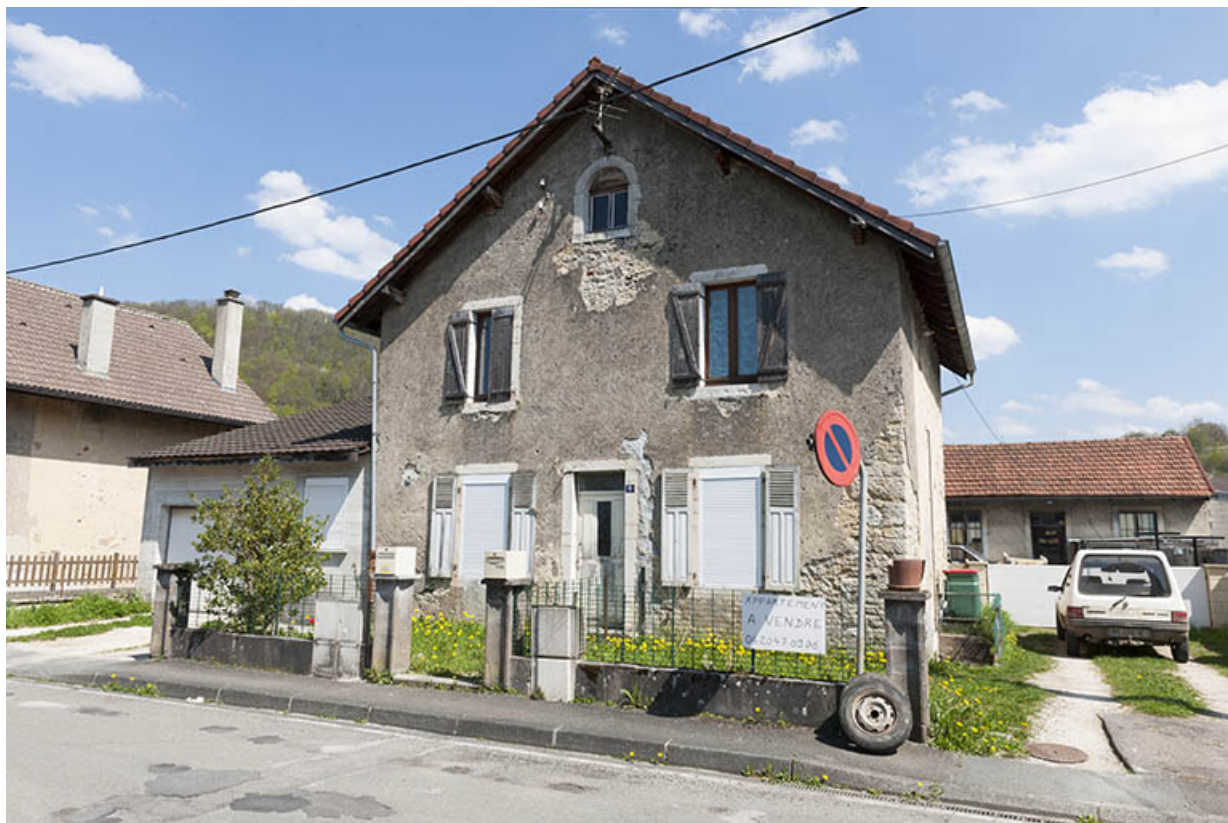
Maison individuelle (vers 1875).