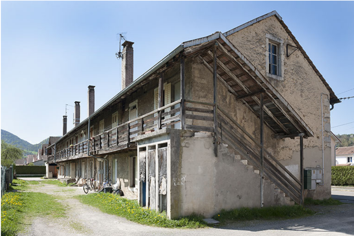
Habitation de type caserne. Escalier sur le pignon et galerie de desserte. 25, Pont-de-Roide rue Hélène Peugeot