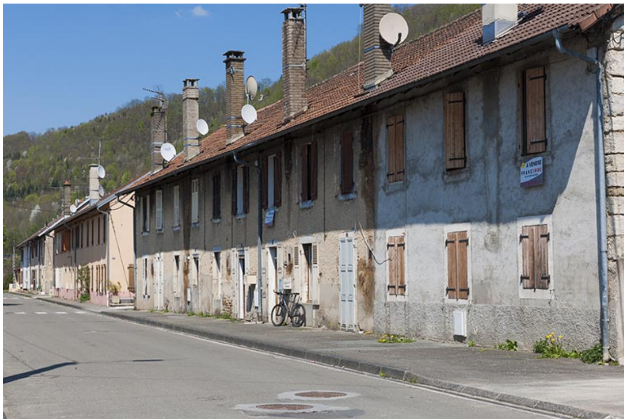
Habitations de type caserne (côté impair). 25, Pont-de-Roide rue Hélène Peugeot