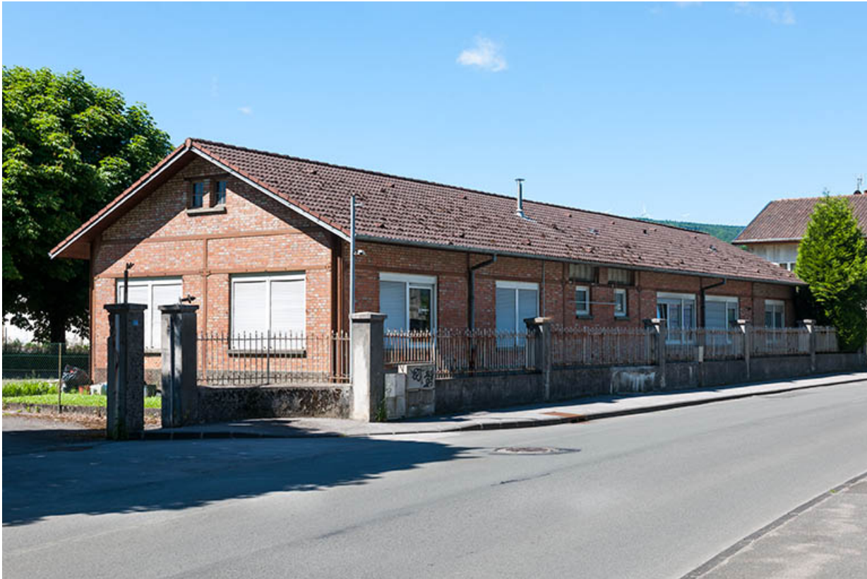
Bâtiment des logements et bureau.