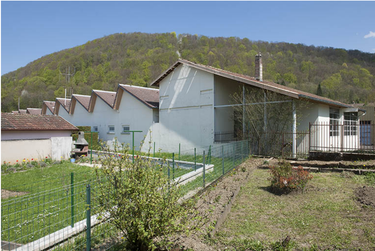
Atelier vu de trois quarts arrière.