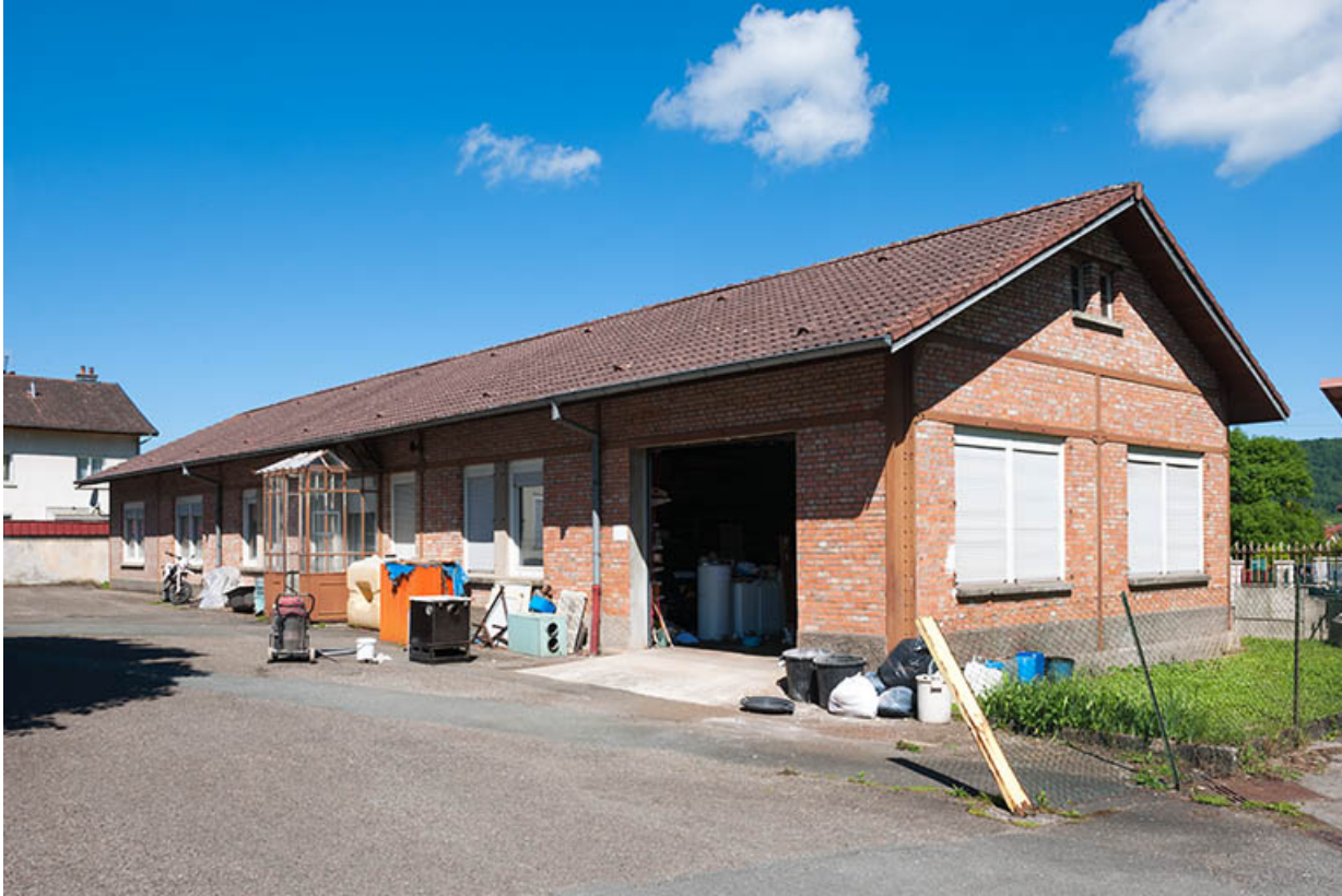
Logements et bureau vus de trois quarts.