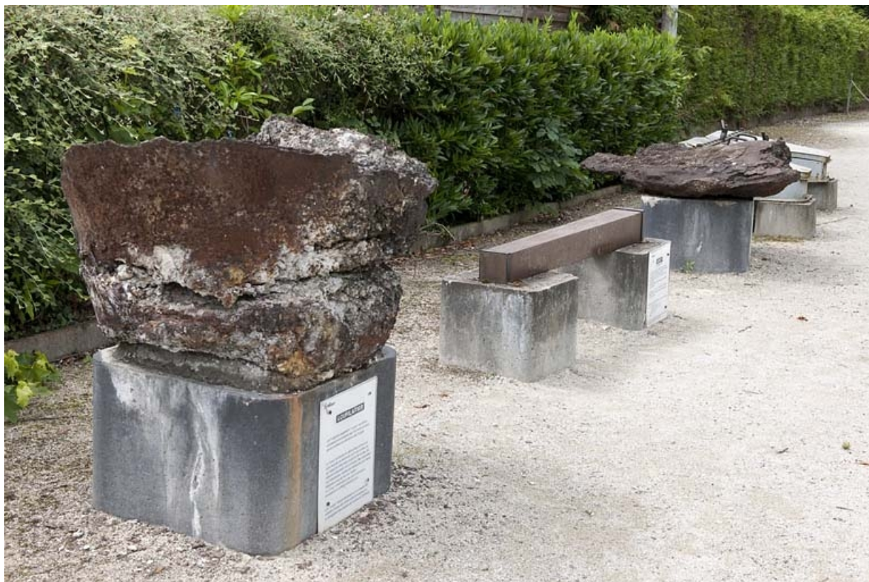
Pièces diverses exposées à proximité du site : loup (ou laitier, résidus agglomérés issus du démoulage) et lingot d'acier. 25, Audincourt rue du Four Martin, lieudit : les Forges