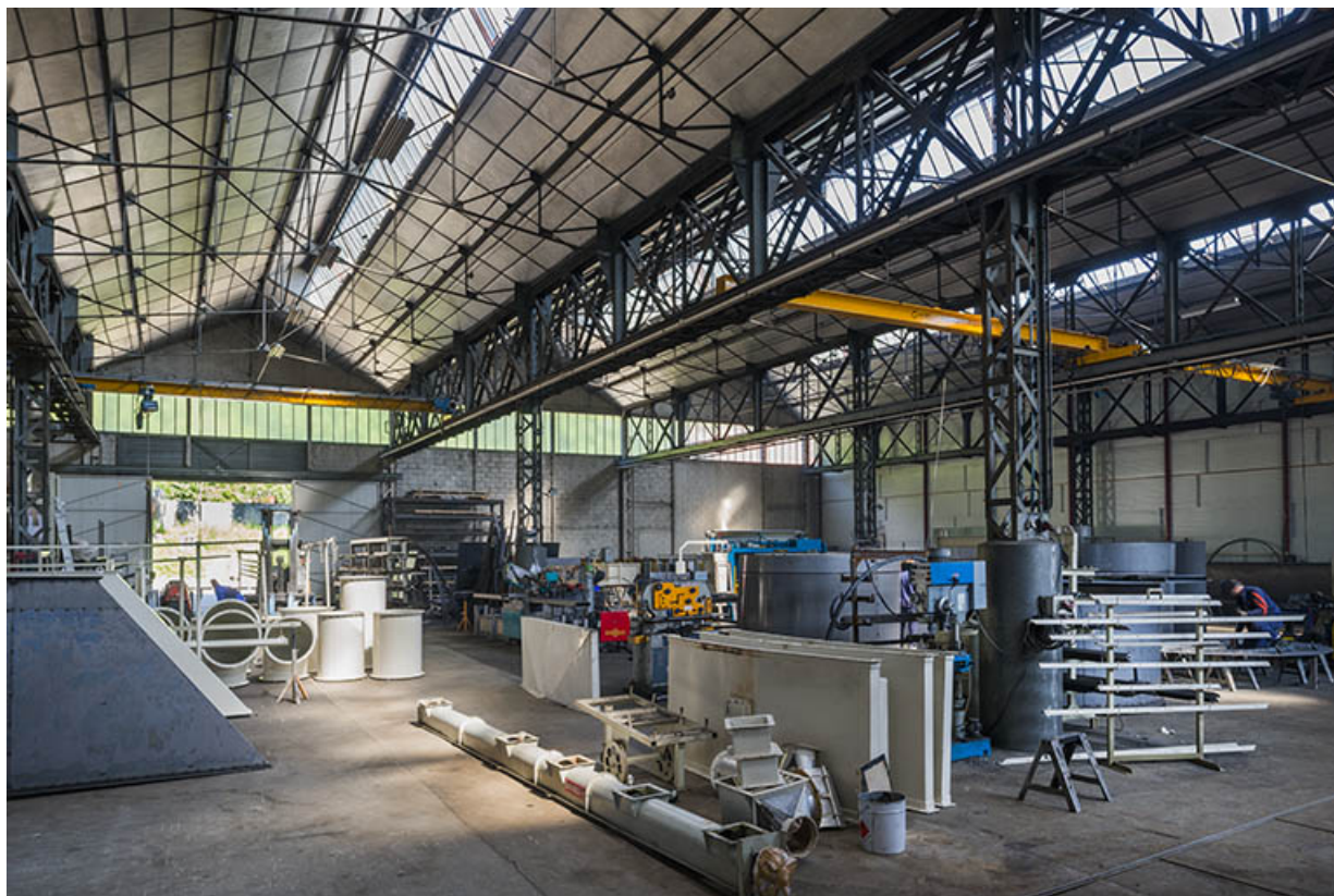
Vue intérieure de l'atelier de laminage.