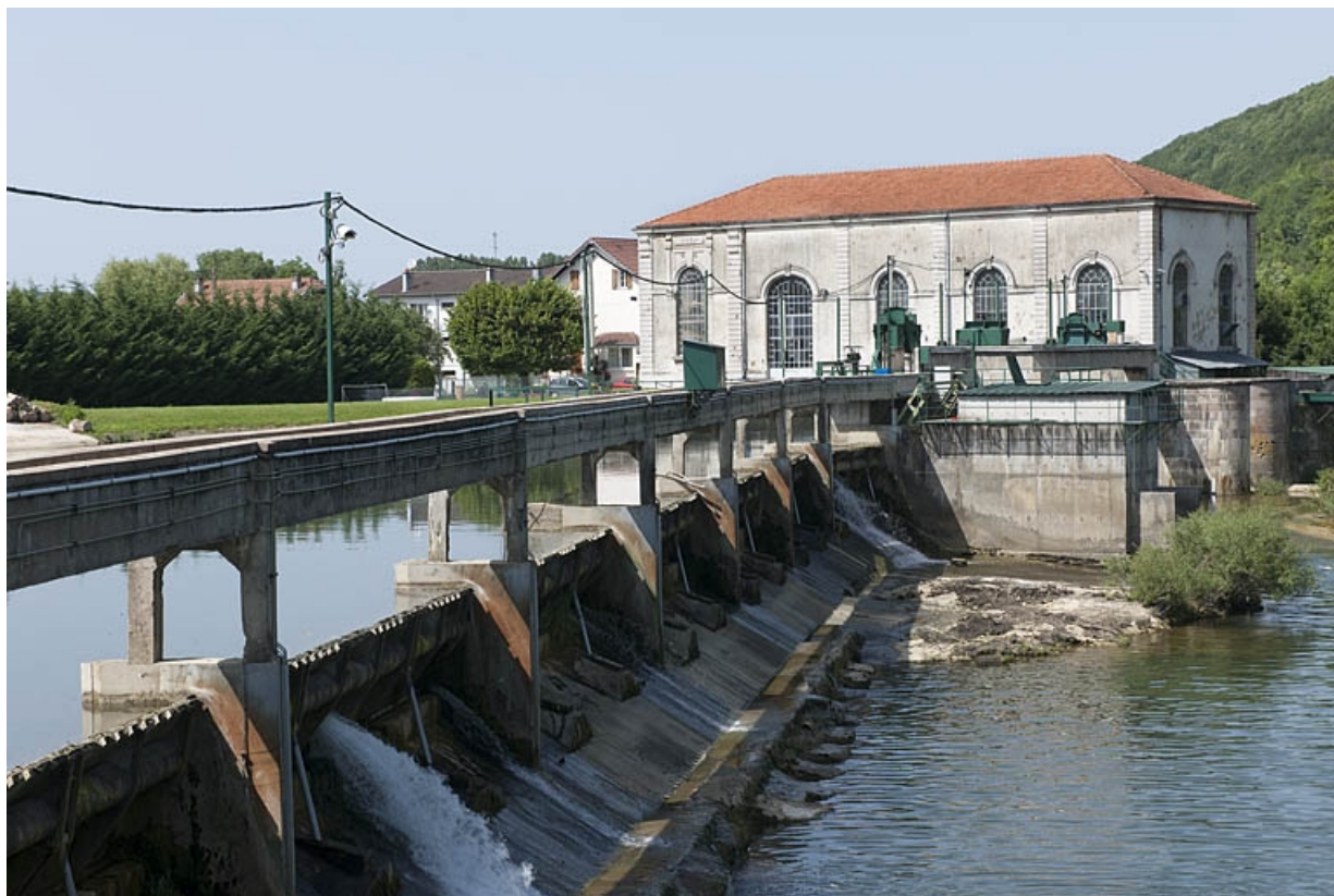
Les déversoirs du barrage et la centrale.