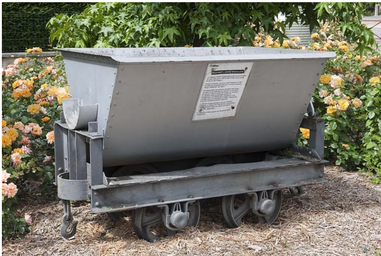
Wagonnet servant au transport du laitier vers le crassier, tiré par des locomotives "Decauville" (seul le châsis est d'origine). 25, Audincourt rue du Four Martin, lieudit : les Forges