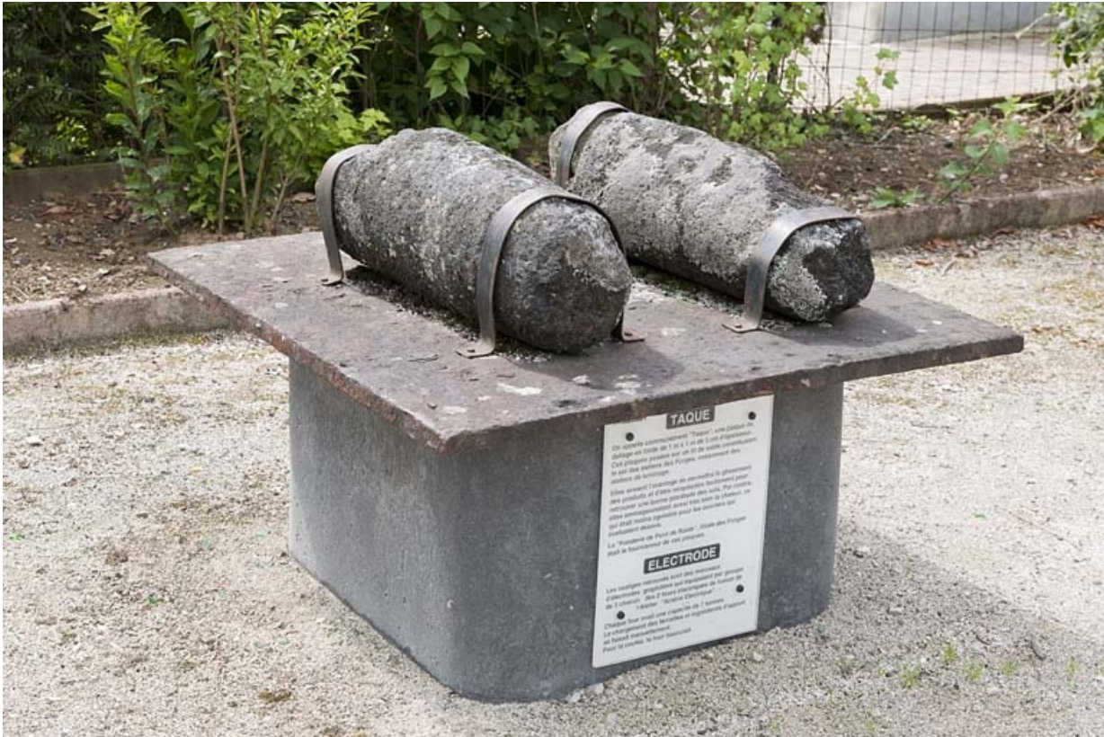
Pièces diverses exposées à proximité du site : électrodes des fours électriques posées sur une plaque de fonte (taque). 25, Audincourt rue du Four Martin, lieudit : les Forges