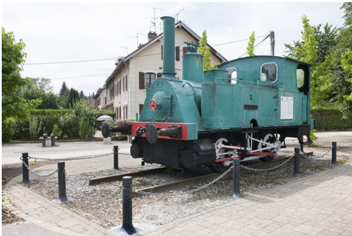
Locomotive Krauss (1907) utilisée pour le transport des matières premières et des produits finis entre la gare d'Audincourt et l'usine.