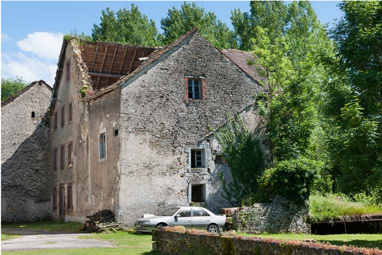
Le moulin depuis le nord-ouest.

25, Dampierre-sur-le-Doubs rue du Moulin