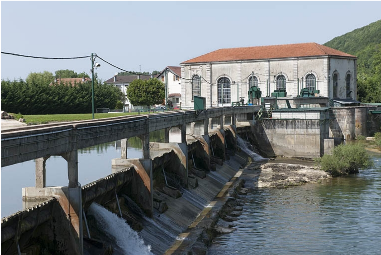
Les déversoirs du barrage et la centrale.