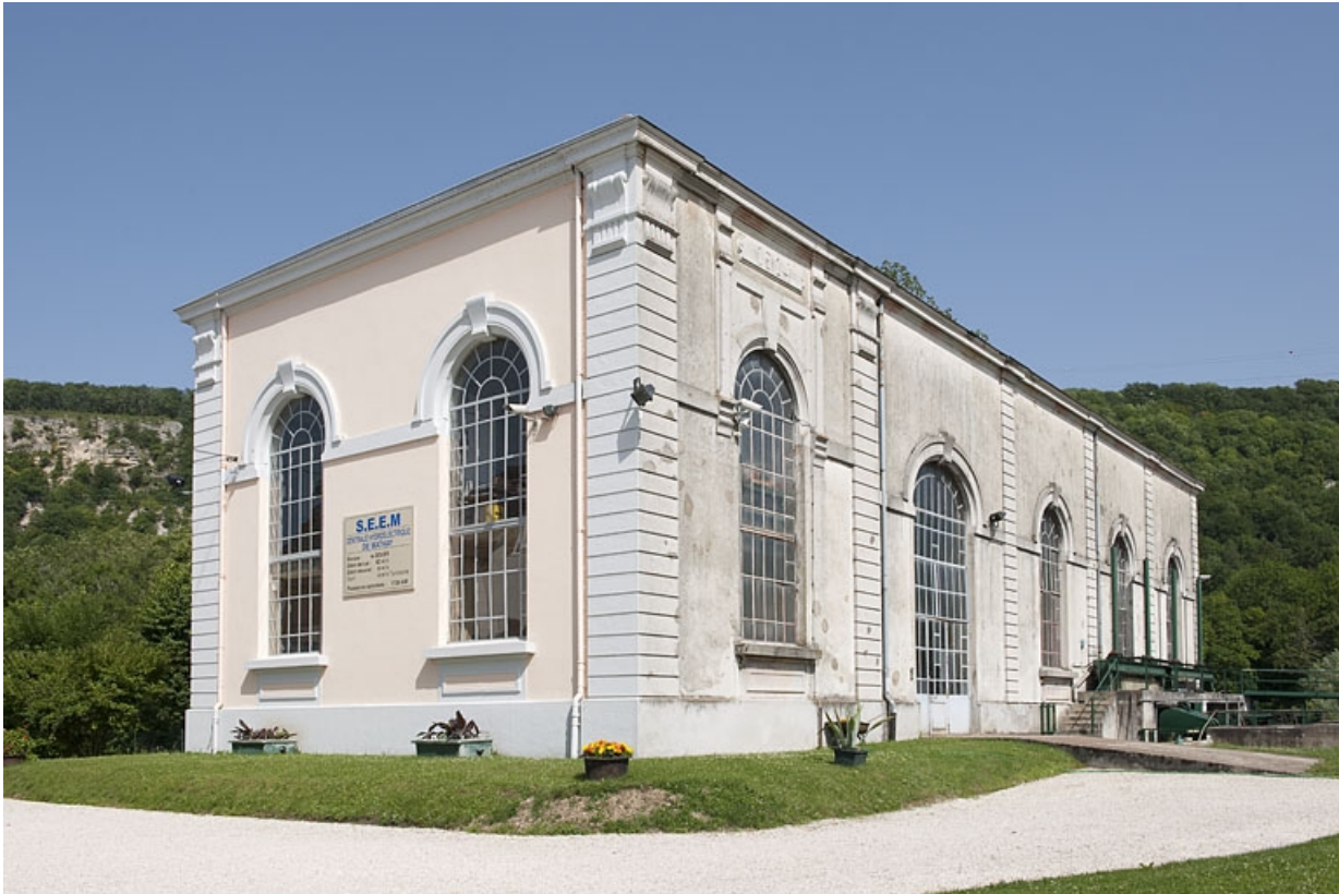
Centrale vue de trois quarts, depuis l'entrée.