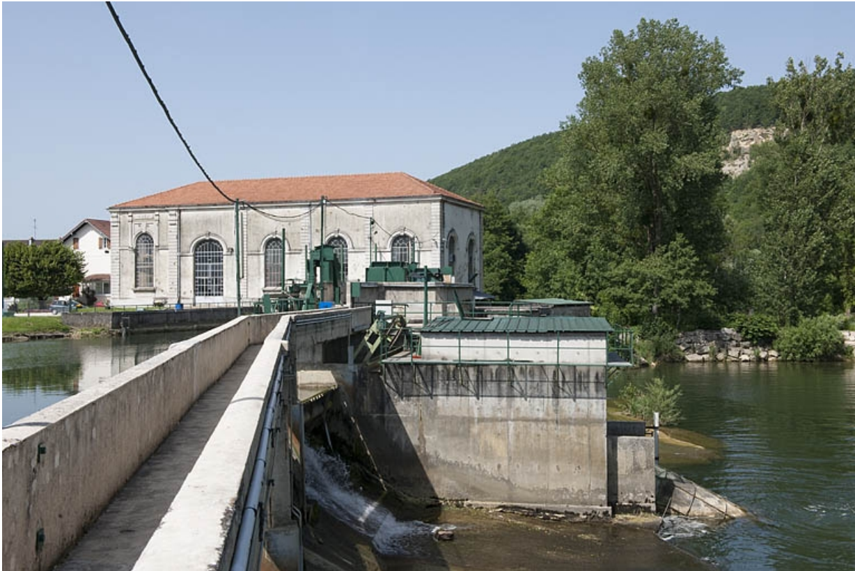
Extrémité nord du barrage et façade sud de la centrale.