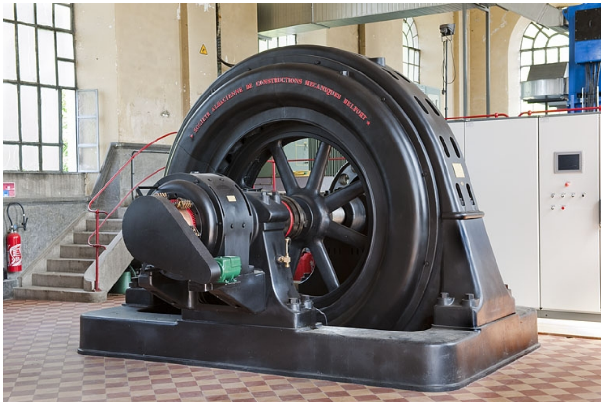
Alternateur de la Société Alsacienne de Constructions Mécaniques (Belfort). 25, Mathay, lieudit : rue du Barrage