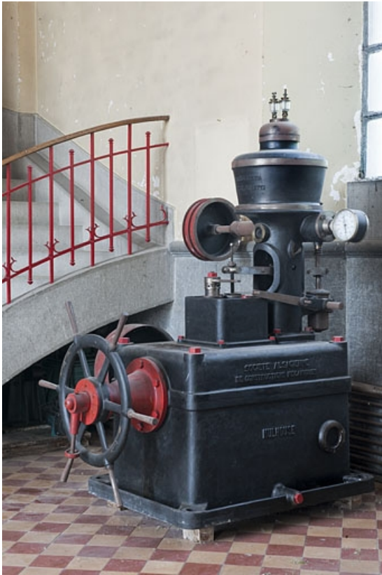
Détail d'un régulateur de la Société Alsacienne de Constructions Mécaniques (hors-service). 25, Mathay, lieudit : rue du Barrage