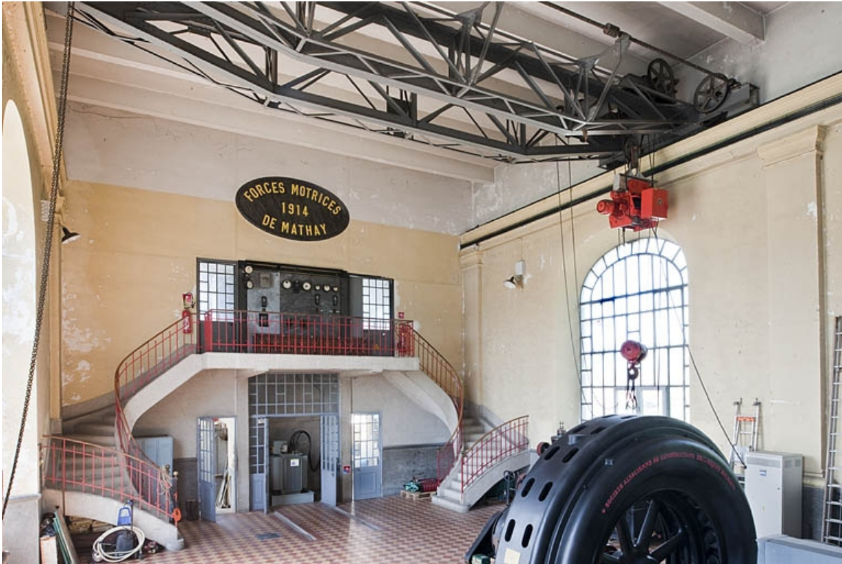
Extrémité nord-ouest de la centrale.