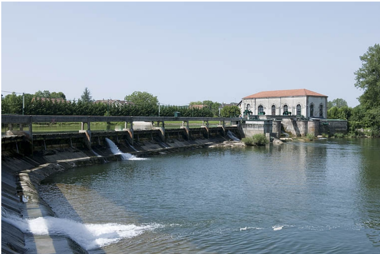
Le barrage et la centrale depuis le sud.