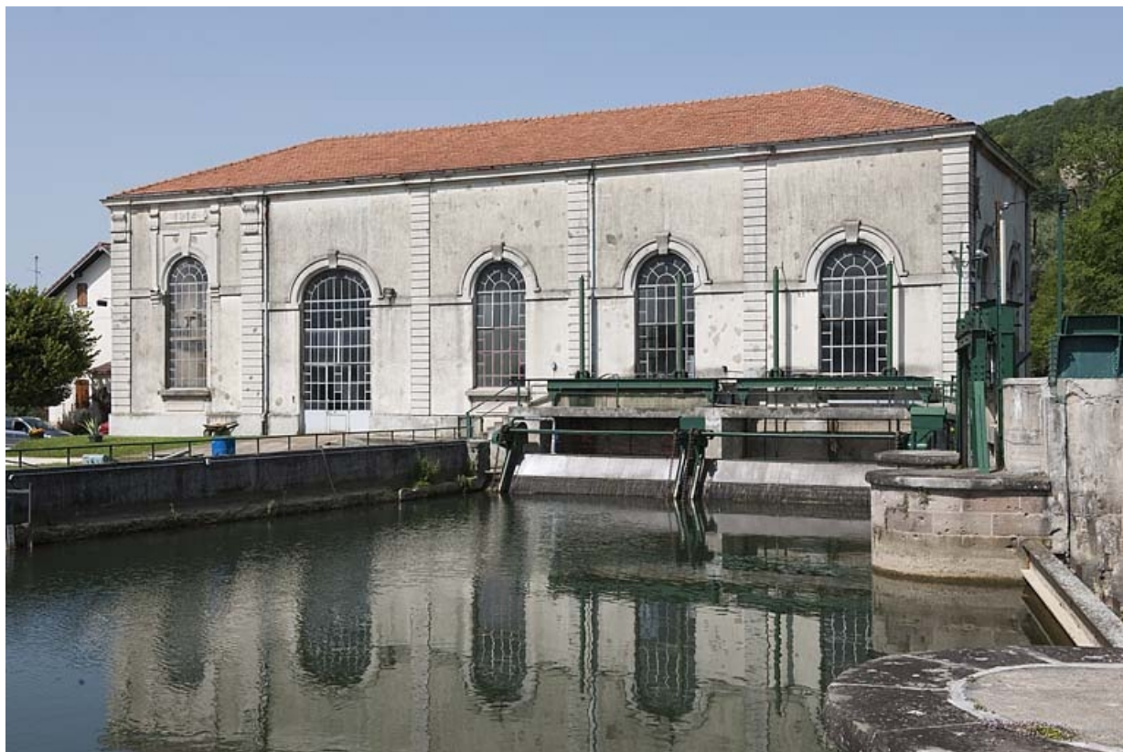
Façade sud de la centrale et prises d'eau.