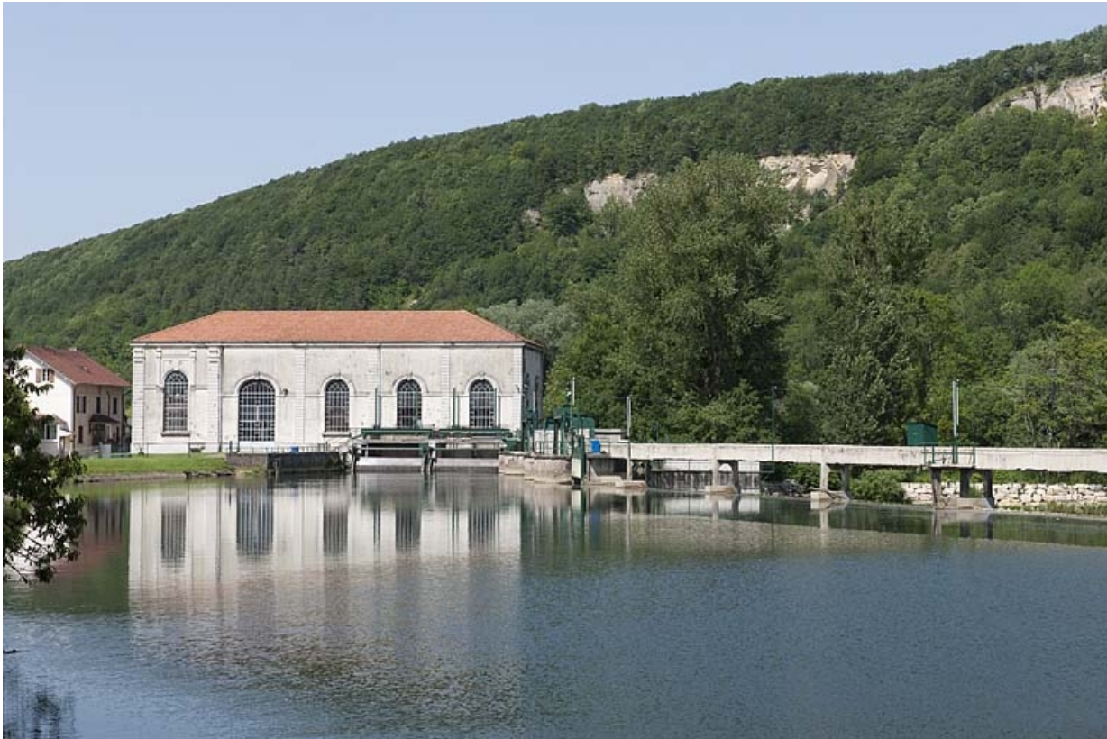
La centrale et le barrage depuis le sud.