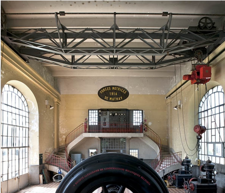
Vue intérieure, depuis le sud-est.