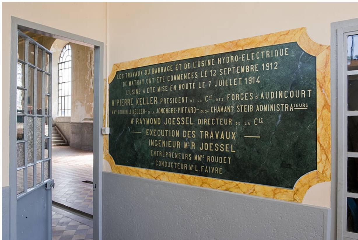
Cartouche-dédicace peint, à l'intérieur du bureau.