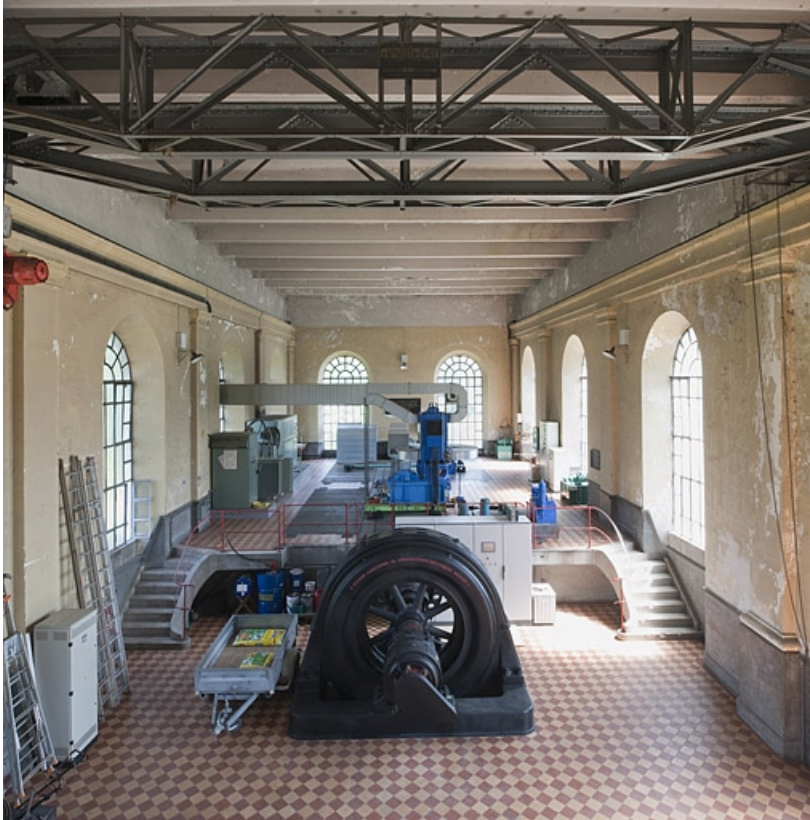
Vue intérieure, depuis le nord-ouest.