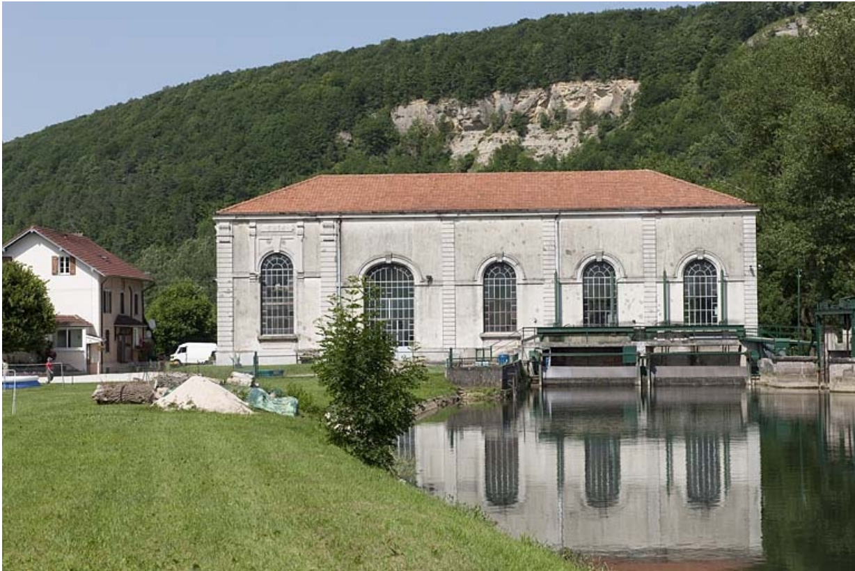
Façade sud de la centrale.