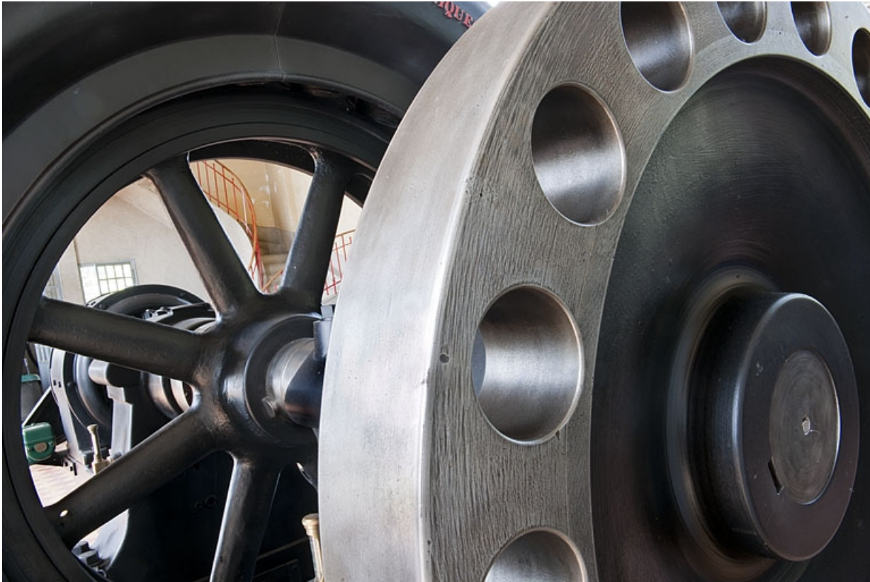
Détail de l'alternateur de la Société Alsacienne de Constructions Mécaniques (Belfort). 25, Mathay, lieudit : rue du Barrage