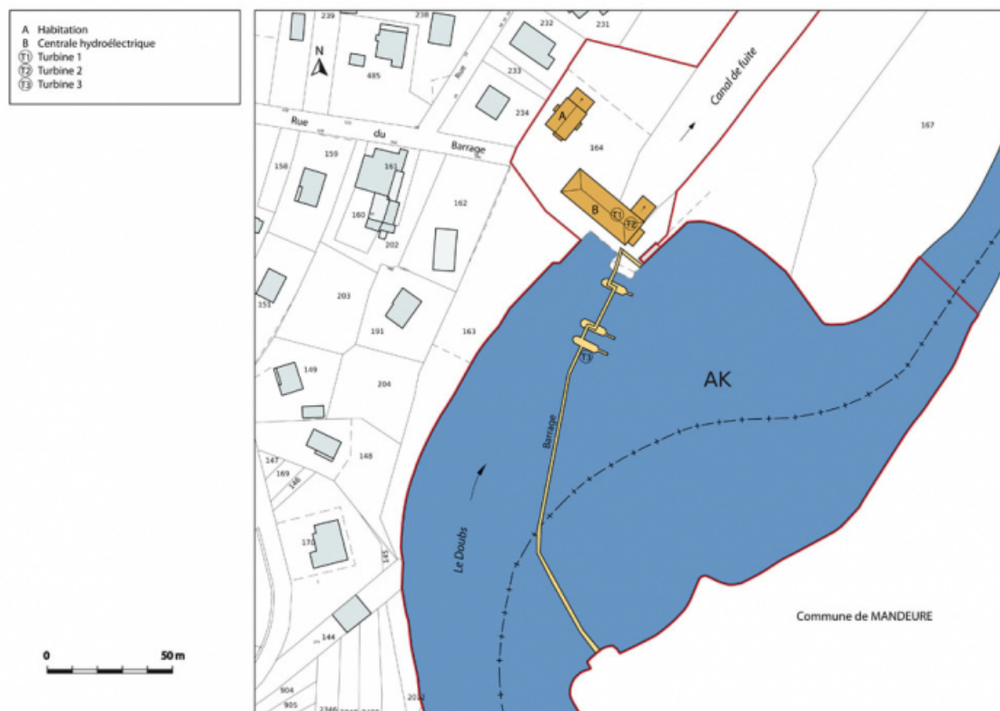
Plan-masse et de situation. Extrait du plan cadastral numérisé, section AK, échelle 1:1250. 25, Mathay, lieudit : rue du Barrage