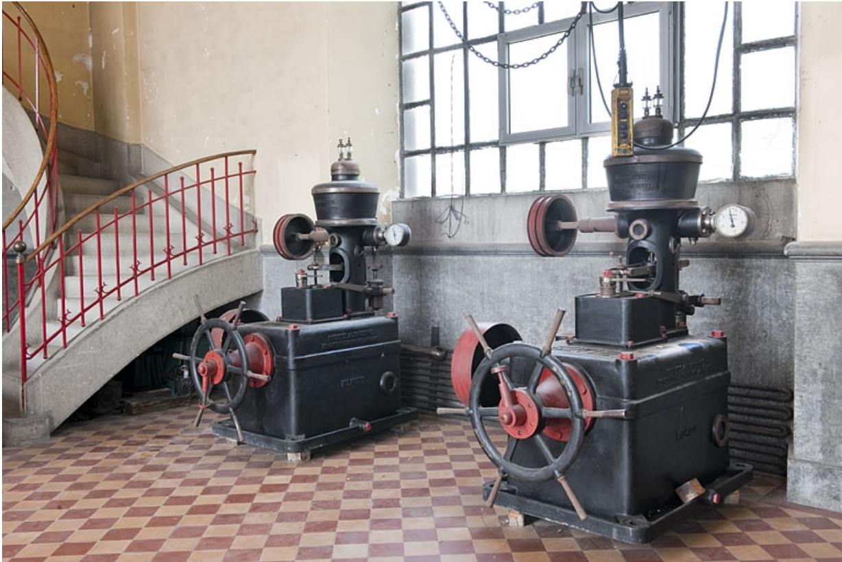
Régulateurs de la Société Alsacienne de Constructions Mécaniques (Mulhouse).