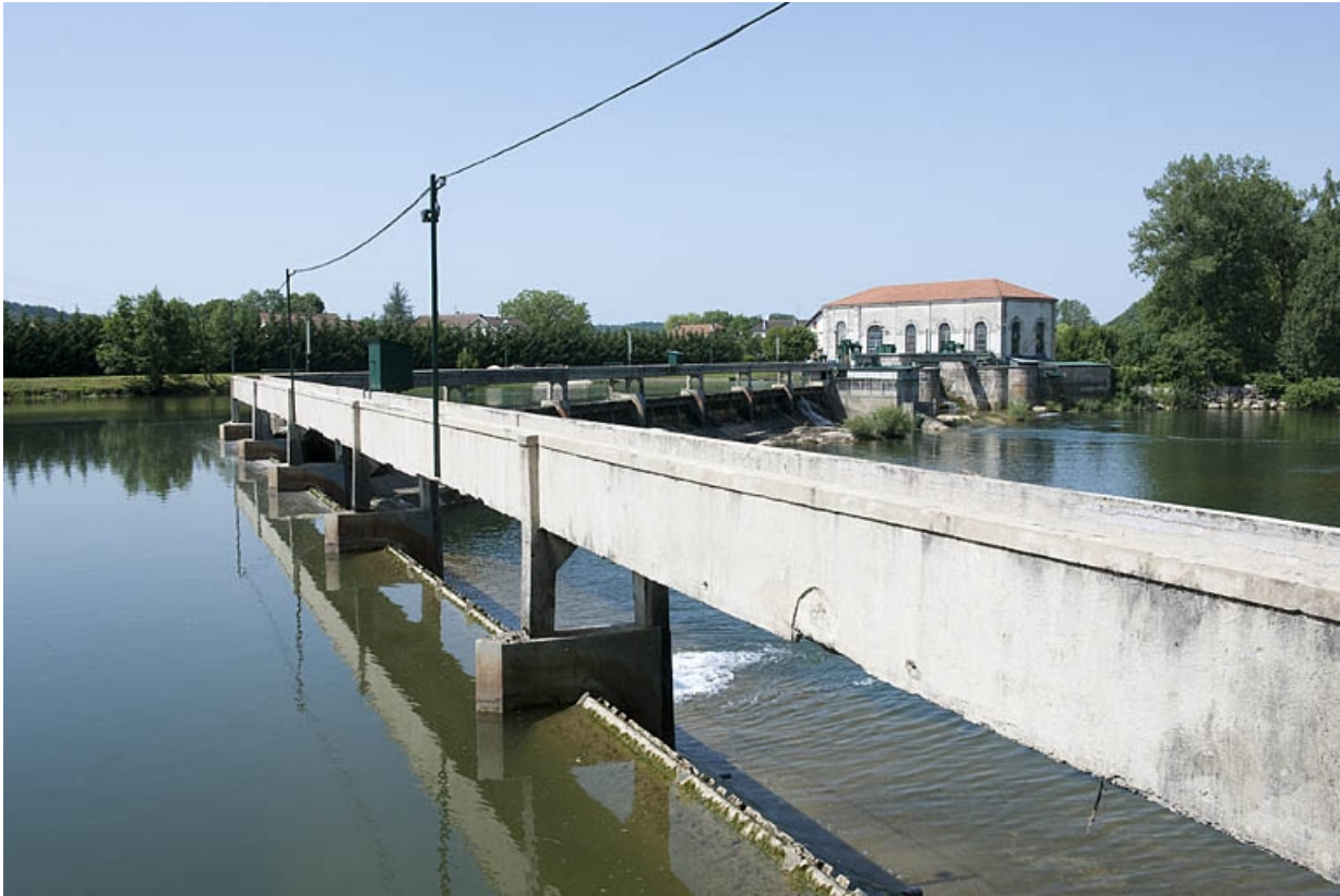
Vue éloignée depuis l'amont du barrage.