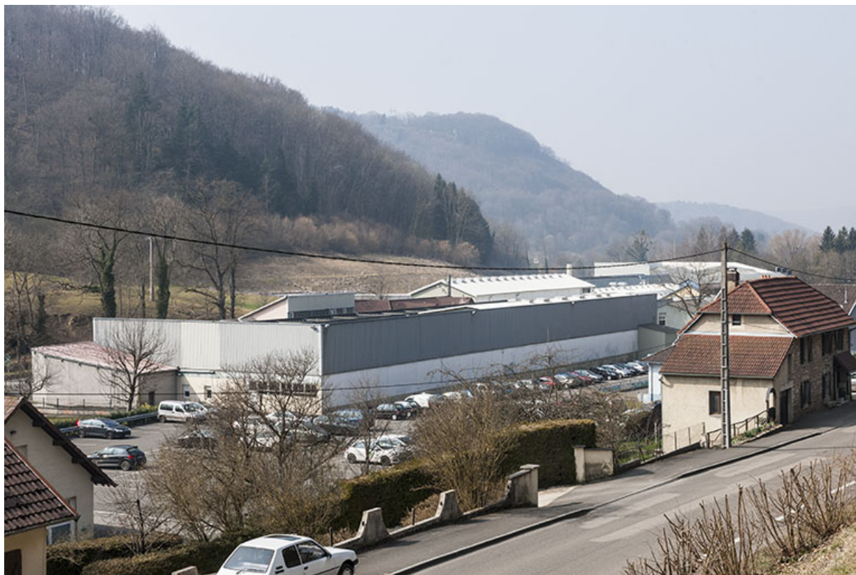
Vue d'ensemble depuis le nord-est.