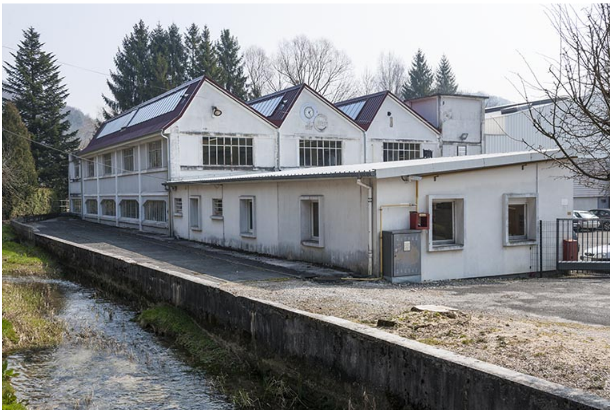
Vue de trois quarts depuis la route.