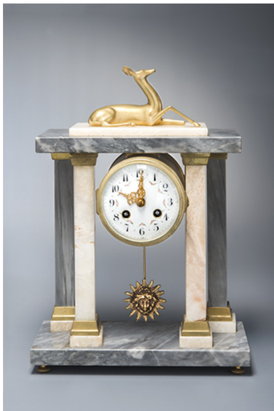
Pendule de salon Mégnin.