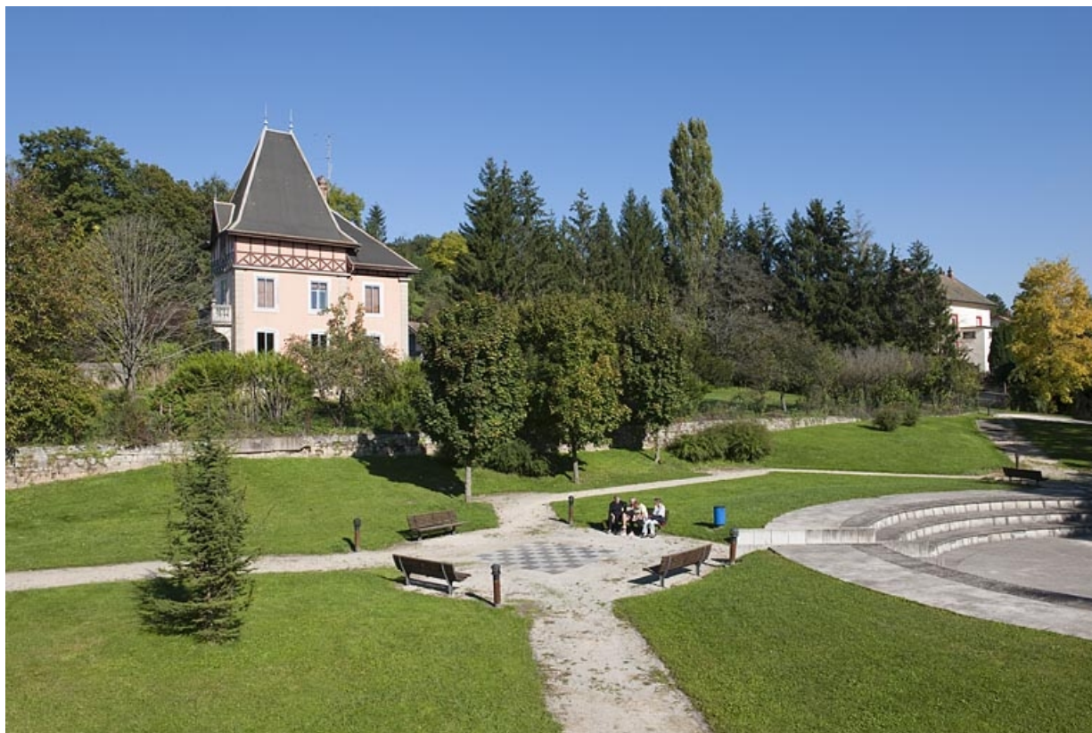
Logement patronal. Vue d'ensemble depuis le sud-ouest.