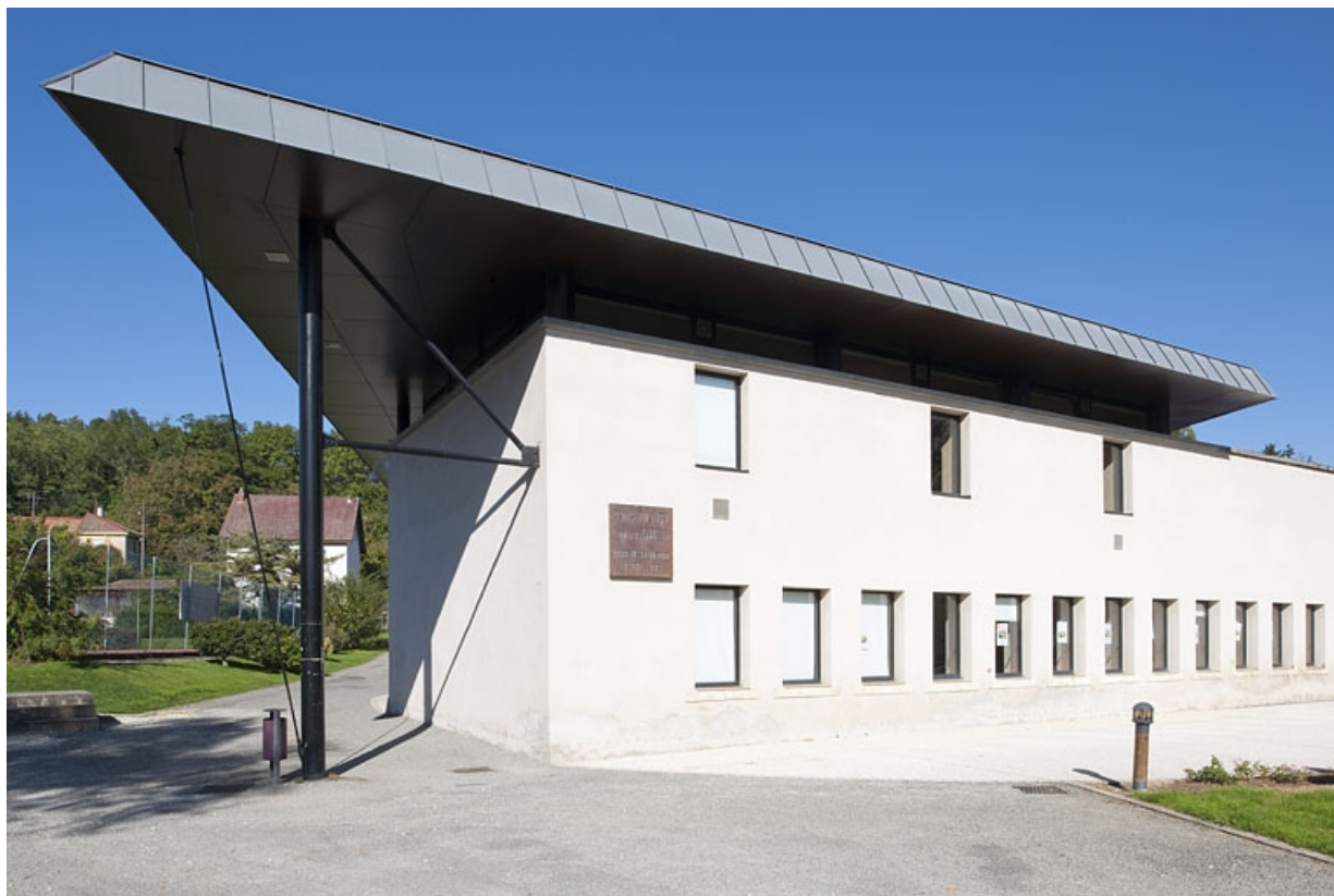
Baies de l'usine reprises dans le mur du centre culturel communal.