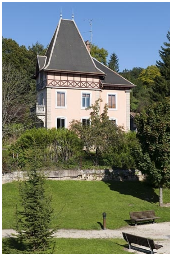
Logement patronal. Façade sud. 25, Seloncourt, lieudit : la Stauberie