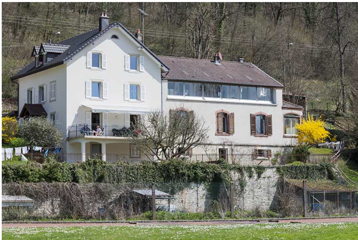
Façade ouest vue de trois quarts gauche.