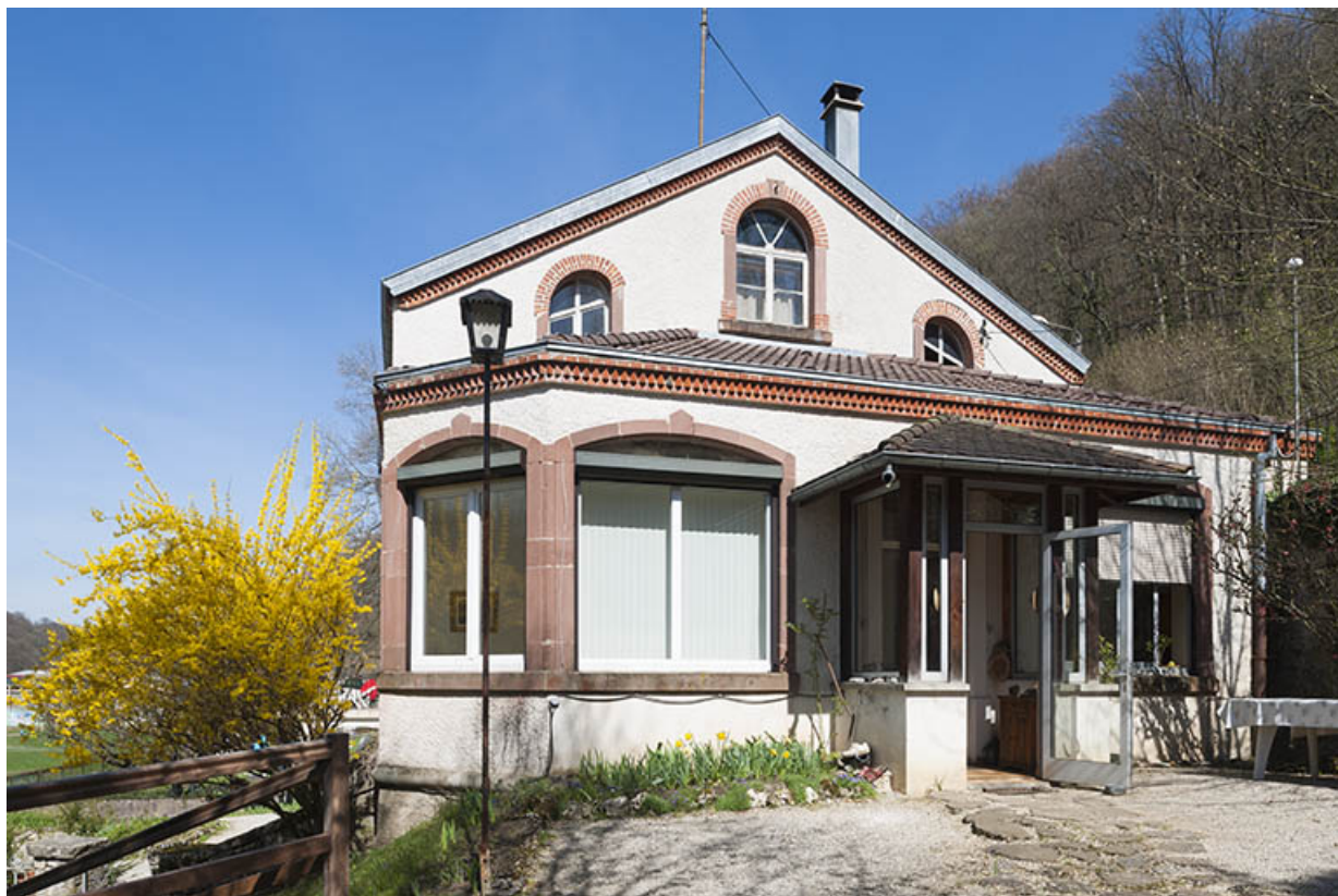
Pignon sud. Vestibule.