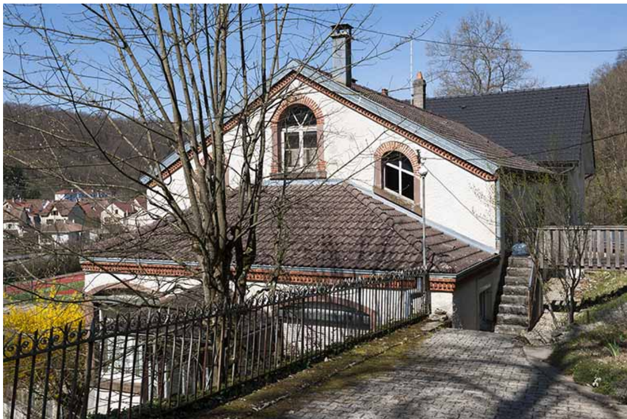
Pignon sud vu de trois quarts.