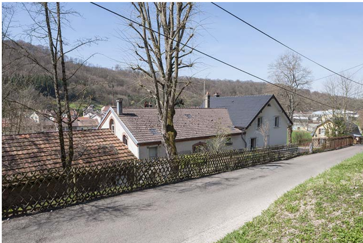
Façade postérieure vue de trois quarts.