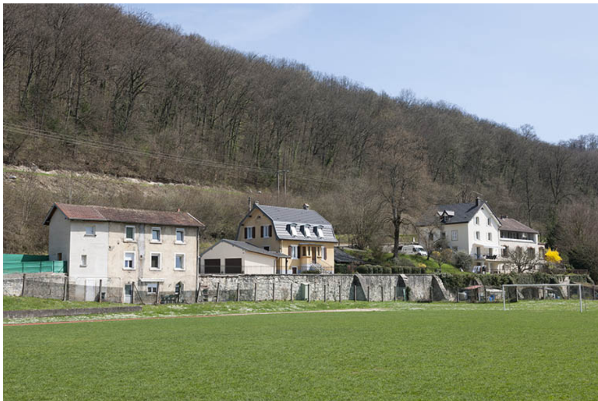
Logements et hôpital depuis le nord-ouest.