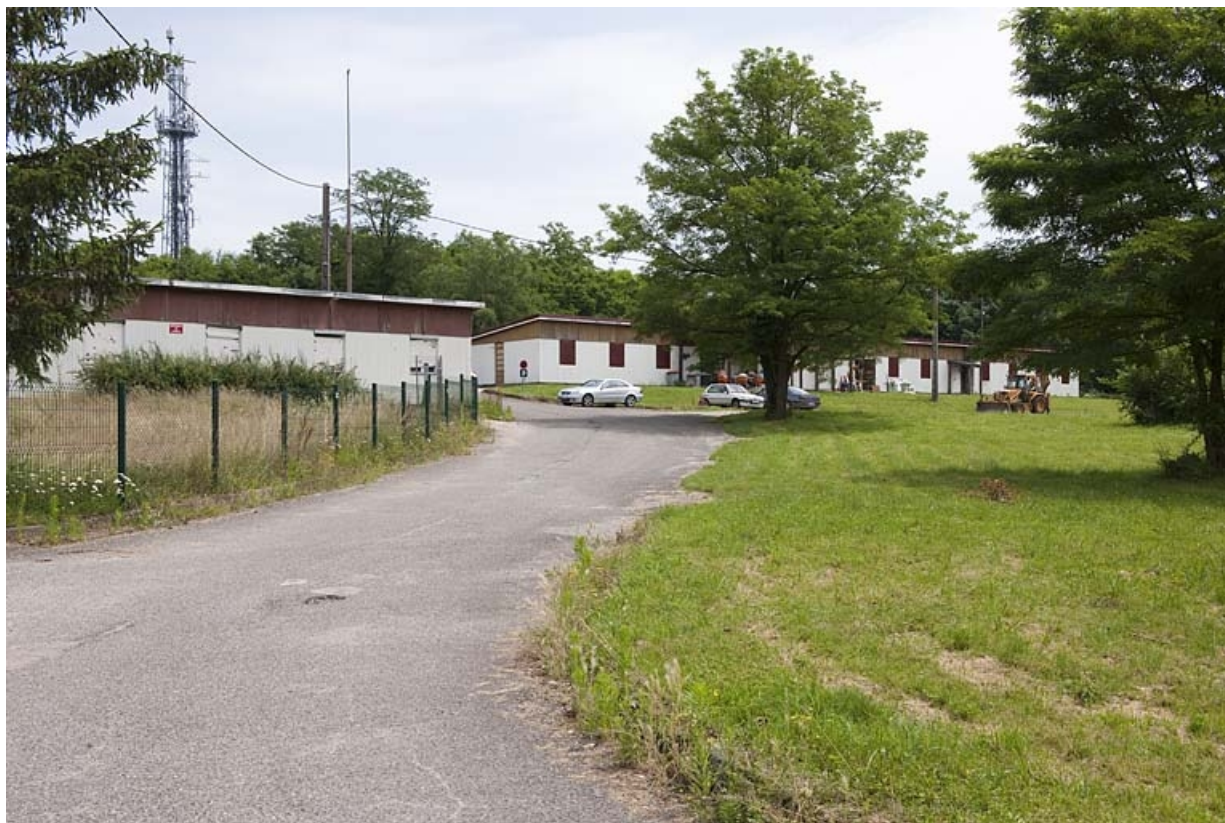
Logements N et L vus depuis l'ouest.

25, Sochaux, lieudit : le fort de la Chaux