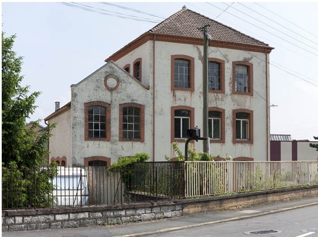
Façade sur rue du bâtiment d'entrée.