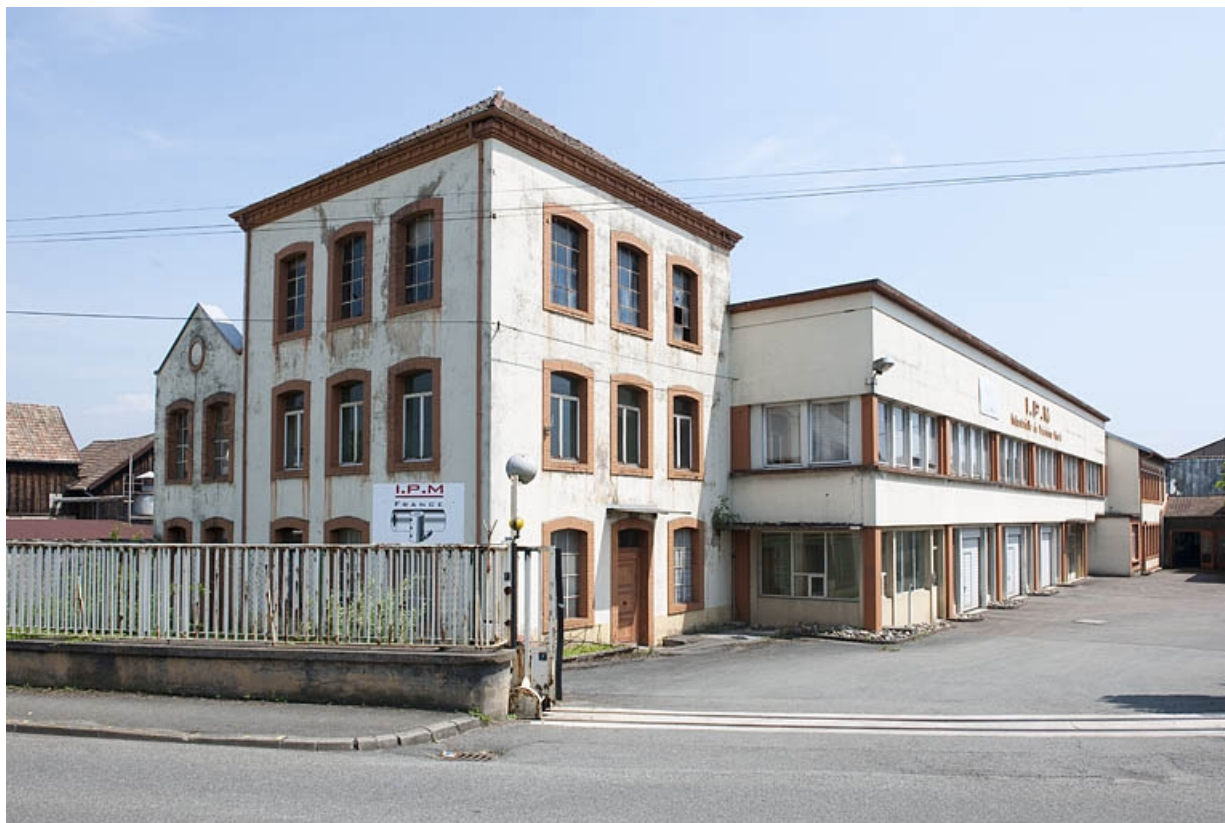
Vue d'ensemble depuis l'entrée.