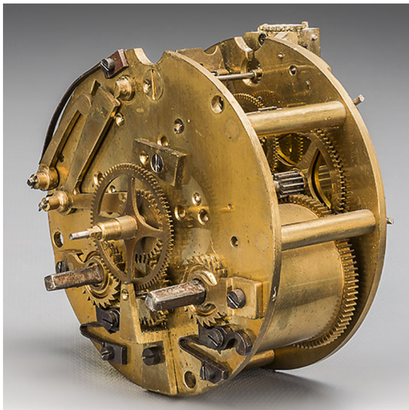
Mouvement de pendule Fritz Marti. Vue de trois quarts.