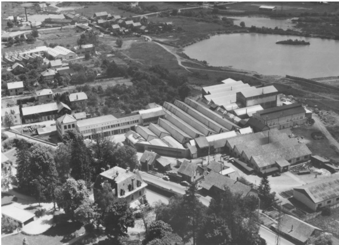
Vue aérienne de l'usine depuis le sud-ouest.