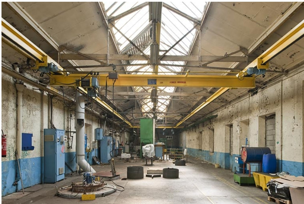
Atelier d'usinage nord. Travée orientale. 25, Vieux-Charmont, 10 route de Belfort