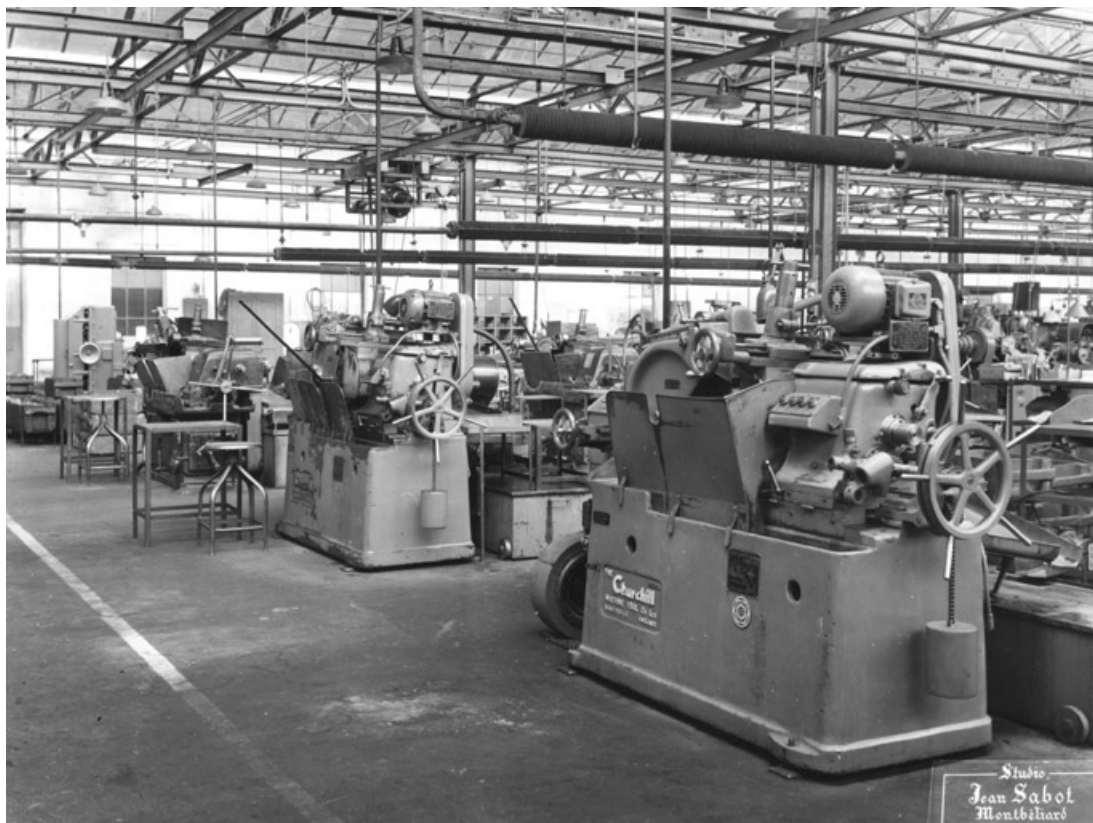
Vue intérieure de l'atelier. Batterie de presses.