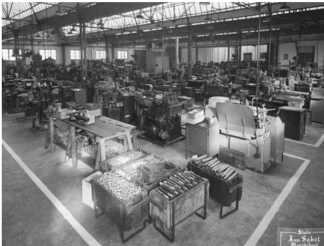
Vue d'ensemble de l'atelier.