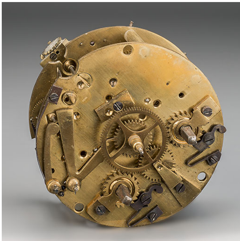
Mouvement de pendule Fritz Marti. Vue de face.