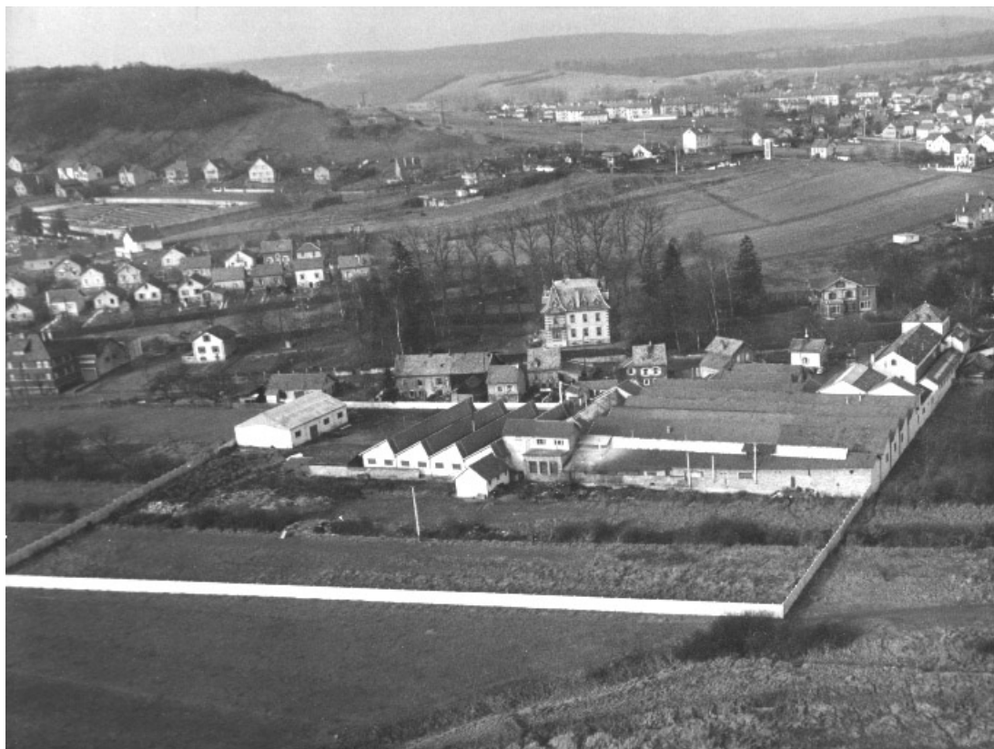
Vue aérienne depuis l'est.