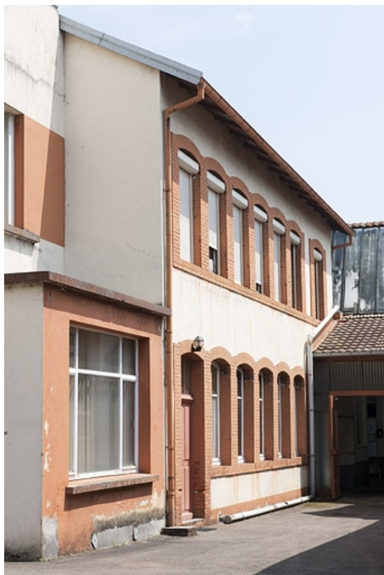
Bâtiment de bureaux (?) situé en fond de cour.