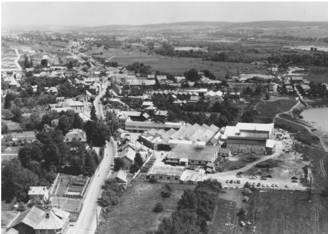
Vue aérienne de l'usine depuis le sud. 25, Vieux-Charmont, 10 route de Belfort