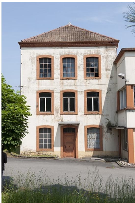
Bâtiment d'entrée. Façade sud-ouest.