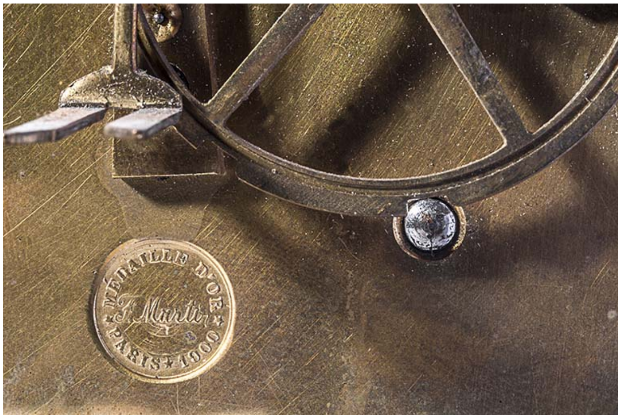
Mouvement de pendule. Détail du poinçon.