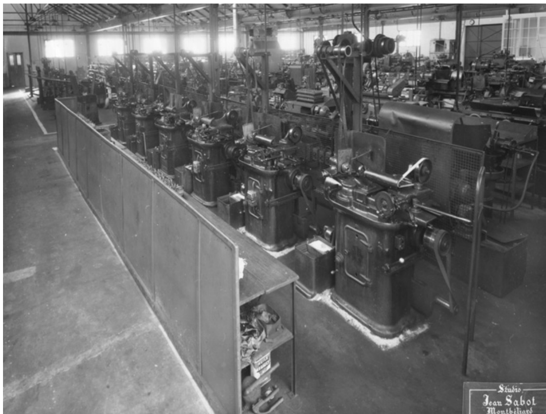
Vue intérieure de l'atelier. Batterie de machines (à décolleter ?).