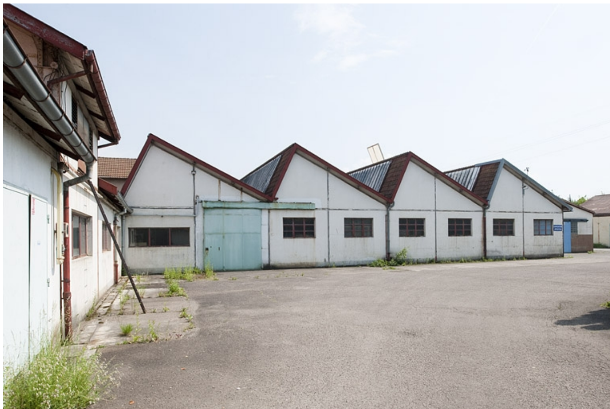
Pignons des shed de l'atelier d'usinage sud. 25, Vieux-Charmont, 10 route de Belfort