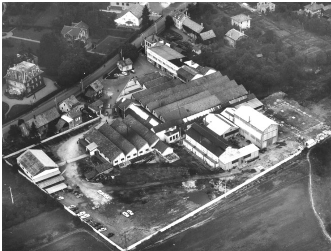
Vue aérienne de l'usine depuis le sud-est.