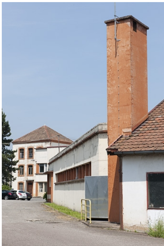
Bâtiment d'entrée et atelier de conditionnement depuis la cour.