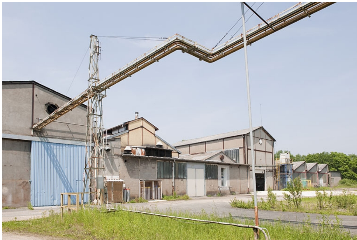
Pignons des bâtiments industriels depuis le sud.