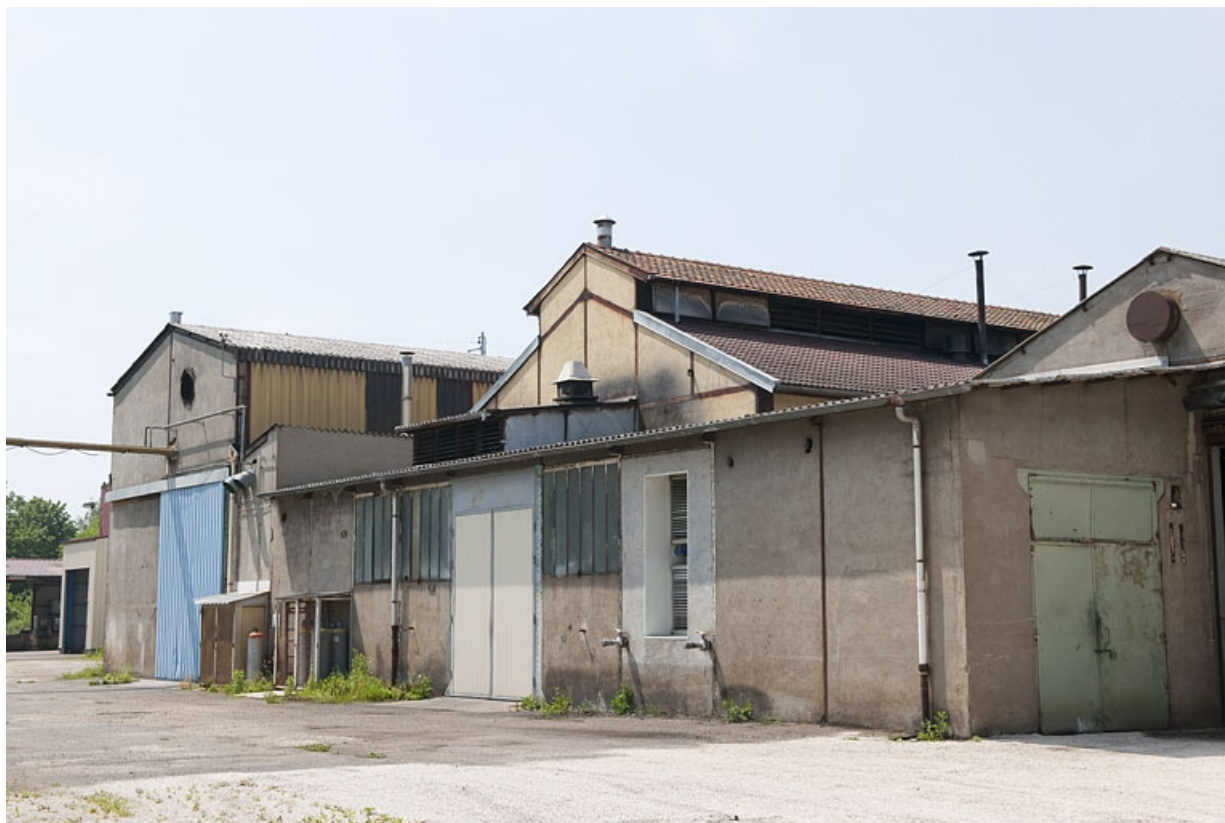
Pignons des ateliers de fabrication. Vue rapprochée depuis l'est.