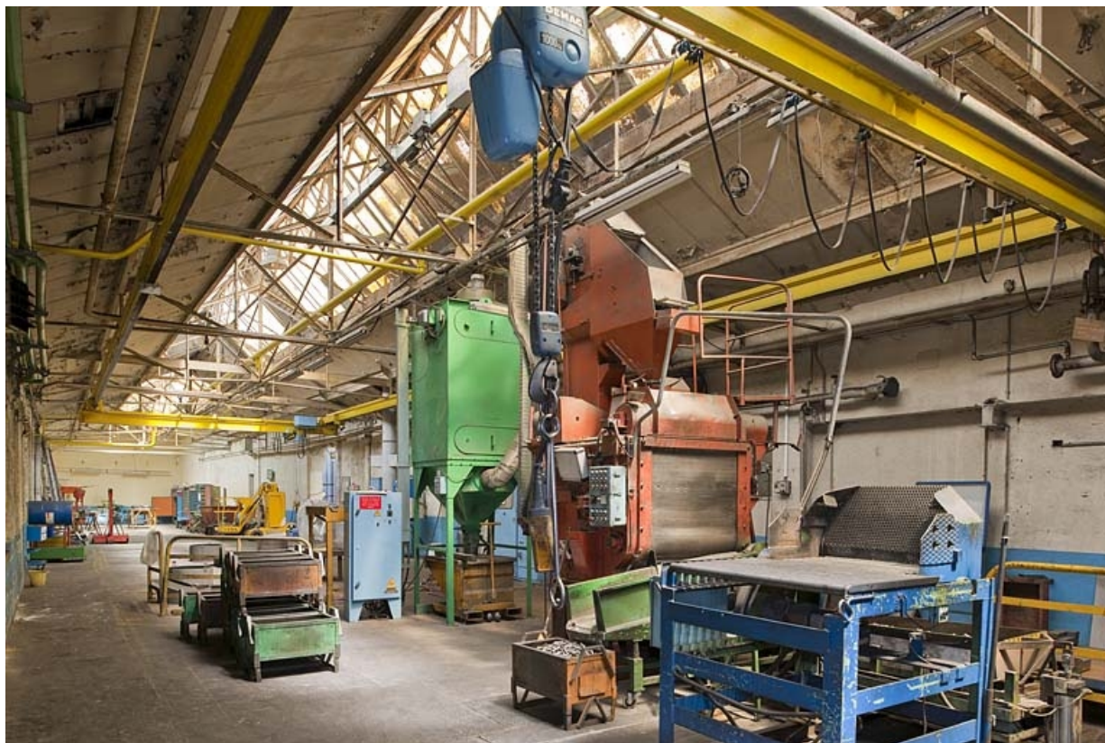
Atelier d'usinage nord. Travée orientale. 25, Vieux-Charmont, 10 route de Belfort