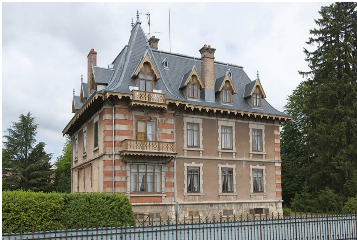
Logement patronal. Façade orientale.