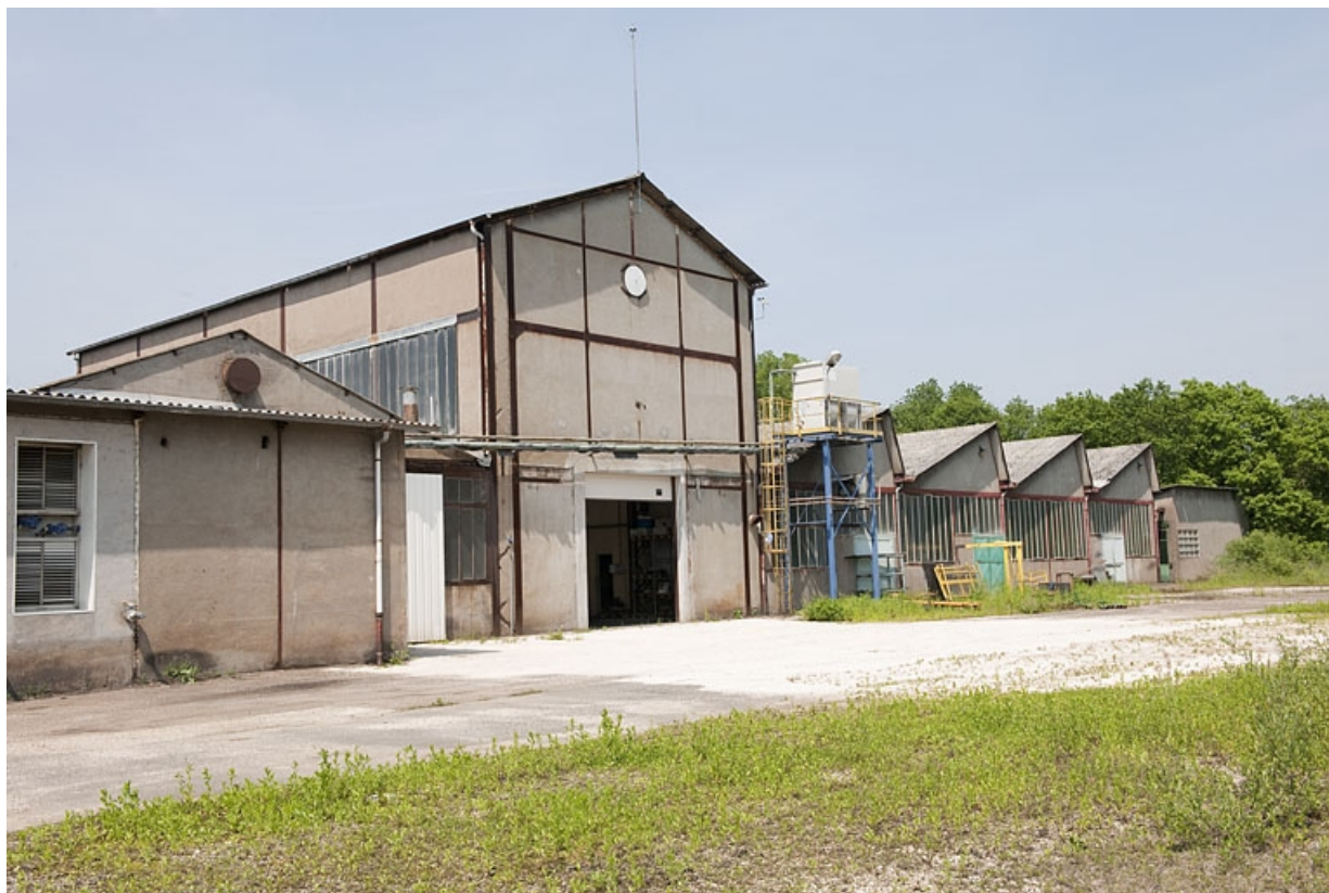
Pignons des ateliers de fabrication. Vue de trois quarts arrière.