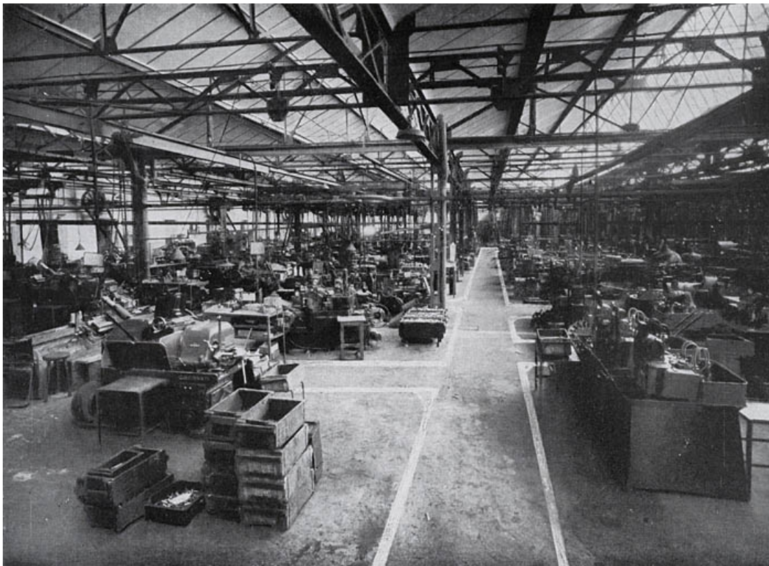
Vue d'ensemble de l'atelier principal.