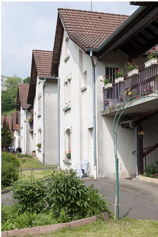
Cité du parc : habitations de 4 logements vues de trois quarts. 25, Bethoncourt impasse de la Lizaine