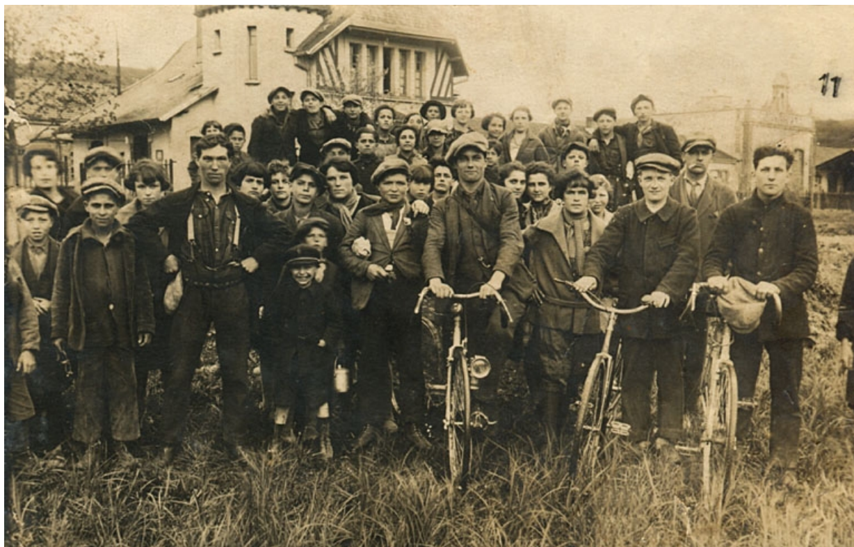
[Groupe d'ouvriers devant la conciergerie de l'usine].