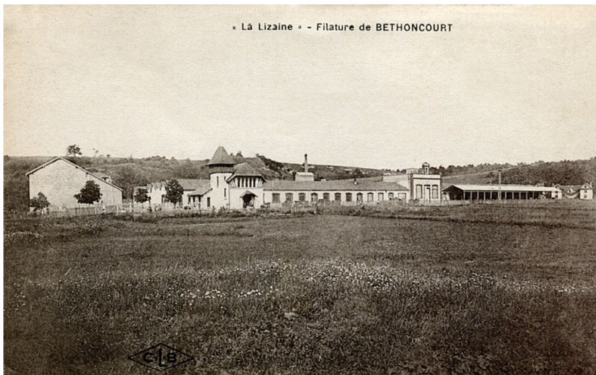
La Lizaine, filature de Bethoncourt.