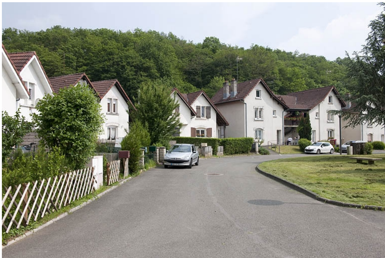
Cité du parc. Vue d'ensemble depuis l'entrée. 25, Bethoncourt impasse de la Lizaine