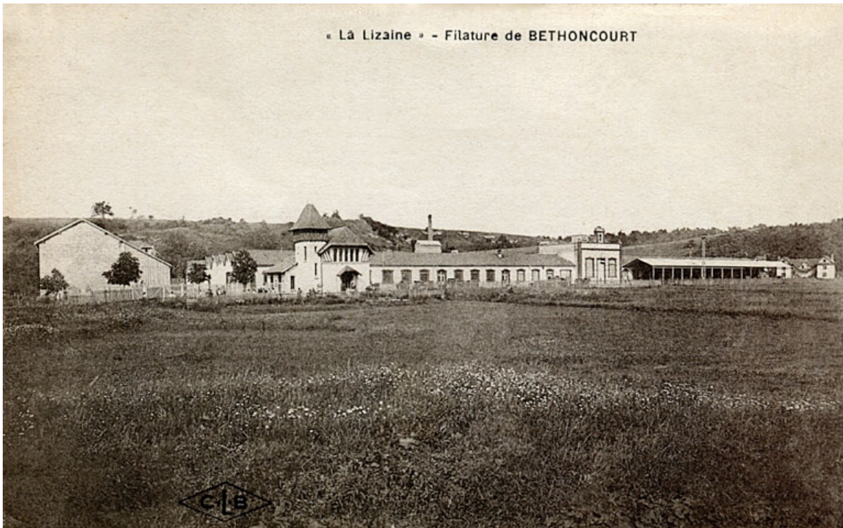
La Lizaine, filature de Bethoncourt.