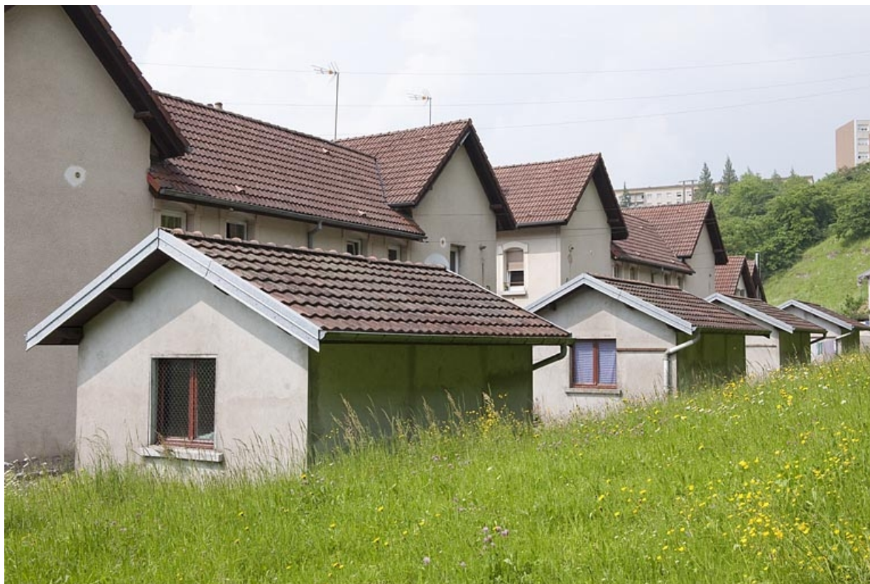
Cité du parc : façades postérieures des habitations de 4 logements. 25, Bethoncourt impasse de la Lizaine